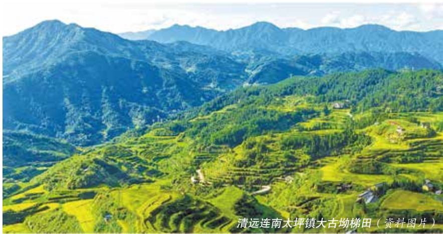
清远连南太坪镇大古坳梯田（资料图片）