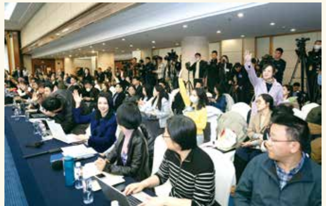
广东代表团开放团组会议上，中外媒体记者争先恐后抢着提问