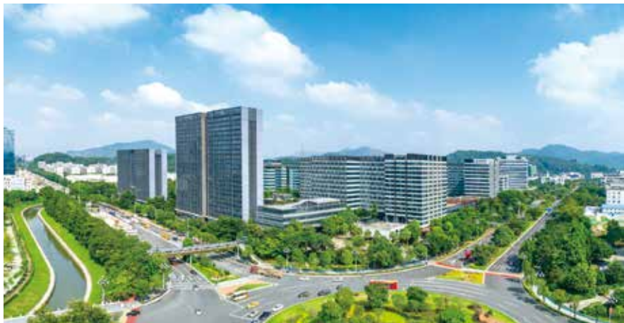
绿树成荫的广州市黄埔区科汇金谷（资料图片）

一是引领科技赋能，加强信息化管理。城市绿化事业的高质量发展离不开科技的创新发展。为推动城市绿化的科技进步，充分发挥科技创新带动作用，条例第五条规定县级以上人民政府应当推动城市绿化科学研究和成果转化，开展重要乡土树种草种资源收集保护、开发利用、种苗繁育等关键技术和设施研发，推广应用绿化先进技术，发展岭南特色乡土植物。为加强城市绿化信息化建设水平，实现绿化工作智慧化，第六条要求县级以上人民政府城市绿化主管部门应当会同相关部门利用信息化技术，开展绿化资源、外来入侵物种、病虫害等的调查、监测，按照规定实行数据