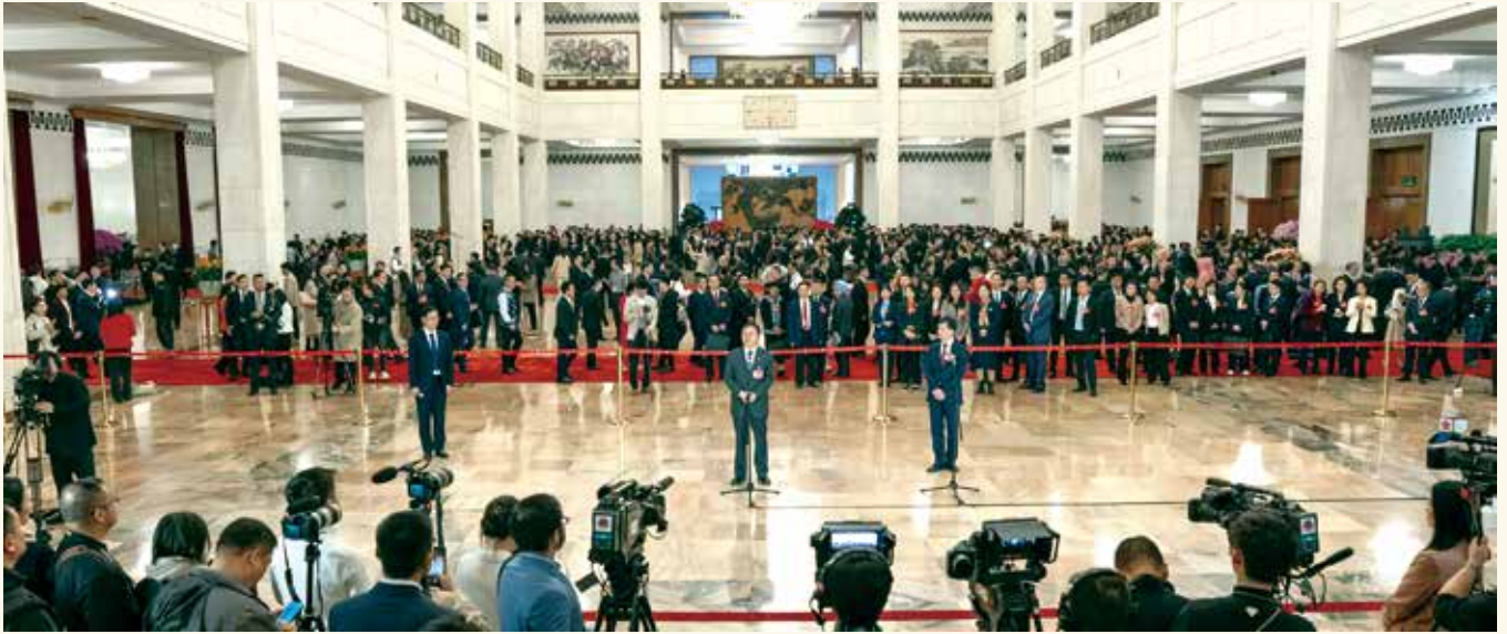
“代表通道”现场