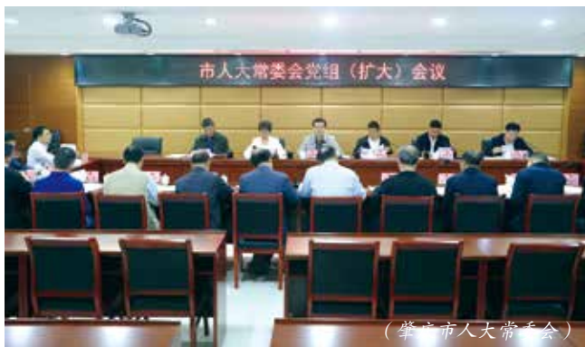
（肇庆市人大常委会）

2月22日，肇庆市人大常委会召开常委会党组（扩大）会议，专题学习贯彻全省、全市高质量发展大会精神。会议强调，要深刻认识肇庆拥有的科技创新资源和优势，围绕推进产业科技创新、发展新质生产力，充分发挥人大职能作用，找准工作着力点和切入点，以高质量履职助力肇庆高质量发展。结合年度工作安排，加大对制造业当家战略、实施创新驱动发展战略、知识产权保护等方面的监督，推动相关重点工作落地落实；要鼓励引导人大代表，特别是科技领域人大代表充分发挥自身优势，勇担科技创新重任，努力产出更多高水平创新成果，为塑造发展新动能新优势作出积极贡献。