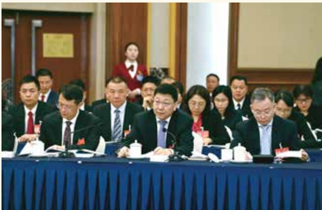
代表审议发言