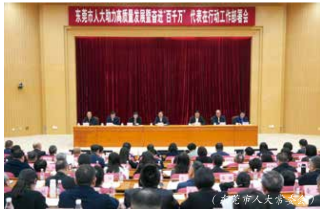
（东莞市人大常委会）

3月6日，东莞市人大助力高质量发展暨奋进“百千万”代表在行动工作部署会召开，会议传达学习全市高质量发展大会暨“百千万工程”现场推进会精神，解读《东莞市人大2024年开展“百千万工程”实施方案》，并向全市近3000名各级人大代表发出倡议书，迅速把市镇两级人大的履职方向更加精准统一到高质量发展、“百千万工程”上来。市人大常委会成立市人大开展“百千万工程”专门工作组，并制定《东莞市人大2024年开展“百千万工程”实施方案》，以“八个一”（即：召开一场工作部署会、开展一场专题询问、制定一部法规、督办一件议案、发出一份倡议书、印发一份工作方案、建