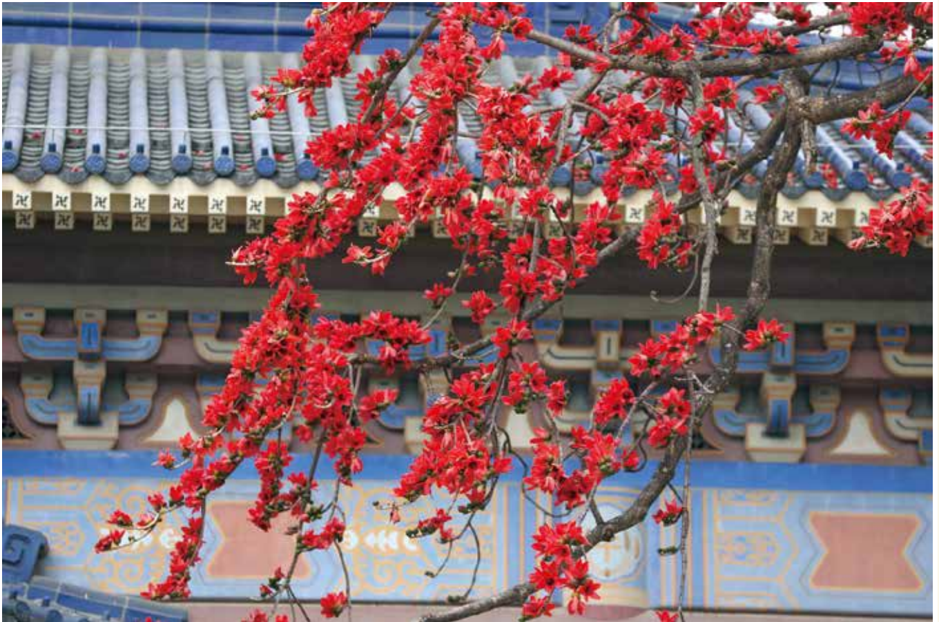
木棉花开