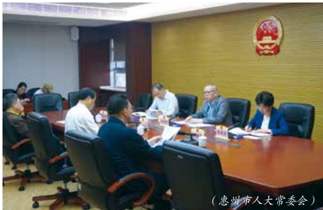
（惠州市人大常委会）

2月21日，惠州市人大常委会党组召开奋力打造广东高质量发展新增长极专题研讨会。会议强调要充分发挥人大职能作用，扎实推进全市实现新的跨越式发展，为惠州奋力打造广东高质量发展新增长极凝心聚力、擘画蓝图。会议提出，要讲政