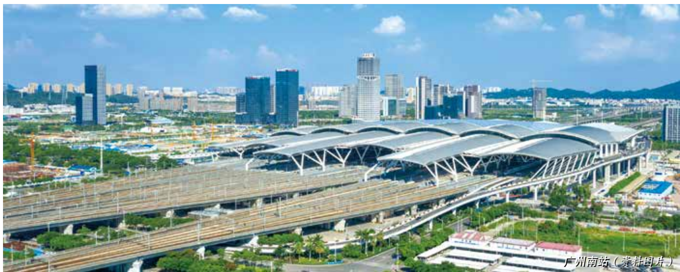
广州南站（资料图片）