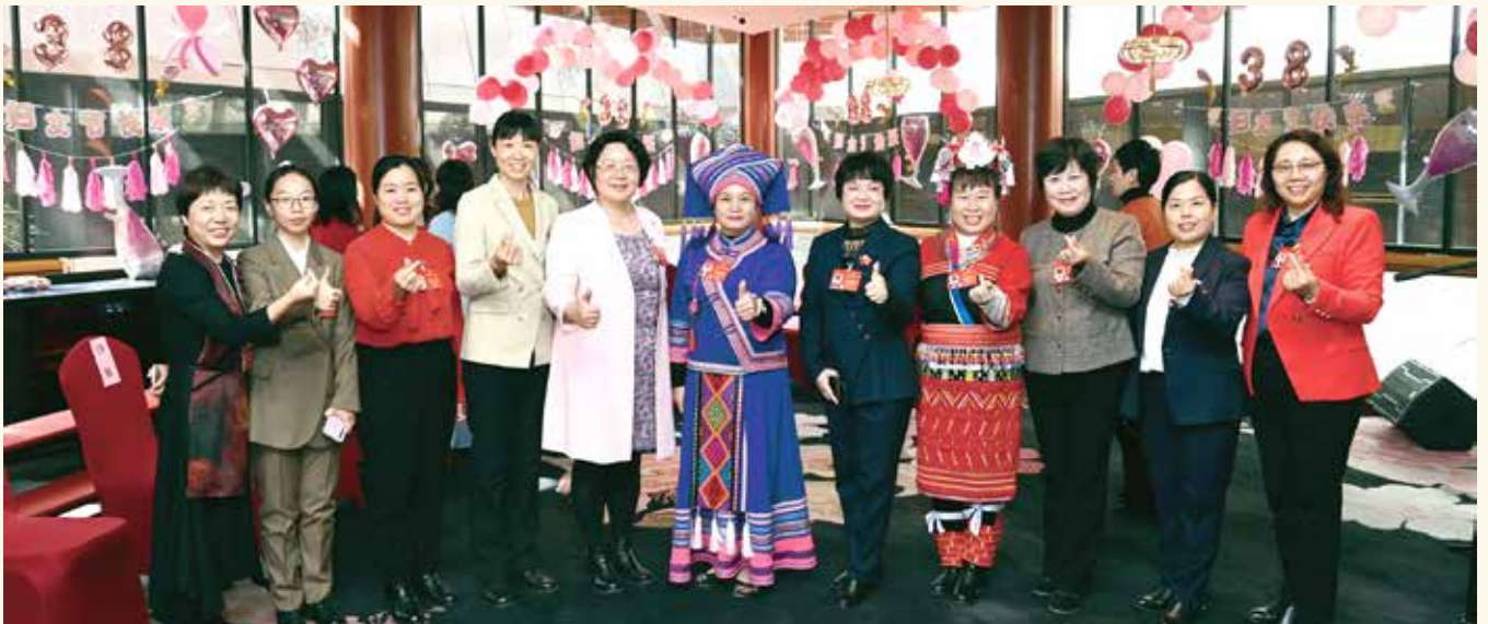
“三八”国际妇女节女代表合影留念