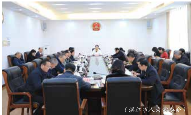
(湛江市人大常委会)

3月4日,湛江市人大常委会召开常委会主任会议,传达学习全省高质量发展大会、全市科技创新推动产业高质量发展大会精神,研究贯彻落实措施。会议强调,要把推动高质量发展作为人大工作“第一要务”,紧扣湛江高质量发展的重点领域、关键环节,扎实做好人大工作。要聚焦立法高质量,修正制定地方性法规条例,修订历史建筑保护条例,制定湛江湾保护条例、物业管理条例,以良法促发展、保障善治。要聚焦监督高质量,瞄准湛江在新质生产力发展、科技与产业互促双强、“百千万工程”实施等重点领域,实行正确监督、有效监督、依法监督。要聚焦决议决定高质量,紧紧围绕关系全市改革发展稳定大局的重大事项,依法及时作出决议决定,推动市委重要部署安排落地落实。