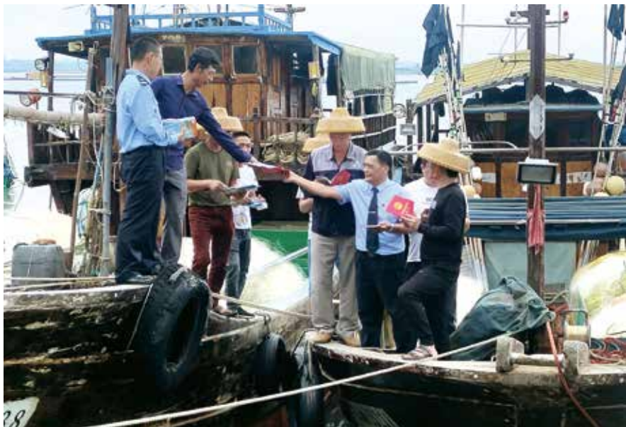
省司法厅派员深入渔港为渔民提供法律服务