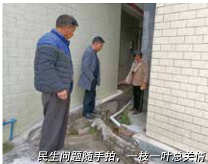
民生问题随手拍，一枝一叶总关情