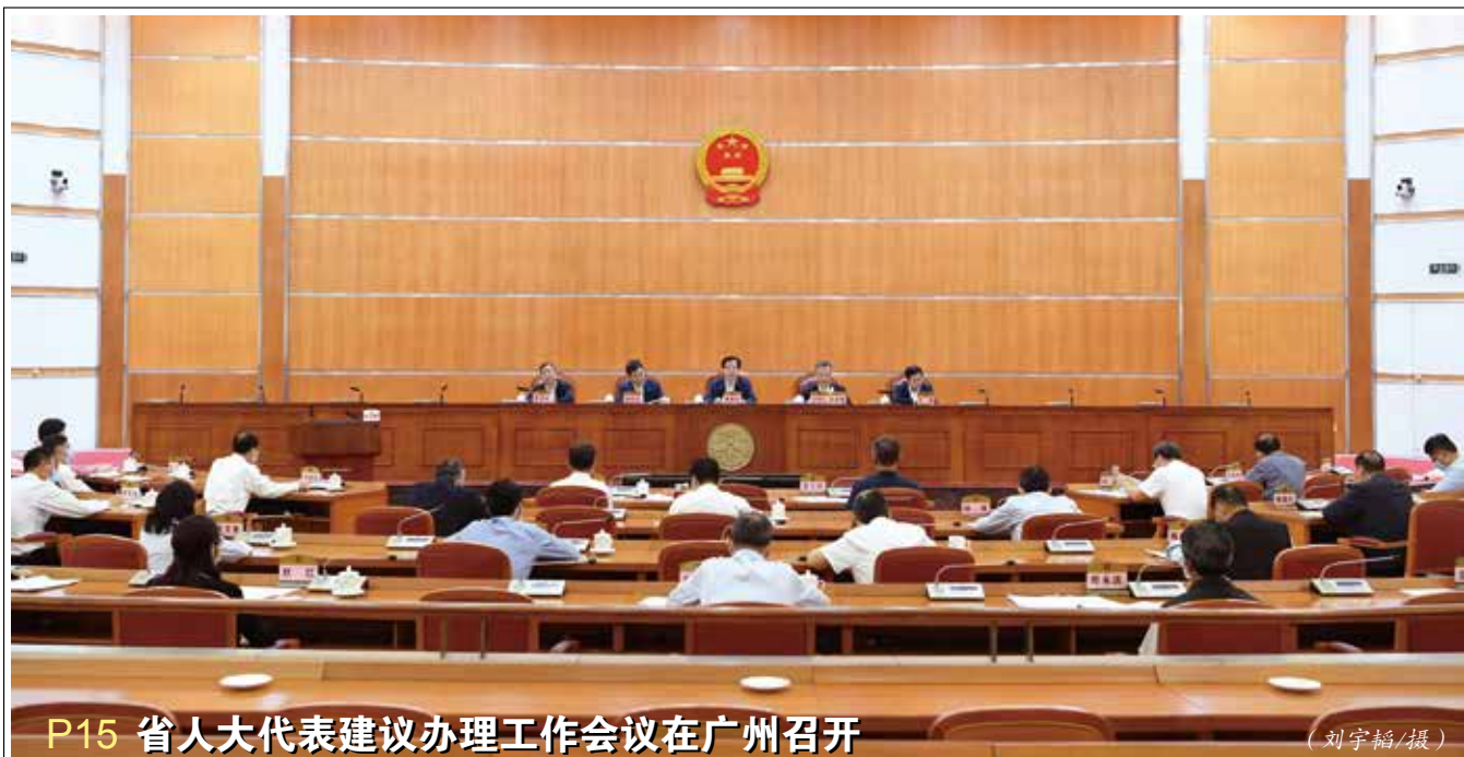
P15 省人大代表建议办理工作会议在广州召开