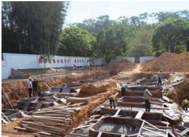
新龙镇九龙二小扩建工程现场

新龙镇人大在高标准打造镇人大代表中心联络站的同时，全面提升其它站点建设水平，形成了“中心联络站—联络站—联络点”三级网络，确保“有场地、有人员、有制度、有活动、有经费、有设备”。联络站（点）每月15日或20日定期组织代表接待选民，成为代表倾听民声的重要窗口。3月15日，广州市委常委、黄埔区委书记陈勇以普通人大