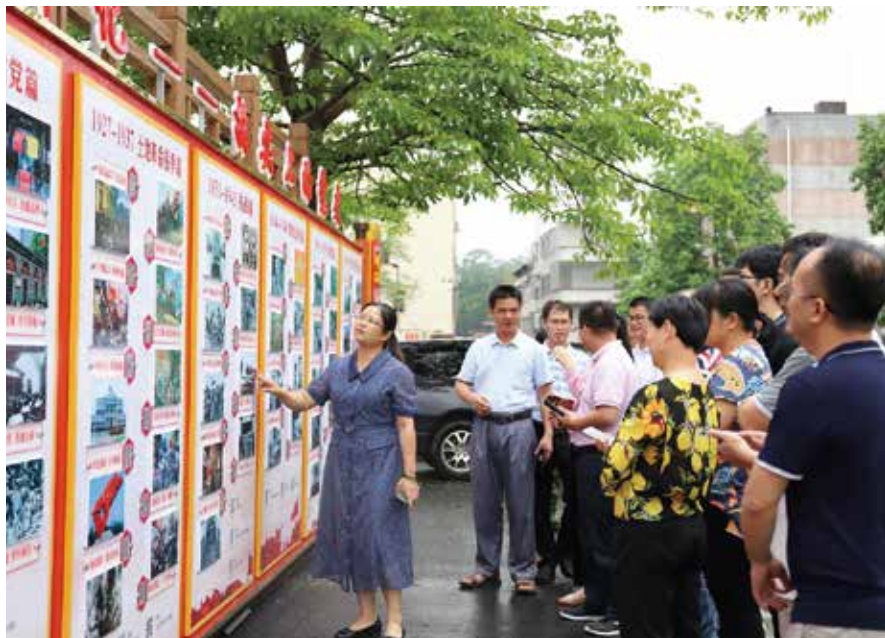
信宜水口镇“指尖上的党史”让党史学习更有声有色(资料图片)