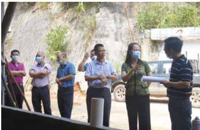
2021年9月，云浮市人大常委会调研组到云城区河口督办建议办理工作