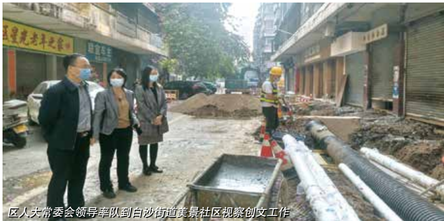
区人大常委会领导率队到白沙街道美景社区视察创文工作