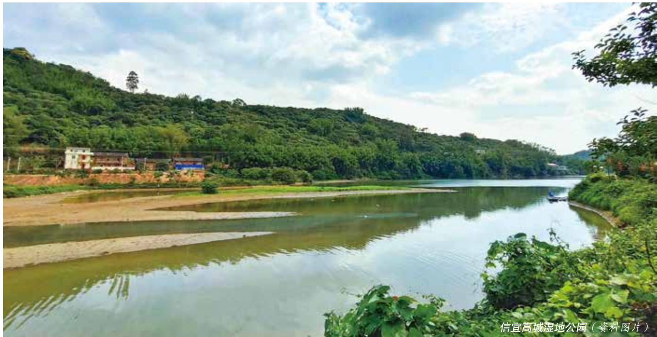
信宜高城湿地公园（资料图片）