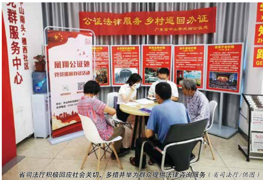
省司法厅积极回应社会关切，多措并举为群众提供法律咨询服务

一是严格专人跟办责任。在严格落实领办责任制的基础上，严格实施专人跟办责任措施。在制定代表建议工作方案中，完善部门、分管、专人三级代表建议办理工作负责制，形成各层级“一把手亲自抓、分管领导直接抓、指定专具体办”的工作机制。将各项代表建议落实到具体责任部门、具体经办人员和办理时限。规范办理流程 and 办文格式，