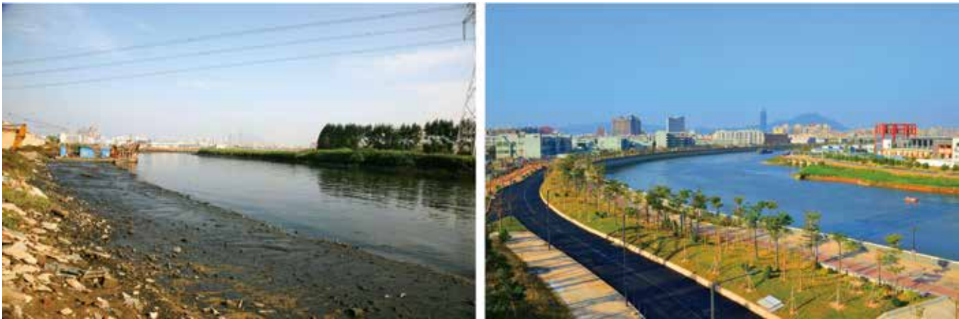
经过近几年的整治后，东莞市长安镇的茅洲河水质变好了，周边绿道铺设了，焕然一新，今非昔比。（资料图片）

检查组对全市实施《中华人民共和国环境保护法》和《广东省环境保护条例》的情况开展执法检查，全面了解“一法一条例”在东莞市的实施情况。