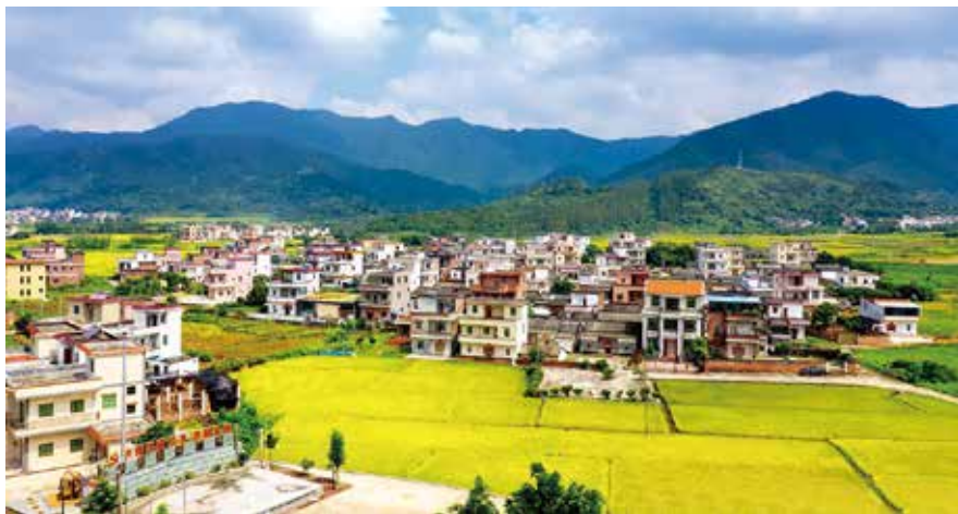
有“香格里拉”美誉的新兴县天堂镇（资料图片）