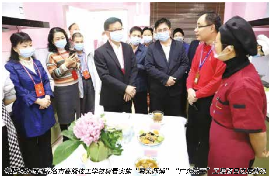
专题调研组到茂名市高级技工学校察看实施“粤菜师傅”“广东技工”工程项目进展情况

“我市城乡低保最低标准和特困供养标准提标任务完成得怎么样？”“提高残疾人两项补贴保障水平进度怎么样？”“专项资金问题是否落实到位？”