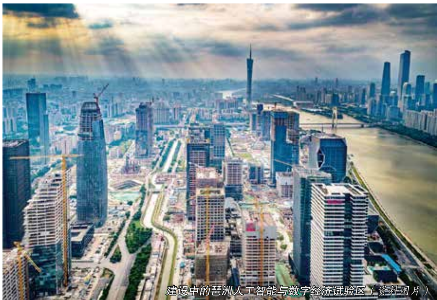
建设中的琶洲人工智能与数字经济试验区（资料图片）

在全面规范促进中体现一体保护。 国家外商投资法、外商投资法实施条例对外商投资总的原则、投资促进、投资保护、投资管理、法律责任、参照适用等作了较为全面和具体的规定。为避免与上位法简单重复，同时又与上位法相衔接，条例专门单列一条，规定：“本省依法促进外商投资，保护外商投资权益，优化外商投资服务，规范外商投资