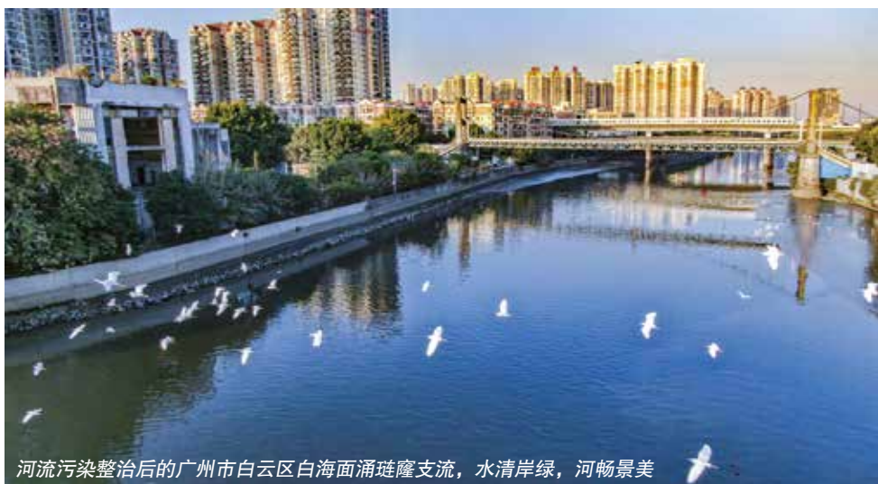
河流污染整治后的广州市白云区白海面涌璠隆支流，水清岸绿，河畅景美

关口前移、控制总量，加强污染物排放源头管控。 实施排污许可制是提高环境管理效能、改善环境质量的重要基础性制度。为了推动生态环境持续改善，进一步筑牢生态安全屏障，条例明确了重点污染物排放总量控制和排污许可管理制度，细化了重点污染物排放总量控制实施方案的报批备案程序，完善了污染物排放许可管理制度，进一步加强对全市污染物排放的总体规划 and 前端审批，严格将污染排放总量控制在合理区间，确保污染排放不超过生态环境承载能力。