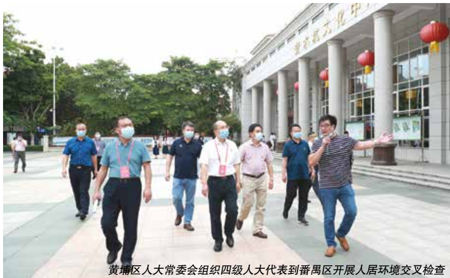
黄浦区人大常委会组织四级人大代表到番禺区开展人居环境交叉检查