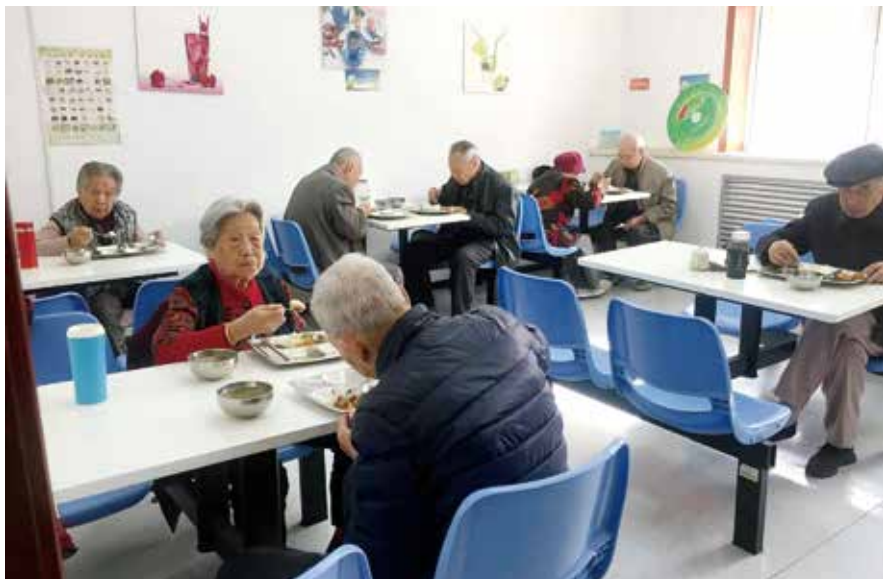
代表呼吁提高我省社会养老服务水平，积极应对人口老龄化问题（资料图片）