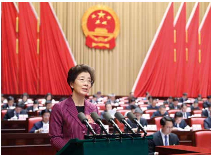
省人大常委会主任李玉妹作常委会工作报告