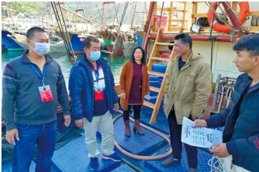
代表进渔船做好防控宣传