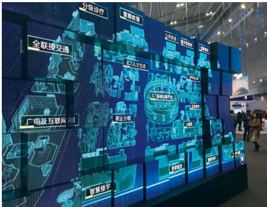
粤东西北地区在推动“数字政府”改革建设工作时，需要更大的政策支持和财政补助。

粤东西北地区“数字政府”建设的建议。建议指出，在我省“数字政府”改革建设工作推进过程中，存在着发展不平衡的问题。粤东西北地区由于基础较薄弱、起步较晚、专业技术人才缺乏、财政资金不足等问题，“数字政府”改革建设步伐受到了较大制约。珠三角地区和粤东西北地区社会经济发展上的差距，在“数字政府”时代有可能被进一步拉大。建议省政府按照“全省一盘棋”的思路，在“数字政府”改革建设工作上给予粤东西北地区更大力度支持。粤东西北地区在推动“数字政府”改革建设工作时，最大的短板和困难就是资金不足，建议省政府给予更大的政策支持和财政补助。粤东西北地区电子政务行业管理和技术人员比较缺乏，当地的信息企业以中小型企业为主。建议在招募生态合作伙伴的时候对粤东西北地区的企业适当降低标准，对于当地项目以及一些珠三角的但可以远程完成的项目在同等条件下尽量分包给粤东西北企业，通过“数字政府”建设带动粤东西北地区信息化企业一起成长。■