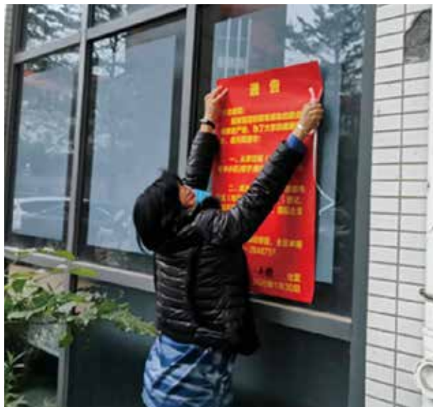
英海燕代表在社区张贴防疫海报