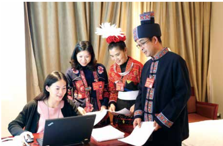
在省十三届人大三次会议期间，代表提交议案建议

广东区域发展不平衡是一个不争的事实，未来必须使其发展走向平衡。这就要求广东必须把握粤港澳大湾区建设重大战略机遇，实施以功能区为引领的区域协调发展战略，加快构建形成“一核一带一区”区域发展新格局，着力增强珠三角地区辐射带动能力及东西两翼地区和北部生态发展区内生发展动力，推动区域经济协调发展。这一类的相关建议数量较多，其中引起媒体关注的有，李锐香代表的《关于进一步加大对东西