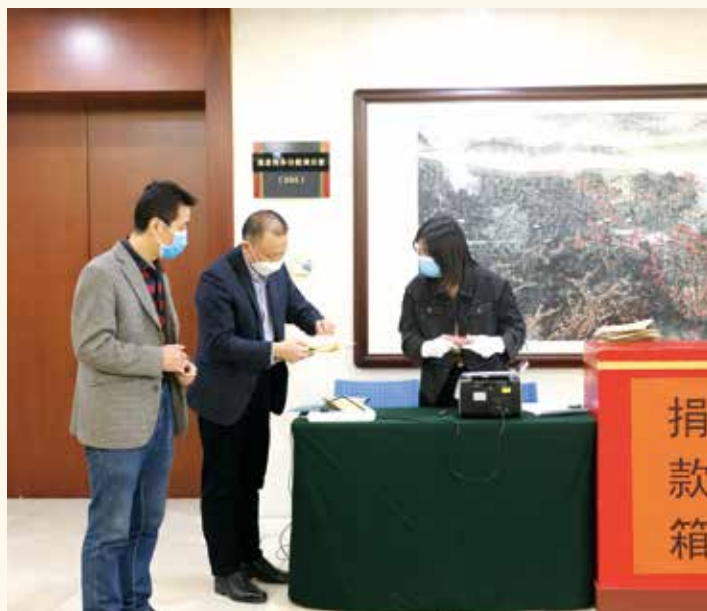
2月10日，省人大常委会领导及机关全体干部职工开展向武汉新冠肺炎流行地区捐赠活动，表达万众一心抗疫情的决心和爱心。