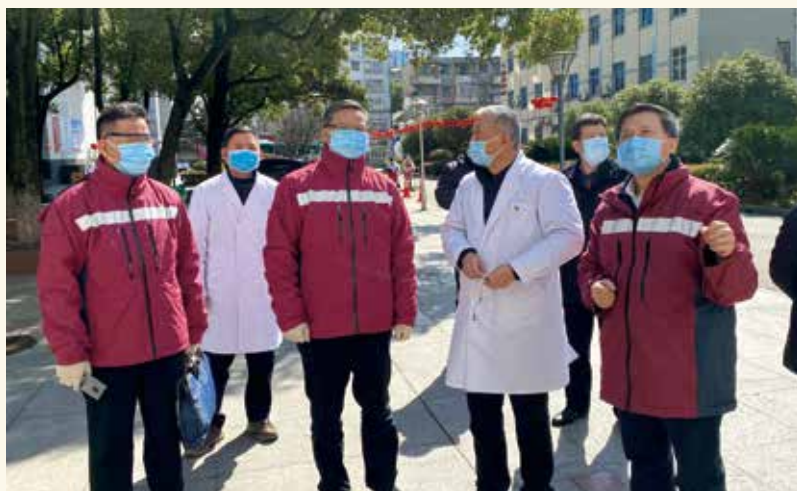
2月14日晚，为支援湖北荆州疫情防控救治工作，进一步增强前线医疗救治力量，广东省对口支援湖北省荆州市新冠肺炎防治工作领导小组副组长、广东省人大常委会副主任吕业升率广东援助荆州第三批医疗队赴荆州。图为吕业升在荆州市第一人民医院危重症救治中心调研并在荆州医疗队前方指挥部研究疫情防控工作。