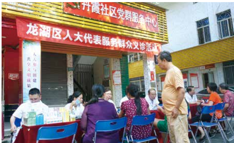
代表联络站组织人大代表为群众义诊

打造“示范点”。2019年初，常委会专门组织区人大代表和45个代表联络站站长及工作人员到深圳培训，以深圳为样板推进全区联络站创建工作。为树立典型，示范带动，常委会把硬件设施、运作机制、工作效果较好的新津街道香