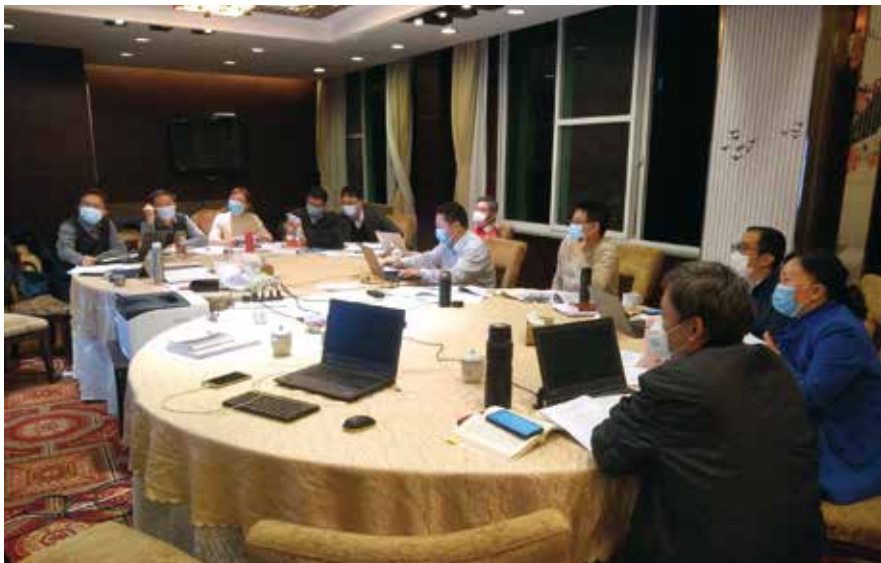
条例起草工作专班经常加班加点研究修订草案

相比原条例，修订后的条例扩大了禁止猎捕、交易的范围。在国家规定禁止猎捕、交易的野生动物外，结合广东实际，将禁止范围扩大到省规定禁止猎捕、交易的其他野生动物。新条例对禁食范围的规定与全国人大决定保持一致，但细化了禁食措施，对餐饮服务提供者和电子商务平台的责任，以及行业自律管理和信用管理作出细化规定。在人工繁育方面，针对调研中发现的突出问题，新条例完善了人工繁育制度，补充了对人工繁育非国家重点保护野生动物的规定，实行了更为严格规范的管理。