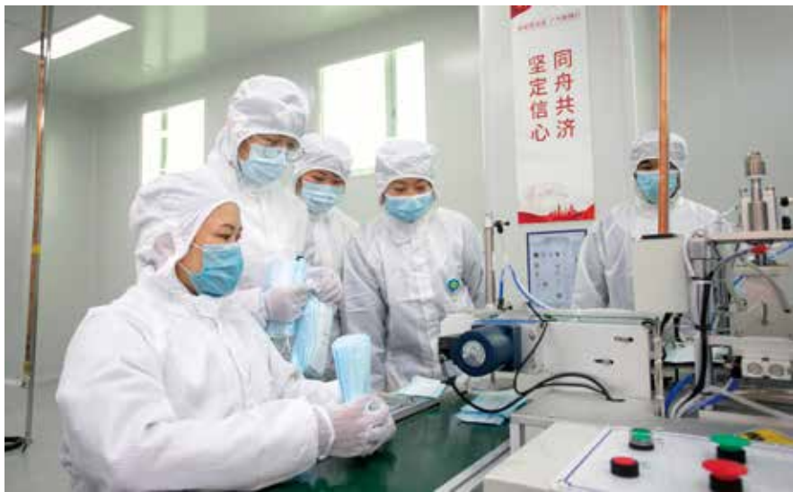
2月20日，广汽自制口罩正式批量生产

“在这非常关键的时刻，我们得到广汽职工的物资支持，我非常感激，我代表广州呼吸健康研究院、代表我自己以及全体医务人员向你们表示敬意！”