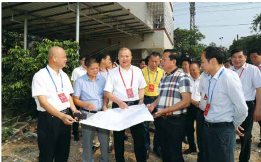
市人大代表调研罗州大道西延伸线建设

出台评议前的调研方案。2019年12月初，常委会组织市政府及其27个职能部门负责人召开评议动员会，出台评议