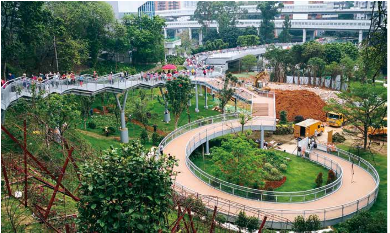
广州云道（资料图片）