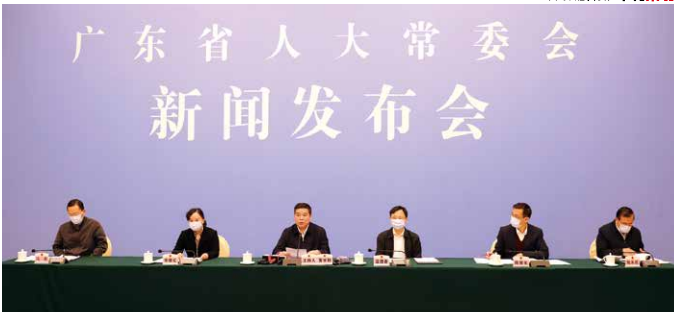
3月31日，省人大常委会召开新闻发布会介绍《广东省野生动物保护管理条例》有关修订情况

讨论。当年7月，在“抗非”取得阶段性胜利后，作为主战场的广东在制定《广东省爱国卫生工作条例》时，将“不吃野生动物”写进了草案，并举行了一场盛况空前的立法听证会对此展开讨论。听证会上，就该不该吃野生动物，各方意见针锋相对，但反对意见成了主流。由于社会争议较大，条例最后将“不吃野味”变成了一个倡议性条款。此后，就是否立法禁“野味”数次引发争论，但终因种种原因被一度搁置。