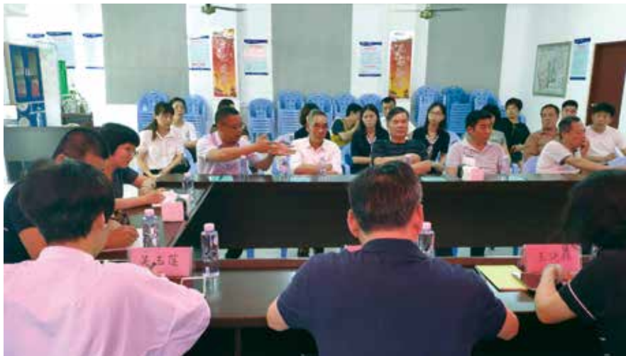
区人大代表开展集中接待群众活动