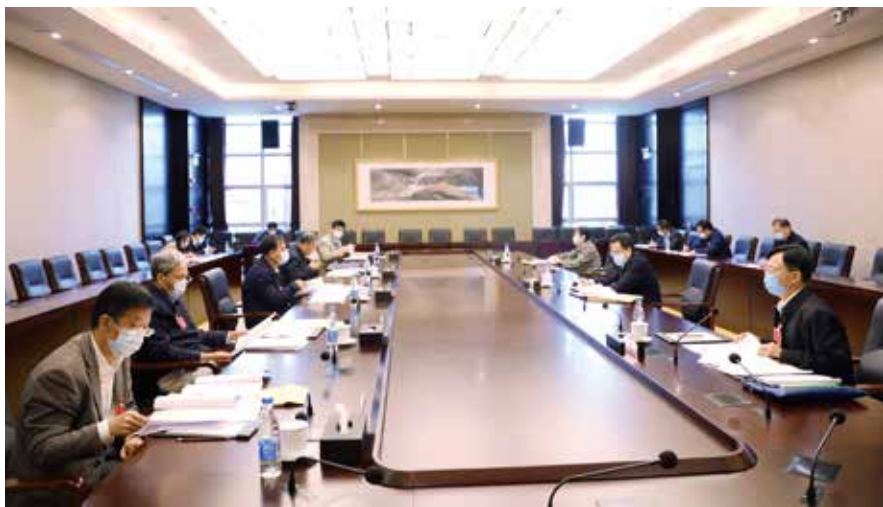
省人大常委会组成人员认真审议条例修订草案

严厉打击非法野生动物市场和交易，依法取缔或者查封、关闭违法经营场所和违法经营者，依法加重对违法猎捕、交易、运输、食用野生动物行为的处罚，坚决刹住滥食野生动物陋习，切实杜绝公共卫生安全风险。