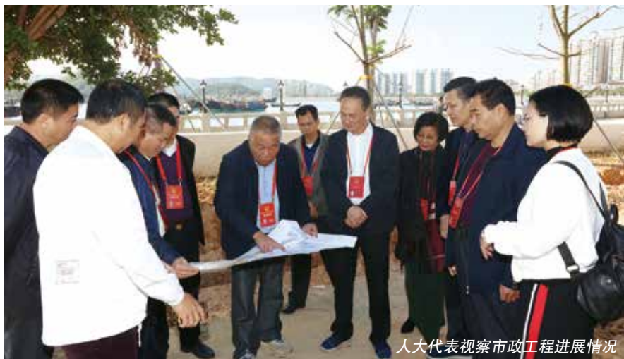
人大代表视察市政工程进展情况

为全力助推汕尾“创文”冲刺工作，2019年10月中旬，常委会决定把助推“创文”工作作为区人大的重点工作，