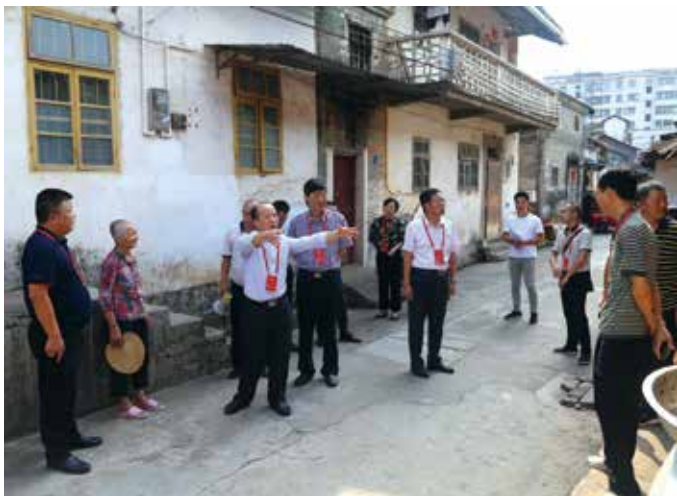
组织代表视察创文工作