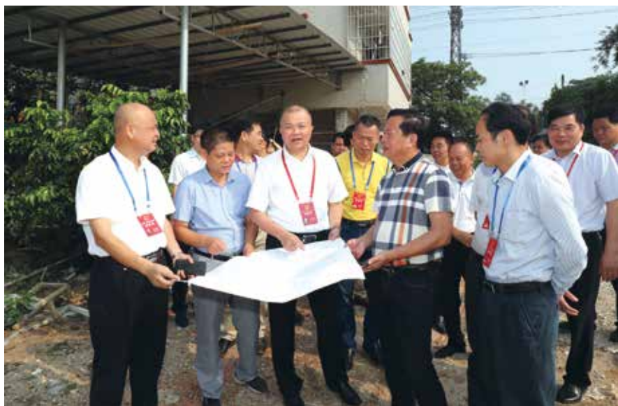
组织人大代表调研“双推动”《关于加快推进罗州大道西延伸线石岭段建设的议案》办理工作情况