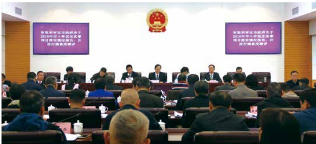
2019年12月底,江门市人大常委会第二十七次会议听取和审议市政府关于2019年市十件民生实事项目落实情况报告,并进行满意度测评。

有发言和评判的机会,因此会觉得这些原本与其息息相关的项目似乎变得无关紧要了,参与和支持项目实施的热情自然会大打折扣。实施代表票决制,是政府拿出部分公共预算,让人大代表来决定投哪里、投多少、怎么投,更好地体现了人民意志、保障了人民权益、激发了人民创造活力,有利于促进基层民主政治的发展。