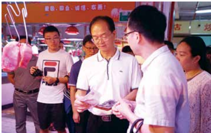
2019年9月,江门市人大常委会开展民生实事监督周活动,监督小组到新会古冈市场督办“提高市场食品质量安全水平”民生实事项目。

实施代表票决制,由于人大的提前介入,使得政府的决策更加科学、更具可行性;年终的满意度测评也让政府在考虑候选项目时会反复研究论证,更加慎重,从而使得项目的实施更加顺利。