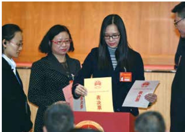
2019年1月,373名江门市人大代表在市十五届人大五次会议上首次无记名差额票决十大民生实事项目。