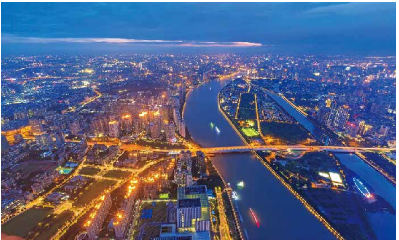
夜幕下的珠水流光（资料图片）