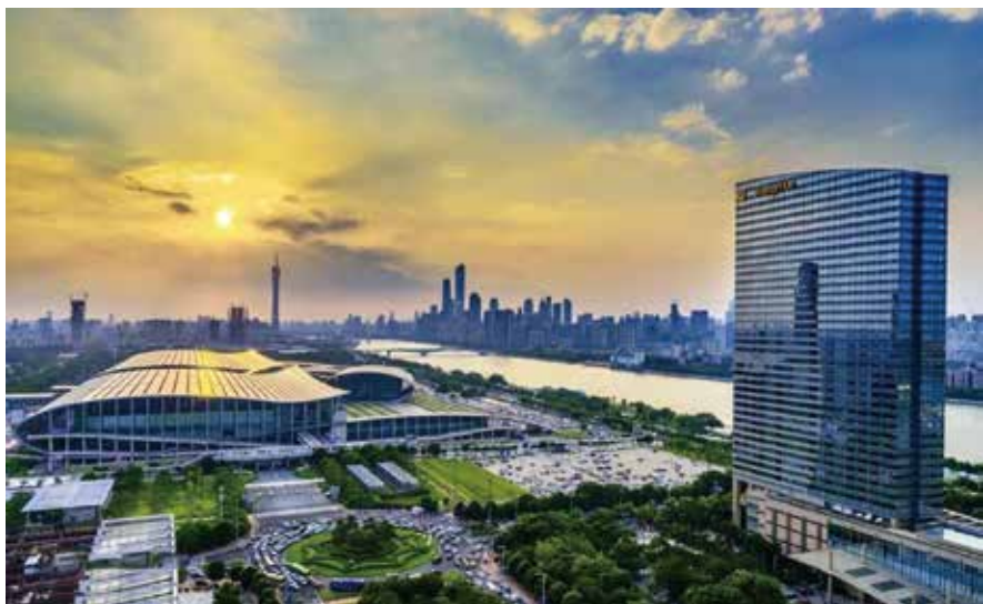
琶洲粤港澳大湾区数字经济创新试验区（资料图片）

“主角”，引起社会深思。很多家长不知道用什么方法教育孩子，重知轻德，过于关注学习，忽视对孩子良好个性品质和行为习惯的培养，还有不少家长在引导孩子的心理健康方面存在明显缺陷。同时，家庭教育缺乏科学的、系统的、规范统一的指导管理服务支持体系，各行各业都已进入信息时代，家庭教育领域不断出现新情况、新问题，必须引起高度重视。改革现有家庭教育局面已到了刻不容缓的地步。在当前社会转型、家庭变迁、教育变革的外部环境下，一般家庭尚且存在诸多问题，留守儿童、单亲儿童、重组等特殊家庭儿童的家庭教育更是难点。