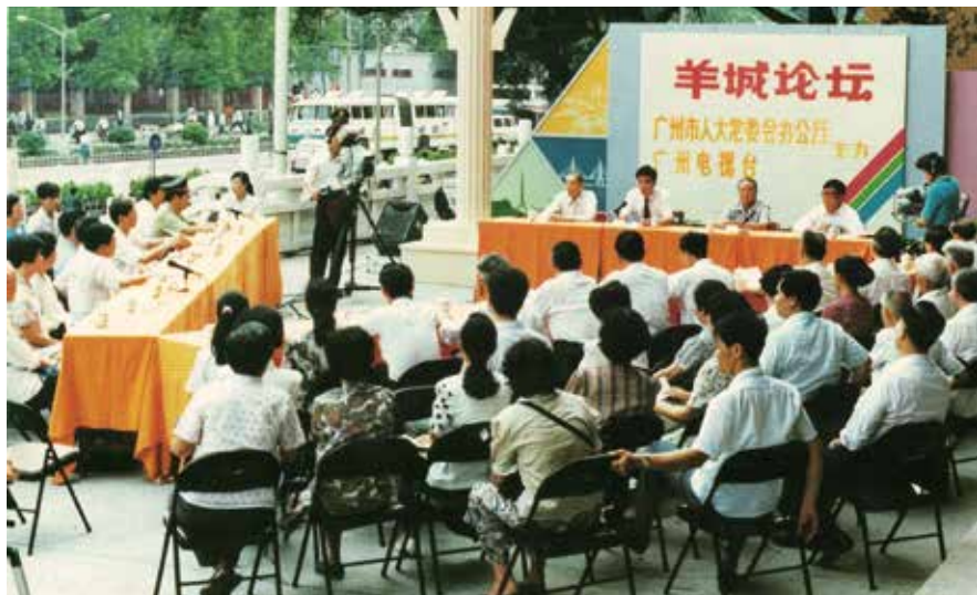
1992年5月,广州市人大常委会举办第1期《羊城论坛》“禁止烟花爆竹大家谈”(资料图片)

(1) 将公民立法建议权写入地方立法程序规则。1998年6月,《广东省人民代表大会常务委员会制定地方性法规规定》第六条对此做了明确规定,即一切国家机关、政党、人民团体、社会组织、公民都可以向省人民代表大会常务委员会提出制定地方性法规的建议和意见,这早于2000年立法法第九十条的相关法律规定。2006年1月新修订的《广东省地方立法条例》进一步确认了公众立法建议权。2008年12月,广东省人大常委会主任会议审议通过的《广东省地方性法规立项工作规定(试行)》第三条更明确规定公众对地方性法规立法项目享有建议权。此外,《广东省地方性法规清理工作若干规定(试行)》提出广东省地方性法规清理必须坚持合法性、科学性和民主性原则结合的原则,推动相关工作的规范化、制度化和常态化。