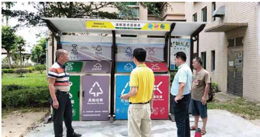
镇人大组织代表检查垃圾分类工作