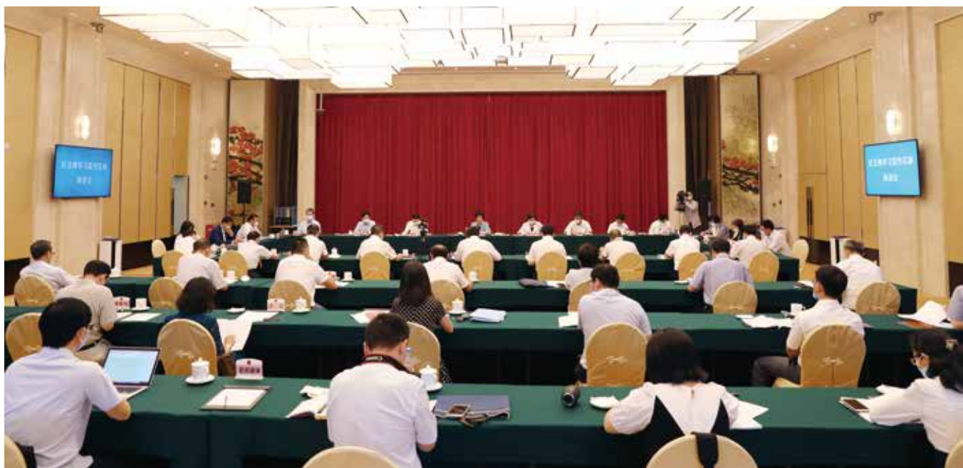
民法典学习宣传实施座谈会现场