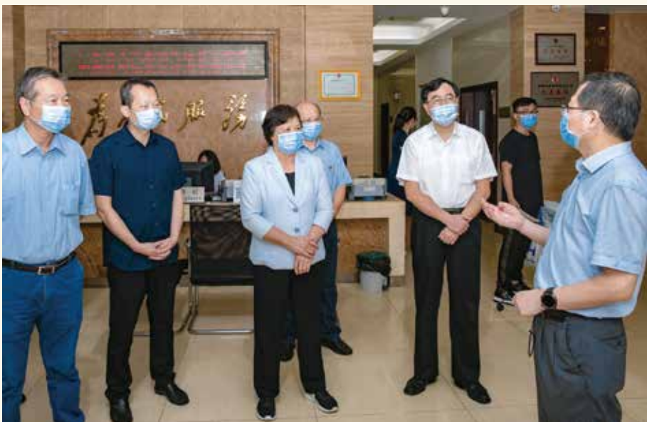
8月19日，省人大常委会副主任罗娟（左三）率调研组赴广州市开展加强司法鉴定管理和规范司法鉴定行为专题调研。调研组考察了中山大学法医鉴定中心和广东华医大司法鉴定中心，召开座谈会听取广州市法院、检察院、司法局、司法鉴定协会等单位的情况汇报和意见建议。（任监/供稿）