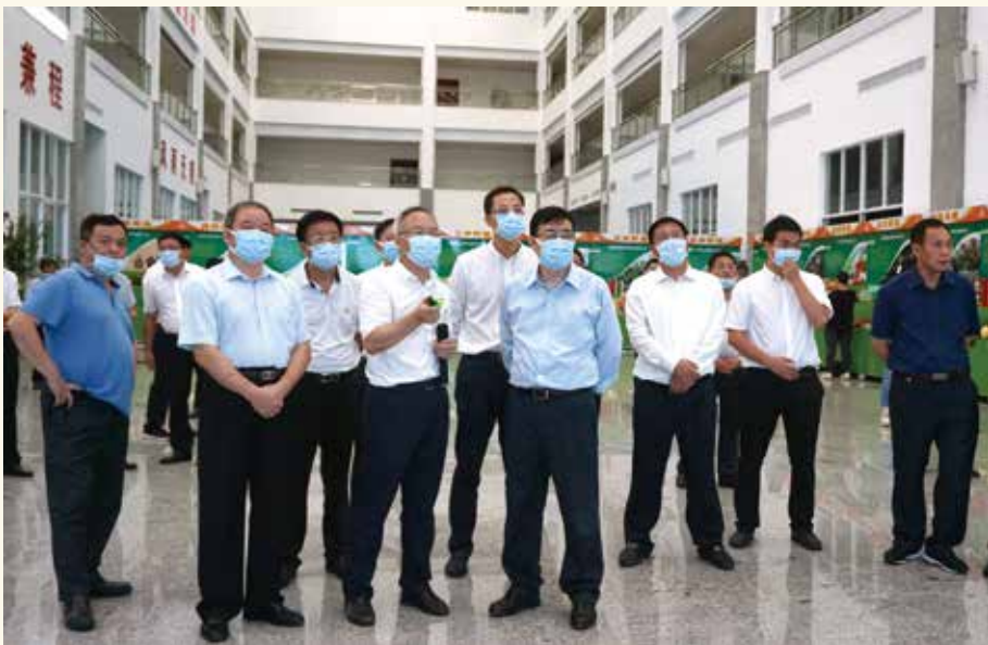
9月8日，省人大常委会副主任黄业斌（左二）、副省长王曦率调研组赴河源市调研。调研组先后到河源市高新区、东源县和连平县等地考察产业发展项目、保居民就业工作、脱贫攻坚及乡村振兴进展、公共服务基础设施建设等情况，并开展教师节慰问活动，走访慰问贫困户。