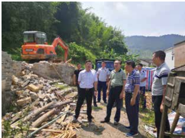
常委会组织代表督导乡村振兴“扫雷扫盲”专项行动