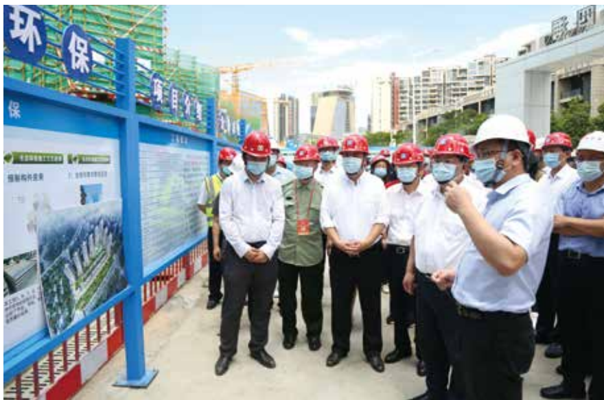
市人大常委会主任骆文智率队视察生态文明建设情况，筑牢生态环境保护的“法制屏障”

这个巨大的变化，与人大代表的推动分不开。面对群众反映的“入园难、入园贵”问题，市人大代表多次展开调研、视察、专题询问等活动，并提出意见建议。市人大常委会将代表的建议定为重点督办建议，督促政府有关部门加快幼儿园特别是公办园的建设。在人大推动之下，全市学前教育财政投入大幅增加，在公办幼儿园不断增加的同时，幼儿园师资队伍水平也大幅提升，到2022年，公办园大专以上学历的教师比例将提高到100%。