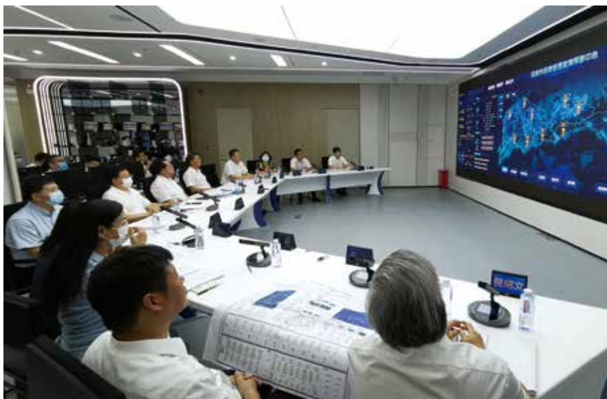
市人大常委会调研组调研全市应急管理工作情况，着力推进应急管理立法

人大常委会重大事项决定权被誉为“最具权力机关性质的权力”，是最具法律权威的决策形式。然而长期以来，在地方各级人大常委会中普遍存在着重大事项决定权使用频率低、使用范围窄、使用意愿弱、使用效果差等问题，与立法权、监督权、人事任免权相比其行使较为薄弱。在深圳也存在着程序性的决定决议行使得多、主动行使重大事项决定权较少、部分领域重大事项决定权未行使等问题。