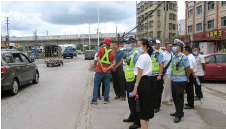
港口镇组织人大代表与职能部门人员现场解决交通拥堵问题