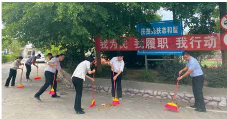
人大代表积极参加城乡人居环境大清扫行动