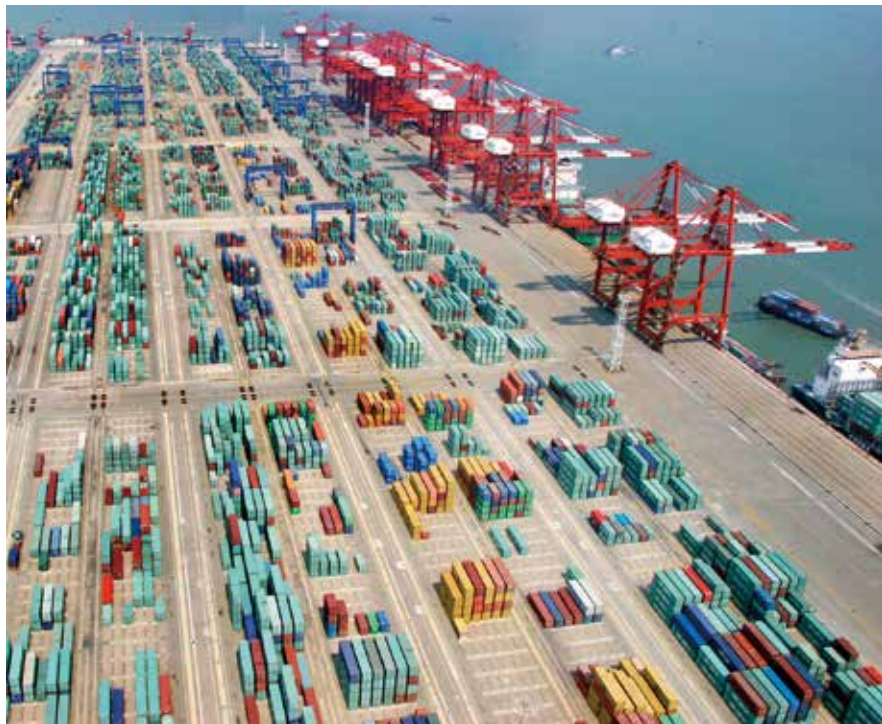
南沙港码头（资料图片）

三是注重沟通，加强协作。重视加强与省政府国有资产管理部门的沟通联系，及时就有关问题做好协调，形成工作合力，共同研究解决国有资产管理基础薄弱、底数不清，统计会计口径和标准不统一等问题，努力提高报告质量。重视与省政府办公厅、省财政厅、省国资委等部门的沟通协调，对报告征求意见稿从体例结构到报告内容等提出详