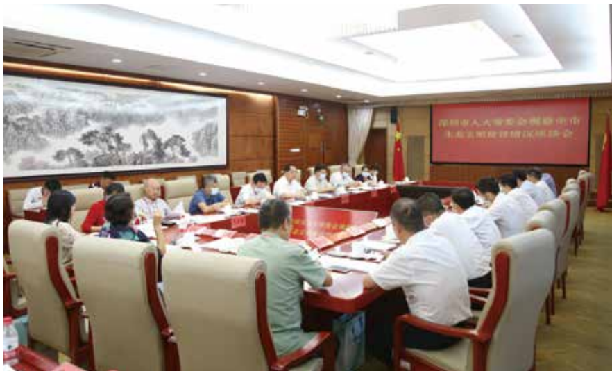
市人大常委会视察组召开座谈会听取全市生态文明建设情况汇报

月亮湾人大代表社区联络站成立于2002年，是全国第一个人大代表社区联络站。10多年来，联络站已为居民办成