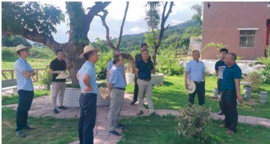
人大代表测评组进村了解情况