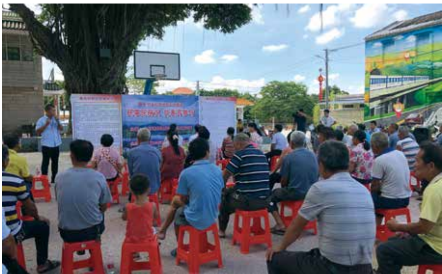
江门市新会区双水镇萌头村民议事会现场

处理机制和办理台账，抓好推动解决问题的跟踪督办机制，有效提高问题解决率和代表、群众满意率。省人大常委会领导在7、8月份，分别带队到有关省直单位，检查和督办常委会重点督办建议的办理情况。各地市人大常委会负责同志也大都以不同形式进行了督办，推动了一批问题的解决。湛江廉江市为解决石角镇剩余移民16000多人饮水工程建设问题，投入资金约5800万元，在全镇规划建设自来水厂19家。珠海市香洲区围绕老旧小区住宅加装电梯问题，组织代表深入社区、到住建局等走访，听取设计、监理、施工等相关单位介绍，突破35年前建成小区红线档案资料调取难、消防问题难、报装报建难等难关，推动多部电梯加装成功。中山市小榄镇推动解决大龙舟河桥处断头路、九洲花园车辆乱停放、东区丰源北路水浸、汇丰城马路标志不明显等群众反映强烈的突出问题，横栏镇推动解决了四沙商业街和贴边市场烧烤档及电动车占道经营、三沙段河涌黑臭水体严重等社会热点问题。据统计，主题活动中，全省收集关于城乡人居环境整治的意见建议11498条，已转办10004条，已解决6483条，占比64.8%。各地人大代表在主题活动中，扎扎实实推动解决了许多群众关切的民生难题。■