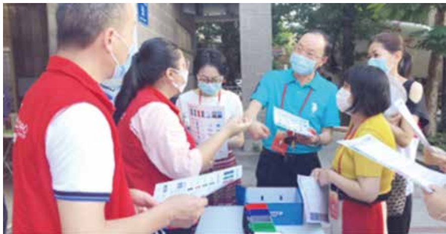
人大代表走进社区开展“垃圾分类”宣讲活动