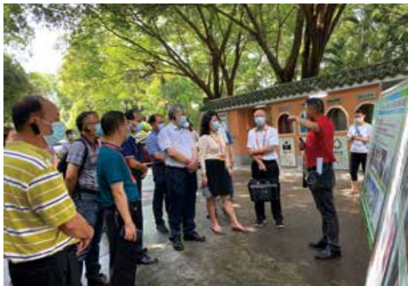
天河区检查组到越秀区检查垃圾分类工作

表示满意，同时也发现了诸如个别社区垃圾分类不够精细、机动车违法占道、旧楼加装电梯噪音扰民、老旧小区三线改造不彻底等问题，他们将这些建议意见汇总后，交由各区相关部门跟进处理。