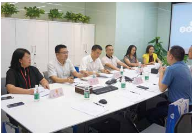
5G站点建设座谈会现场

“交通问题是清水河片区最大的困扰，不仅要统筹规划好，在开发建设过程中也要优先考虑解决。”“片区的改造一定要加快推进，不能等高铁、地铁建造完成才开始谋划和改造，提前更新，成本会更低。”……7月22日，人大街道工委和草埔西社区人大代表联络站组织召开了“清水河重点片区开发建设人大代表议事会”，区人大代表、清水河