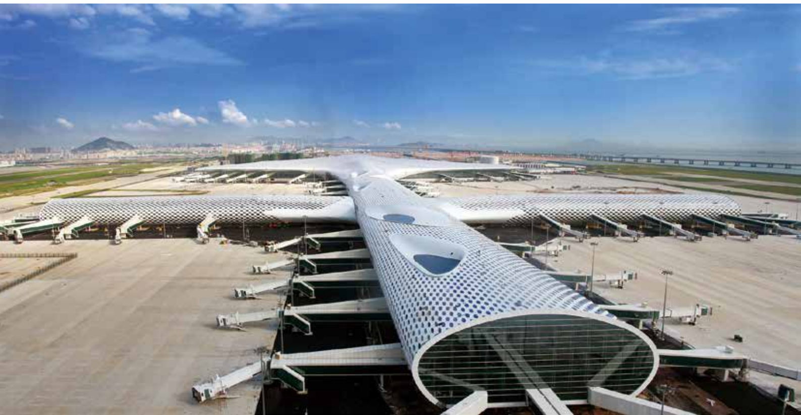
深圳宝安国际机场T3航站楼（资料图片）