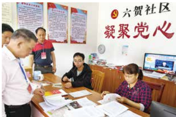
市、县两级代表到六贺社区监督村居干部工作纪律作风

只有敢“打开天窗说亮话”，敢“唱黑脸”，才能推动干部自查自纠，推动整改工作“向实、向深、向广”推进。常委会与人大东镇街道工委共同制定“五步走”方案。第一步，分片负责，层层压实责任。以人大街道工委作为督促整改的主要责任人，采取以片为单位的分工负责制方式，把督促整改责任分解压实到每一个市、县代表，做到“分