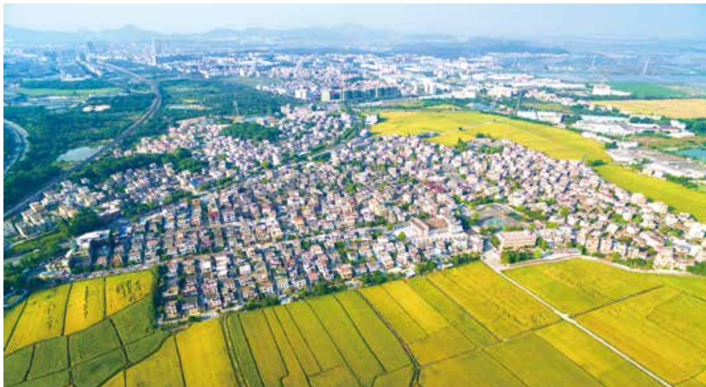
航拍金秋时节的中山市南朗崖口村（资料图片）