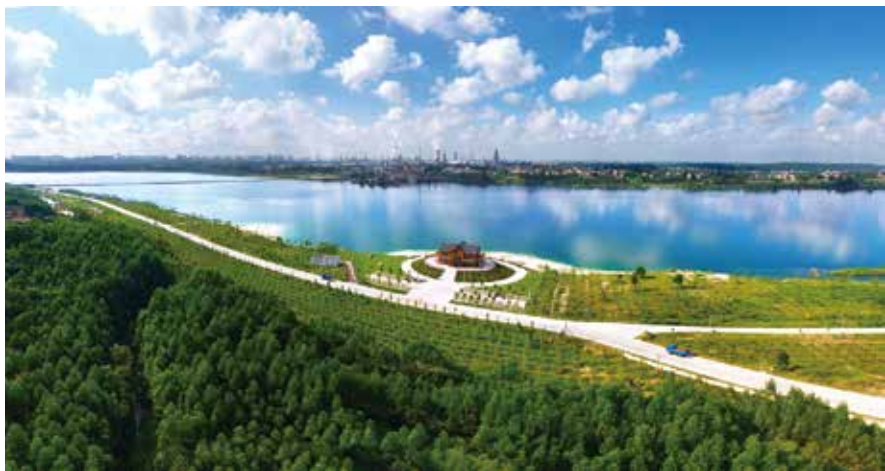
茂名露天矿生态公园好心湖