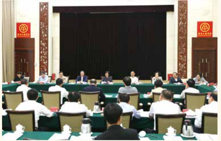
4月中旬，全国人大常委会副委员长沈跃跃率全国人大常委会执法检查组在广东检查《中华人民共和国水污染防治法》实施情况。检查组检查城中村水污染防治、河涌综合整治等情况，深入基层听取意见建议。