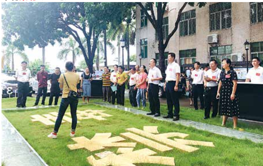
2018年9月12日，电白区人大常委会组织区、镇人大代表到沙院镇视察禁毒工作

度，从麻岗和树仔两个镇向周边蔓延，加上电白地理环境和治安形势的复杂，本来就缺警力的电白公安，已经是捉襟见肘了。