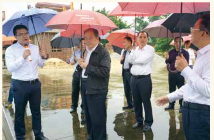
5月5日至8日，省人大常委会副主任黄业斌率队赴肇庆云浮两市就推进农村人居环境整治、建设生态宜居美丽乡村工作开展专题调研。（何敏/供稿）