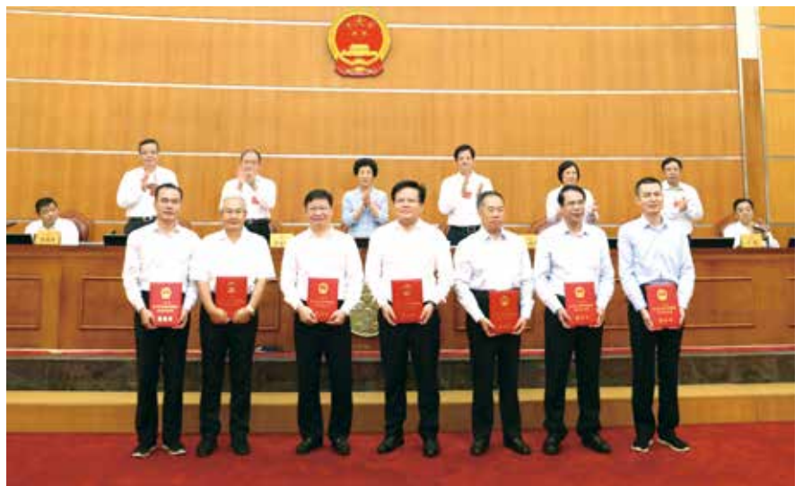
会议举行向省十三届人大常委会监督司法咨询专家颁发聘任书仪式

办法（修订）》的说明、珠海市人大常委会关于《珠海市人民代表大会常务委员会关于废止〈珠海市社会养老保险条例〉的决定》的说明、连南瑶族自治县人大常委会关于《连南瑶族自治县人民