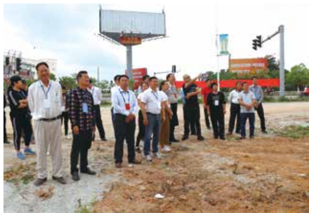
各级人大代表调研“雪亮工程”建设情况

2018年，林头镇人大主席团把“雪亮工程”、信访维稳、扫黑除恶、禁毒示范镇创建等工作作为加强代表履职的