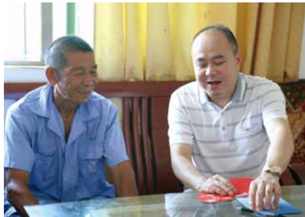
代表开展形式多样的走访、接访活动

收集意见建议366条，目前已办结280条，正在处理的86条，一大批涉及脱贫致富、教育医疗、基础设施建设等内容的民生实事得到跟进落实，许多困扰人民群众的“烦心事”得到有效解决。