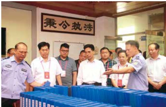
2018年6月12日，化州市组织市县镇三级代表视察公安派出所工作