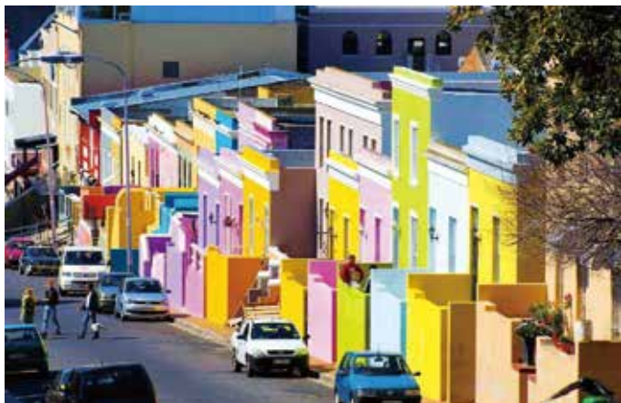
南非开普敦的彩色房子（资料图片）