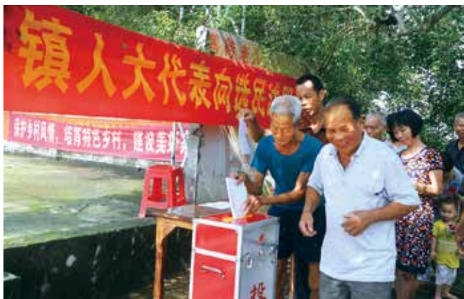
选民投票测评述职代表