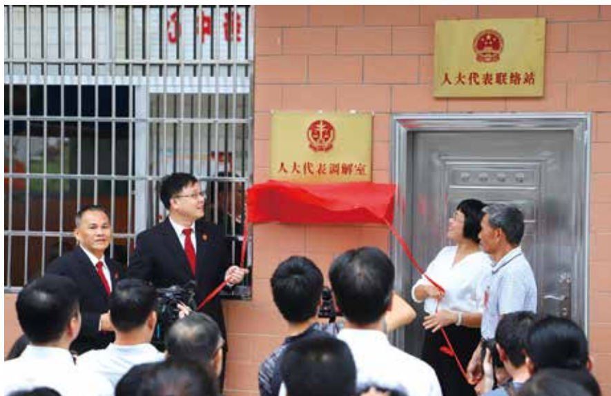
2018年12月6日，信宜市首个人大代表调解室在池洞镇大坡代表联络站揭牌