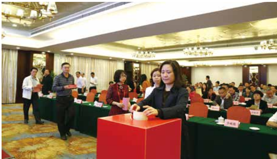
2019年3月6日，茂名市人大常委会组织代表评议河长制工作

案就开展评议的“指导思想”“评议范围”“评议的主要内容及评分”“评议等次的决定”“评议的组织”“评议时间”“后勤保障”“评议结果的运用”