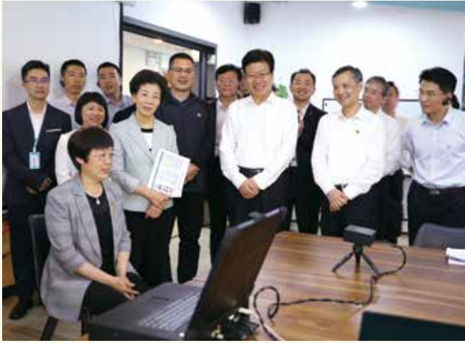
5月8日至11日，全国人大常委会副委员长张春贤率全国人大常委会执法检查组在广东检查《中华人民共和国就业促进法》实施情况。执法检查组深入企业、人力资源市场、高校、职业技能培训机构、公共就业服务中心等，检查就业促进法实施情况。