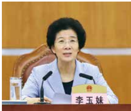
省人大常委会主任李玉妹作小结发言

5月23日下午，省人大常委会主任李玉妹在小结讲话时指出，省委召开全省人大工作会议，出台关于加强新时代人大工作的意见，这是深入学习贯彻习近平新时代中国特色社会主义思想，特别是习近平总书记关于坚持和完善人民代表大会制度的重要思想的重要思想的重大举措，是新时代加强和改进党对人大工作领导、推动我省人大工作高质量发展的一件大事。