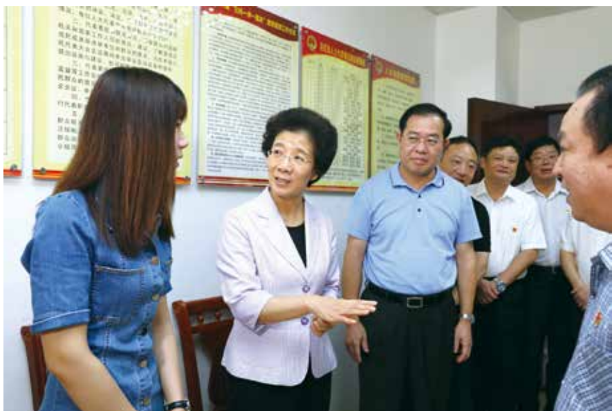
2018年8月，李玉妹主任赴英德市英红镇开展联系群众活动，听取基层代表和群众的意见建议

三、全省各级人大及其常委会要下大力气抓好会议精神的贯彻落实。这次全省人大工作会议规格高，内容十分重要。李希书记亲自出席并讲话，兴瑞省长和伟中副书记分别主持会议。李希书记在讲话中对如何提高人大工作质量和水平提出了六项任务，对加强党领导人大工作提出了三点要求。会议还专门就指导我省今后一个时期的人大工作出台省委意见。对这个文件的研究制定，省委高度重视，李希书记亲自过问，省委常委会会议专题研究讨论，省委办公厅逐字逐句进行把关。正如李希书记所说，