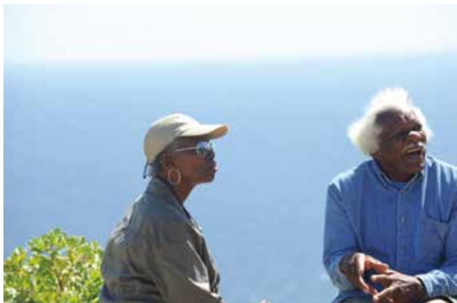
在海边休闲的南非百姓