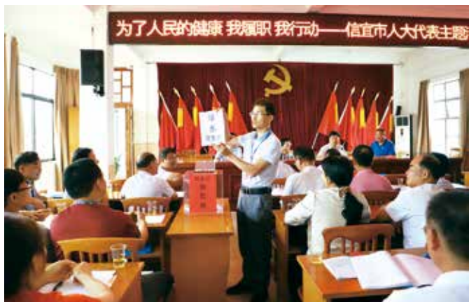
由代表抽签确定视察点