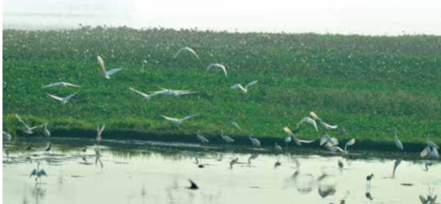
镇盛镇彭村湖生态湿地一景