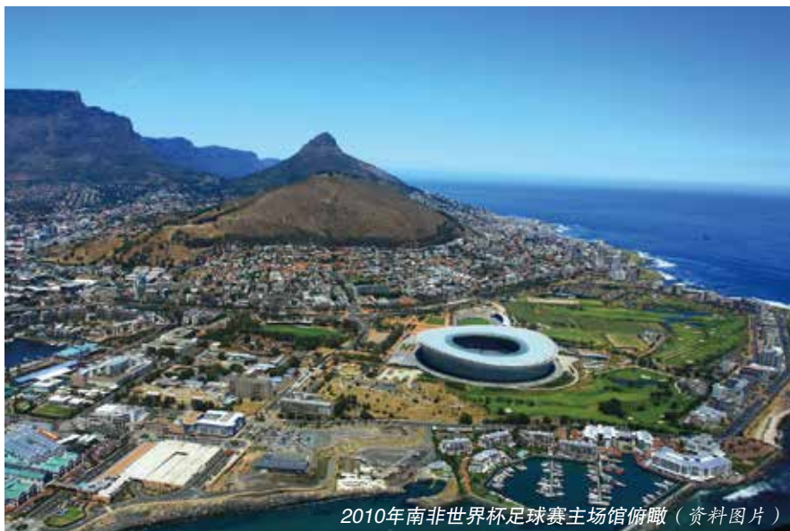
2010年南非世界杯足球赛主场馆俯瞰（资料图片）