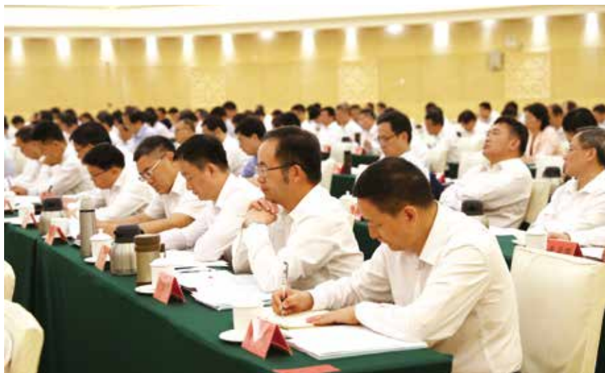
与会同志认真聆听

李玉妹在小结讲话时强调，广东各级人大及其常委会要把贯彻落实全省人大工作会议精神作为当前与今后一个时期的重要任务，认真学习、深刻领会、全面贯彻，切实落到实处。要紧紧围绕省委工作部署，认真行使职权，发挥好人大职能作用，坚持探索实践，完善工作机制，夯实基层基础，强化能力建设，不断推进广东人大工作高质量发展。■