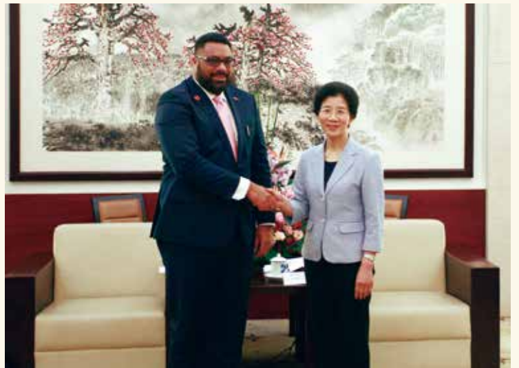
4月23日，省人大常委会主任李玉妹在广州会见来粤访问的汤加王国议长法卡法努阿一行。