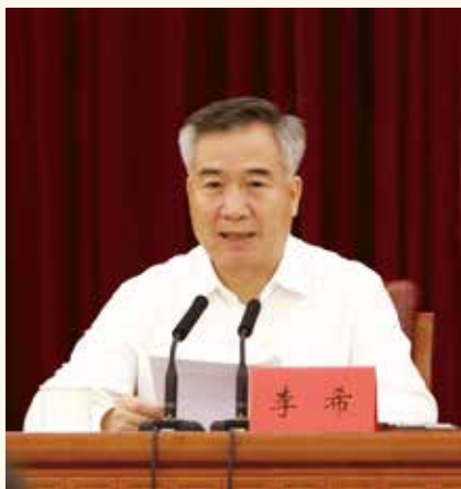
省委书记李希出席会议并讲话