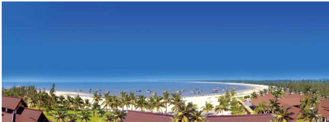
茂名市浪漫海岸海湾