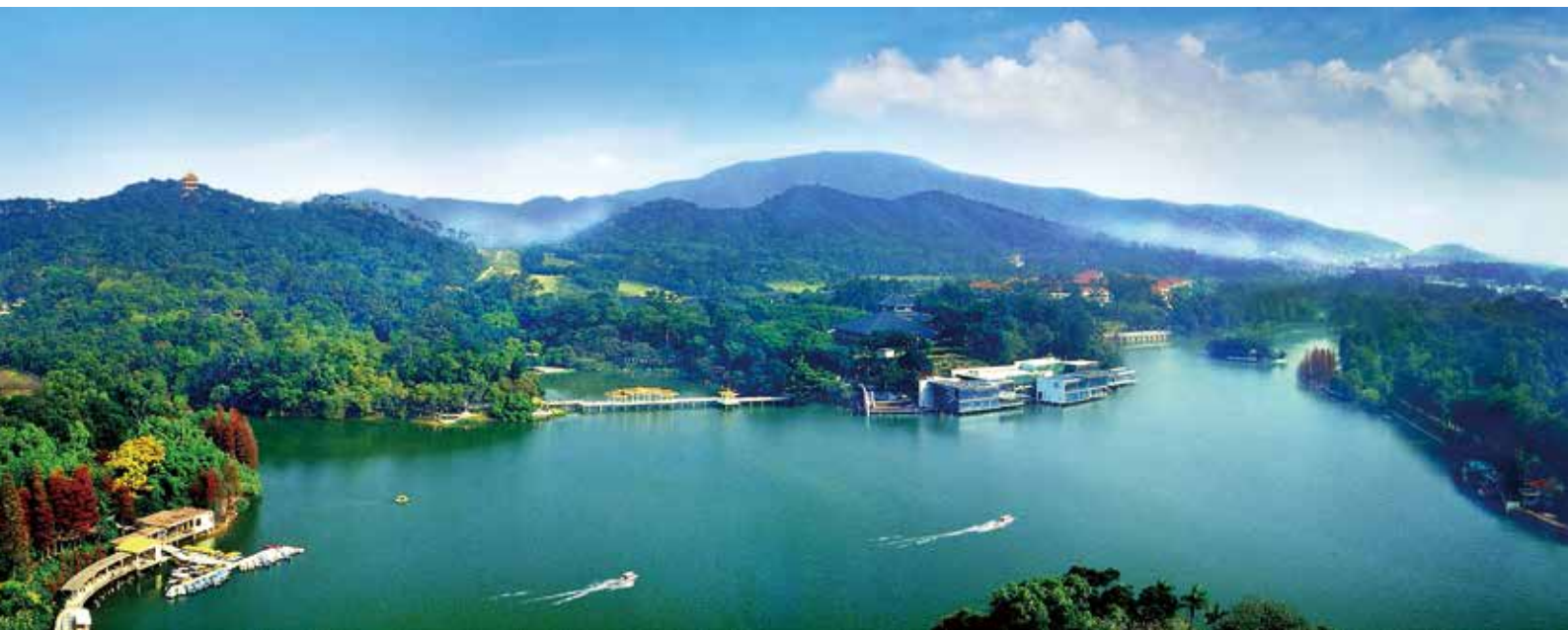
白云山下（资料图片）