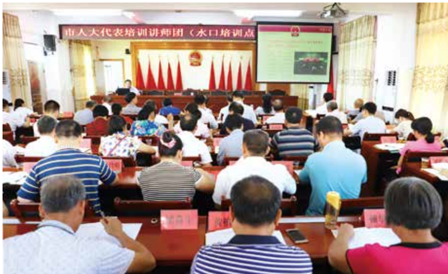
讲师团到各镇巡回培训

联系的有益尝试。三是有利于工作的推动。上级人大常委会统筹安排的工作，下级党委领导、支持的力度会更大，完成工作的条件更完备。更能实现针对同一监督项目的资源整合，形成浓厚的工作氛围，更便于综合运用监督法等法律规定的多种监督方式，形成一个比较完整的监督链条。四是有利于发挥各级人大的优势。市人大常委会发挥信息资源广泛、专业力量较强等优势，加强牵头组织、统筹协调、业务把关；县、乡两级人大发挥基层情况熟悉、问题了解透彻等优势，加强与群众的联系、听取群众的呼声，各方加强衔接配合，形成整体合力，契合联动特点、发挥联动优势，使工作抓得更实。五是有利于调动了镇级人大工作的积极性。市人大常委会点题，县、镇两级人大就有根有据、有名有实。六是有利于代表主体作用的发挥。开展联动工作，各级代表共同参与到每一项工作中来，几级代表一起，互相交流、互相学习、互通信息，更有利于人大代表互相帮助、共同提高。