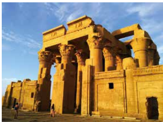
世界文化遗产，埃及最美的神庙——菲莱神庙、康翁波神庙（资料图片）