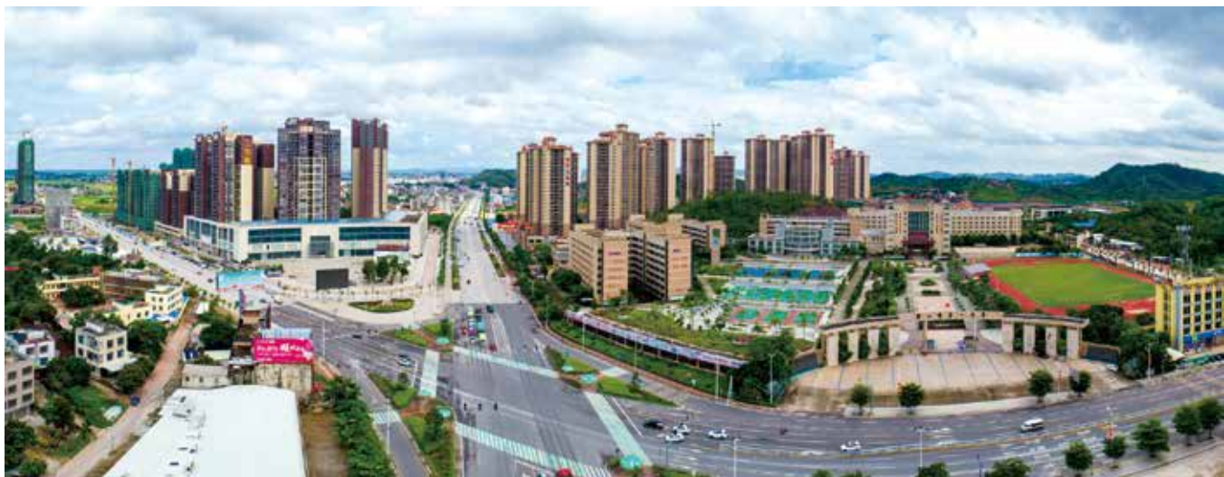
廉江市新貌（资料图片）

此外，代表联络站建设，让更多的代表参与日常活动，更好地凝聚人大代表智慧，形成工作合力，推动工作落实。例如，东环大道建设，全程12公里，跨越4个镇（街道），涉及大量征地拆迁。这四个镇（街道）人大代表，共同聚焦这一重点项目建设，通过联络站达到共识，在同一个月内安排多种形式代表活动，如开展视察调研、代表约见等活动，共同为征地拆迁工作发声造势，凝聚了更多的正能量，增强了沿线群众对项目的认同，有力助推征地拆迁任务顺利完成，为东环大道顺利开工建设贡献了力量。又如，2018年市人大常委会组织现代农业示范区建设情况调研时，依托各代表联络站，收集代表、群众的意见，将群众普遍要求政府尽快建立红橙黄龙病检测中心的意见，列入市人大的监督计划，推动黄龙病检测中心及时建成使用，体现了“人民有所呼、代表有所应”，也维护了廉江“中国红橙之乡”的美誉。■