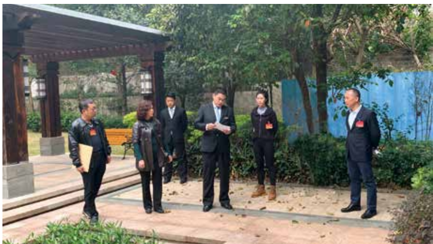
2019年2月，人大代表视察小区健身路径建设选址

远程联动专题接待。利用远程视频会议系统，组织人大代表与物业公司负责人、选民代表、社区律师围绕小区物业管理开展专题接待活动，为修订广州市物业管理条例征集了很多条意见建议。