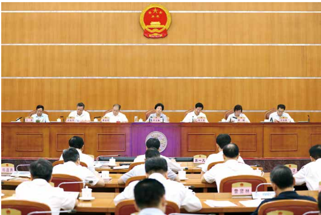
7月8日，省人大常委会召开全省人大代表联络站工作经验交流会（珊玮/摄）

意见关于县级人大要做到“五个规范”和乡镇人大要做到“三个规范”的要求，推动县级人大进一步提升会议组织、代表作用发挥、监督工作、重大事项讨论决定和人事选举任免工作的规范化水平，加快推进乡镇人大会议组织、重大事项讨论决定和主席团闭会期间工作规范化建设，切实提高县乡人大工作制度化规范化科学化水平。