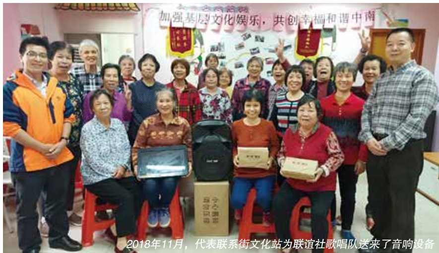
2018年11月，代表联系街文化站为联谊社歌唱队送来了音响设备