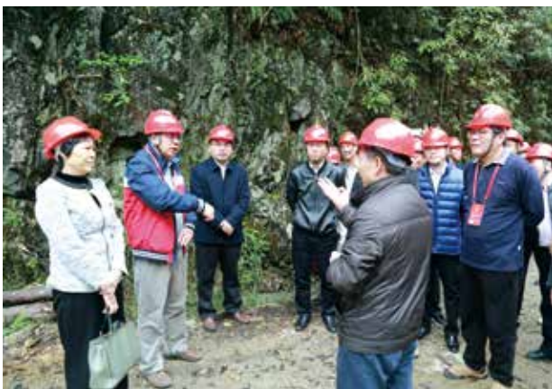
代表在南雄市视察小水电站