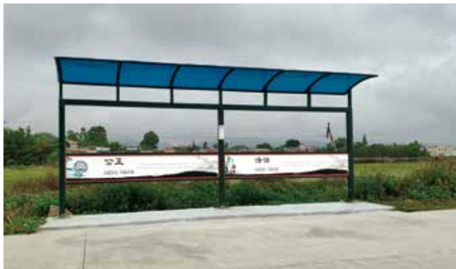
汶村镇校车候车亭投入使用