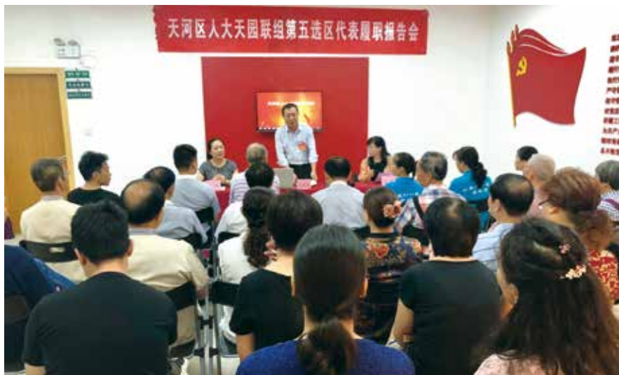
2018年8月，广州市天河区人大代表到选区开展履职报告会，接受选民群众的评议监督

代表联系社区制度：一是每名代表相对固定联系1-2个社区；二是组织代表积极参加慰问困难群众、居民议事、法律宣讲、文艺活动等社区活动；三是制作代表联系群众联系卡、意见卡，设立群众意见箱，方便群众找代表。