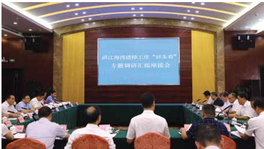
召开海湾清障工作“回头看”专题调研汇报座谈会

调研组乘船出海，现场察看可能存在的“黑点”“盲点”。霞山区监管海域发现大面积蚝桩等违建，虽然开始组织拆除，但还不够彻底；坡头区监管海域出现非法渔业设施最多，虽然通过开展宣传及公告自行拆除，但效果甚微；开发区出现了边拆除边违建的现象……这些现状都表明了属地监管责任落实还远未到位，各地查处执法力度也很不平衡，致使个别海域非法渔业设施死灰复燃。加上长期以来湛江海湾存在多头管理的问题，《湛江市人大常委会关于评