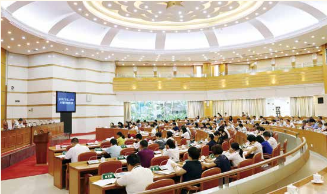
6月21日，省人大常委会举办省人大代表乡村振兴专题学习班。