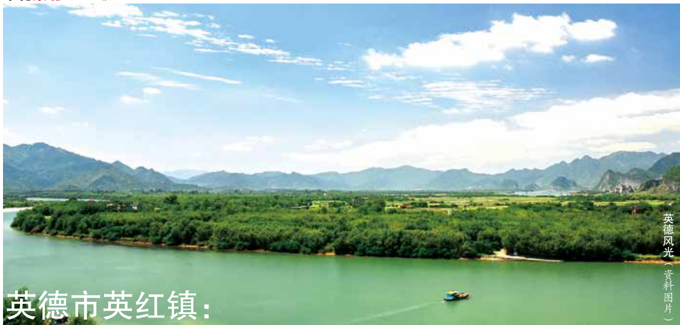
英德风光（资料图片）