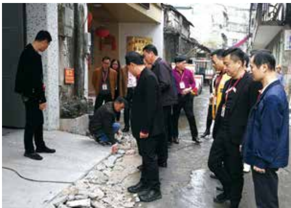
庵埠镇人大代表调研镇区破损道路