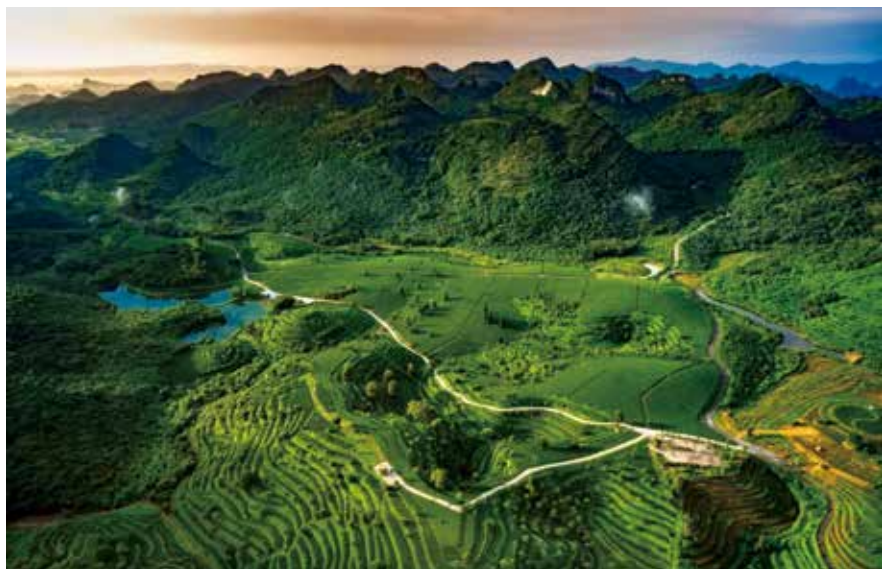
英德积庆里红茶谷（资料图片）

突出代表主体作用，推动代表履职活动规范化。 在要求代表积极开展履职活动基础上，镇人大对代表活动的要求也提出了更高的标准。如在代表进驻站接待选民群众时，要求提前三天进行公告，防止接待联系群众活动走过场；在具体接待联系选民群众过程中，要求代表牢牢坚持“负责收集和听取民意，但不负责直接解决问题”的原则，既要认真听取群众意见，又要严格把握工作中的“度”，不越俎代庖干政府的事，针对代表开展履职活动过程中收集到的意见和建议，要求严格按照问题清单（收集）、责任清单（转办）、公示清单（结果）的要求进行转办、督办及答复，有效防止将代表联络站变成信访室，也防止群众提出的问题和意见石沉大海。对代表个人走访联系选民群众、收集群众意见建议、开展跟踪监督，以及代表所跟进的意见建议的办理及答复情况，全部实行“一人一档”的要求进行管理，做到活动规范、程序规范、档案管理规范。■