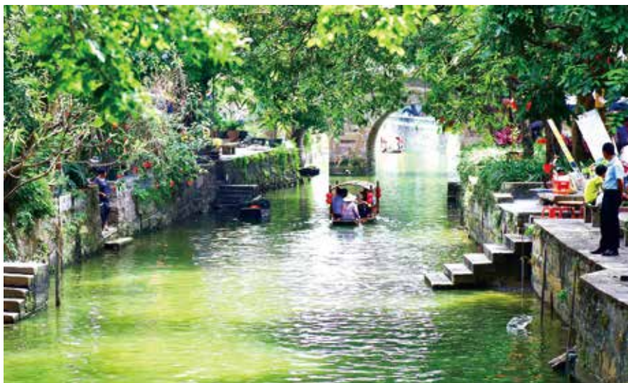
佛山顺德逢简水乡（资料图片）