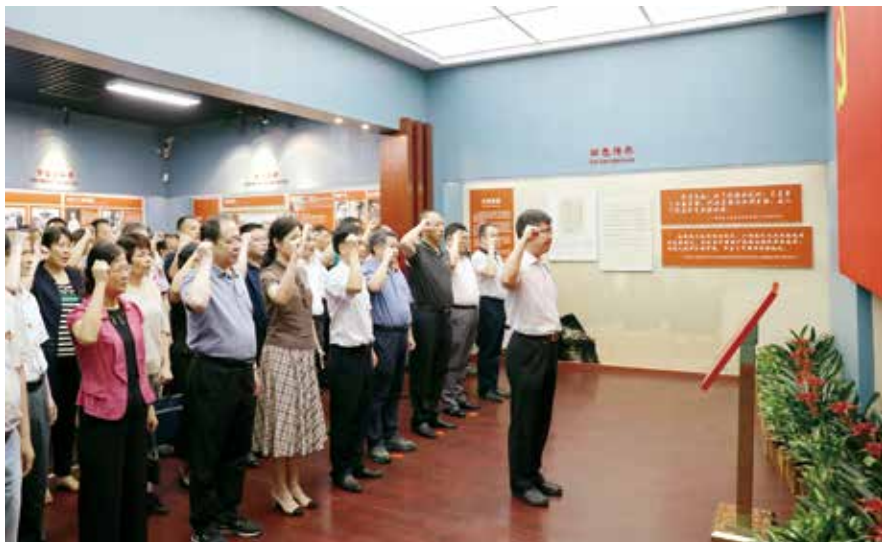
6月24日，省人大机关全体党员干部参观广州起义纪念馆并重温入党誓词

为大力整治形式主义、官僚主义，省人大常委会针对文风会风还需进一步改进以及调查研究存在形式主义的问题，研究制定了《省人大常委会机关关于解决办文办会和调研形式主义突出问题为基层减负的具体措施》，提出了大力精简文件的目标任务和10条措施、精简会议的5条举措、科学合理安排调研和执法检查的3条措施等，建立了解决形式主义突出问题专项工作机制。同时，常委会明确把力戒形式主义、官僚主义作为开展“不忘初心、牢记使命”主题教育重要内容，纳入年度和专题民主生活会、组织生活会征求意见、对照检查的重要内容，切实加强督促检查，切实落实减负松绑措施，真正使开展主题教育的过程成为深化认识、改进提高、破解难题、推动工作的过程。■