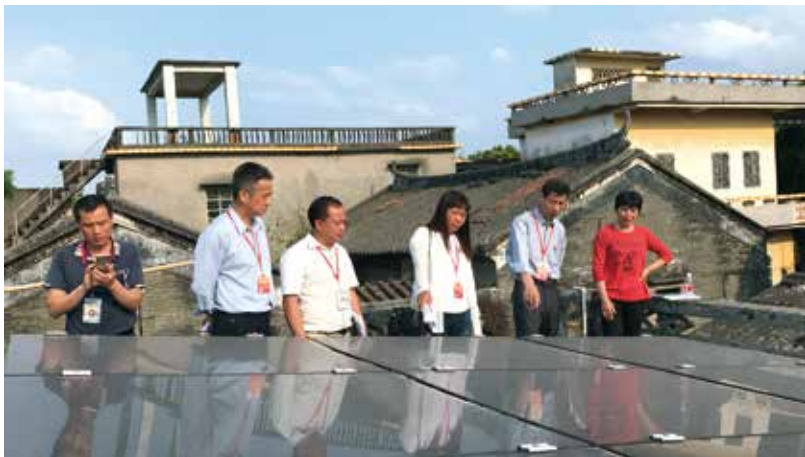
人大代表走访精准扶贫家庭