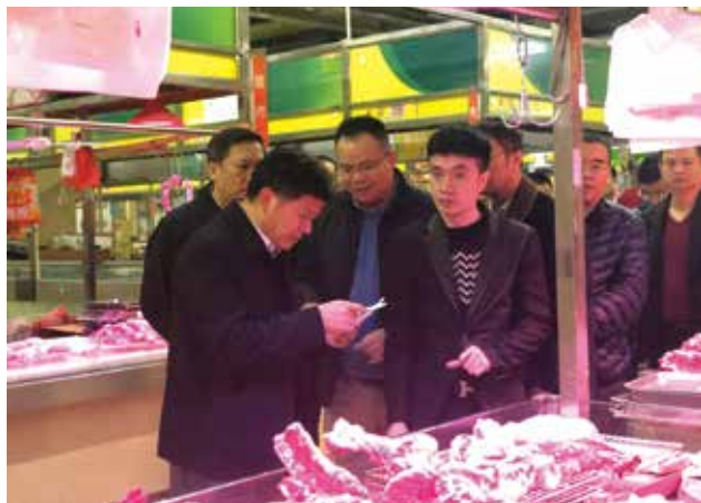
东莞市人大代表在万江中心市场督导检查食品安全

委会及时将生猪定点屠宰场整合、牛羊定点屠宰场建设等作为2018年跟踪监督的重点内容。跟踪监督的结果显示：2018年建成南城、横沥的两家牛羊定点屠宰场，其中横沥屠宰场已试产运行，牛、羊屠宰量分别为50头/日、450头/日，南城屠宰场已完成工程建设，正在办理相关验收手续。目前，市民在市场上买到了