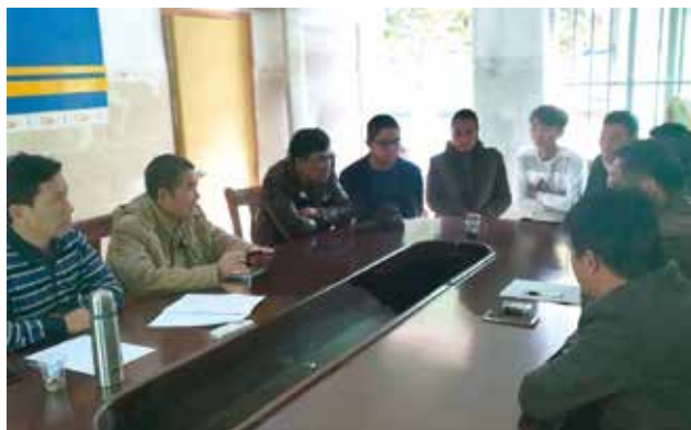
镇人大组织劳务双方调解现场