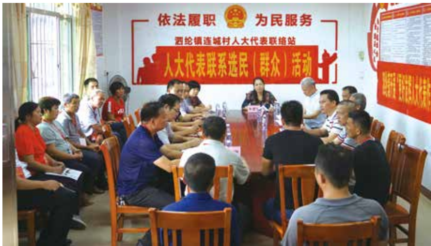
7月22日，罗定泗纶镇连城村人大代表联络站代表联系选民活动现场

这些天来，泗纶镇人大要求驻站的人大代表都回到各自所在的工作居住地，在深入群众了解民情的同时，广泛宣传这个活动安排，要让联络站附近的两万