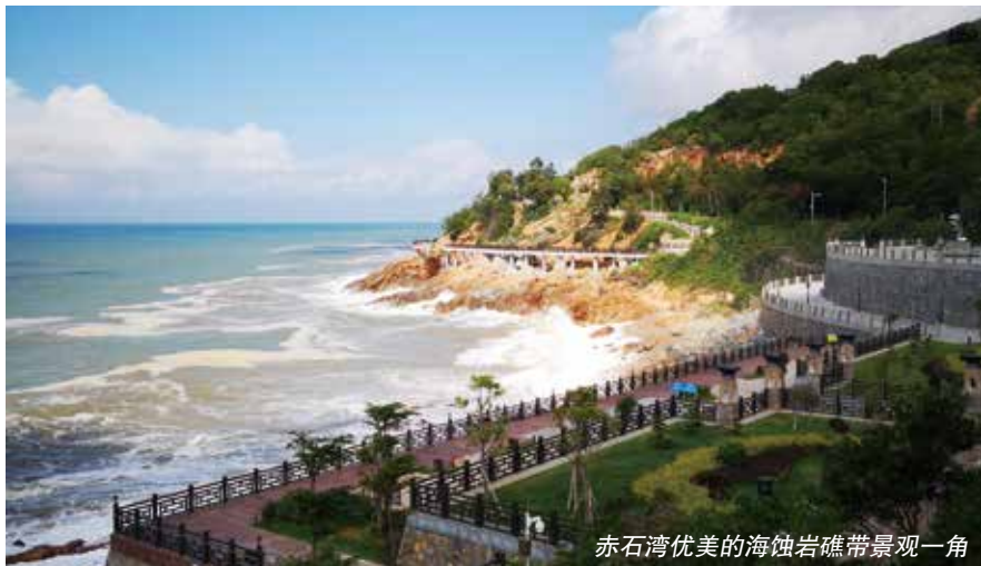
赤石湾优美的海蚀岩礁带景观一角