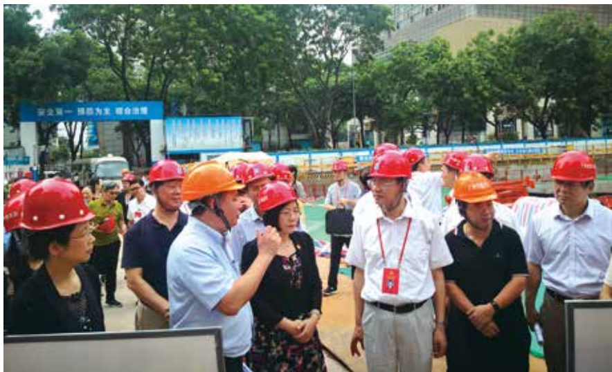
人大代表视察广州华侨博物馆在建项目

值得一提的是，7月30日，结合“生鲜农产品互联网+冷链配送体系建设”这一城市发展中的热点问题，市人大常委会