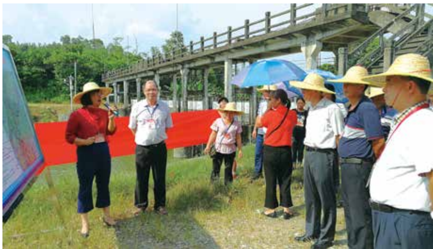
河长制监督员视察河道治理情况

监督评价。为了更好地收集监督员上报的信息，圣堂镇委、镇政府建立了专门的信息上报平台，监督员可通过平台分享各种信息。