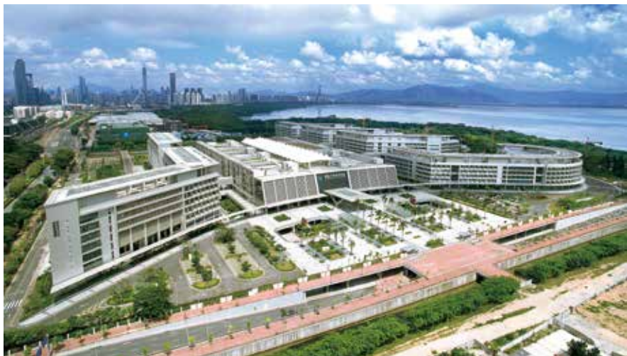
香港大学深圳医院全貌（资料图片）

深圳市的有关负责人回应，将在交通、科技、人才等方面继续加强与粤东北地区的联动，实现人流物流的互联互通，同时希望粤东北提升产业衔接的能力，在区域内打造承接产业转移的良好环境。■