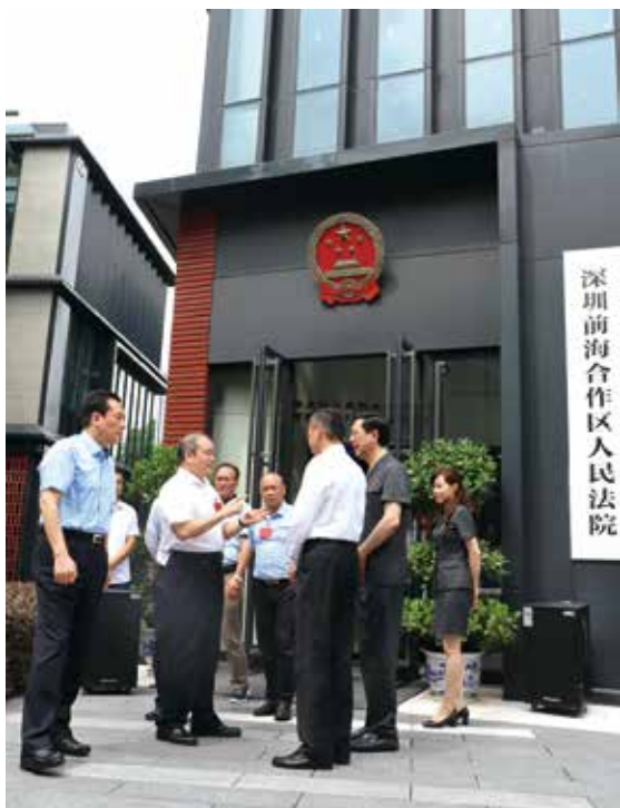
调研组在前海法院调研（雪敏/摄）

疗券香港大学深圳医院计划，成为深港跨境合作的重大创新，受到香港长者的欢迎，“在内地的香港市民不过关就能享受相关医疗待遇”。