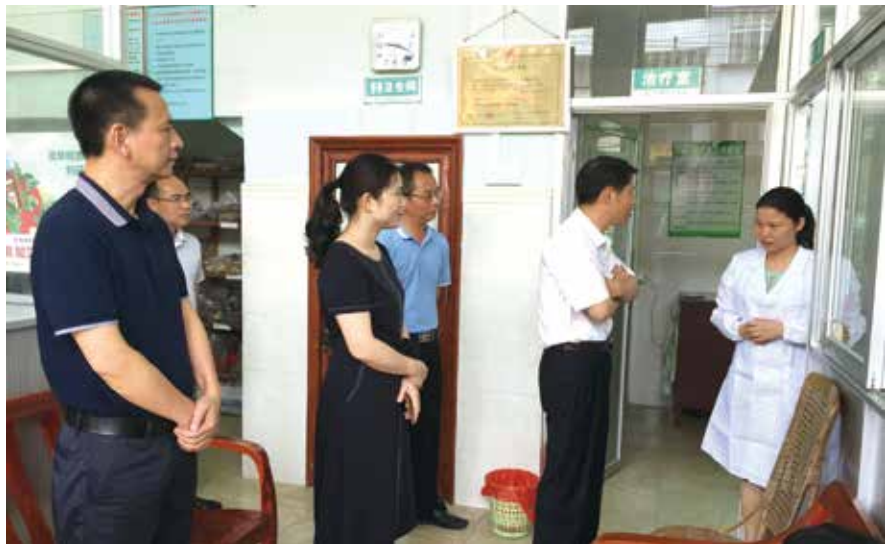
调研组走街串巷，深入各村卫生站调研

通过一段时间的座谈、走访、听取汇报和实地察看，各调研组对村级卫生站建设和运行情况有了进一步的了解，摸清了村卫生站的发展现状和基层需求。当前，兴宁市村卫生站建设虽然取得了一定成效，但离国家、省、市要求与人民群众日益增长的医疗服务需求仍