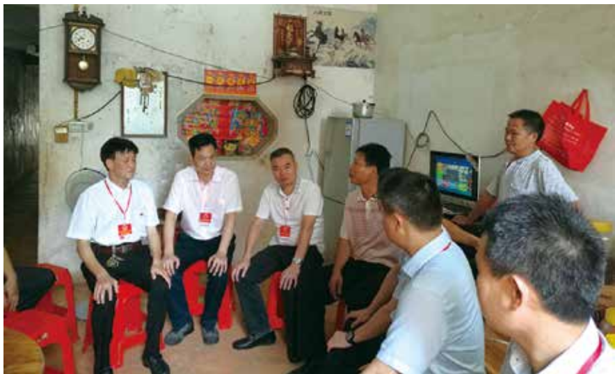
江城区人大代表走进群众家中听取意见