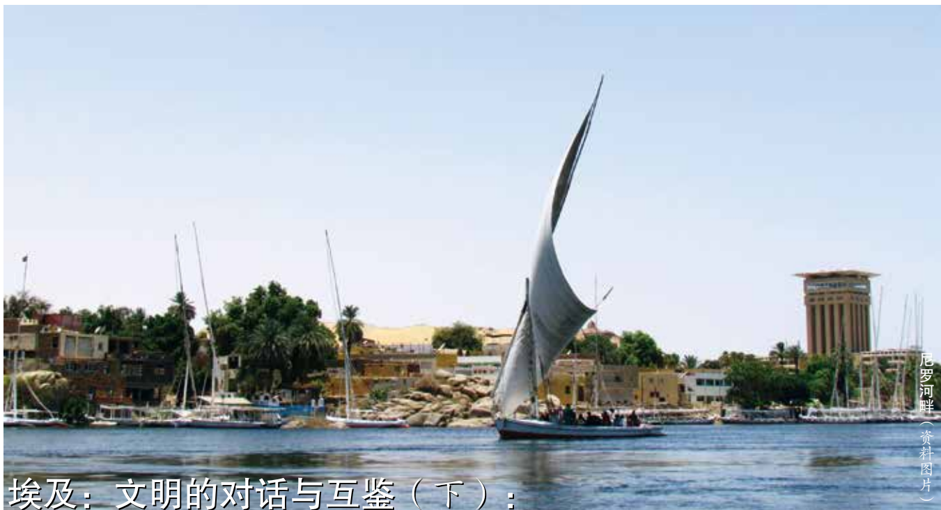
尼罗河畔 (资料图片)