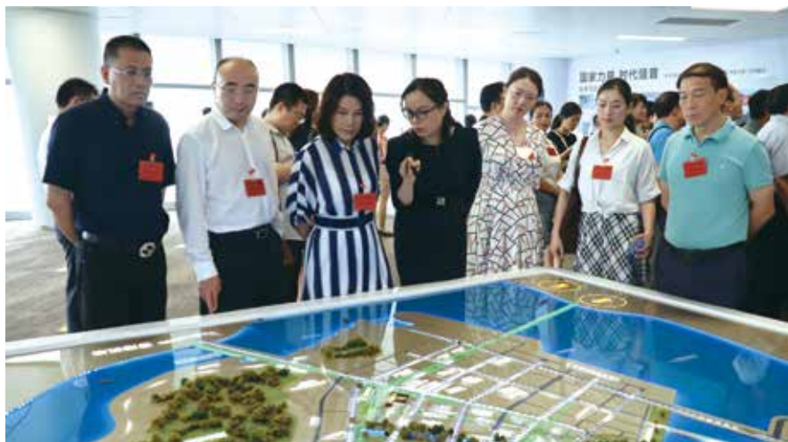
代表们现场了解河套地区的规划设计

医院的医护人员是“白天深圳人，晚上香港人”，医院的医疗服务同样也惠及深港两地的居民，“我们不仅为深圳的市民提供优质的医疗服务，香港的市民也一样能享受到我们的医疗服务”2015年10月，香港特区政府推出长者医