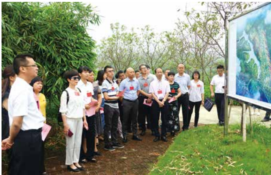
7月11日，全国人大代表在四会市地豆镇视察美丽乡村建设

“我省农村医保结算在县域范围内已经实现了一站式结算，但很多因病致贫的贫困户，通常都是患有大病，需要经常到省内其他医疗条件较好的城市大医院诊治。因此，医保结算应尽早实现省域范围内的一站式结算。” ■