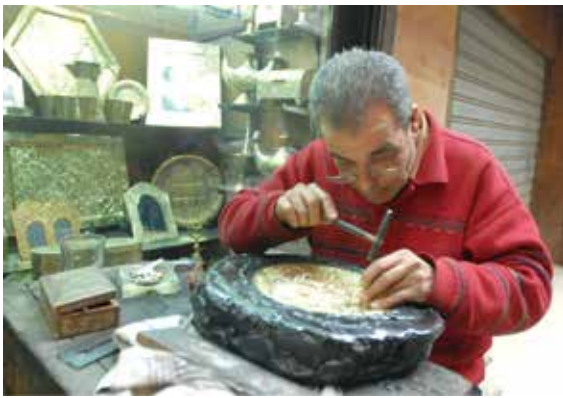
开罗工艺品店的工匠