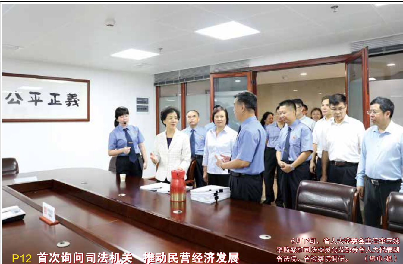
6月下旬，市人大常委会主任李玉妹率监察和司法委员会及部分省人大代表到省法院、省检察院调研。