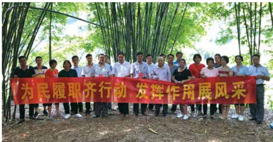
赤坑镇人大组织第一联组代表调研古水河赤坑圩镇段水污染防治工作情况