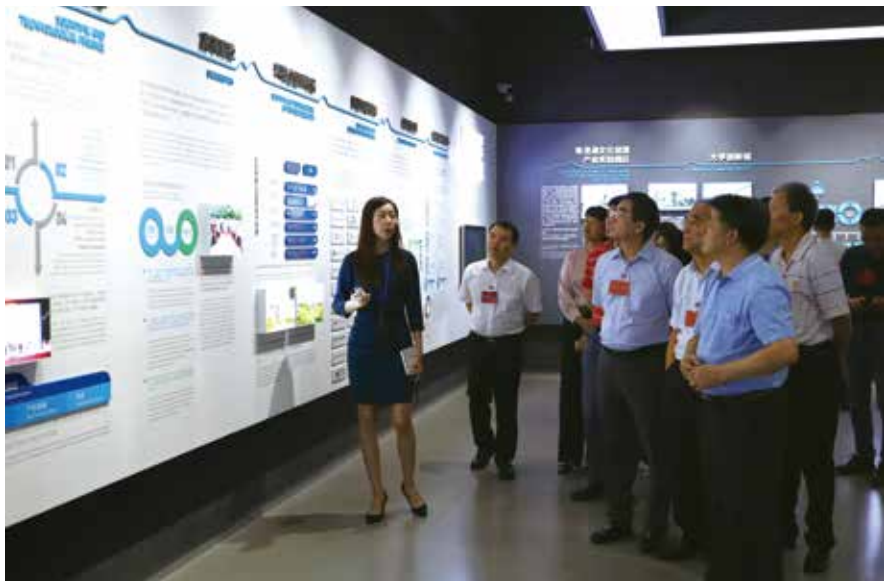
代表听取东莞企业情况介绍

在东莞市搜于特集团，代表们了解到，这家从事休闲服饰品牌运营、供应链管理业务的民营上市公司，去年实