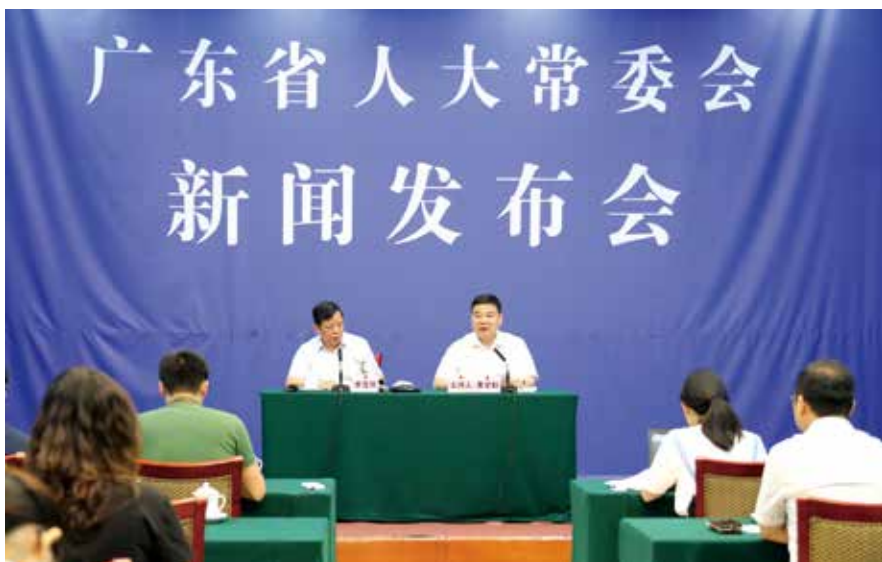
6月27日，省人大常委会召开新闻发布会，详细介绍今年主题活动的部署安排

性开展形式多样、内容丰富的代表活动，进一步丰富了闭会期间代表活动内容，创新了代表活动方式，拓展了代表履职途径，为代表工作闯出了一条新路子。例如，深圳市在全国首创深圳人大代表大讲堂网络直播，由人大代表中的各行各业专家上台专题授课，全程网络直播；召开深圳基层创新案例研讨推进会，为基层人大创新实践提供了“深圳范本”或“深圳标准”。广州、湛江、阳江、佛山等市充分发挥代表小组专业特长，突出专业性和针对性，分法制、预算计划、城建环资等多个专业小组开展活动，确保调研走专走深。珠海利用“珠海人大”微信公众号推出主题活动专题投票，选出群众关心的热点难点问题作为活动主题。