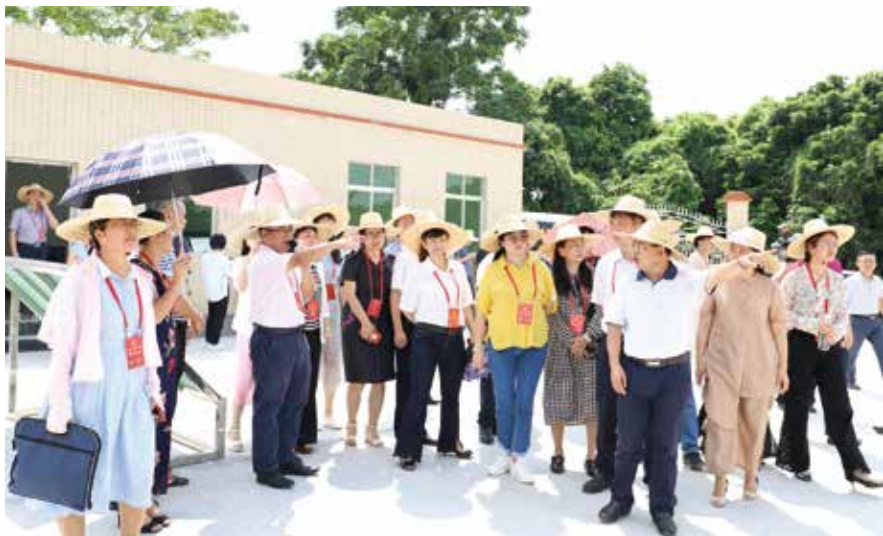
7月19日，代表视察信宜市镇隆镇污水处理厂建设及运行情况