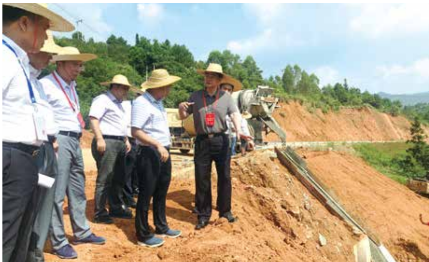
人大代表查看损毁道路修复情况