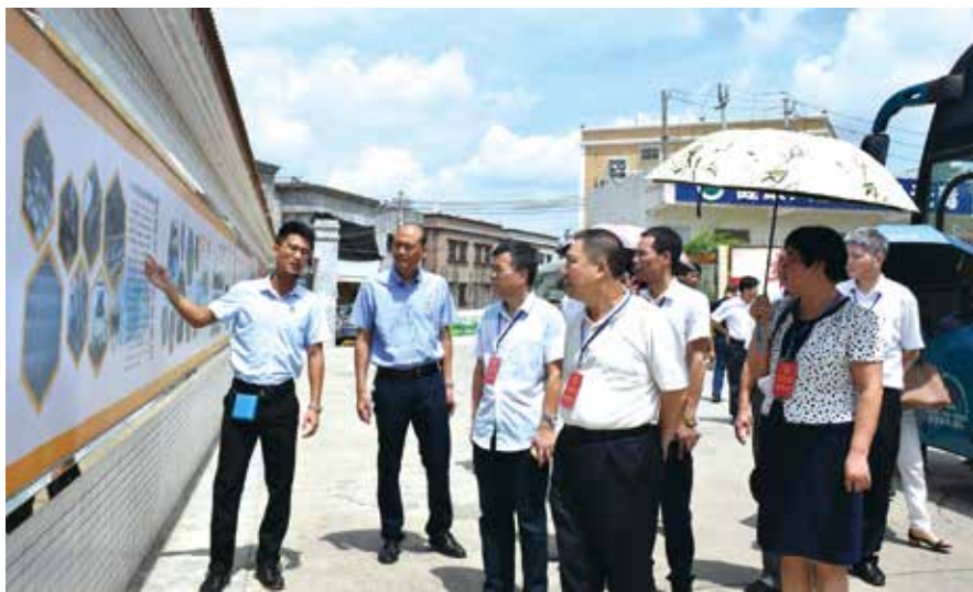
人大代表在行动，时刻关注“创建禁毒示范市”工作

7月下旬，陆丰市人大常委会积极开展“更好发挥人大代表作用”主题活动，组织各级人大代表视察“创建禁毒示范市”工作，代表边视察边赞叹：