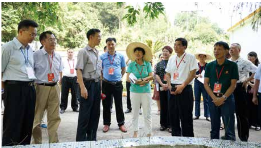
代表集中视察农村人居环境整治工作