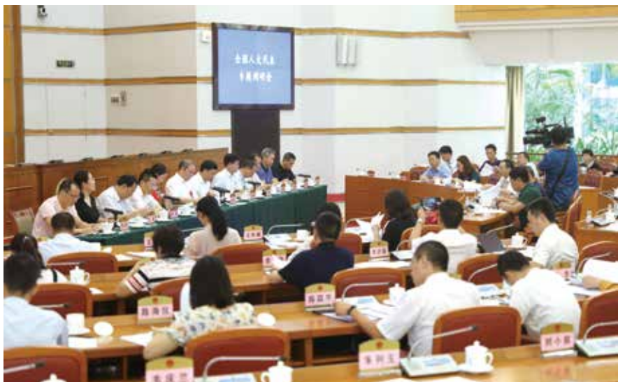
7月8日，全国人大代表调研组听取省政府和有关部门情况汇报

议研讨，省人大常委会决定：今年的主题活动将设定统一的专题，不仅选题有“高度”，而且内容更聚焦、更有针对性。