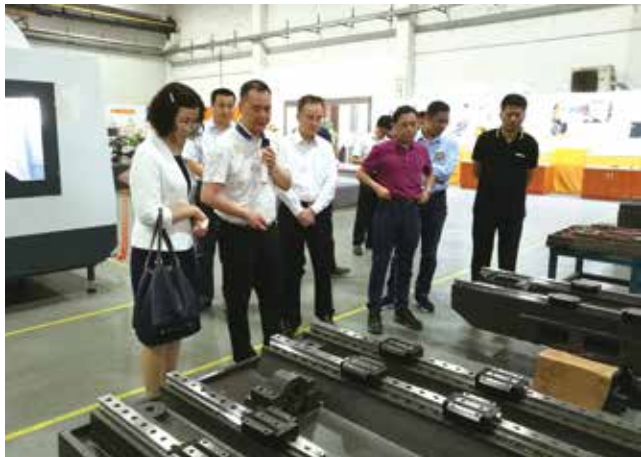
省人大常委会调研组在民营企业调研