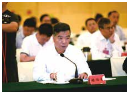
省法院院长龚稼立、省检察院检察长林贻影到会询问