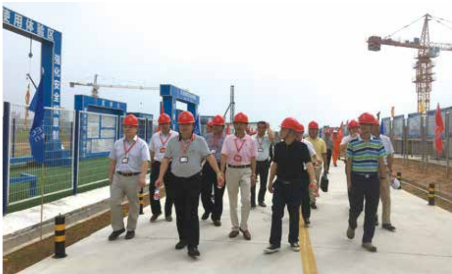
镇人大第一代表小组视察热电联产项目建设情况