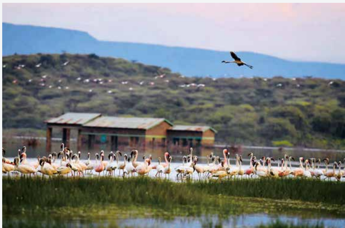
肯尼亚博高利亚湖的火烈鸟

非洲广袤无垠的草原，惊心动魄的大迁徙，还有数以万计的非洲生灵……，肯尼亚，一个野兽和人类共生共息的荒野国度。