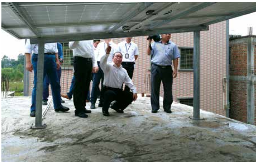
2017年11月，省人大常委会副主任黄业斌在化州市调研贫困户光伏发电项目

为使专题询问“问出深度、问到要害”，确定询问问题至关重要。农委一方面与省政府有关部门密切联系，加强