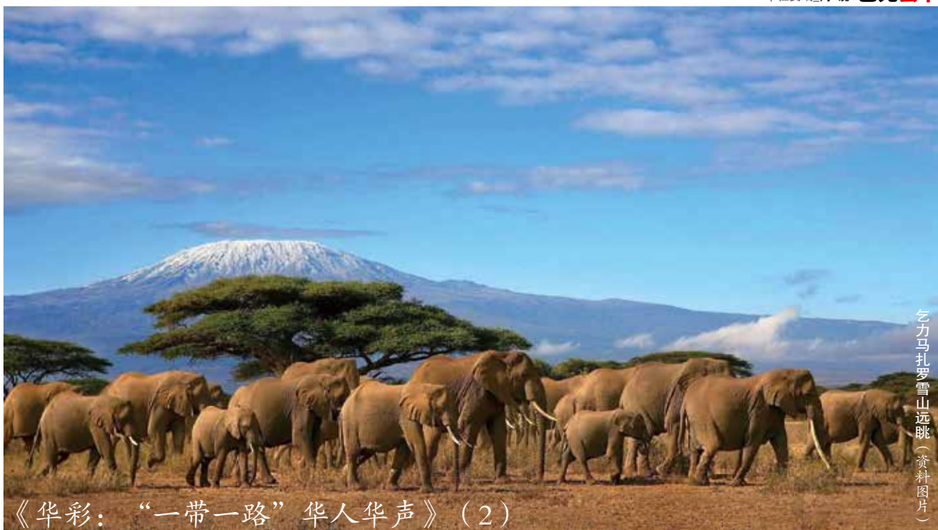
乞力马扎罗雪山远眺(资料图片)