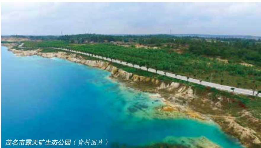
茂名市露天矿生态公园（资料图片）

更好地保护茂名人民践行生态文明建设、坚持绿色发展理念的成果，茂名市委指示市人大常委会深入听取群众意见，开展立法调研，切实把立法保护露天矿生态公园项目摆上立法日程。2017年2月6日，市人大常委会把《茂名市露天矿生态公园保护管理条例》列入2017年立法工作计划的初次审议项目，立法工作随即启动。