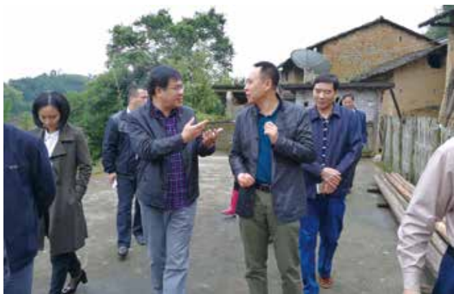
省人大农委专题调研组在南雄市调研