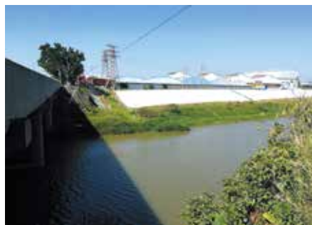
整改后的沙湖水浦桥底下一汪清泓

2012年，常委会在听取审议了市政府有关专题报告后，作出了《关于加强市区山体水域保护与利用的决定》。决定明确要求市政府尽快制定市区山体水域保护规划及管理规定，对市区山体水域实施严格保护。规定若因道路交通、市政公用、旅游景观及必要的公共服务和因特殊用途的设施建设，确需挖山、填水的，政府及相关部门应慎重研究，从严审批，依法处理，并及时向市人大常委会报告。决定得到了社会各界和人