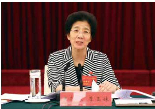
省人大常委会主任李玉妹主持联组会议

力就业增收空间。着力深化农村土地制度和农村集体产权制度改革，激发贫困地区产业发展的活力。着力加强政策制度创设，特别是要建立和完善督导检查、绩效考核等制度机制，组织开展农业扶贫领域作风问题专项整治。”郑伟仪用“六个着力”来解说省农业厅的“通关”方案，而目标就是：到2020年建成150个省级产业园和200个以上农业特色专业镇、1000个以上专业村，使产业发展既能带动点上的2277条村当中占30%贫困人口，又能带动面上70%的分散贫困人口增收。