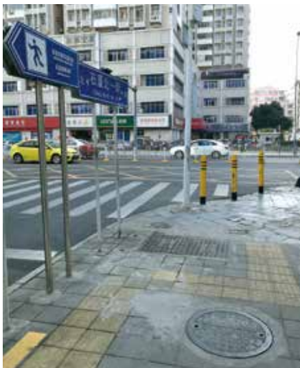
挡路的电箱（左）被移走了（右）