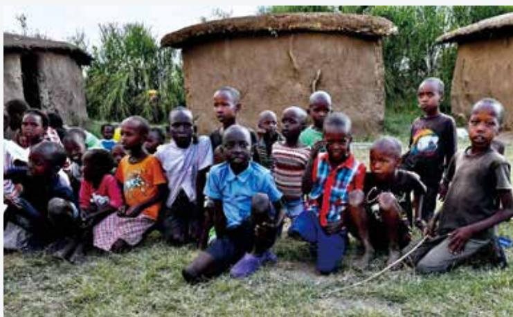
东非大草原马赛村的小朋友

非洲广袤无垠的草原，惊心动魄的大迁徙，还有数以万计的非洲生灵……，肯尼亚，一个野兽和人类共生共息的荒野国度。