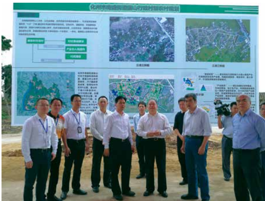
2017年11月，省人大常委会副主任黄业斌率队到化州市调研新农村规划建设情况

与的产业带动利益联结机制，保障贫困户收入可持续稳定增长，让贫困群众在发展特色产业中增加经营性收入，让产业在脱贫中成为治本之策。