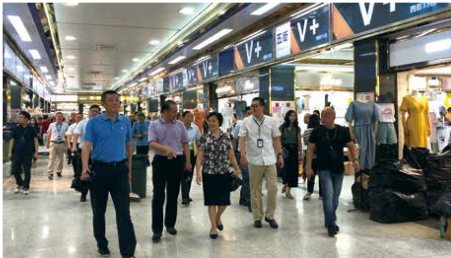
调研服装市场改造工程