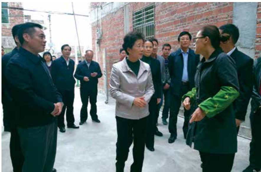
2017年11月，省人大常委会主任李玉妹到紫金县检查指导脱贫攻坚和新农村建设工作

议、中央农村工作会议、打好精准脱贫攻坚战座谈会、全国“两会”、中央财经委第一次会议、中央政治局常委会会议、中央政治局会议等重大会议上，反复强调要打赢脱贫攻坚战。今年6月，中央召开了关于打赢脱贫攻坚战三年行动电视电话会议，总书记又作出重要指示。