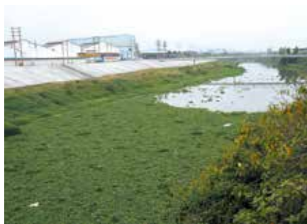
整改前的沙湖水浦桥段水浮莲密布河面

之后几年，常委会持续跟踪督查潭江流域水环境保护专题询问意见的落实情况，并围绕农村垃圾处理、城市黑臭