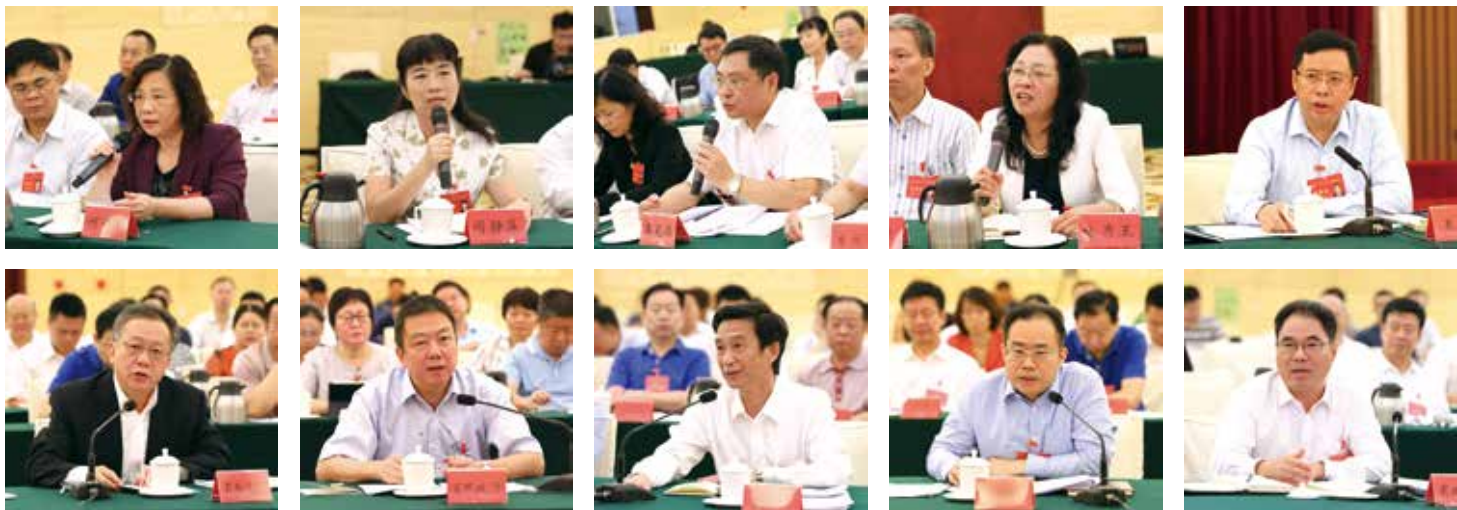
常委会组成人员轮番发问，省政府有关职能部门负责人如实回应