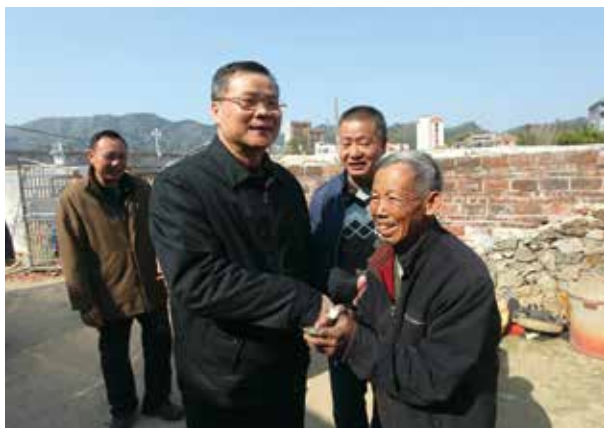
今年2月，省人大常委会副主任吕业升到新丰县梅坑村检查指导脱贫攻坚和新农村建设工作，并与贫困户亲切交谈

9月初，农委对有关情况认真综合研判，形成专题调研报告，归纳出在产业扶贫、就业扶贫、“三保障”、资金管理等方面存在的突出问题，为9月下旬常委会会议听取和审议省政府《关于我省打赢脱贫攻坚战工作情况的报告》