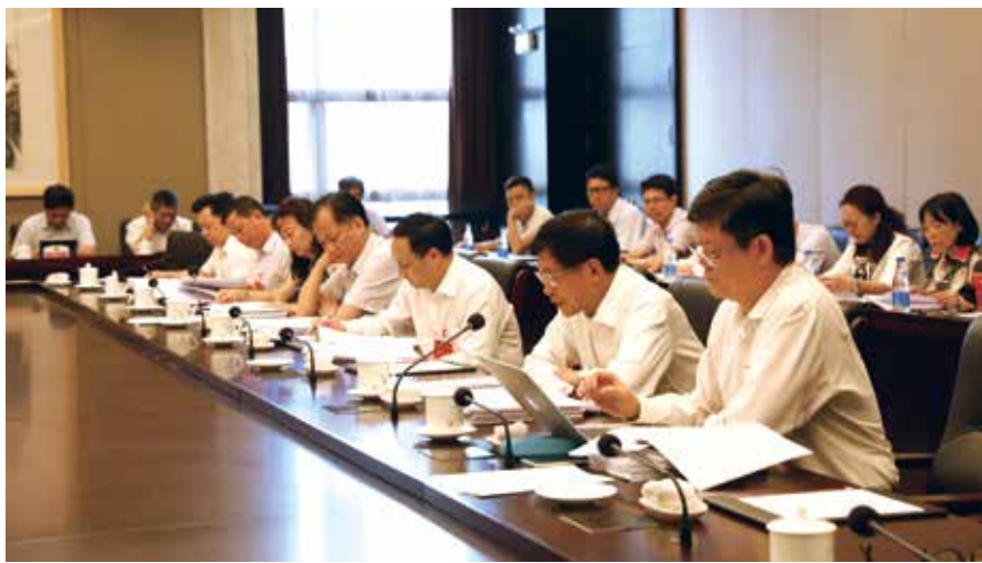
代表分组审议省政府专项工作报告

全国人大代表、省人大常委会副主任黄业斌说，对当前扶贫工作中存在的认识不到位、选项目不精准、项目管理不规范、就业扶贫不稳定不精细、教育扶贫落实不到位、应保尽保不到位、住房安全政策不接地气、资金使用不够规范甚至还存在违规违法以及作风不严不实等问题，要一个个抓好整改落实到人。同时，扶贫工作队工作很认真、很辛苦，建议省有关部门要设置相应的容错机制，为扶贫工作人员解除后顾之忧，鼓励他们做好工作。