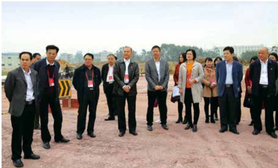
代表们视察北部湾大道三期施工现场

去年底，市人大常委会检查组到廉江市对县乡人大工作和建设情况进行专项督查时，充分肯定了廉江市人大工作：“人大机关硬件建设100分，落实‘县乡人大十条’效果好，人大代表作用发挥好。真正让乡镇人大‘活’起来了，人大代表‘动’起来了，人大监督‘硬’起来了。”