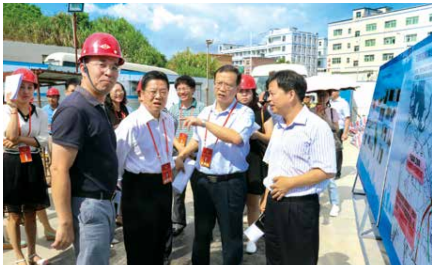
代表视察治污工程