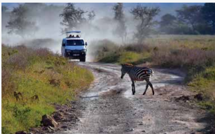
在肯尼亚野生动物保护区内驱车