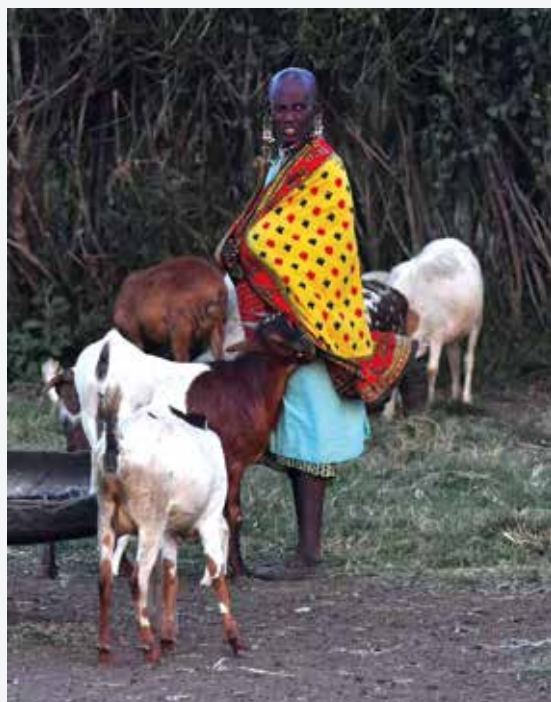
亮丽的肯尼亚妇女在喂羊