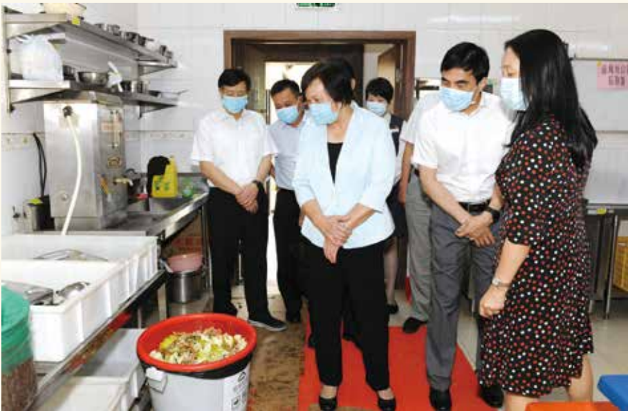
◀ 10月16日，省人大常委会副主任罗娟率调研组赴佛山市开展“珍惜粮食反对浪费”专题调研。调研组考察了佛山市机关食堂、佛山市迎宾馆餐饮部，听取佛山市政府有关工作情况汇报。罗娟指出，要贯彻落实习近平总书记关于坚决制止餐饮浪费行为的重要指示精神，采用有效管用的措施在全社会营造浪费可耻节约为荣的氛围。（任社/供稿）