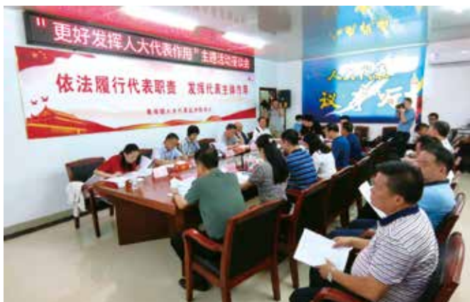
人大代表在盐州联络站就考洲洋生态保护听取意见并座谈