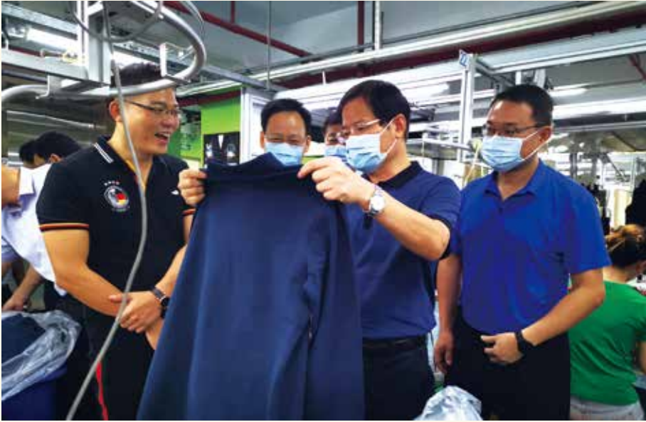
◀ 10月13日，省人大常委会副主任徐少华率调研组赴东莞市开展“珍惜粮食反对浪费”开展专题调研。调研组考察了东莞市国丰粮油有限公司、省储备粮管理总公司东莞直属库、餐厅、食堂等，听取东莞市政府有关情况汇报。徐少华指出，要坚决贯彻落实习近平总书记对制止餐饮浪费行为作出的重要指示精神，加强立法、监督工作，制止餐饮浪费行为，做好珍惜粮食工作。（任法/供稿）