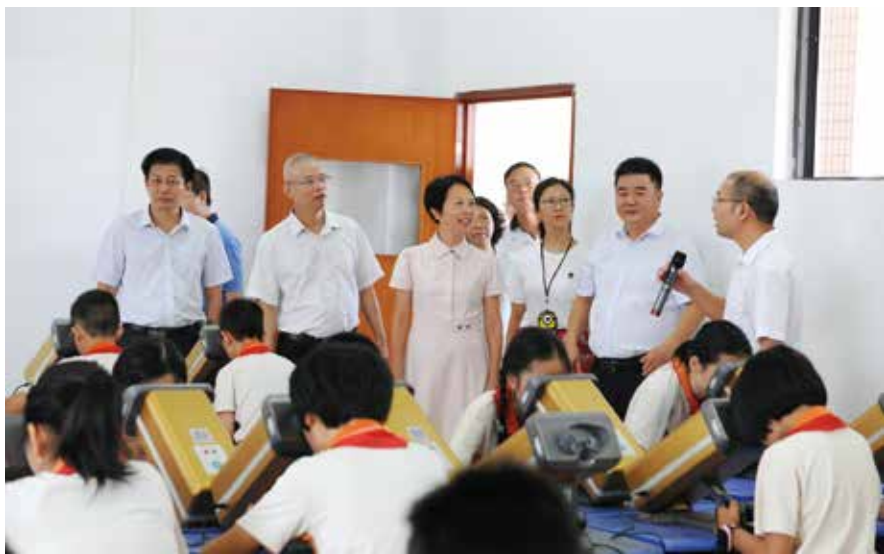
2019年9月，佛山市人大常委会组织部分市人大代表到禅城区环湖小学等地视察督办《关于建立佛山市青少年近视眼防控体系的议案》办理情况。

“部分中小微型民营企业由于规模小、经济实力弱，法律顾问也没有聘请。如果不正视上述问题，将给企业带来巨大的甚至不可挽回的损失。”市人大代表、佛山市律师协会会长钟坚为调研中