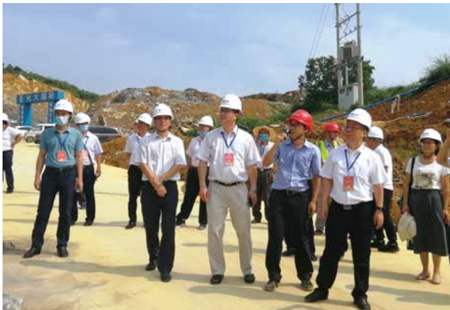
7月17日，乐昌市人大代表视察该市循环经济环保园项目建设