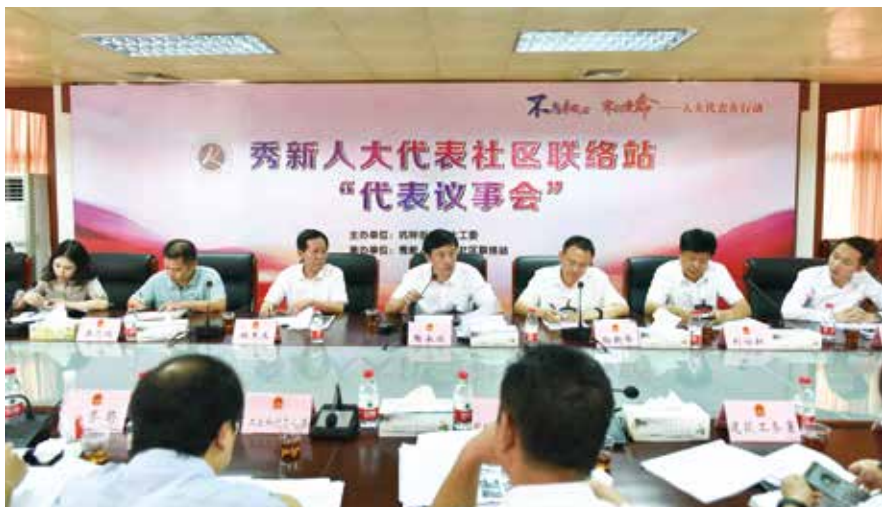
2019年7月，秀新社区联络站“代表议事会”活动现场

关的组成人员，代表人民行使国家权力，无疑是加强和创新社会治理的重要力量。基层人大代表直接来自于选民，参与社会治理是人民赋予代表的权力。代表法规定，“代表可以通过多种方式听取、反映原选区选民或者原选举单位的意见和要求。”