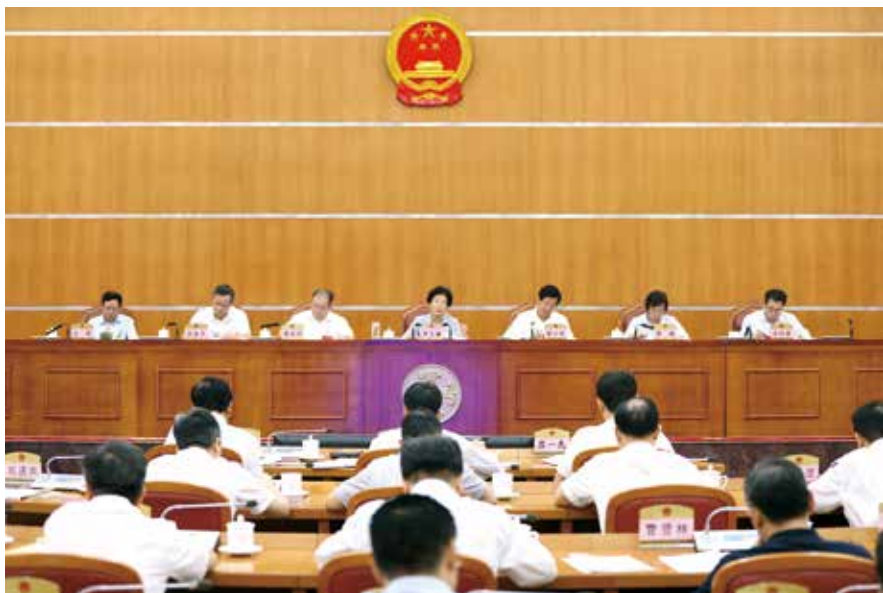
2019年7月，全省人大代表联络站工作经验交流会在广州召开

订《梅州市五级人大代表进站安排指导意见》，阳江市出台《人大代表驻站联系群众工作记录表》《关于人大代表接待群众反映意见和建议转交的函》，廉江市统一制定了《人大代表在联络站征集的群众意见建议处理制度》并实施镇人大代表中心联络站联络指导员制度，安排市人大机关干部挂点指导联络站工作。