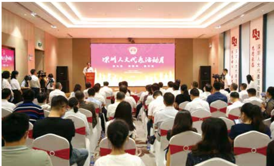
7月10日，深圳市人大常委会主任骆文智出席2020年“深圳人大代表活动月”启动仪式