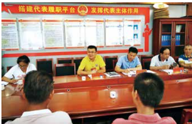
人大代表在高潭镇中心联络站接待来访选民