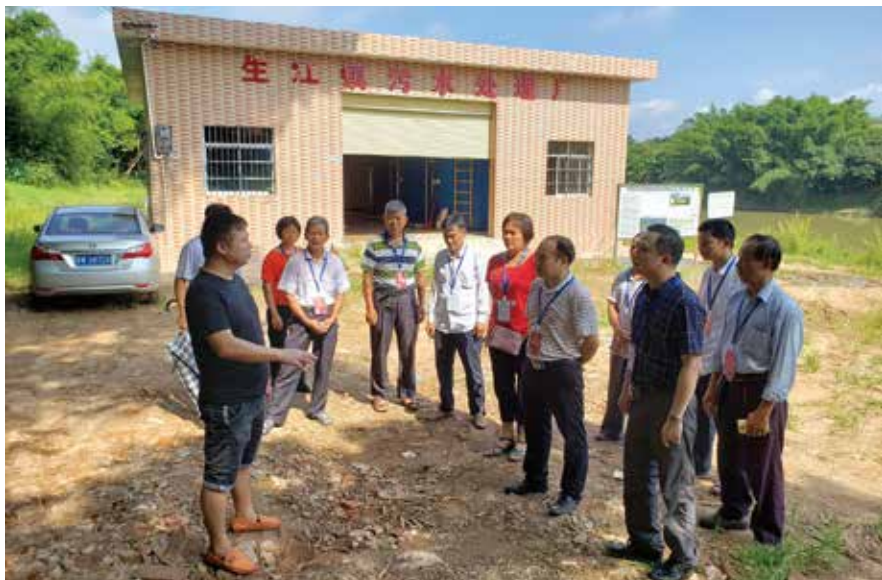
生江镇人大代表小组调研视察镇污水处理厂，跟踪监督镇污水处理情况