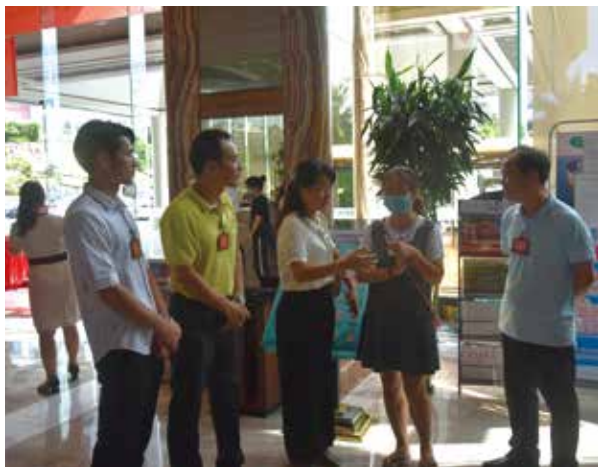
驻站代表走访三合颐和温泉大酒店游客