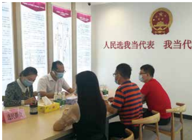
人大代表在增城区中新镇代表联络站接待群众

表进社区时间的选择，人大代表服务选民的履职意识在一个个细节中体现。为方便选民联系代表，人大代表接待选民的形式也从“线下”转至“云端”。