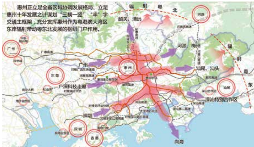
惠州市“丰”字型城市交通发展规划示意图