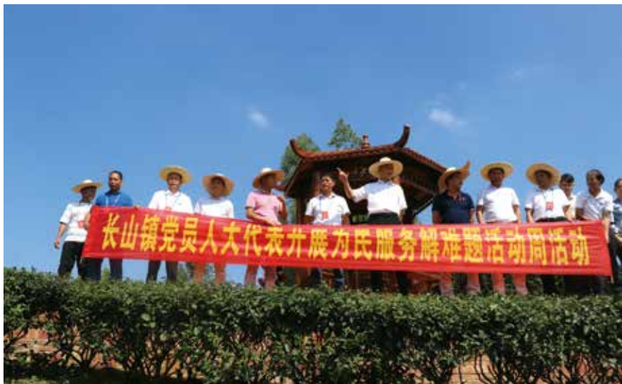
廉江市创新开展党员人大代表为民服务解难题活动

不久前，在罗州街道人大代表中心联络站，一选民反映廉江市环市东路大江边村的廉江河边没有防护栏，存在严重的安全隐患。驻站人大代表立即向市城市管理和综合执法局转达意见，城管局虚心接受代表监督，收到意见后的第