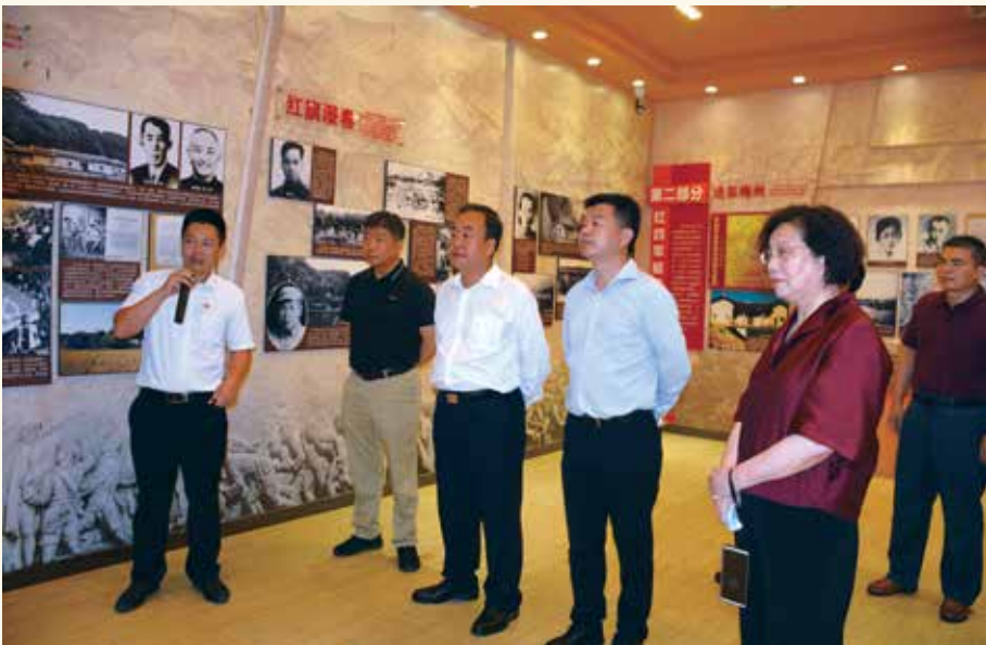
◀ 9月16日，省人大常委会副主任王学成率队到梅州市开展“关于传承红色基因，加强岭南革命遗址保护”和“关于加强儿科建设，解决儿童看病难问题”两项代表建议重点督办工作调研。王学成指出，要依法保护好传承好利用好我省的革命遗址，将革命遗址的保护利用与脱贫攻坚、乡村振兴相结合，促进革命老区振兴发展。要加大儿童预防保健力度，推动区域儿童医疗资源均衡发展。（任柯/供稿）