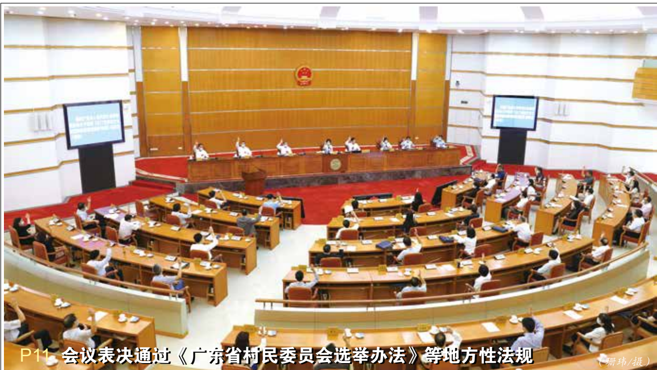
P11 会议表决通过《广东省村民委员会选举办法》等地方性法规