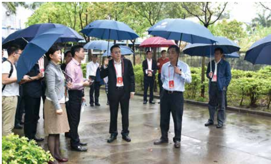
人大代表视察城市管理“百日整治”行动

新时代“枫桥经验”的动力，在于科技创新，通过大数据为“枫桥经验”赋能，在社会治理中更高效、精准地发挥作用。实践证明，大数据是“现代社会的新石油”，智慧人大建设大有可为。一是助力精准调研，（下转第64页）