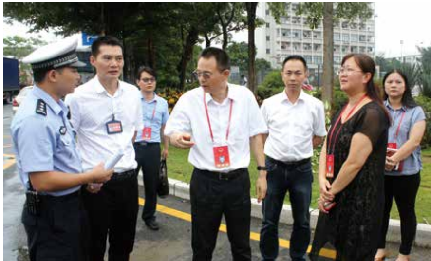
“代表议事会”会前调研活动

为进一步激发代表参与基层社会治理的主动性，更好发挥代表参与管理国家事务、监督“一府一委两院”工作的