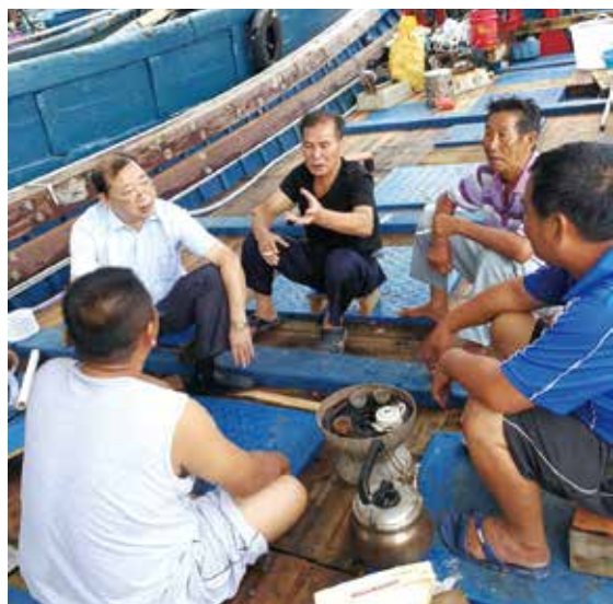
人大代表到渔民劳作渔船上了解渔民生产生活情况，向渔民宣传政策法规。