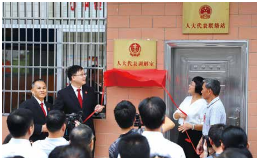
2018年12月，信宜市首个人大代表调解室在池洞镇大坡代表联络站揭牌

进一步加强代表联络站建设的各项保障。 一是推动全员化培训。注重提高代表培训的经常性和实效性，增强代表对群众的感情，提高代表接待群众、收集反映社情民意的能力，提升服务群众的成效，探索建立代表履职激励约束机制，促进代表自觉接受人民群众监督；注重加强对代表联络站站长、副站长、联络员等工作队伍的培训，切实提高组织协调保障代表联系群众活动的素质和能力，促进代表联络站工作队伍尽职尽责。二是强化力量建设。支持和鼓励各地邀请法律、经济等方面的专业人士以及政府相关职能部门的工作人员担任代表联络站的咨询员，增强代表联系群众的效果。三是继续加强经费保障。建议省财政继续对欠发达地区的乡镇给予补助，同时增加对欠发达地区的街道人大给予补助，切实保障基层人大各项工作有效开展。■