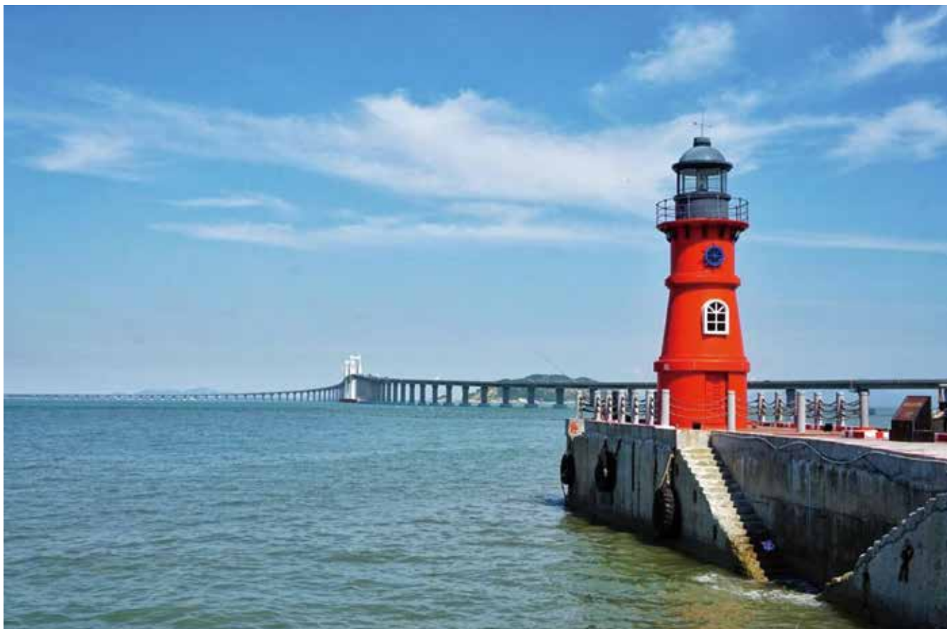
汕头南澳大桥（资料图片）