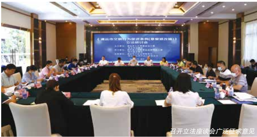
召开立法座谈会广泛征求意见

党的领导是保障。 人大在立法中的主导作用，是在党的领导和支持下的主导作用，越是坚持党的领导，就越能有