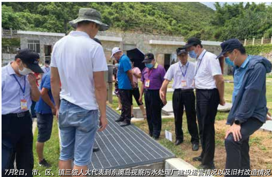
7月2日，市、区、镇三级人大代表到东澳岛视察污水处理厂建设运营情况以及旧村改造情况