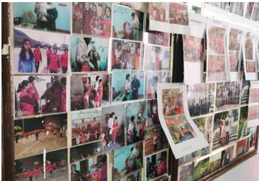
红姐家的墙面上满是她慰问留守儿童及老人的照片