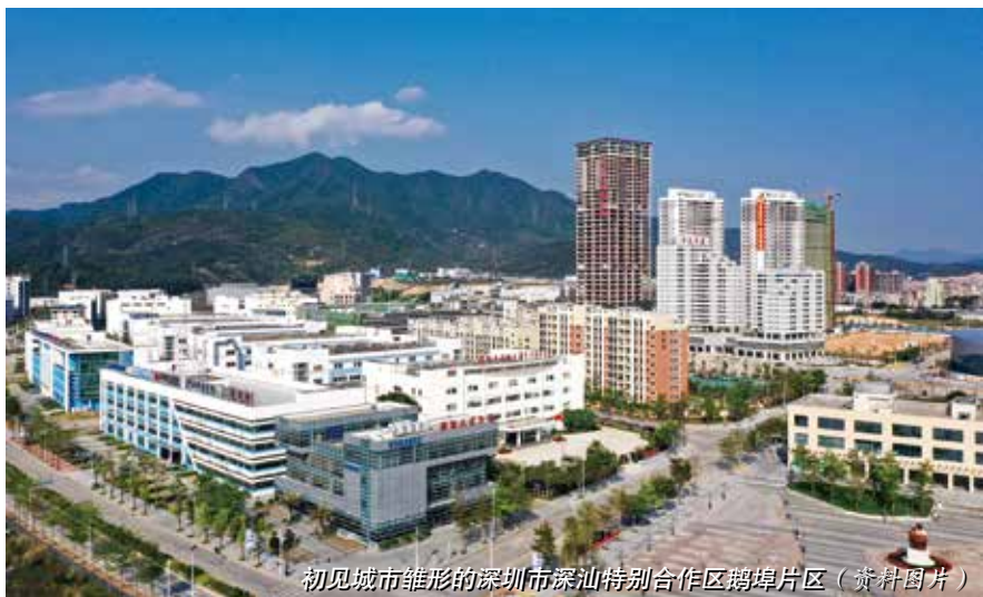
初见城市雏形的深圳市深汕特别合作区鹅埠片区（资料图片）

创新，目前仍处于试验阶段，尚未在全国普遍推广，由经济问题引发的社会、生态等一系列问题属于地方可以通过立法予以规范的，暂时不宜由中央统一立法调整。地方立法机关拥有立法权，在不触犯立法法第八条规定的法律保留事项外，可以适时立法，弥补中央立法不足，推动飞地治理法治化。