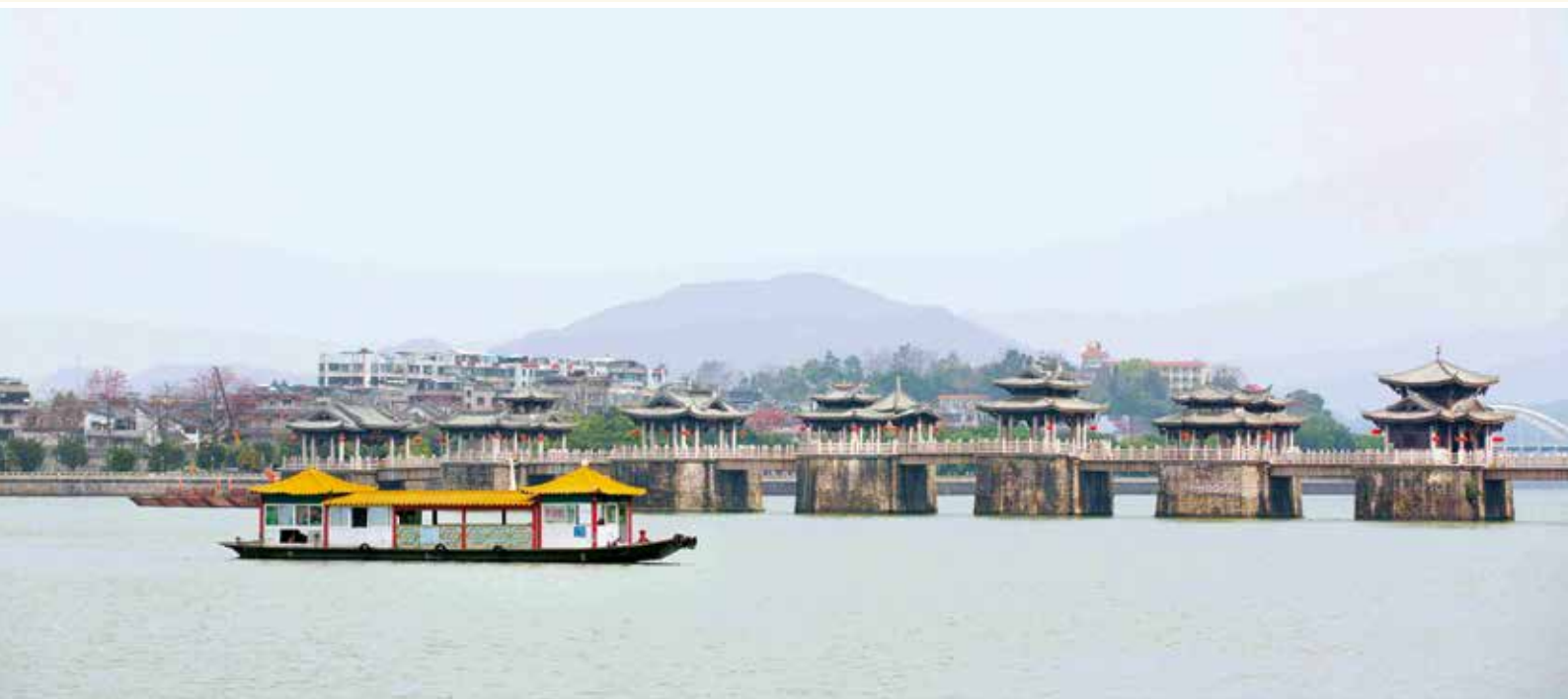
烟雨湘子桥（资料图片）