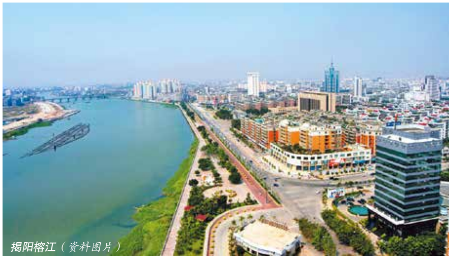
揭阳榕江 (资料图片)

为确保立出来的法有质量、能管用，在条例草案的起草、审议和修改完善过程中，市人大常委会秉持“针对问题立法、立法解决问题”的理念和方法，紧扣本市在城镇化进程中市容管理方面存在的部门职责交叉不清、长效管理措施未到位等主要问题，（下转第25页）