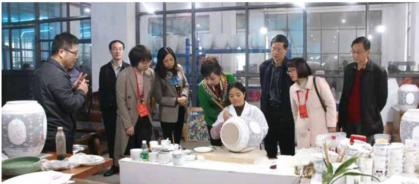
潮州市人大常委会组织在潮州的全国人大代表、省人大代表视察潮州做好“六稳”工作、落实“六保”任务情况

踊跃提出议案建议。怎样让代表的建议落地见效，是市人大常委会不断思考的一个课题。近年来，市人大常委会以提高建议落实率、群众满意率为核心深化代表建议督办工作，有力推动代表建议办理工作从“答复型”向“落实型”转变。