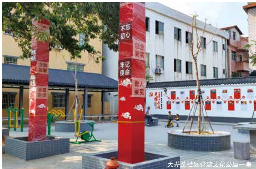
大井头社区党建文化公园一角

联络站组织代表开展接待群众活动，拉近了代表与群众的距离，让代表更好地了解群众心声，推动民生问题的解决。下来，我将更加注重密切联系群众方式多样化，突破传统驻站接待群众的时空限制，让更多群众的呼声得到更好回应，让更多的群众主动参与到社会治理中来，共同营造和谐稳定的社会氛围。■