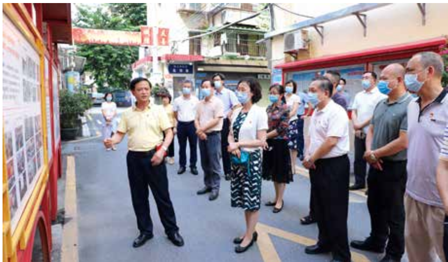
白云区人大在三元里街梓元岗社区人大代表联络站召开全区镇街人大工作现场会

三元里街是历史文化名街，有户籍人口4.6万，非户籍人口5.7万，专业市场、总部经济等商贸活动活跃，人员流动性较强，社会治理任务繁重。辖内共有市、区人大代表20名，建成代表联络站5个。为充分发挥人大代表在听民意、集民智、惠民生等方面的作用，有效监督和推动民生“微实事”落实，区人大常委会三元里街道工委积极探索解决服务群众“最后一公里”新方法，创新推行“代表进网格，‘五长’微治理”新机制。将辖区划分为20个网格，分别安排人大代表挂钩联系，拓宽人大代表履职平台，形成“联络站—网格—选民”的联络链，在“五长”（党小组长、网格长、议事长、监事长、警长）微治理工作机制中发挥人大代表主体作用，推动