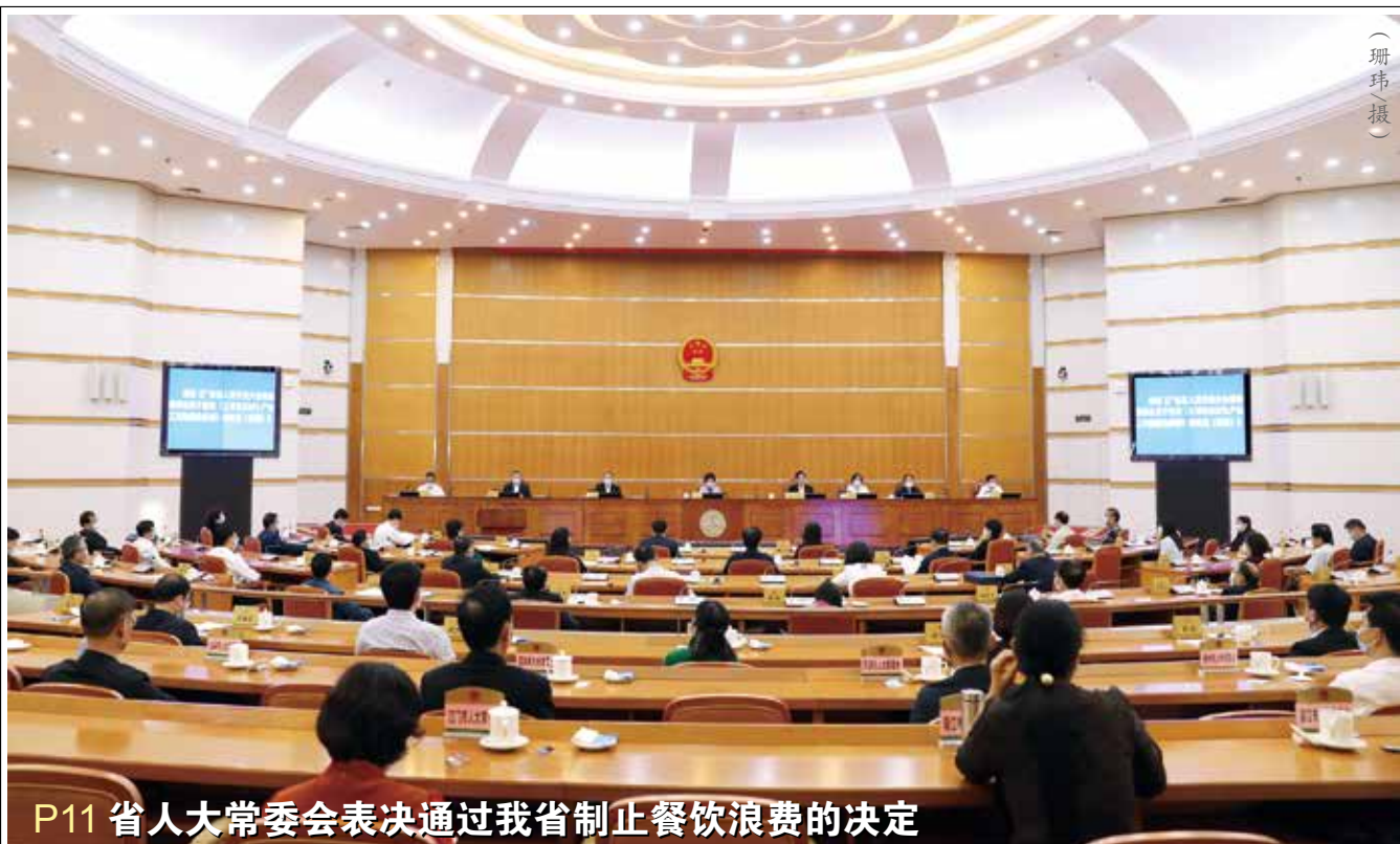
P11 省人大常委会表决通过我省制止餐饮浪费的决定