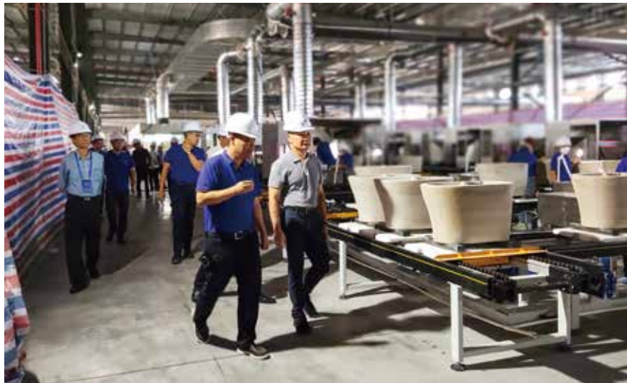
潮州市人大常委会组织代表深入基层专题调研

“正是有了市人大常委会对我们工作的跟踪监督，才推动解决了一些之前想解决但还没解决好问题，这既是一种鞭策，更是一种有力的支持！”在关于食用农产品安全监管工作进行满意度测评工作完成之后，潮州市市场监管部门一位负责人发出如是感慨。