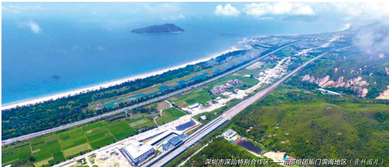
深圳市深汕特别合作区——东部组团鲘门滨海地区(资料图片)