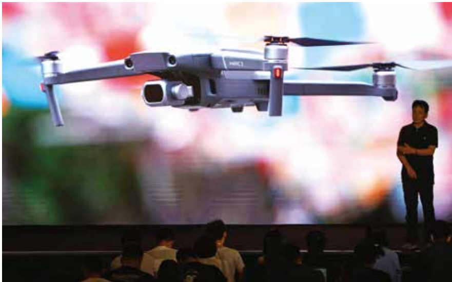
大疆无人机举行新品发布会（资料图片）

为了更好引导和支持企业等社会力量加大对基础研究和应用基础研究的投入，条例规定“支持企业及其他社会力量通过设立基金、捐赠等方式投入基础研究和应用基础研究”。同时，将“企业用于资助基础研究和应用基础研究的捐赠支出”视作能够促进社会发展进步的“公益捐赠”，创设性的规定该捐赠支出可以按照有关规定参照公益捐赠享受有关优惠待遇。