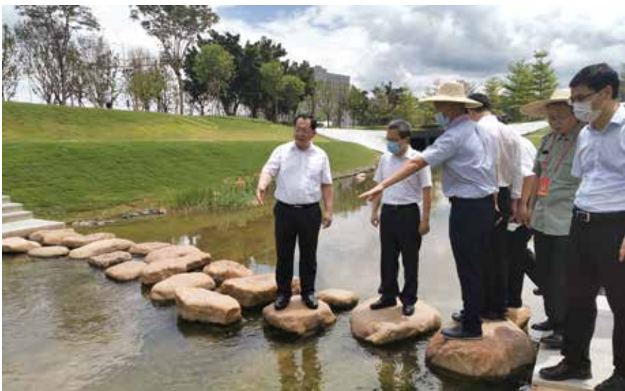
7月25日，骆文智（左一）率部分深圳市人大代表视察深圳市生态文明建设情况

“双区”建设和综合改革试点工作，及时梳理出第一批立法需求项目清单和与综合改革试点相配套的立法规划和计划，初步确立制度创新重点和需要变通国家法律、行政法规和地方性法规的条款内容。围绕促进改革发展和加快科技创新，制定或修改科技创新条例、科学技术普及条例、知识产权保护条例、个人破产条例等法规，推动经济可持续高质量发展。围绕提升城市文明建设和社会治理水平，制定或修改突发公共卫生事件应急条例、全面禁止食用野生动物条例、物业管理条例、股份合作公司章程等法规，推动城市管理和社会治理精细化。