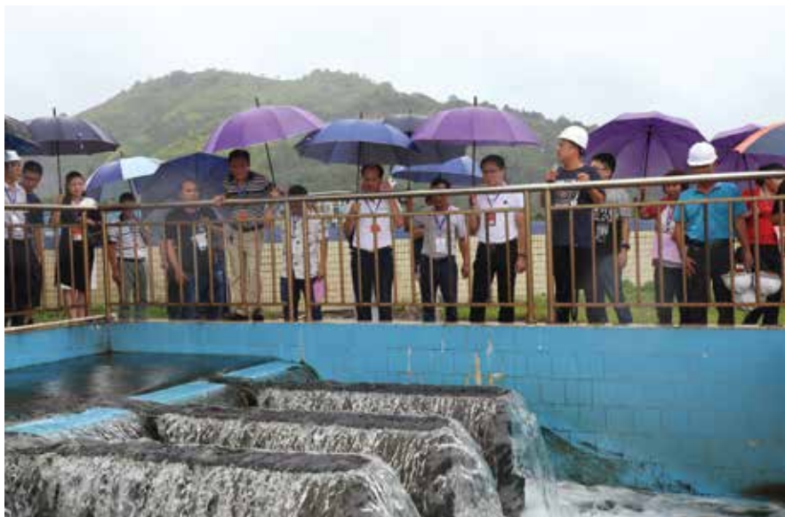
常委会组织人大代表视察污水处理设施

考洲洋地处惠州市惠东县稔平半岛，有着“海中有岛”“岛中有洋”“洋中有岛”的特殊地理环境，被当地人称之为稔平半岛之“心”。2020年6月30日，惠东市人大常委会会议审议通过《惠东县人民代表大会常务委员会关于加强考洲洋生态保护的決定》，为考洲洋生态撑起法治“保护伞”。