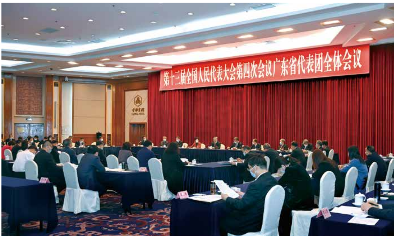
3月5日，十三届全国人大四次会议广东代表团举行全体会议，审议政府工作报告

有效应对世纪罕见的三重严重冲击，推进“双统筹”取得的重大成果，充分体现了习近平总书记、党中央驾驭复杂局面的卓越领导力，充分彰显了中国共产党领导和中国特色社会主义制度的无比优越性。报告立足“两个一百年”历史交汇点，着眼“两个大局”，贯彻中央“十四五”规划建议要求，坚持以人民为中心的发展思想，对“十四五”发展作出战略性、前瞻性、系统性的实化量化部署，科学提出今年工作的主要目标和重点任务，有效回应社会关切，非常务实、含金量高，对于稳定社会预期、推动经济行稳致远、确保“十四五”开好局起好步具有重要意义。