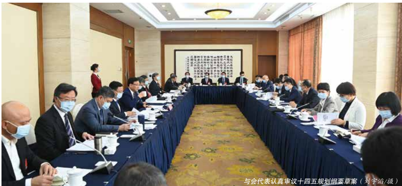
与会代表认真审议十四五规划纲要草案

高质量发展的措施，进一步促进国有经济高质量发展。进入新发展阶段，将以更昂扬的姿态，充分发挥新企业、新机制、新技术优势，努力实现更高水平发展，在确保安全环保的前提下提高经营业绩，加大技术革新力度，推动布局结构调整，将公司打造成为贯彻新发展理念示范企业的示范企业。