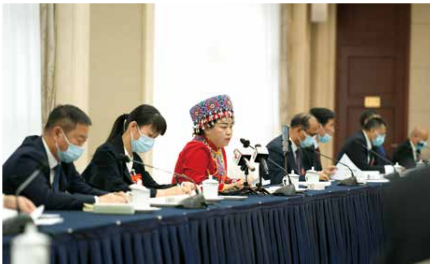
代表就乡村振兴战略积极建言献策

过渡期，保持主要帮扶政策总体稳定。规划纲要草案也提出，要走中国特色社会主义乡村振兴道路，全面实施乡村振兴战略。代表们聚焦乡村振兴，从财政、土地等政策扶持角度进行热议。