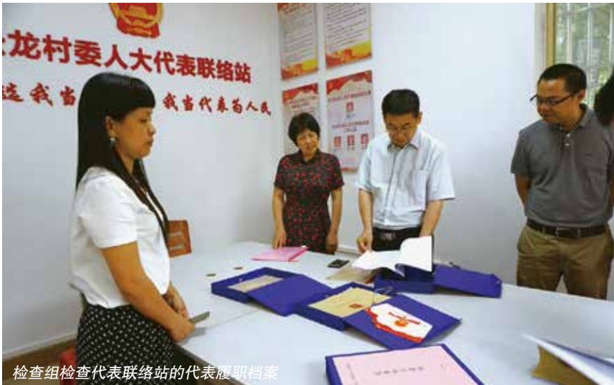
检查组检查代表联络站的代表履职档案