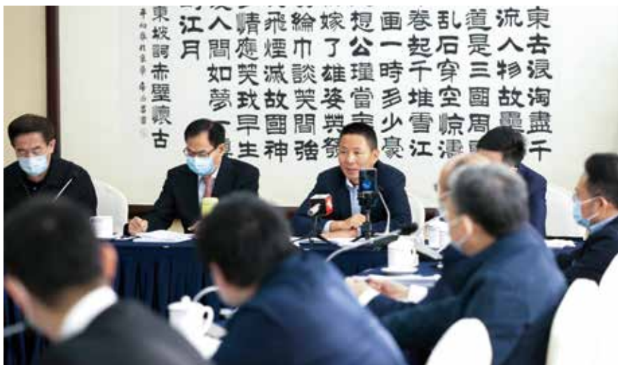
代表分组审议政府工作报告

为加强网购食品安全监管，建议：一是建立智慧监管平台。运用大数据思维，将市场监管部门食品安全监督信息系统与网络订餐平台深度连接，及时将商家违法违规行为实时推送给执法人员和网络食品订购平台，实现监管力量精准投送，织密网购食品安全的监管之网。二是建立健全市场监管部门与网络食品订购平台的约谈机制。明确平台责任，通报问题风险，研讨治理措施，整合评价体系，深化信用监管，确保消费者合法权益得到真正保护。三是加强监管与处罚力度。重罚证照造假，并建立“食品安全黑名单”，加大对网络食品安全违法违规行为曝光力度。对不符合食品安全条件的商家推行“一票否决”制度。四是对网购食品进行全链条监管，运营平台、销售体系和物流体系包括售后服务进行全方位、全链条监管，从事网络食品交易、销售，甚至宣传的各个环节提供者，都要承担相应法律责任。