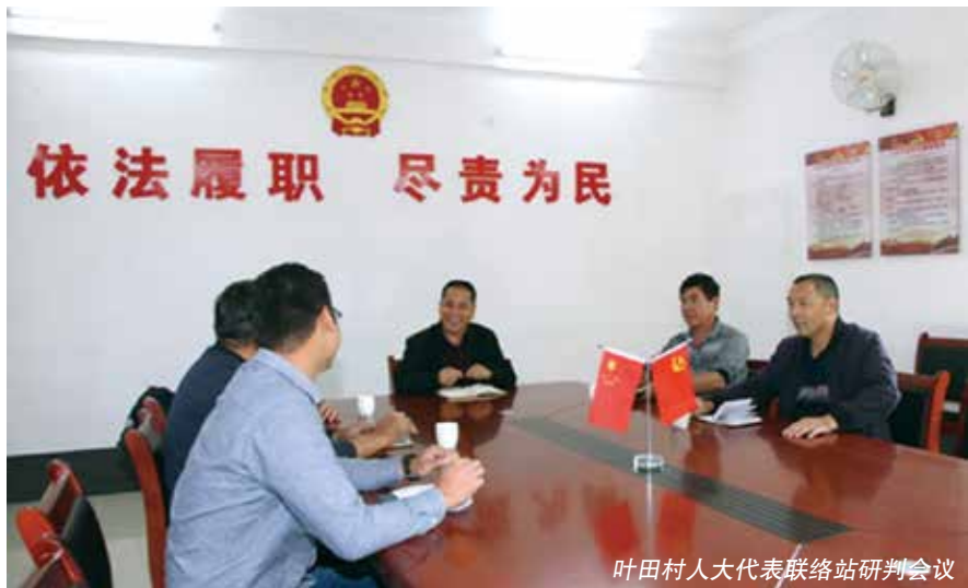
叶田村人大代表联络站研判会议

“县镇村三级人大代表联络站定期召开研判会，对选民群众意见建议的公益性、普惠性、科学性、紧迫性、可操作性作全面综合的分析研判，将群众想干的、党委期盼干的、政府能干的事项