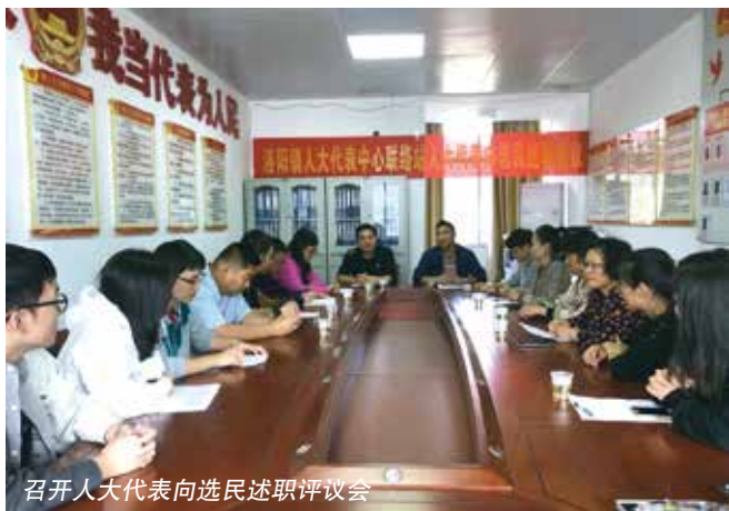
召开人大代表向选民述职评议会

近日，乳源瑶族自治县洛阳镇、村人大代表联络站组织20名代表、共80余名选民代表召开人大代表述职评议会。从汇报发言、答疑解惑，到现场视察、把脉问诊，洛阳镇人大通过代表述职、民主评议、实地调研“三招”延伸述职评议工作内涵、“激活”镇村代表联络站。