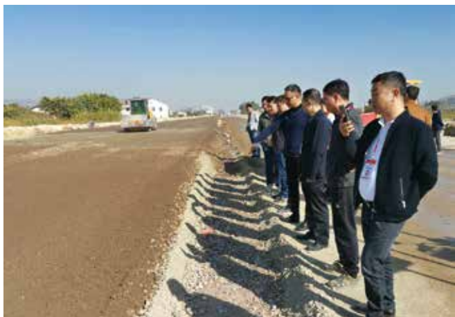
2019年12月，监督小组实地督查省道S335樟公线至高铁潮汕站连接道路新建工程建设情况。