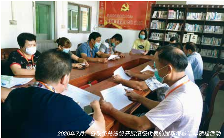
2020年7月，各联络站纷纷开展镇级代表的履职考核半年预检活动

镇人大办公室负责制定《都斛镇人大代表履职考核分项评分表》，并公正客观地把代表参加会议、活动、提出建议等情况记录进评分表，按照代表履职积分标准实时计算统计，如实“记账”。年中，以小组为单位开展履职考核半年预检活动，公布上半年积分结果，代表