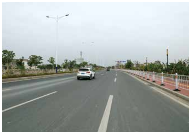
完工后的省道S335樟公线至高铁潮汕站连接道路为双向6车道的通衢大道。