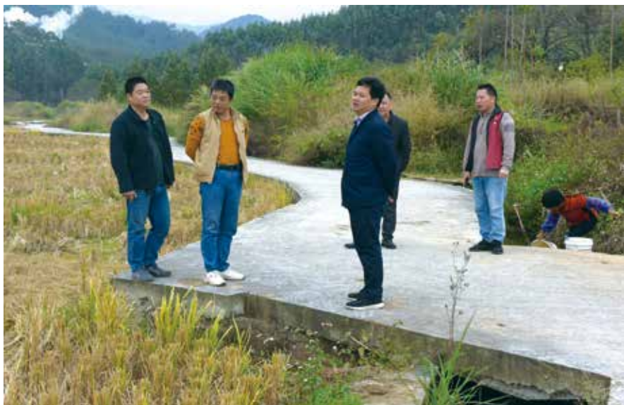
拓宽改造后平整宽敞的机耕路