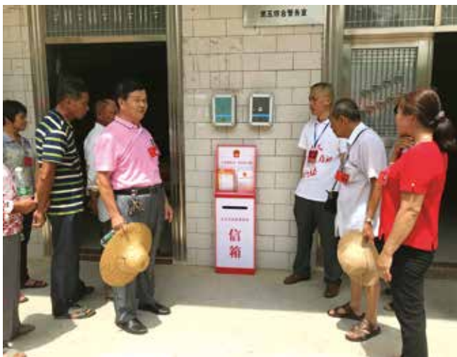
镇人大设立人大代表联系群众信箱收集人民群众的意见建议