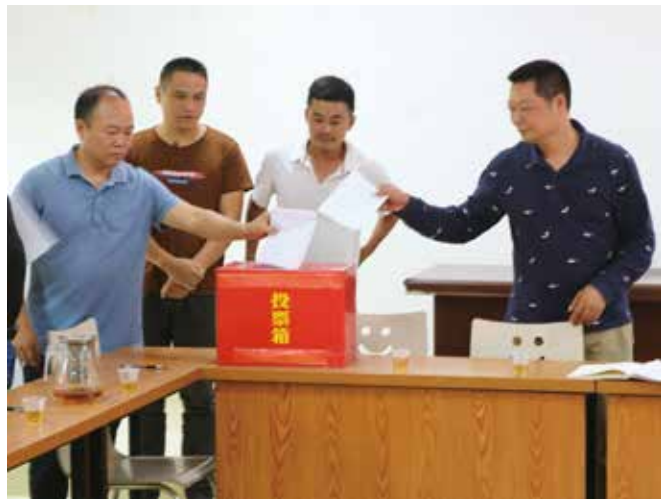
选民代表投票现场