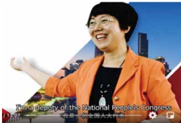
安然接受英语现场连线直播采访画面

虽然会议日程安排得特别紧凑，但忙碌中也不乏一些温馨时刻。当选全国人大代表后，除了去年情况特殊，每年三八节，都在会议期间度过。今年的三八节，我获邀参加了几个女同胞的旗袍