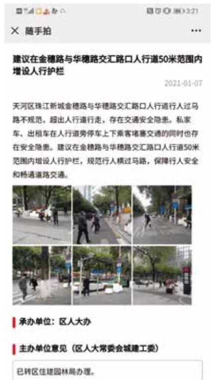
“天河人大”APP的“随手拍”为代表履职提供更方便方式