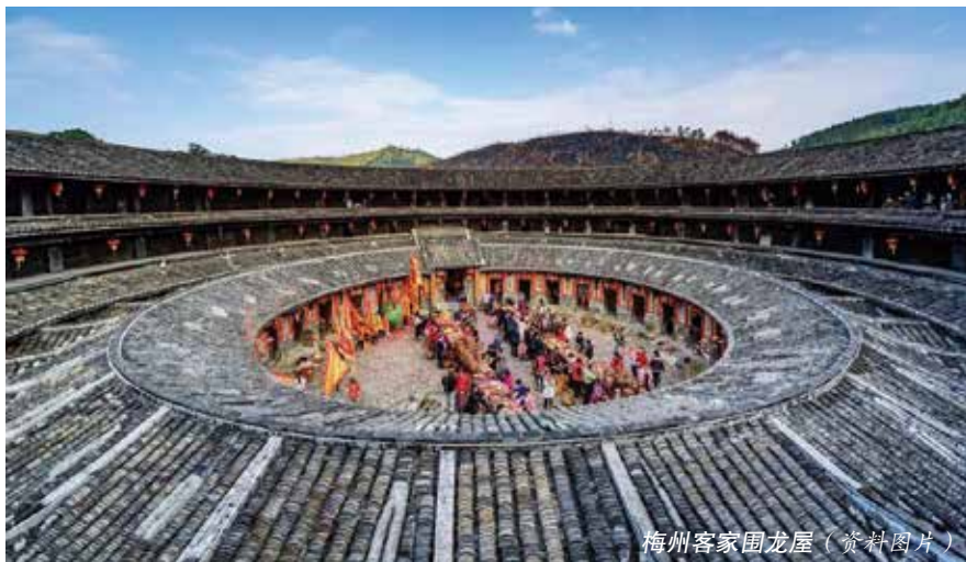
梅州客家围龙屋（资料图片）