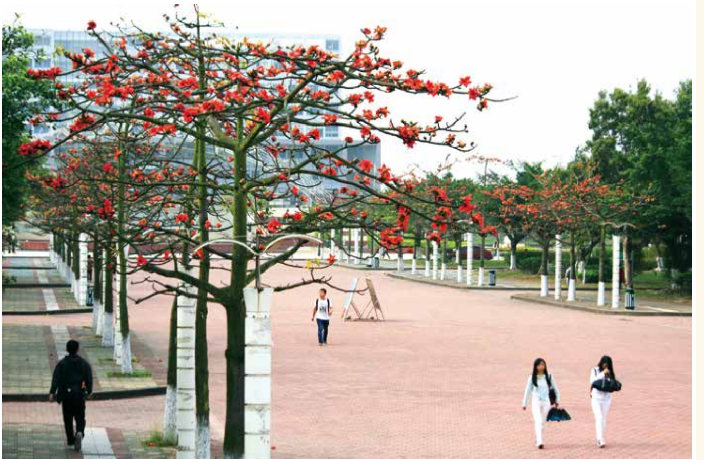
红棉花开（资料图片）