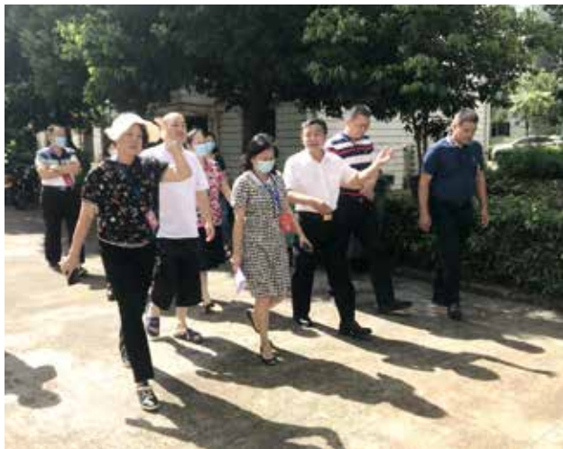
三灶中心联络站开展“局长走进中心联络站”活动

将代表意见建议办理抓好抓实，使代表联系群众走深走实，联络站承担了关键环节，尤其是针对代表意见的转办服务上，联络站的设置起到了中枢纽的重要作用。