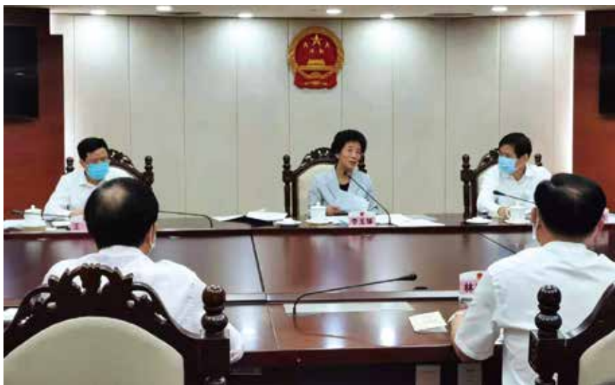
2020年8月4日，省人大常委会听取江门市关于全国人大常委会法工委基层立法联系点（江海区）建设情况的汇报。

指导修改法规中部门名称和职能，及时反映机构改革要求；指导将社会主义核心价值观体现在文明行为促进、社会工作服务、市容环境卫生、红色资源保护等法规中；指导制定禁止滥食野生动物、反餐饮浪费、垃圾分类管理等法规，依法引领文明生活新风尚；指导加强重点领域、新兴领域立法，制定优化营商环境、科技创新、数字经济促进等法规。