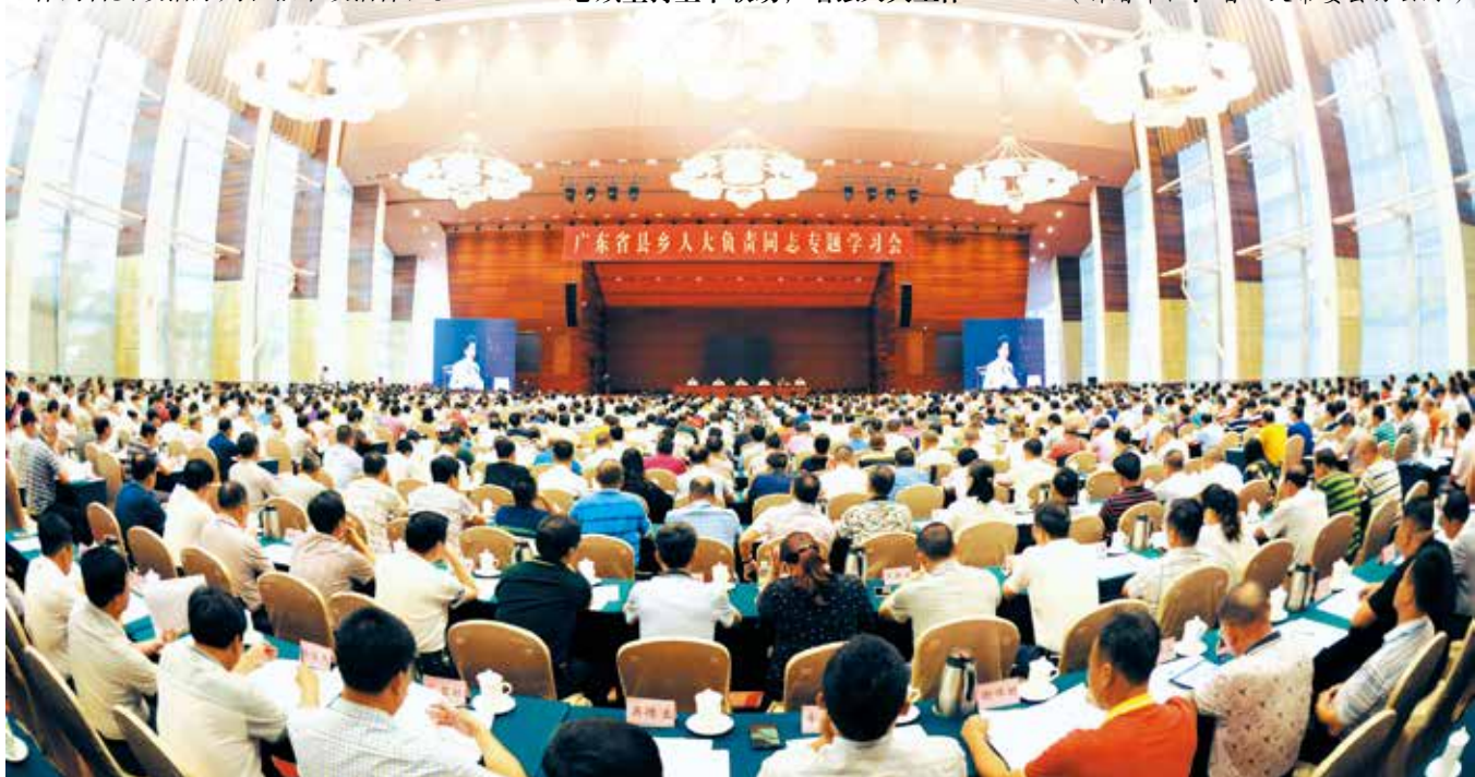
2017年9月，省人大常委会在广州白云国际会议中心举办第二期“广东省县乡人大负责同志专题学习会”开班