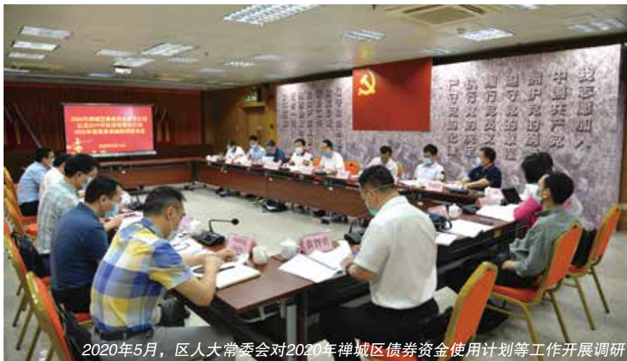
2020年5月，区人大常委会对2020年禅城区债券资金使用计划等工作开展调研

对此，常委会督促区财政部门召开全区推进财政支出工作会议，并与预算单位签订《预算支出责任书》，明确各