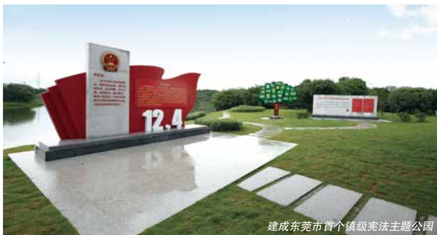
建成东莞市首个镇级宪法主题公园