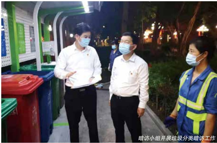
暗访小组开展垃圾分类暗访工作

诸如以上暗访监督垃圾分类的代表活动从2020年6月开始就在天河区如火如荼地开展。区人大常委会向全区人大代表发出《关于进一步推进垃圾分类工作的倡议》，广泛动员全区四级人大代表深入暗访。“我们积极探索构建代表全覆盖常态化暗访机制，通过这种持续暗访，代表们能够从中发现问题，便于更