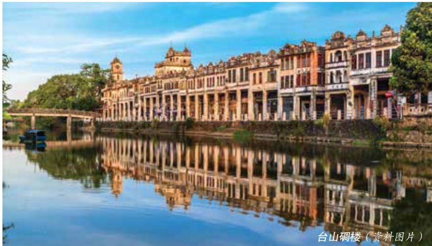
台山碉楼(资料图片)

(一) 开展靠前监督,确保项目可实施、合民意。 一是广纳民意,明确选立标准。江门市人大常委会《关于开展政府民生实事项目人大代表票决制工作的决定》中明确规定,纳入代表票决制工作的民生实事项目,主要是以本级政府财政性资金投入为主,在本行政区域内实施的具有普惠性、公益性、紧迫性和社会效益较为突出的重大民生类公共事业项目,原则上当年应办结。然而,