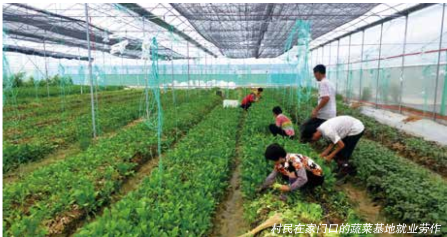
村民在家门口的蔬菜基地就业劳作

“以前我们村种菜，品种少，成长慢，菜贩子收购价钱也低，有时遇到时节不好，很难卖出去。”太平村一位菜农说，“现在，有公司包收购，让我们尽管放心种，而且价钱也高，我们收入