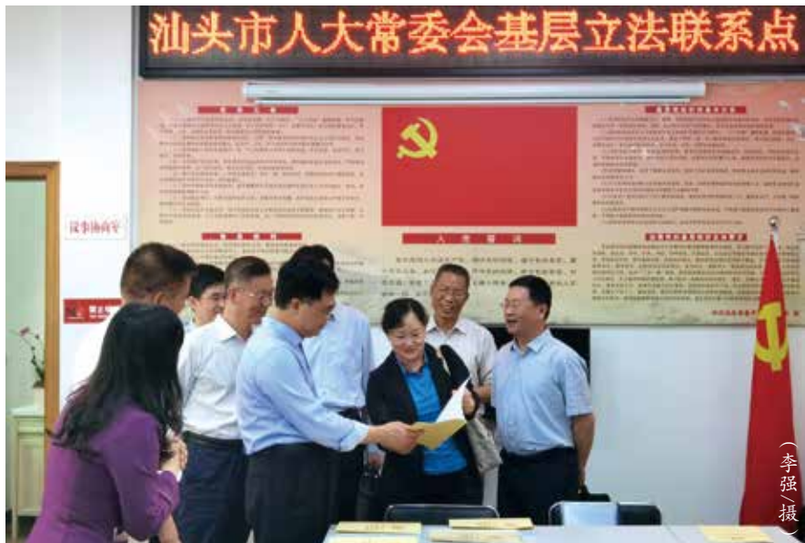
4月23日，市人大常委会法工委到汕头市金平区石炮台街道新华社区基层立法联系点调研

一是积极推进立法工作力量配齐配强。为使这17个市接得住、用得好立法权，2015年市人大常委会充分利用对立法能力等因素进行评估的“杠杆”作用，推动这些市人大设立了负责法规统一审议的法制委员会，市人大常委会设立了法制工作委员会，配备8-10名立法工作人员。2018年以来，市人大常委会法工委以参与法治广东建设考评为抓手，