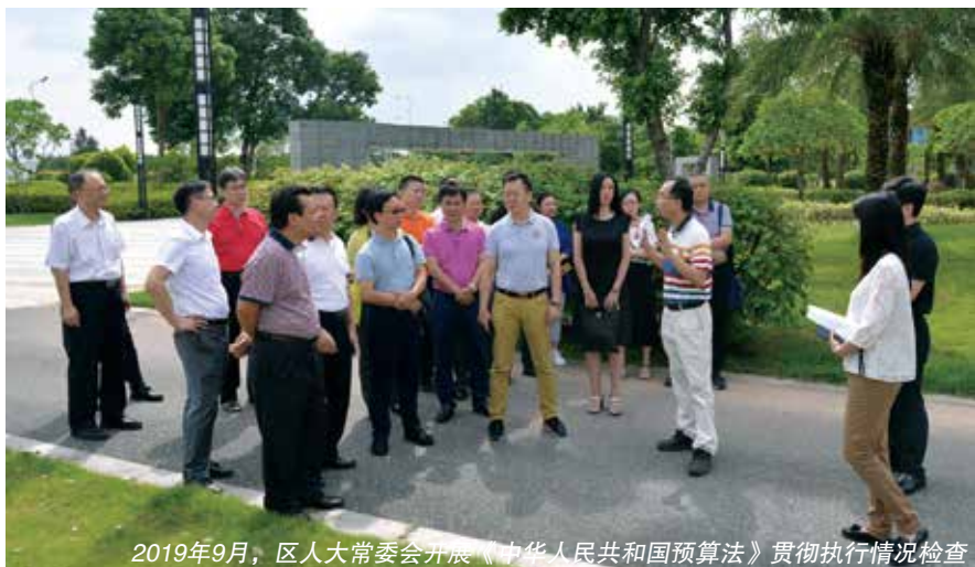
2019年9月，市人大常委会开展《中华人民共和国预算法》贯彻执行情况检查

责人表示，“现在，不但财政支付效率的满意度提升了，很多政府部门规矩用钱的自觉性提高了，不敢像过去那样随意‘抢钱’了。拿了这个钱，一定要有严密的工作计划相配套，并自觉接受人大监督。”