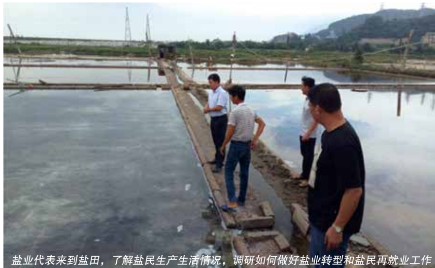
盐业代表来到盐田，了解盐民生产生活情况，调研如何做好盐业转型和盐民再就业工作

“我为盐民兄弟代‘言’”是写在盐业（宫前）代表联络站外墙上驻站人大代表对选民群众的承诺，也是人大代