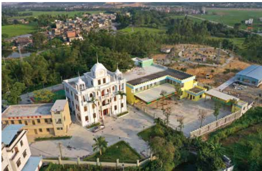
横江综合性文化中心、绍贤幼儿园及“四小园”俯瞰

作为一名基层人大代表，我从人民群众中来，了解基层群众的需求，也非常愿意服务于人民。每当看到他们因为问题得到解决后洋溢在脸上的笑容，身为人大代表的我感到十分自豪。日后，我还要继续鼓足干劲，全心全意为人民群众的操心事、烦心事、揪心事“鼓与呼”。■