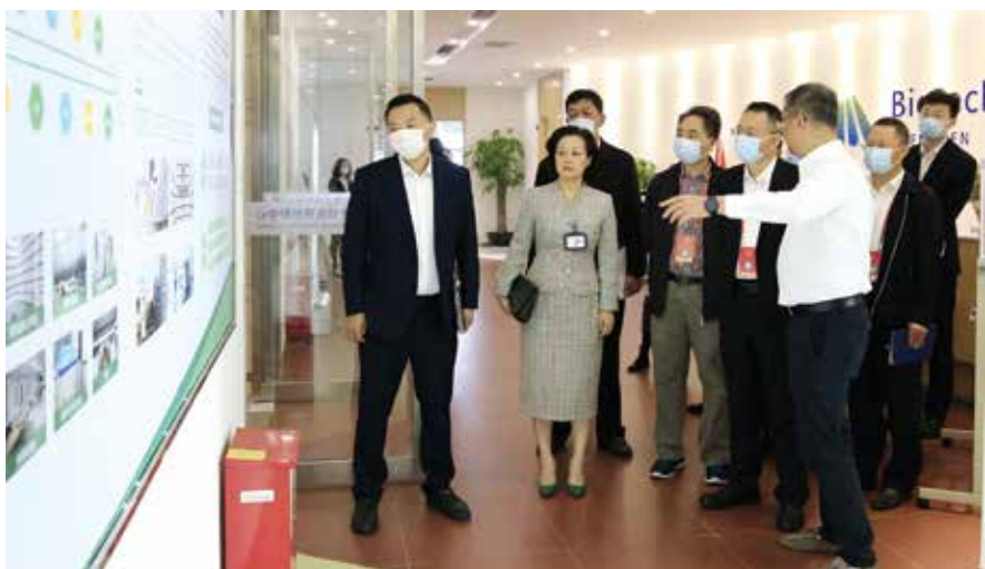
常委会组织部分代表视察2020年重点督办建议办理落实情况

表小组活动等形式，了解人民群众的意见和诉求，并通过代表建议为地方发展献计献策，推动解决民生问题，因此，代表履职好不好，很大程度上体现在建议办理的实效上，而代表满意不满意往往是衡量建议办理实效的一个重要指标。