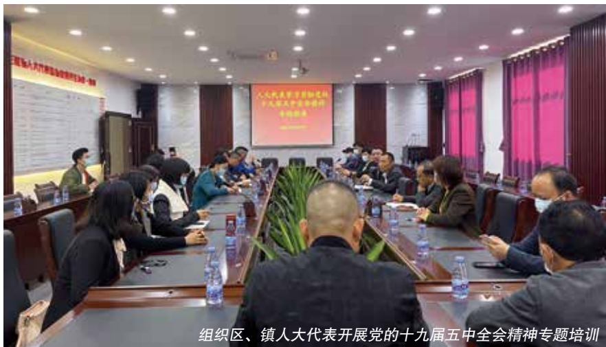
组织区、镇人大代表开展党的十九届五中全会精神专题培训

2019年10月，珠海市金湾区人大代表三灶、红旗中心联络站正式揭牌运作。依托中心联络站，人大代表们有了“动起来”的平台，激发了“活起来”的积极性，“局长走进中心联络站”等特色品牌活动的打造，也促进了政府部门以更积极主动的姿态回应社会关切，在与群众的直接面对面交流中，解决民生问题，让人大代表的监督变得愈发“实起来”。通过高标准制度建设、高质量服务、高频次运作，使联络站功能不断延伸拓展，为民服务工作走深走实，充分发挥了人大代表联络站应有的作用。