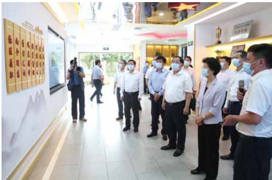
2020年7月，李玉妹主任到深圳市宝安区新安街道调研人大代表社区联络站建设情况

确定后，省人大常委会办公厅及时印发通知，并在广东人大网、广东人大公众号等平台公布创新案例的名称、主要做法和入选理由等。二是强化跟踪指导。对创新案例的实施加强工作指导，推动进一步完善工作机制，增强工作实效，相关工作经验通过办公厅主办的《人民之声》《县乡人大工作动态》等予以重点关注和推广。三是加强宣传推介。积极向全国人大常委会办公厅的有关刊物推介创新案例，广州天河、深圳福田和南山、惠州惠东、肇庆高要等县级人大的经验做法陆续被《联络动态》刊发推广。同时，组织省内主要媒体加强宣传报道，推动在全省形成示范带动效应。