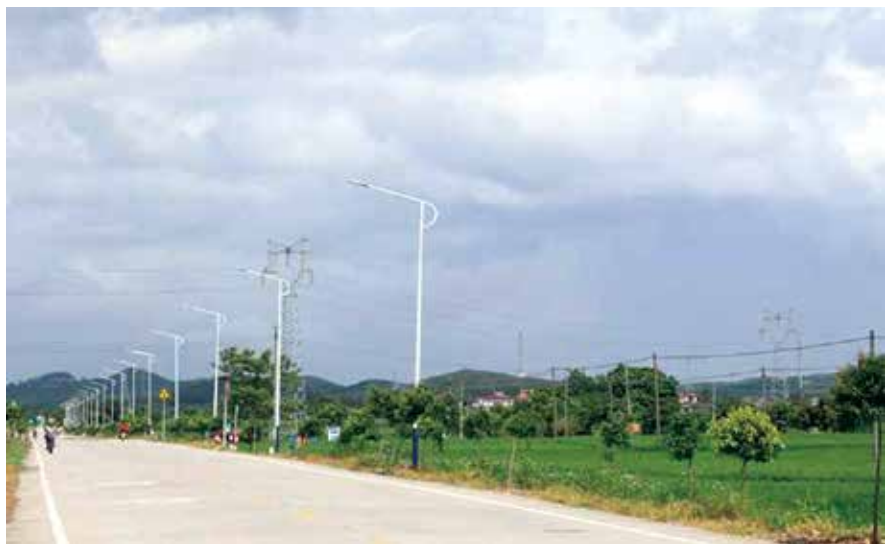
冲恩线新安装的路灯