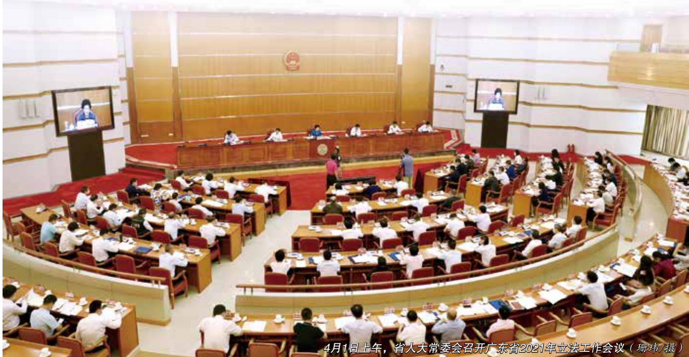
4月1日上午，省人大常委会召开广东省2021年立法工作会议

4月1日上午，省人大常委会召开广东省2021年立法工作会议，对做好今年立法工作作出部署，提出要求。省人大常委会主任李玉妹主持会议并作讲话，强调要深入学习领会习近平法治思想，不断完善立法工作格局，坚持建设德才兼备的高素质立法工作人才队伍，推动地方立法工作取得新成效。省委常委、常务副省长林克庆，省人大常委会副主任王衍诗出席会议并讲话。