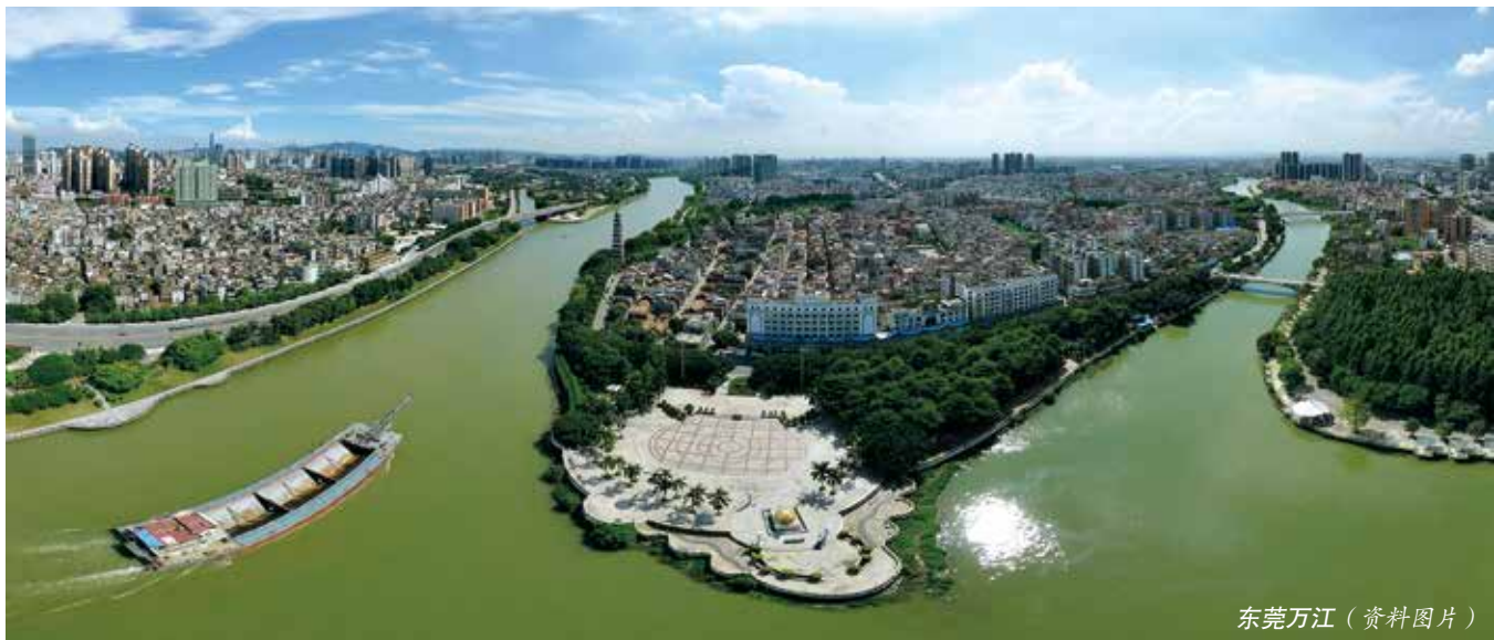
东莞万江（资料图片）