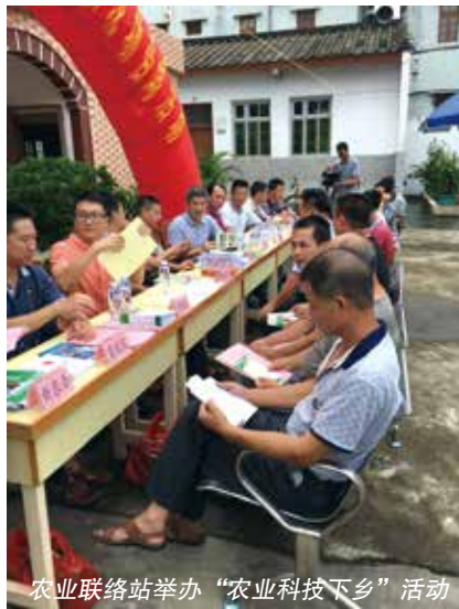
农业联络站举办“农业科技下乡”活动

“后宅镇人大要因地制宜、科学规划，针对镇产业分布特点有针对性地建设行业联络站，使高标准建成的代表联络站发挥其应有的作用。”经过深入的调研和认真研究，市人大常委会主任陈映山给出了常委会的指导意见。