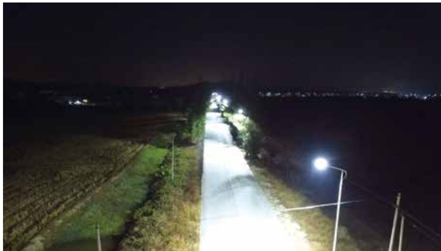
改造后的冲端线夜间灯火通明