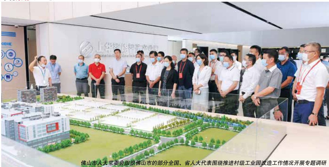
佛山市人大常委会组织佛山市的部分全国、省人大代表围绕推进村级工业园改造工作情况开展专题调研