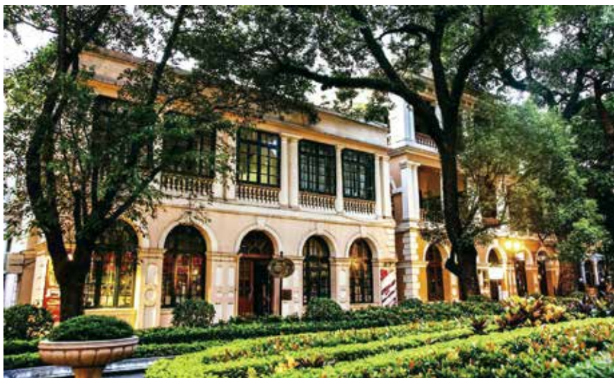
广州沙面（资料图片）

交往，可以增进中国与其他国家和地区民众之间的理解和友谊，巩固和夯实国家间关系的社会和民意基础，为国家间关系的持续良性发展增添新的动力。