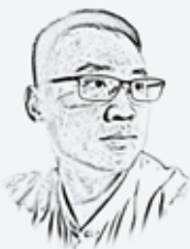
戚戚语 戚耀斌专栏