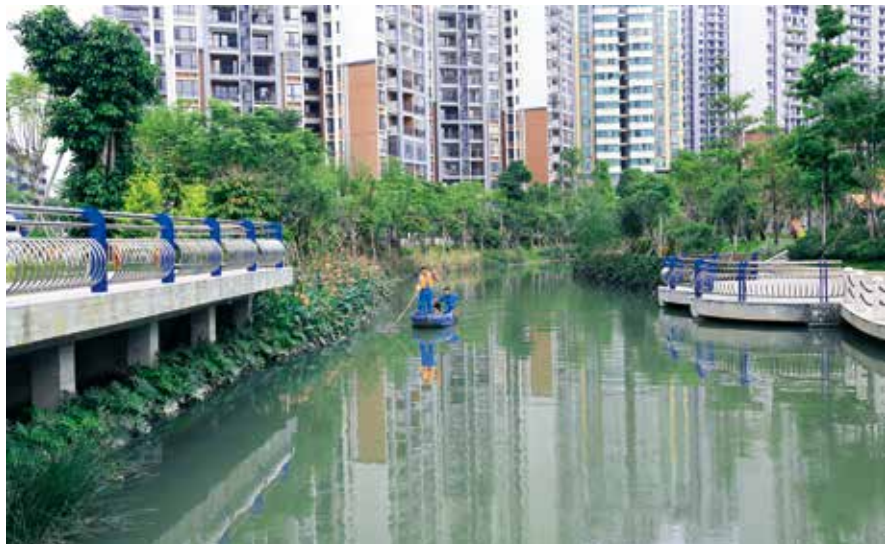
佛山市禅城区丰收涌如今不仅水清没异味，沿岸更是芳草萋萋、绿树成荫