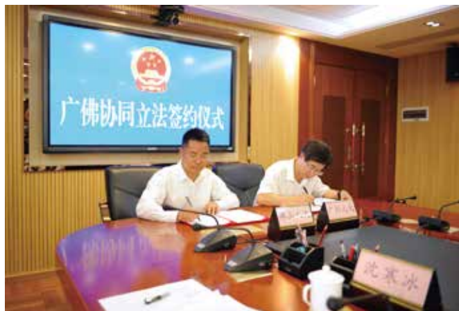
广佛协同立法签约仪式在佛山举行

庞大，涉犬纠纷频发。面对这道社会治理难题，经过两年立法探索，《佛山市养犬管理条例》于2020年获通过，理顺政府部门及相关单位职责，创设养犬备案制度，制定养犬人行为规范，建设犬只留检场所、规范犬只经营活动，让养狗不能再“任性”。