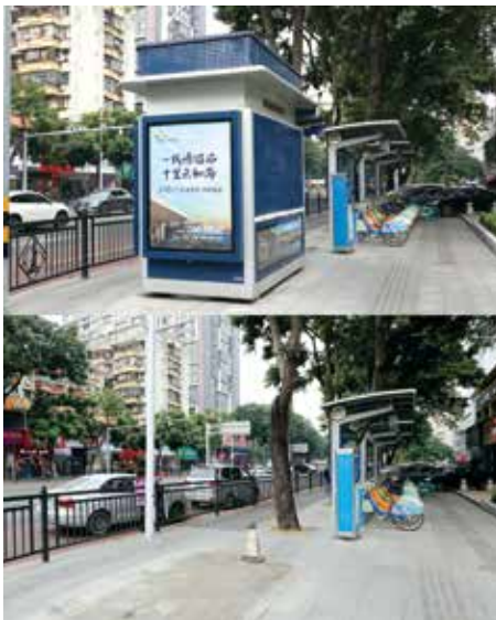
“变味”书报亭吊走前后对比