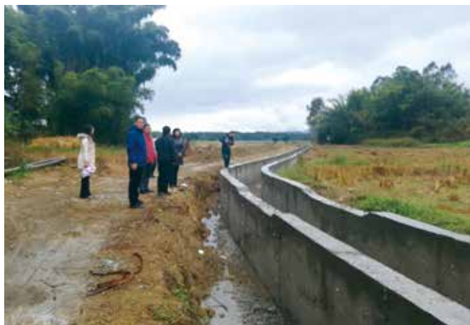
翁源县开展“更好发挥人大代表作用”主题活动，人大代表视察代表建议办理情况

期向人大代表寄送《人民之声》《韶关人大》《县人民代表大会汇编》等人大刊物，使镇级人大和人大代表及时了解人大工作、重大活动和全县政治、经济、文化、社会中的大事。组织代表集中培训，邀请专家讲授如何撰写高质量的代表议案建议。在每年人代会召开前夕，组织部分人大代表开展会前调研、视察，为代表在大会期间提出“精准”议案建议“预热”。如，2019年、2020年连续两年，围绕翁源争当广东北部生态发展区高质量发展示范县和乡村振兴发展大局，县人大代表相继提出了《关于全面实施桉树人工林退出和改造的议案》《关于建立完善共建共治共享机制巩固提升全县农村环境卫生保洁水平的议案》，这两个议案分别得到了两次大会主席团的高度重视，审议通过列入了大会议程，并作出了相应决议。目前两项议案都得到了高质量的推进办理，为翁源生态环境持续改善和乡村振兴起到了很好的推动作用。