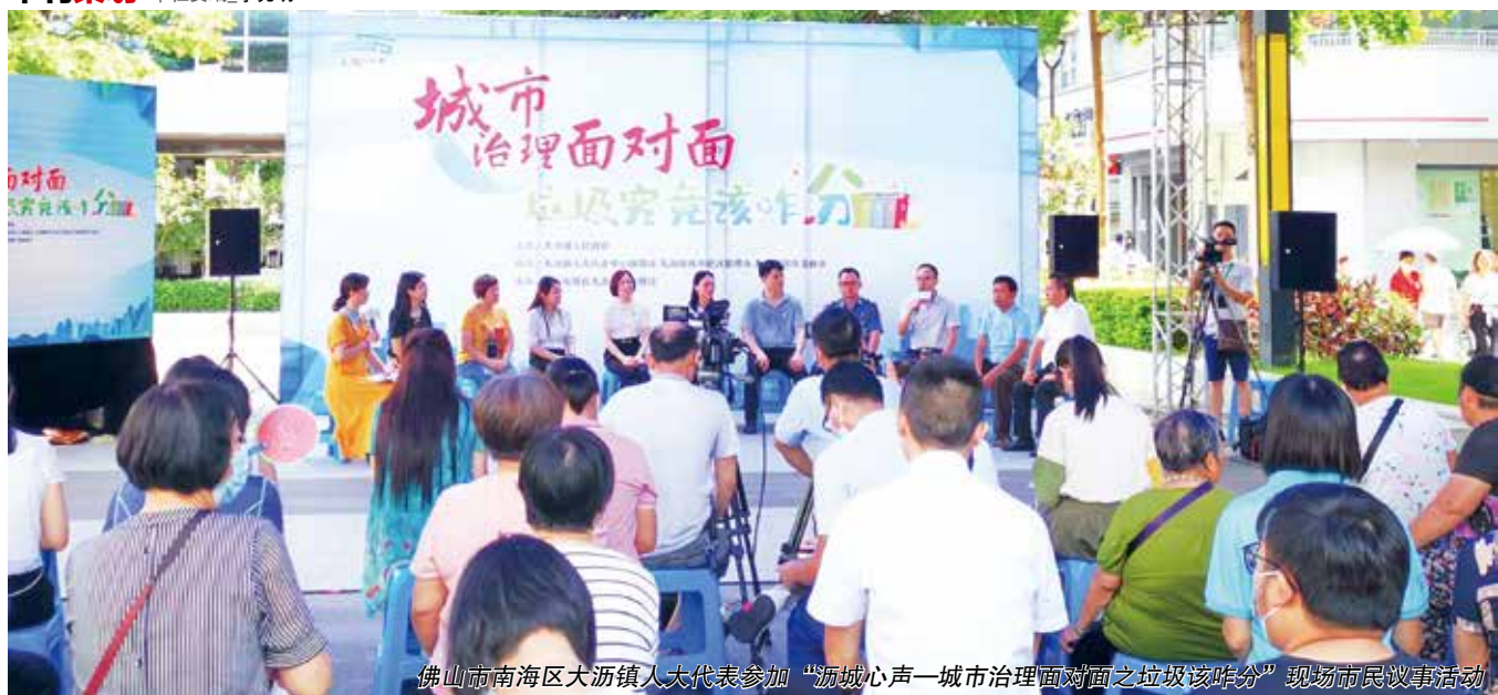
佛山市南海区大沥镇人大代表参加“沥城心声—城市治理面对面之垃圾该咋分”现场市民议事活动