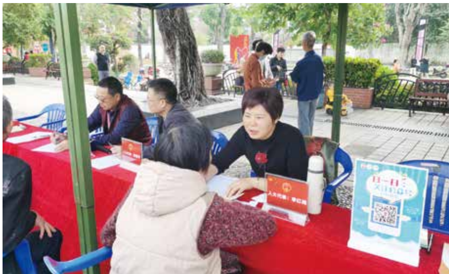
人大代表在佛山市顺德区容桂街道花溪公园接待人民群众