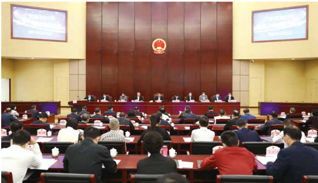
今年2月22日，广州市人大常委会召开广州市2021年立法、监督工作会议，研究部署全年立法、监督工作