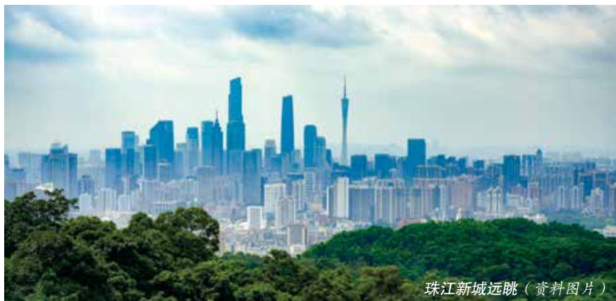
珠江新城远眺（资料图片）