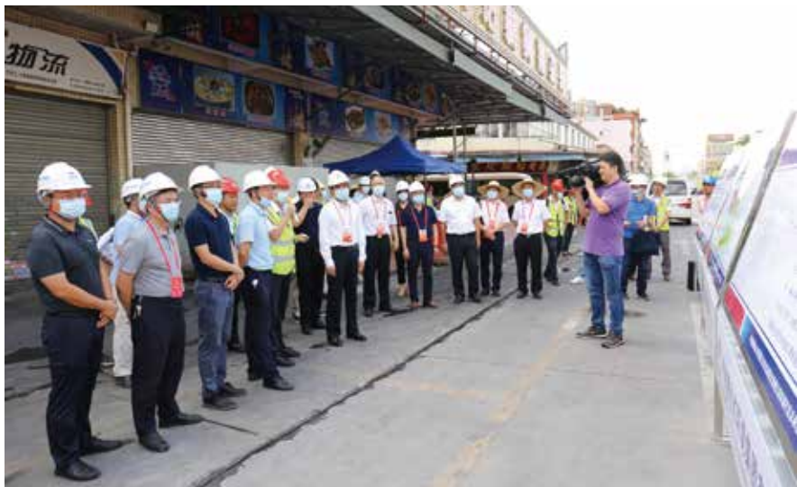
佛山市人大常委会开展黑臭水体整治情况调研视察

大常委会组成人员用好联系代表“小技巧”，通过走访、电话、信函、视频、微信、电子邮件、代表在线平台等多种途径，行稳民意“直通车”，共同推动解决人民群众普遍关心的热点难点问题。