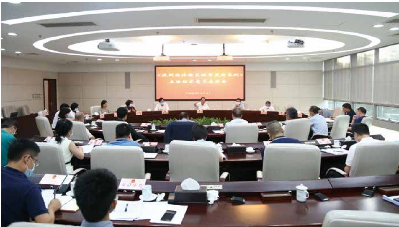
2020年6月17日，深圳市人大常委会召开《深圳经济特区城市更新条例》立法征求意见座谈会