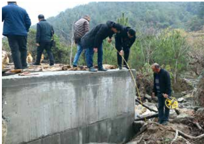
代表参与监督验收现场