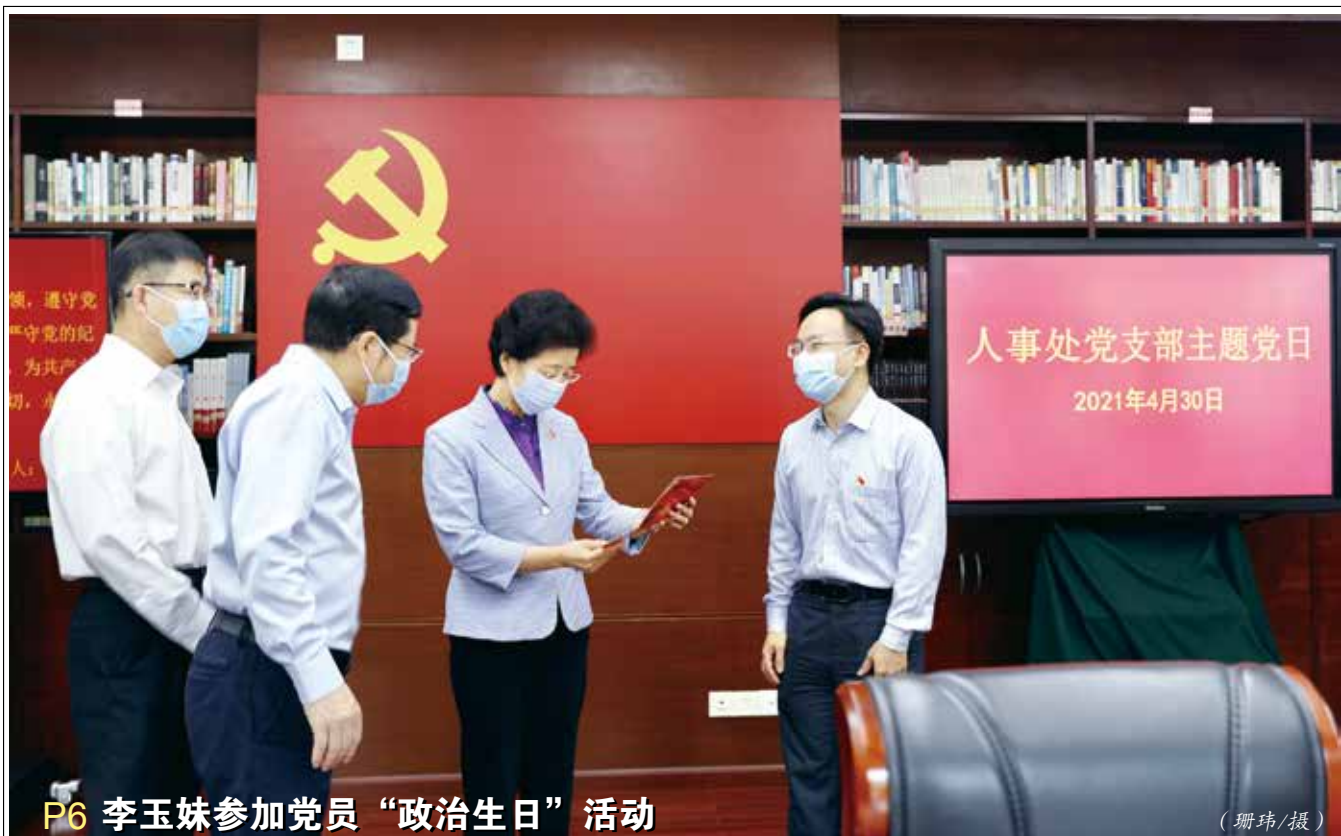
P6 李玉妹参加党员“政治生日”活动