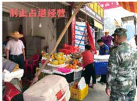
梅林镇人大组织人大代表开展圩镇“六乱”综合整治工作