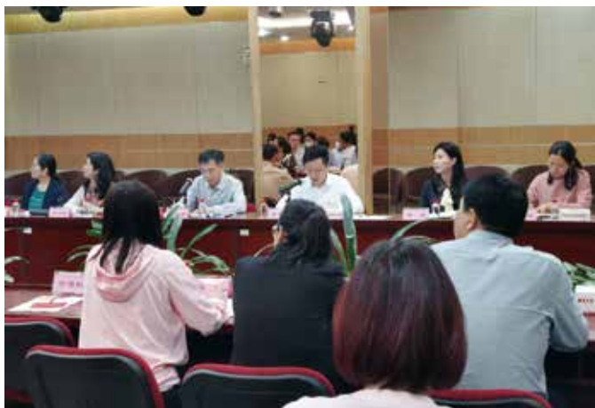
全国人大代表刘若鹏、杨飞飞分别到南山区、罗湖区“人民代表大会制度宣讲基地”开展宣讲