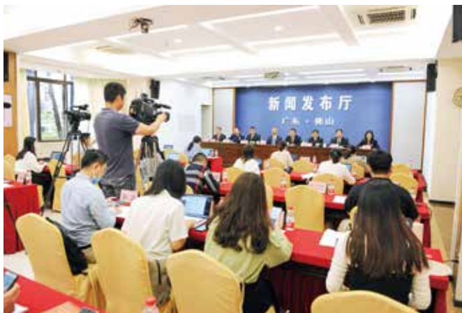
佛山市人大常委会召开《佛山市住宅物业管理条例》新闻发布会