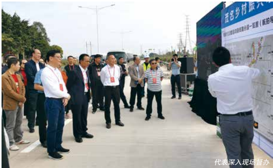
代表深入现场督办

2017年以来，常委会已连续四年对茂名市开展河长制湖长制工作情况组织多种形式的监督，先后调研5次、视察2次、听取和审议专项工作报告2次、评议3次、专题询问2次，有力地推动了茂名市河长制湖长制工作。尽管茂名市河