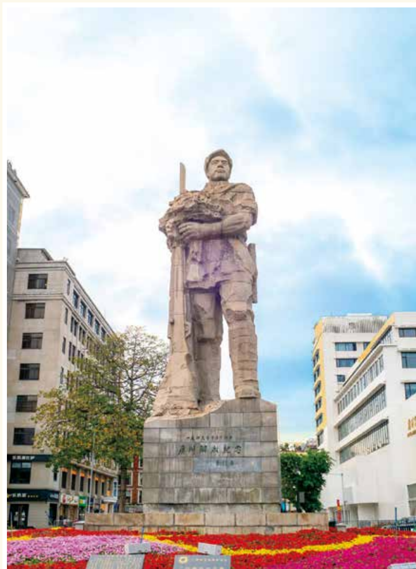
广州解放纪念碑（资料图片）