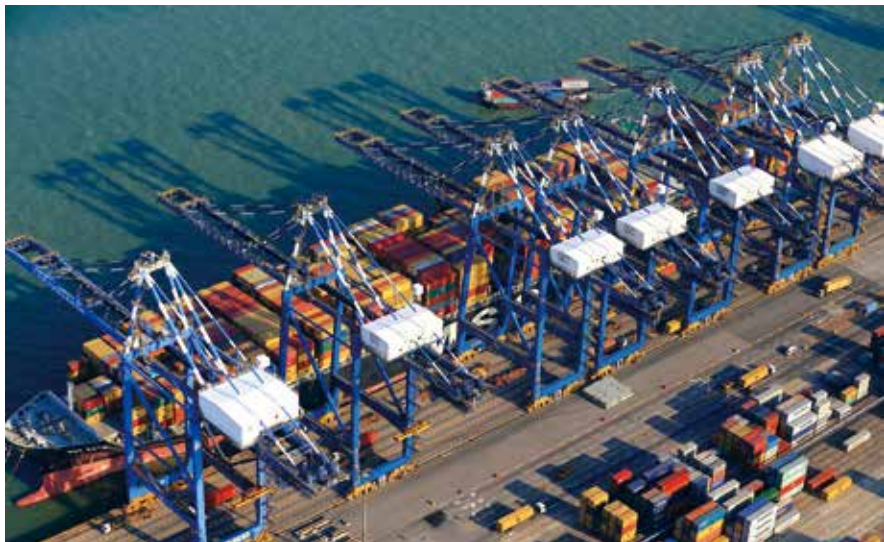
南沙港码头（资料图片）

以现代农业产业园财政补贴为例，为了乡村振兴发展新兴产业群，广东省2018年开始，三年内从全省（主要是粤东西北地区）挑选150家龙头企业作为重点扶持，每家实体企业财政补贴5000万元，已全部实施在案，这是省政府扶持三农、打通一二三产业链的一项有效措施。从近期省人大代表审议2021年财政预算得悉，由省有关部门主持，省政府决定总结经验，实施第二轮现代农业产业园帮扶工作，再用三年从各市挑选