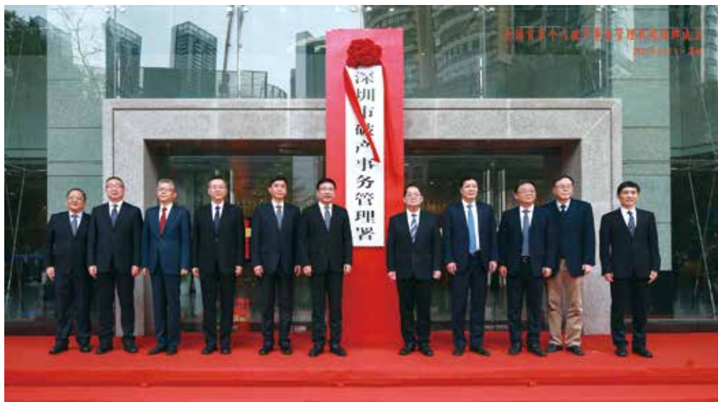
今年3月1日，全国首家个人破产事务管理机构——深圳市破产事务管理署挂牌成立