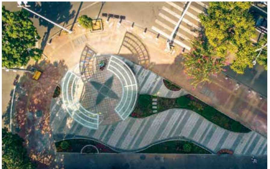
狮山街道建成“美化街角”——门户空间