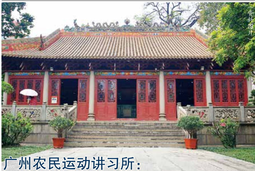
广州农民运动讲习所：