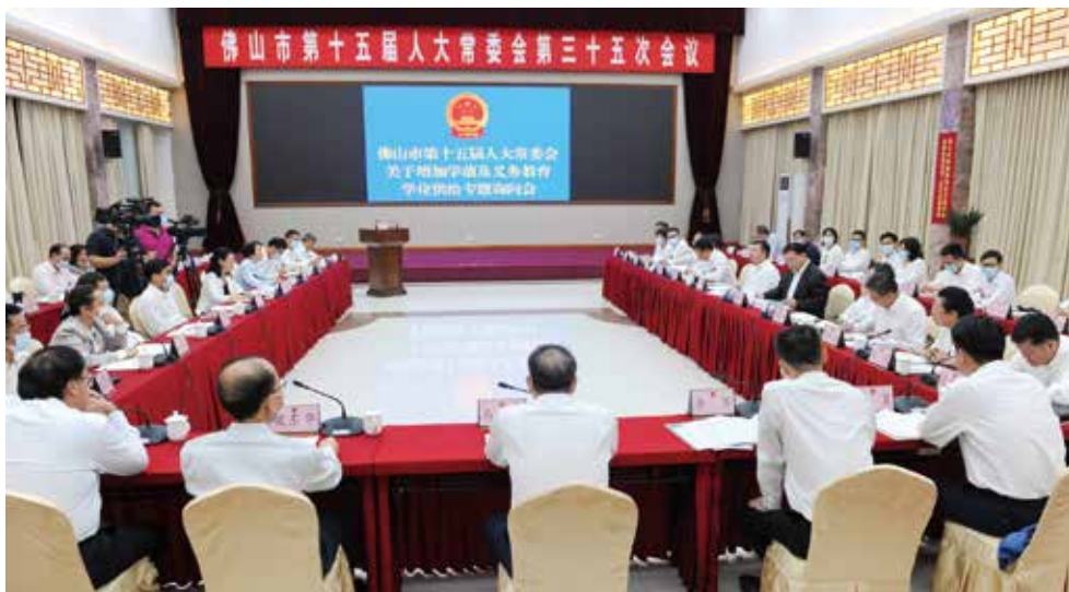
佛山市第十五届人大常委会第三十五次会议对“增加学前及义务教育学位供给情况”开展专题询问