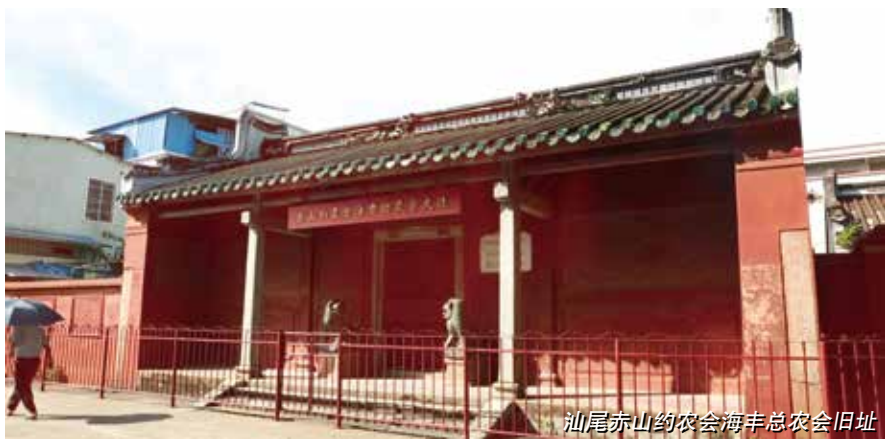
汕尾赤山约农会海丰总农会旧址

既带动当地旅游业发展，也带动群众就业。加强文物价值的挖掘阐释和传播利用，加大对文物创意产品的扶持开发，改造提升全国红色旅游经典景区，积极引导学校与革命文物管理单位建立长效合作机制，让文物活起来。要策划打造主题突出、导向鲜明、内涵丰富的宣传精品，形成更加丰富、更加立体的宣传形态，实现有址可寻、有物可看、有史可讲、有事可说，见人见物见精神。四是培育专业人才队伍。加强革命文物保护、管理、利用和研究人才队伍建设，制定人才培养计划，健全人才培养激励机制，大力培养研究型、管理型和技能型人才，为保护利用工作提供人才支撑。加强行政管理队伍建设，结合实际论证适当增加内设机构和人员，省、市文化和旅游部门增设革命文物处（科）。培养一批熟悉业务、有情怀、热爱本职工作的优秀红色讲解员，讲好红色故事。五是要强化有关法律责任。要协调住建、国安、保密等相关部门，支持文物行政部门依法履职。如，要聚焦法人违法、盗窃盗掘、火灾事故三大风险，明确重大文物安全事故的评判标准，制定和落实重大文物安全事故的防范预案，建立文物资源资产管理、不可移动文物保护等机制，建立和落实督查评估、情况通报、检查报告等文物安全长效机制。对因失职渎职导致革命遗址造成损坏、毁弃等严重事故的，要追究主要领导和直接责任人责任，为消除安全隐患提供法律支撑。■