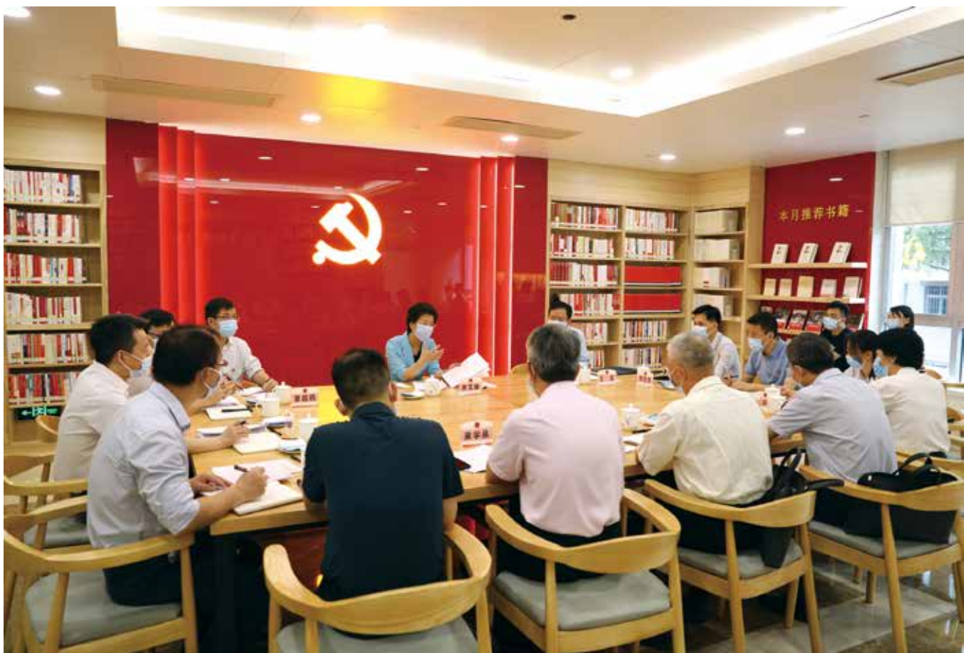
李玉妹主任出席省人大常委会机关党史学习教育工作汇报会

习强国”党史专栏开展学习，采取每日学习打卡、重点内容导读、定期解疑释惑等方式，认真学习党史有关内容。有的党支部还自我加压，要求每名同志提交1篇以上学习心得、讲1次党史微党课等。三是抓好集中学习。严格落实专题学习计划，围绕规定的学习内容，分6个专题，扎实开展学习教育。采取理论学习中心组学习、举办“广东人大课堂”、专题学习会等形式开展集中学习讨论。常委会党组已召开理论学习中心组学习会4次，机关党组也已召开理论学习中心组学习会4次，7个分党组和33个党支部共召开专题学习会128次。前一阶段学习教育中，邀请全国人大常委会社会建设委员会副主任委员陈斯喜、中国国际问题研究院常务副院长阮宗泽作学党史、悟思想方面的专题辅导讲座。四是加强专题培训。积极参加全省党史