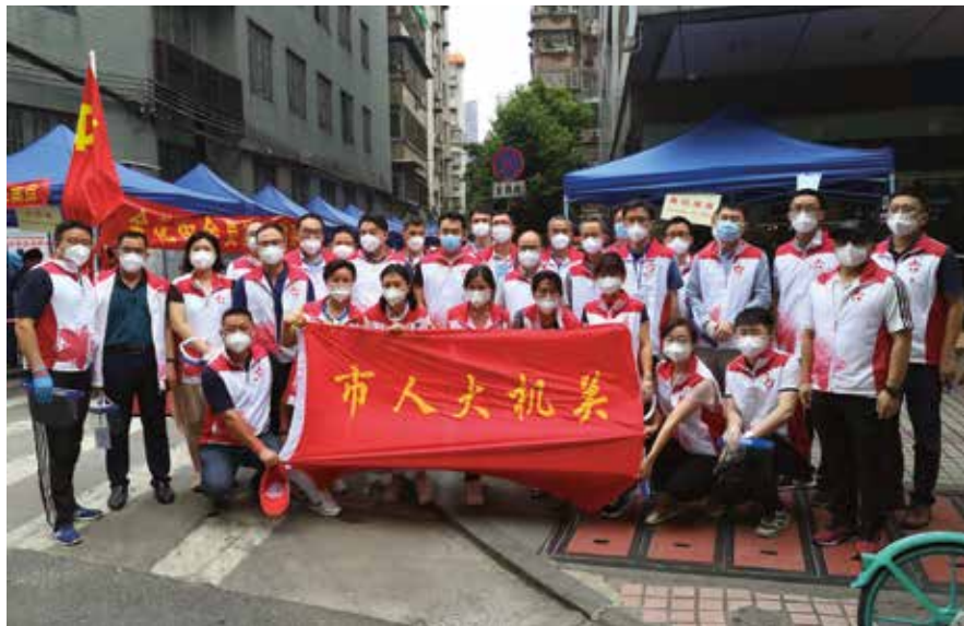
广州市人大常委会组织党员先锋队赴荔湾区金花街参加疫情防控工作

这场辅导培训课暨动员部署会，拉开了广州市人大常委会党史学习教育的序幕。在党史学习教育中，常委会始终坚持在“学”上走在前、“悟”上作表率。