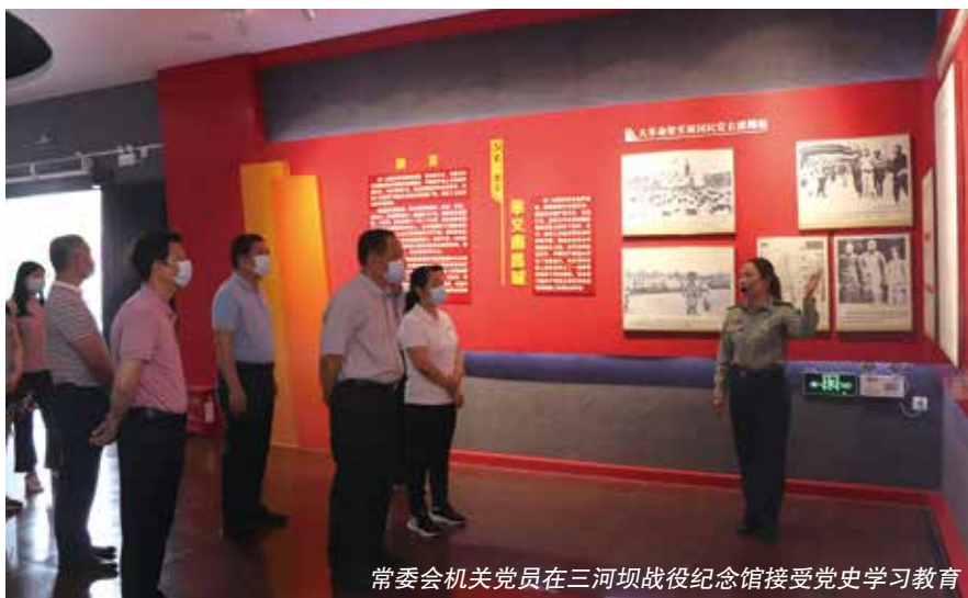
常委会机关党员在三河坝战役纪念馆接受党史学习教育

围绕“铭记光辉历史传承红色基因”主题，组织党员干部在党史学习教育中深入开展革命传统教育，先后组织机关干部到梅县革命烈士陵园祭拜先烈，到红四军前委机关、军部驻地和“九月来信”传达地——同怀别墅、中央红色交通线大埔中站、三河坝战役纪念馆、坚真纪念馆等参观。通过现场参观，开展革命传统教育，大力弘扬红色传统、传承红色基因、发扬革命精神，赓续共产党人精神血脉，用党的革命传统和优良作风坚定信念、凝聚力量，引导广大党员鼓起迈向新征程、奋进新时代的精气神，努力推动梅州苏区振兴发展。