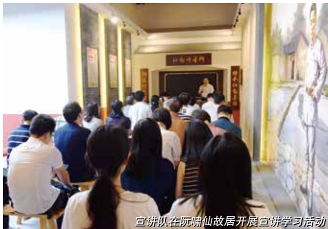
宣讲队在阮啸仙故居开展宣讲学习活动