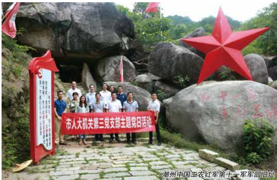
潮州中国工农红军第十一军军部旧址

（一）要厘清立法的基本概念。近年来，革命遗址、革命文物、红色资源经常在领导讲话、党和政府文件、学术文章出现，没有统一表述，学术界观点不一，我们认为制定《广东省革命遗址保护条例》，首先要厘清其基本概念，才能准确把握其价值与功能，为立法工作提供基本依据。这个起点性问题研究得越透彻，后续立法工作就会越清晰，