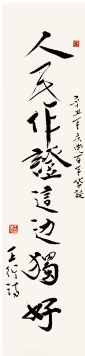
人民作证这边独好 (王衍诗/书)