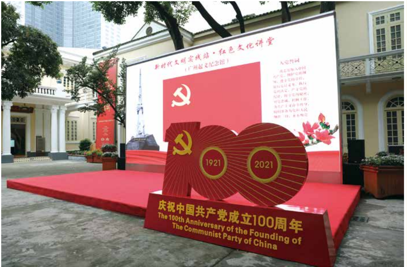
广州起义纪念馆