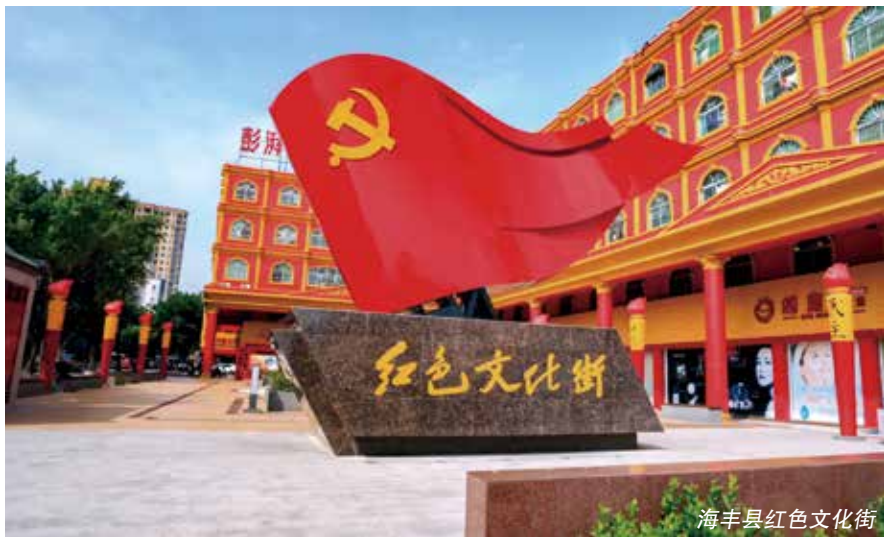
海丰县红色文化街

参天之本，必有其根；怀山之水，必有其源。百年前，中国共产党领导海陆丰人民开展了最早的大规模农民运动，建立了中国第一个苏维埃政权，进行了最早的土地革命实践，留下了被誉为“东方小莫斯科”的红宫红场、赤山约农会旧址、红四师师部旧址、总农会旧址、周恩来同志渡海纪念碑等一大批宝贵的革命遗址遗迹，培育了海陆丰人民敢为人先、生死于理想的革命精神。这些熠熠生辉的红色基因，诠释着中国共产党带领人民群众艰苦奋斗、敢于牺牲的革命精神，共产党人坚如磐石的理想信念和全心全意为人民服务的根本宗旨。