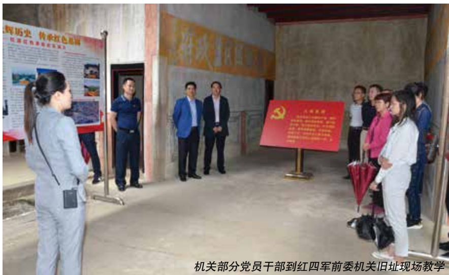
机关部分党员干部到红四军前委机关旧址现场教学

为加强对市政府民生实事项目实施情况的跟踪监督，常委会还制定印发了《关于开展2021年民生实事项目监督工作方案》，列为常委会2021年监督工作计划的重点，明确了时间安排，落实了工作分工，分别由五个工委督办。