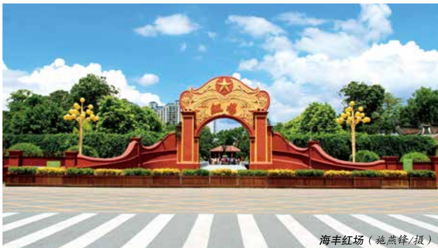
海丰红场

史带来了心灵的震撼，思想上受到深刻洗礼，今后要从党的百年伟大奋斗历程中汲取奋进力量，把学习成效转化为推动乡村振兴的强大动能。