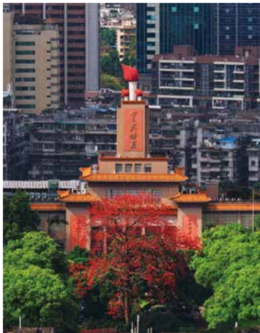
广州少儿图书馆内的“星火燎原”馆（资料图片）