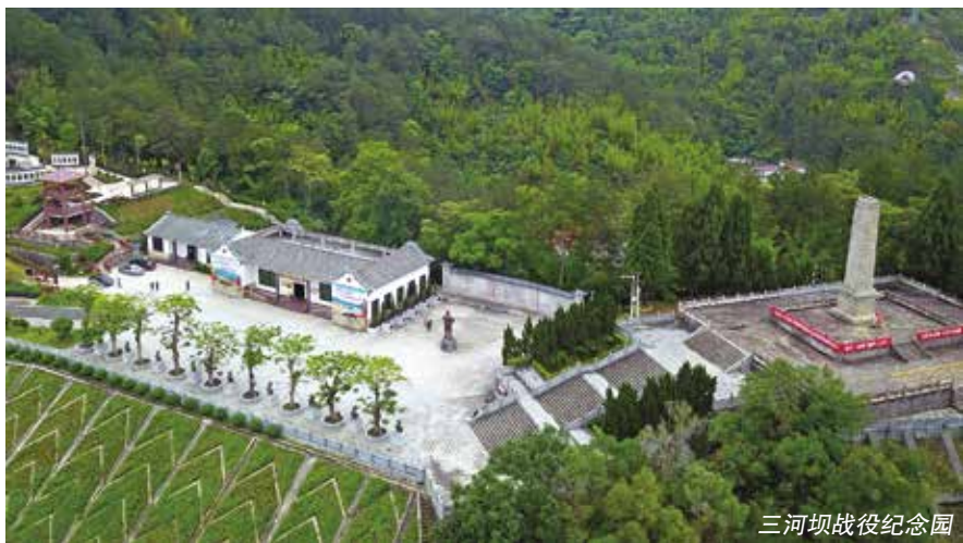
三河坝战役纪念馆

大批革命先辈在梅州这片热土上进行了长时间的革命斗争实践，留下了许多可歌可泣的革命事迹，也留下了众多