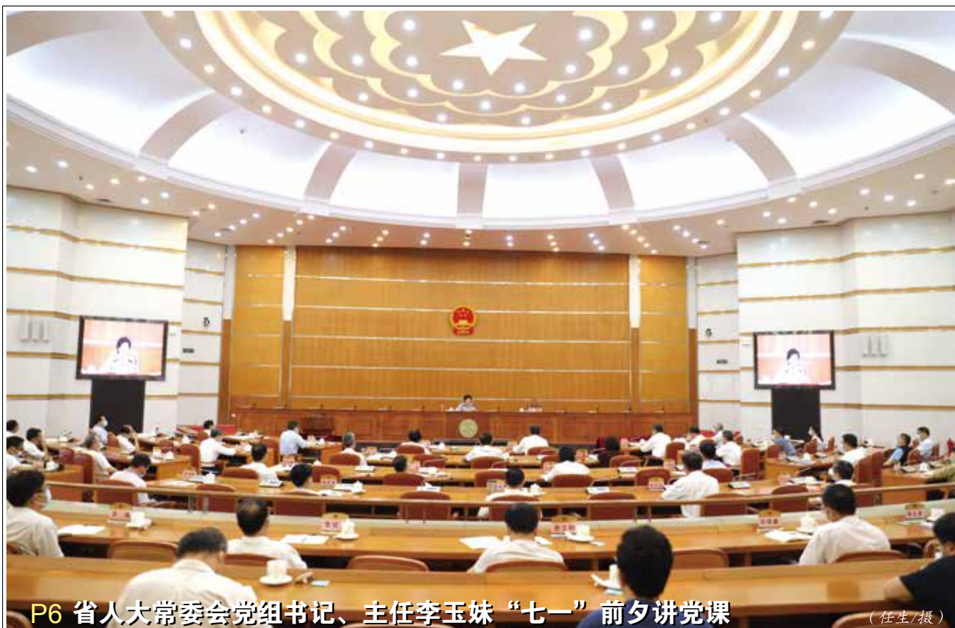
P6 省人大常委会党组书记、主任李玉妹“七一”前夕讲党课