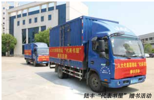
陆丰“代表书屋”赠书活动

书屋搭平台，人大代表讲故事。一场气氛热烈的“人大代表宣讲红色故事”宣讲活动在陆丰市金厢镇洲渚村人大代表联络站“代表书屋”举行，吸引了当地众多党员群众前来聆听。“你们知道当年南昌起义部队挺进潮汕时，周恩来、叶挺、聂荣臻等革命先辈抢渡碣石湾赴香港和开展革命活动的史迹吗？”宣讲中，金厢镇洲渚村人大代表联络站驻站人大代表黄哲泓围绕周恩来等革命领导人转战海陆丰的史迹，追忆周恩来在金厢的日子，讲述革命前辈在陆丰革命老区不屈不挠、艰苦卓绝的革命故事。在场的党员群众纷纷表示，可歌可泣的党