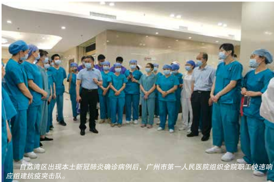
自荔湾区出现本土新冠肺炎确诊病例后，广州市第一人民医院组织全院职工快速响应组建抗疫突击队。

对本单位场所、设施实施卫生消毒；配备必要的防护物品和设施；对本单位人员和往来人员开展健康监测；督促密切接触者、来自疫情严重地区的人员按照有关规定进行隔离医学观察；发现异常情况及时报告相关主管部门并采取相应的防控措施；按照人民政府要求组织人员参加疫情防控工作；严格执行人民政府关于复工复产、开学等规定；人民政府要求开展的其他疫情防控工作。同时，决定还明确对人员流量大、人群聚集的公共服务单位，比如交通运输、农贸市场、商场超市、宾馆饭店、金融机构、学校、文体场馆、养老服务机构等，要严格进行消毒通风、体温检测，必要时进行人流控制。