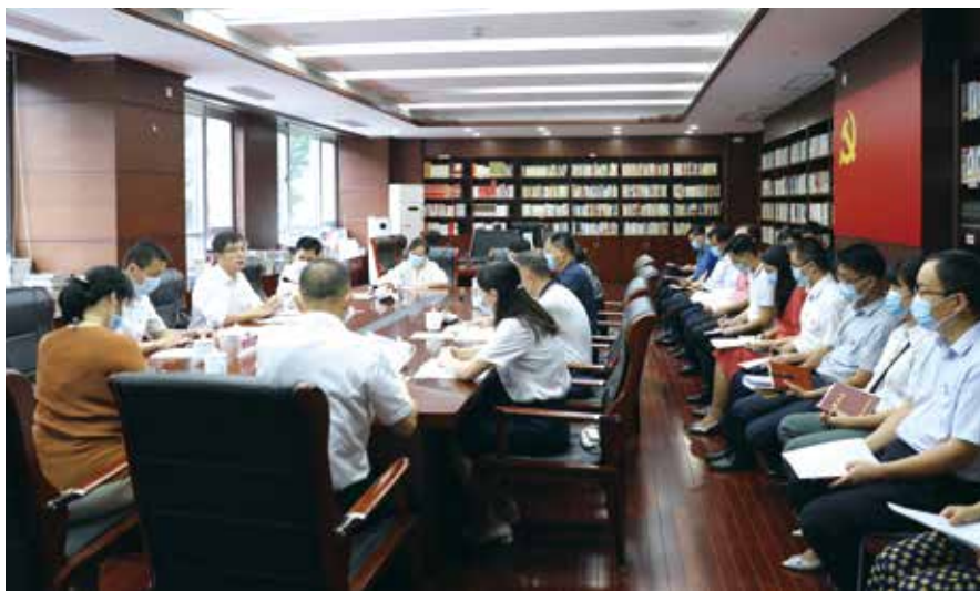
省人大常委会机关党委组织党员干部谈学习党史的心得体会

活动形式丰富多彩。 立足省人大常委会及机关实际，开展特色鲜明、形式多样的学习教育活动，努力增强学习教育的针对性、实效性和感染力。一是深入开展“政治生日”活动。李玉妹主任带头示范，以普通党员身份参加所在党支部“政治生日”活动，带领全体党员重温入党誓词，就加强学习、终身学习为支部党员讲党课，为机关作出了表率。机关专门印发通知，督促机关33个党支部普遍开展了“政治生日”活动。各支部采取重温入党誓词、交流入党体会、开展谈心谈话、组织讲党课、组织办实事活动、表达“政治生日”祝愿、赠送“政治生日”贺卡等形式，教育引导党员同志锤炼党性、永葆初心，大家都感到很有意义，学习教育更加走心走实，成为了支部活动的新形式新风尚。二是把党史学习教育与学习人民代表大会制度史有机结合。充分发挥人民代表大会制度在广东实践历程展的宣传教育作用，组织常委会机关各支部、邀请省直单位和各级人大机关干部，以20至30人的小规模，多频次参观历程展，学习宣传人民代表大会的创建发展史。5月下旬召开省人大常委会会议期间，组织常委会全体组成人员和机关干部分批参观学习、