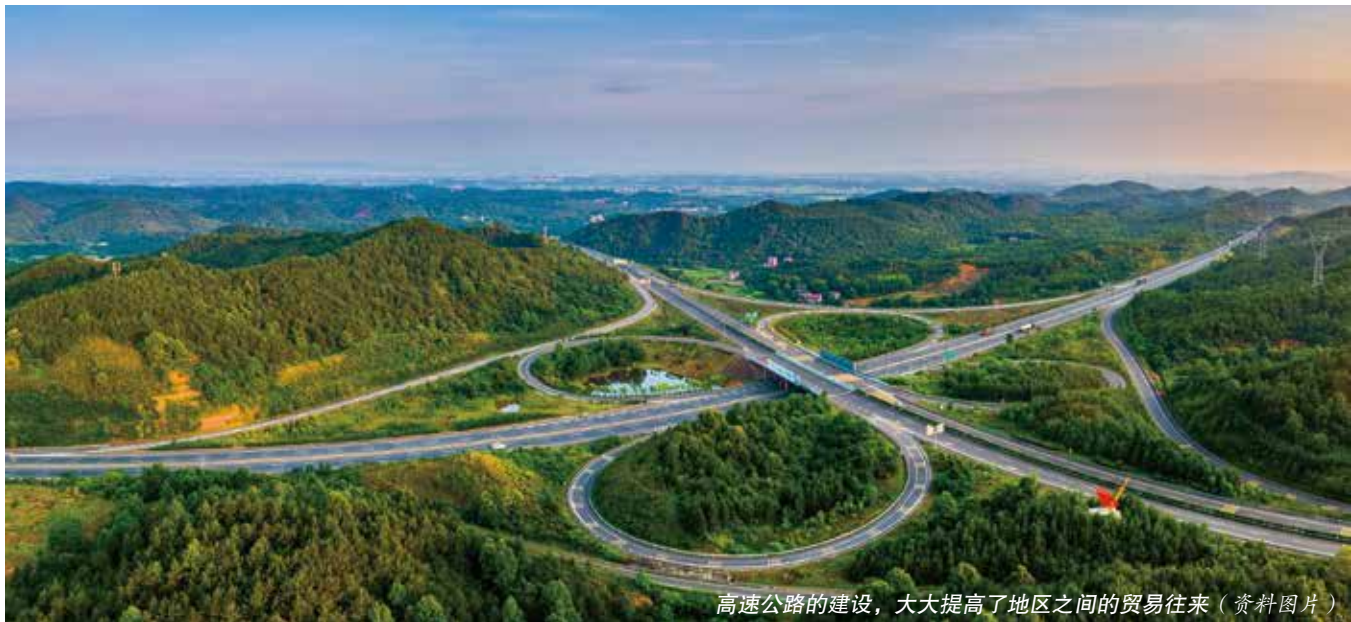
高速公路的建设，大大提高了地区之间的贸易往来（资料图片）

促进提升了全省预算管理水平。 一是推动进一步完善相关财政政策。省政府及其相关部门根据省人大常委会的监督结果，及时修订完善省级专项资金管理办法，进一步明确资金适用范围、管理流程、拨付时限、职责分工，确保专项资金管理有章可循，有据可依。二是推动进一步规范财政资金监管。针对战略性新兴产业发展专项资金支出绩效监督中发现的骗取财政资金、违规使用资金等行为，省财政厅会同相关部门进行了整改，加强了监督检查，并清算收回财政资金共14763万元，对未实施的股权投资项目资金400万元，按规定要求受托管理机构缴回省财政。三是推动进一步完善财政扶持方式。在对产业园扩能增效专项资金以及企业技术改造专项资金绩效监督中，省财政为进一步强化财政政策对省产业园区体制增效的引导和扶持作用，在安排210亿元支持珠三角与粤东西北产业共建的财政资金中，采纳了有关审议意见，对省内产业共建企业及项目给予普惠性奖补和叠加性奖补，调动了珠三角企业转移到粤东西北地区的积极性。■