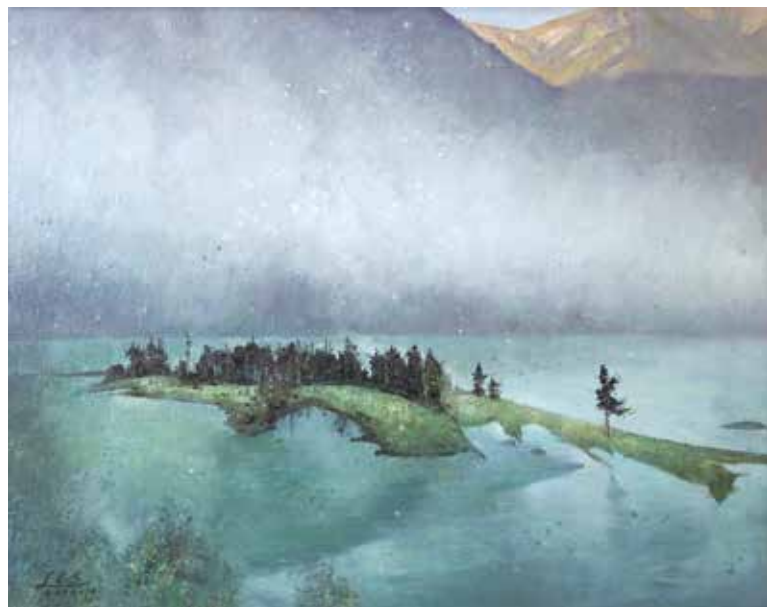
新疆卧龙湾（油画，李春生/作）

翰墨书盛世，丹青绘党恩。省人大常委会机关党委、工会、老干部党总支联合举办“庆祝中国共产党成立100周年”书画摄影作品展，以艺术形式讴歌党的丰功伟绩，生动展示我国经济社会发展的辉煌成就，向中国共产党百年华诞献礼。