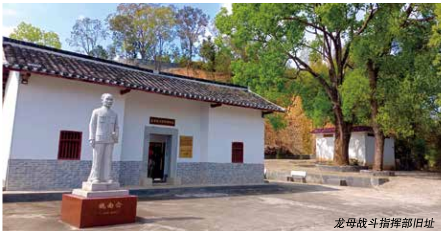
龙母战斗指挥部旧址

谈起条例的出台，河源市人大常委会法工委有关负责人表示，在建党100周年的重大时间节点上施行条例，对河源市更好地传承红色基因，赓续红色血脉，培育和践行社会主义核心价值观具有十分重要的政治意义、现实意义和历史意义。