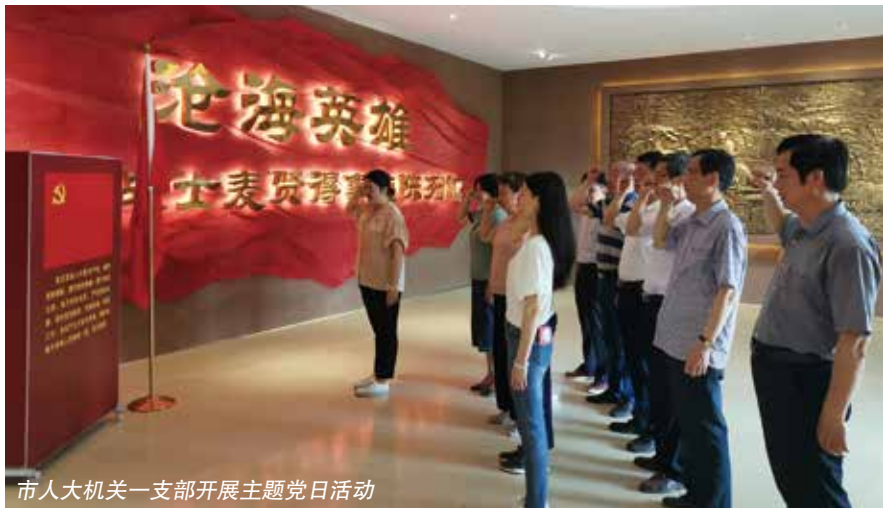
市人大机关一支部开展主题党日活动