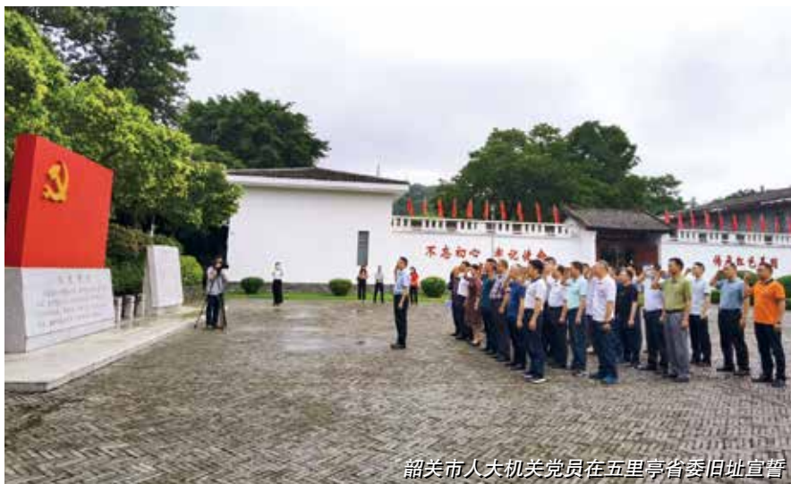
韶关市人大常委会机关党员在五里亭省委旧址宣誓

党史学习教育按下“启动键”后，韶关市人大常委会机关在认真学习习近平总书记党史学习教育动员会上重要讲话精神的基础上，为全体党员分发《习近平论中国共产党史》等四本指定书目，统一配备专门的学习记录本。充分利用韶关丰富红色资源、红色基地开展党史学习教育，让广大党员干部置身于红色资源中，沉浸在红色基因中耳濡目染，让党史学习教育生动鲜活。组织学党史悟思想办实事开新局2021年网上党史知识竞赛，依托“韶关人大”网站、“韶关人大”微信公众号，“韶关人大”杂志等载体，开设“党史学习教育”专栏，让学党史融入日常、做在经常。注重以宣促学，持续拓展党史学习的深度广度，邀请市委党史学习教育宣讲团成员、市委党校统战理论教研室副主任文豪围绕“中国共产党百年历程中应对重大困难