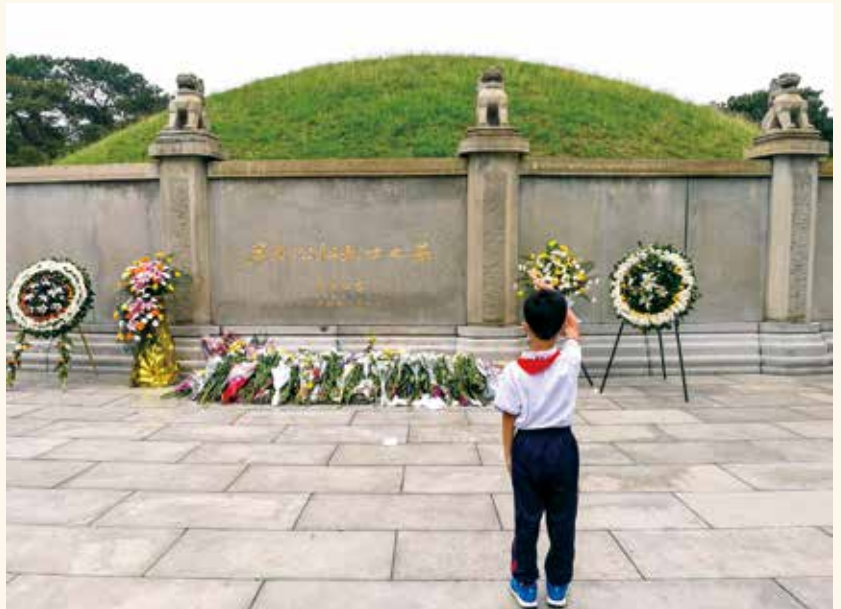
缅怀革命先烈，永远跟党走！