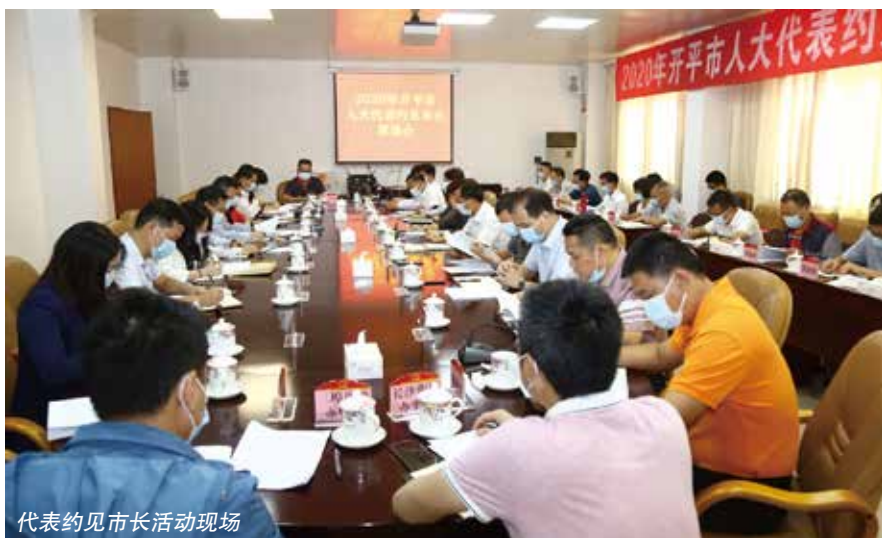
代表约见市长活动现场