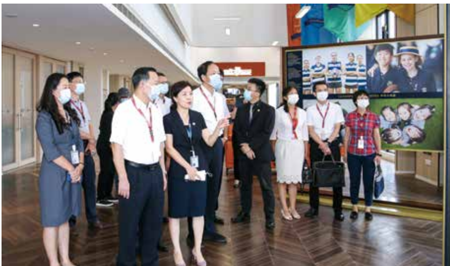
2021年7月1日，珠海市人大常委会到横琴开展《珠海经济特区横琴新区港澳建筑及相关工程咨询企业资质和专业人士执业资格认可规定》实施情况执法检查

为贯彻落实习近平总书记重要讲话精神，推动澳门经济适度多元发展，便利港澳要素跨境流动，服务粤港澳大湾区建设，珠海市人大常委会依据《粤港澳大湾区发展规划纲要》的政策授权，率先出台《珠海经济特区横琴新区港澳建筑及相关工程咨询企业资质和专业人士执业资格认可规定》。该法规从横琴改革实践需要出发，突破国家建筑领域关于资质管理的规定，通过备案取代许可，允许港澳建筑领域企业和专业人士在横琴新区直接提供服务。这是首部地方运用特区立法权，为粤港澳大湾区建设提供法治保障的创新性法规，为横琴新区在相关领域改革创新提供了法律依据和制度保障，为全省和全国逐步推出更多试点项目及开放措施积累了经验。