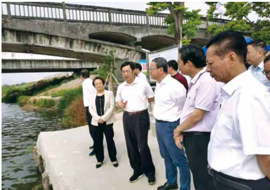
普宁市人大组织人大代表视察练江治污情况

举措一：制作暗访视频促整改。在练江流域污染综合整治工作开始之初，面对生活垃圾遍地、污水横流的情况，常委会采用明察+暗访形式摸准摸清练江流域城乡环境污染问题，暗访内容制成了“普宁市练江流域城乡环境污染综合整治问题调查”视频并在代表视察活动座谈会上播放，引起了强烈反响，常委会要求相关单位及政府职能部门认真