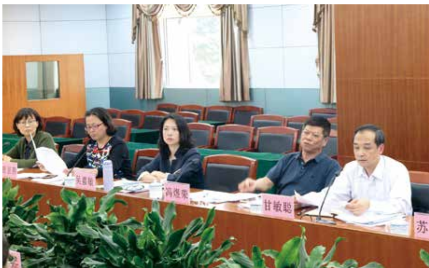
2019年3月13日，中山市人大常委会到小榄镇调研镇属国有资产监督管理情况

强国有资产管理监督的要求和意愿，提出了很多加强和改进国有资产管理的意见建议。比如，要求镇政府增进经营性资产管理和运营透明度，摸清家底，提高经营效益等等。其次，镇人大的监督“实”起来了。听取和审议镇属国有资产管理情况的报告，增添了年度第二次人代会的关键议题，丰富了镇人大监督内容，推动了镇人大自身建设。再次，镇政府“动”起来了。通过报告和审议，镇属国有资产管理方面的情况和问题由以前的“心知肚明”到现在的“公布与众”，集中公开和发现了一批镇属国有资产管理方面的热点、难点问题，倒逼镇政府和职能部门增强对国有资产管理的责任意识，有利于推动问题的逐步解决。