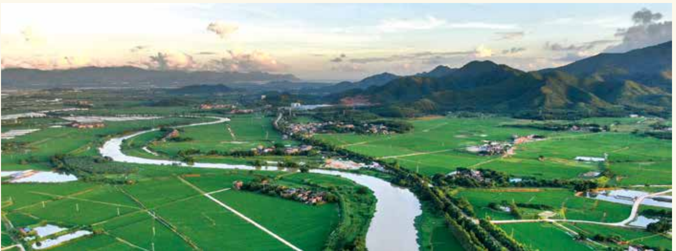
金山银山不如绿水青山