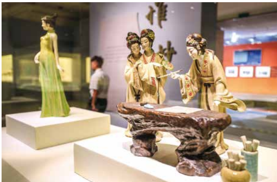
在首都博物馆“中国当代陶瓷艺术展”上展出的石湾窑瓷塑《惜春作画》（资料图片）

评审等程序作出规范。一边规范“接”，明确要求认定工作社会组织应当按照认定管理办法开展认定工作，实行“约法三章”：一是公布认定届次、种类、条件、数量、程序等，接受申请，组织专家评审委员会开展评审工作；二是专家评审委员会成员应当从省工艺美术专家库中随机抽取；三是认定工作应当遵循公平、公开、公正的原则，接受主管部门和社会监督。