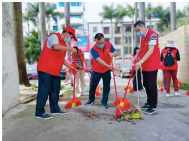
大力开展爱国卫生运动,强化预防优先,打造健康环境,为全面打赢新冠肺炎疫情阻击战奠定坚实基础(资料图片)