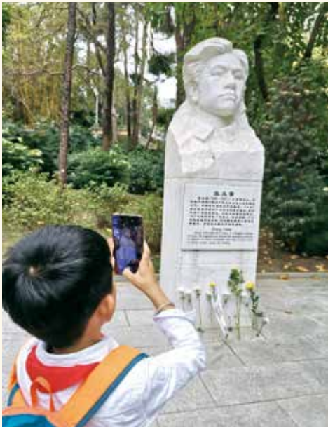
先烈英姿存永照，薪火传承藏心中