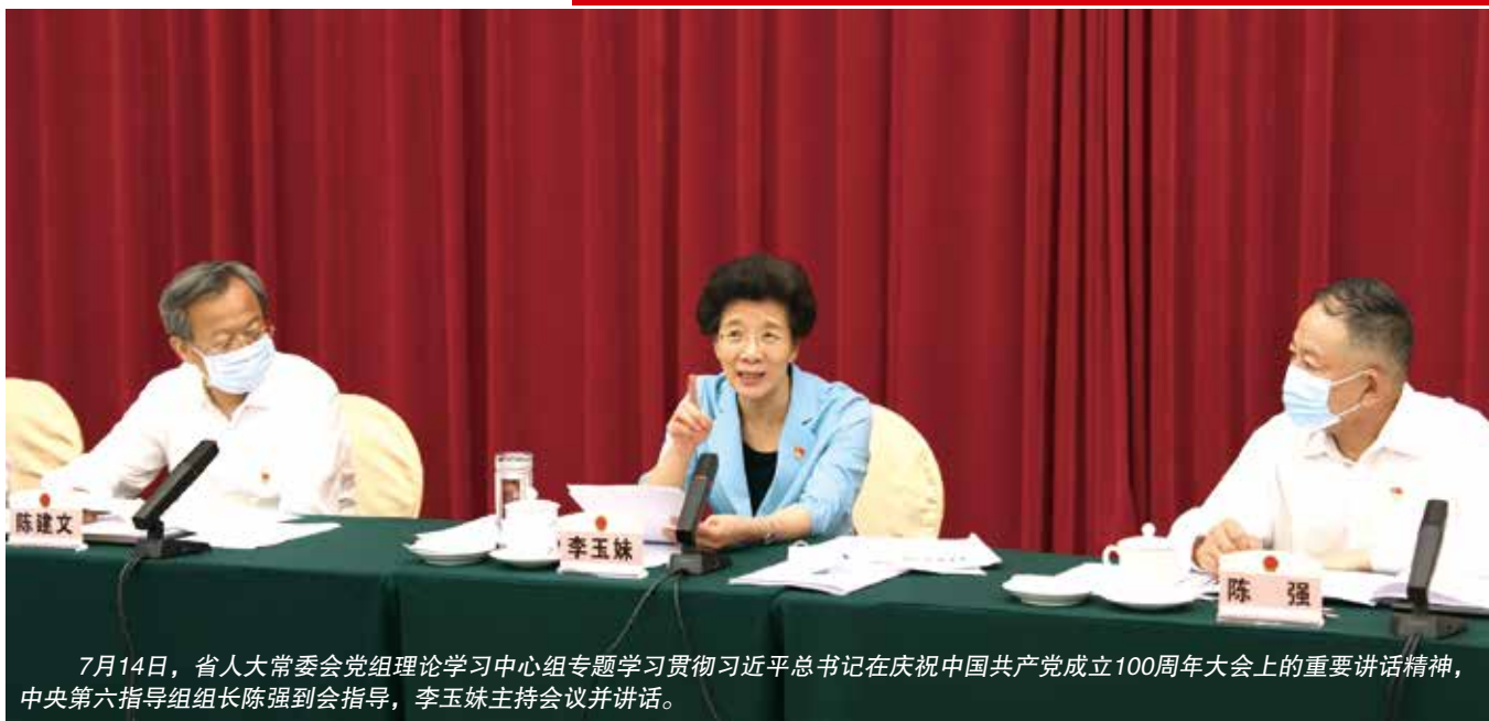
7月14日，省人大常委会党组理论学习中心组专题学习贯彻习近平总书记在庆祝中国共产党成立100周年大会上的重要讲话精神，中央第六指导组组长陈强到会指导，李玉妹主持会议并讲话。

献。要认真开展宣传宣讲、研究阐释工作，围绕发展全过程人民民主、全面推进依法治国等，形成一批高质量的学习研究成果，持续营造浓厚的学习氛围。