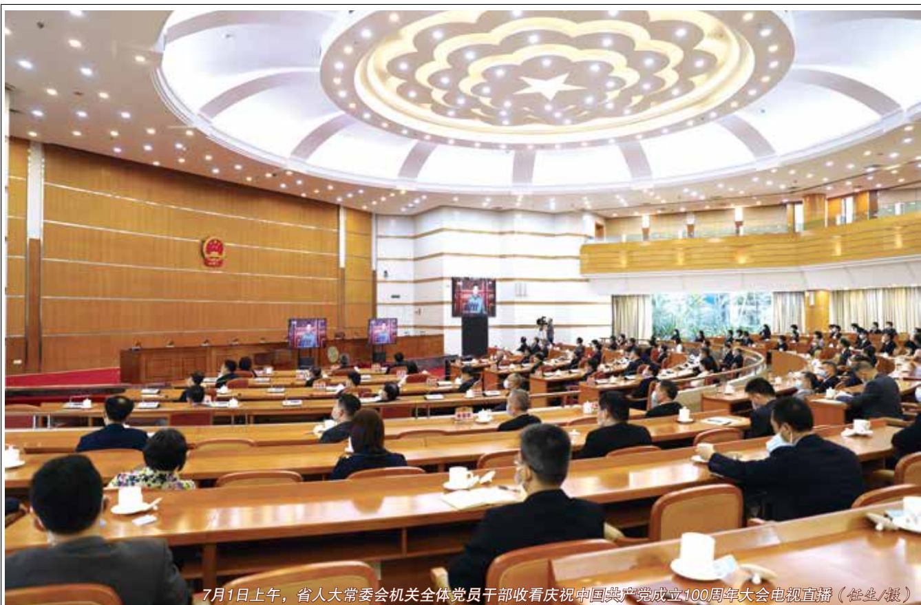
7月1日上午，省人大常委会机关全体党员干部收看庆祝中国共产党成立100周年大会电视直播