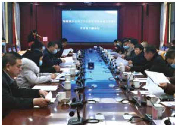
公共卫生应急管理体系建设询问会现场

为确保此次专题询问问到“点子”上，常委会成立了由部分清远市和连州市人大代表为成员的调研组，认真调研连州市公共卫生应急管理体系建设情况，