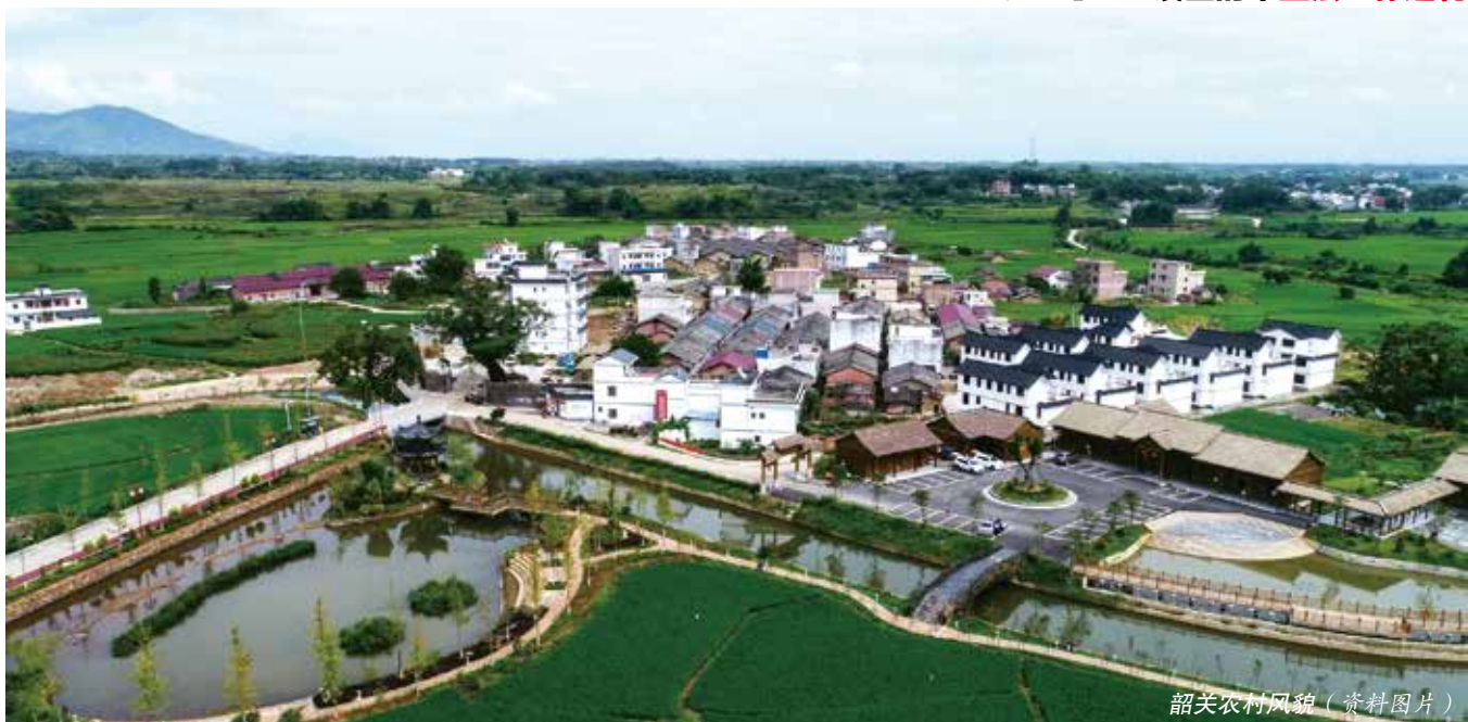
韶关农村风貌（资料图片）

部及城市周边农村住房建设”问题，市人大常委会审议后认为，城中村违规建房情形急需管控，城镇开发边界目前亦没有划定，条例的适用范围应涵盖城镇集中建设区外城镇开发边界内的农村（即城中村）。因此，在《中共中央、国务院关于建立国土空间规划体系并监督实施的若干意见》规定城镇开发边界内编制详细规划，在城镇开发边界外的乡村地区编制“多规合一”的实用性村庄规划的情形下，条例从韶关市实际出发，规定“城镇集中建设区外城镇开发边界内的村庄，尚未编制详细规划的，可以编制村庄规划”等内容，把城中村的农村住房建设和宅基地管理一并纳入条例的适用范围。