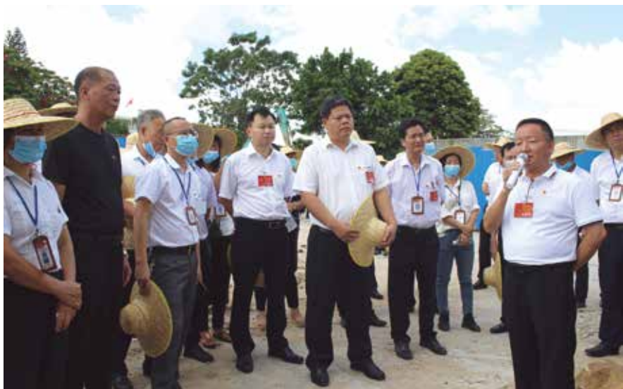
稔山镇人大组织代表视察稔山镇幼儿园项目建设情况

“三议两评”分组跟踪监督方法深化对新时代坚持和完善人民代表大会制度这一重大理论和实践课题的认识；坚持正确的政治方向，坚定制度自信和道路自信，坚持党的领导、人民当家作主、依法治国有机统一，服务社会主义民主政治基层实践；着眼于推进国家治理体系和治理能力现代化，紧跟党中央决策