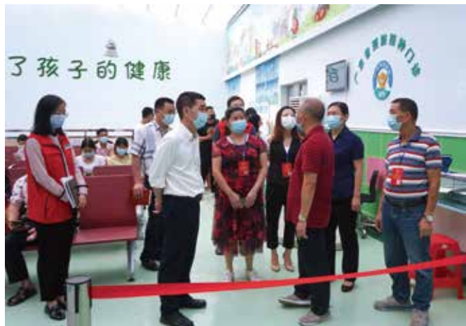
云浮市云城区人大代表“回头看”视察新建的预防接种点

多方合作联动下，高峰街社区卫生服务中心预防接种门诊改建工程于2018年12月底动工，2019年4月正式投入使用。新建云城街社区卫生服务中心春岗预防接种门诊于2019年7月动工，2020年