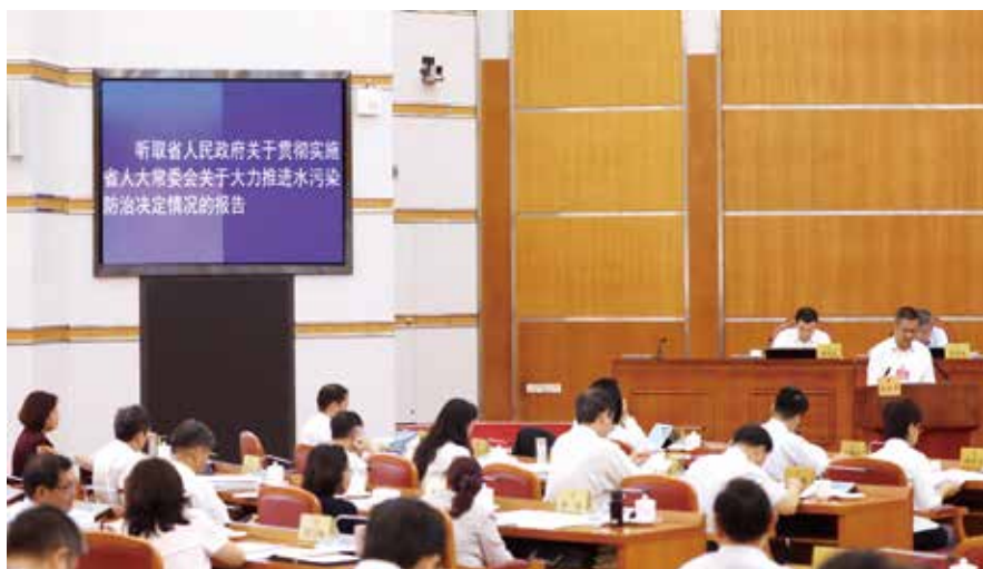
2019年9月24日，省十三届人大常委会召开第十四次会议，听取省人民政府关于贯彻实施省人大常委会关于大力推进水污染防治决定情况的报告

区505个黑臭河涌水体消除黑臭。2020年上半年，我省国考断面水质优良率和劣V类比例，首次全部阶段性达到考核目标，创近五年历史同期最好水平。淡水河紫溪断面水质改善为III类、茅洲河共和村和石马河旗岭断面水质达到IV类、练江海门湾桥闸和东莞运河樟村断面水质达到V类。备受关注的茅洲河和练江，实现水环境从普遍黑臭到全面消除黑臭的重大变化。“还给老百姓清水绿岸、鱼翔浅底的景象”从梦想走近现实。