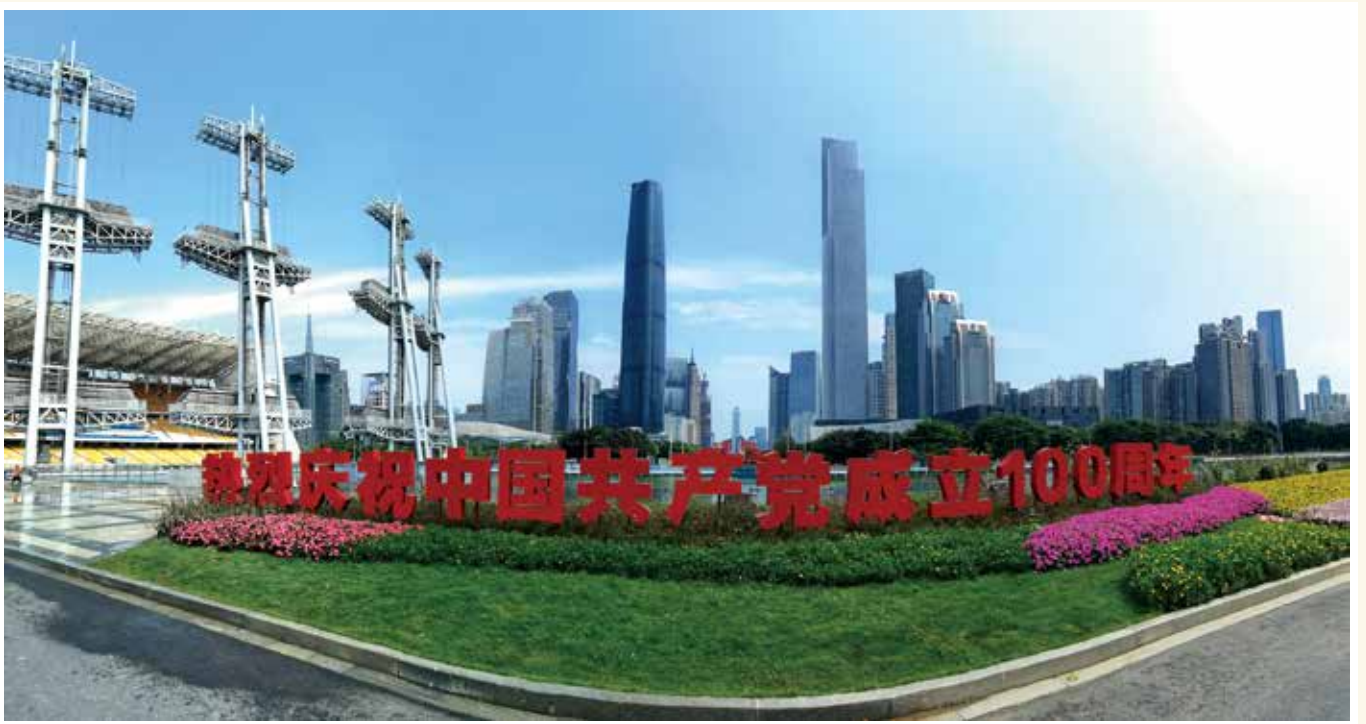
百年铸辉煌