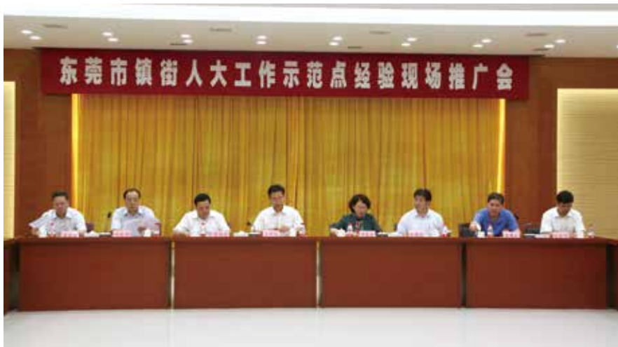
2018年7月5日，东莞市镇街人大工作示范点经验推广会召开

为此，东莞市人大常委会充分考虑莞城、南城、东城、万江4个街道经济社会发展活跃的特点，从制度供给端入手，以出台《东莞市人大常委会关于加强街道人大工作规范化建设的意见（试行）》为核心搭建“1+5+X”双向政策体系（其中1是市出台的总制度、5是街道落实的重点制度、X是街道探索的制度创新），从人大街道工委的现实痛点、难点、堵点上精准发力，率先探索出一条东莞速度、东莞质量、东莞方案“三具备”的破解路径，弥补了街道一级的人大制度空白。不仅成为东莞首个关于街道人大工作的政策支撑，也是全省地级市首份对街道人大工作进行明确授权的综合性文件。