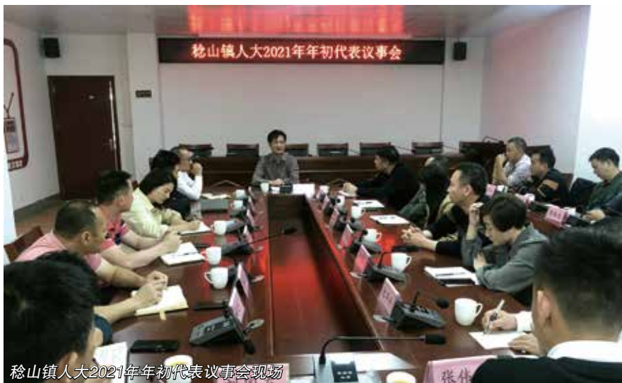
稔山镇人大2021年年初代表议事会现场