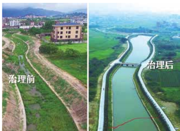
练江普宁段治理前后对比图