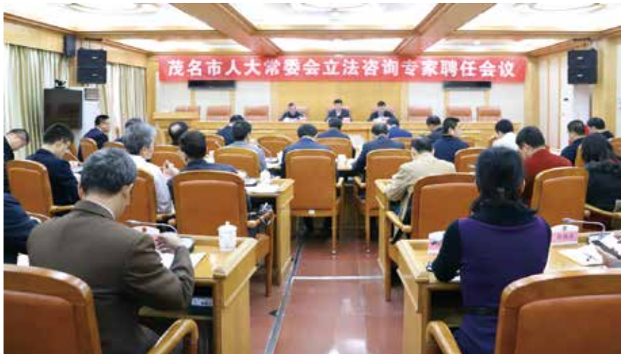
2020年1月，茂名市人大常委会召开立法咨询专家聘任会议

空前的压力主要来源于三个自身存在的先天不足：一是立法机构设置不健全、立法能力薄弱。获得地方立法权前，茂名市人大及其常委会缺乏独立专门的能力与职责相匹配的立法审议机构和立法队伍，获得地方立法权后随即建立了由10名相关法律专家、学者或有实践经验的法律工作者为主体的法制委员会，而初始成立的法制工作委员会只有一名主任和两名工作人员，立法力量非常单薄，立法知识储备匮乏。二是立法人才资源稀缺。茂名市范围内只有广东石油化工学院一所二本院校，拥有学士学位授权的法学专业非该院校的优势专业，师资力量缺乏对立法工作的研究，难以提供高层次的专业支撑和智力支持。三是同时熟悉立法规律、法律知识以及城乡建设与管理、环境保护、历史文化保护等领域业务知识的市人大常委会组成人员和立法工作人员少之又少。目前市人大常委会组成人员共38人，其中有法律专业背景的成员只有11人，占组成人员总人数28.9%，常委会组成人员的知