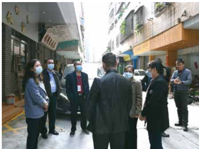
南庄镇人大组织代表视察吉利社区长者饭堂建设项目

代表有效履职，人大制度优势转化为治理效能。 南庄镇人大APP受代表青睐普遍应用后，数据越来越丰富，集中