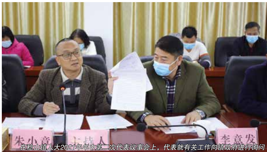
在稔山镇人大2021年年中第二次代表议事会上，代表就有关工作向镇政府进行询问

推动了政府工作的落实。 以前，政府每年在人代会上作报告，提出当年的工作目标和任务，下来究竟能不能完成，完成了多少，没有人去认真关注和追究，政府相关职能部门感觉不到太大