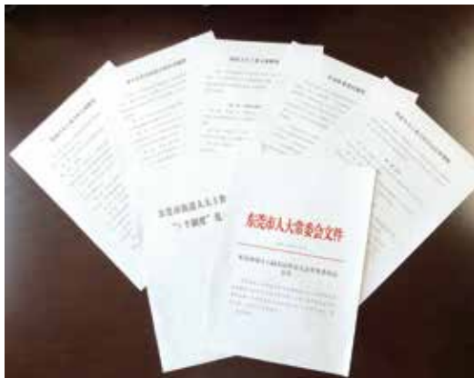
东莞市街道人大工作“5个制度”范本汇编

提升“五个水平”。 一是政治建设上水平。要对“国之大者”心中有数，坚持把人大工作放在大局之中思考和谋划，不断筑牢做到“两个维护”的思想根基，把人民代表大会制度优势转化为治理效能。二是制度建设上水平。健全人大街道工委相关工作制度，使街道人大工作和代表履职活动有规可依。三是自身建设上水平。以建设“两个机关”为目标，高标准、严要求加强自身建设，设置街道工委委员，组建人大街道工委主任会议。四是履职能力上水平。推动代表培训从“大而全”向“小而专”转变，适时组织好“四支队伍”的专门培训，提升人大街道工委整体履职水平。五是工作实效上水平。可通过“一揽子授权”“项目式授权”“一事一授权”的方式，授权街道独立开展监督，打通人大监督在街道层面的通道，成为加强民主政治、夯实基层政权的有力支撑。■