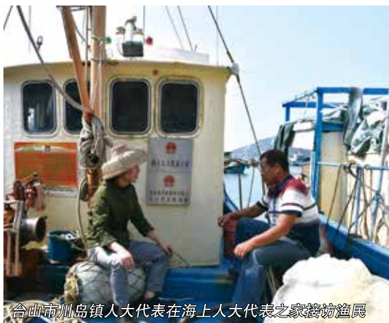
合山市州岛镇人大代表在海上人大代表之家接访渔民

县乡人大工作创新越来越突出。 坚持典型引路、示范带动，省连续两年开展全省县乡人大工作创新案例征集工作，共确定35个创新案例。深圳举办基层人大创新案例研讨推进会，交流推广创新案例。江门、韶关等市推进一县一品牌，创新县乡人大工作实践特色。从创新实践内容看，县乡两级人大普遍开展了专题询问、工作评议或满意度测评，“一府两院”及其有关部门主要负责同志到会应询逐步常态化，不少地方探索开展代表述职活动，加强代表履职监督，不少县（市、区）探索镇（街）人大工作绩效评价，等等。