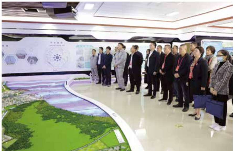
2020年12月，揭阳市人大常委会组织该市的省人大代表和部分市人大代表开展集中视察