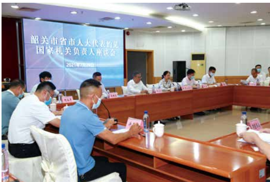
7月28日，韶关市省市人大代表约见国家机关负责人座谈会现场

方面，突出地方立法特色，紧扣贯彻落实党中央重大决策部署，紧扣回应人民群众重大关切，紧扣全面依法治国，在地方立法的权限范围内，注重“小切口”立法、精细化立法，让立法的制度设计与现实情况精准对接，确保法规立得住、行得通、真管用。围绕生态环保针对性立法，制定了《韶关市野外用火管理条例》《韶关市皇岗山芙蓉山莲花山保护条例》，以法规护航韶关市实施生态优先、绿色发展战略。围绕社会治理靶向性立法，制定了《韶关市烟花爆竹燃放安全管理条例》《韶关市文明行为促进条例》《韶关市农村住房建设管理条例》《韶关市建筑垃圾管理条例》，有效发挥立法保障作用，推进市域治理体系和治理能力现代化。在法规审议方面，积极推动公民有序参与立法工作，制定每一件法规时，都召开立法座谈会、论证会、听证会，充分听取各方面意见，广泛凝聚立法共识。充分发挥法制委员会的审议把关作用，每一件法规审议时都召开法委会，以合法性审查为重点，对常委会组成人员提出的意见建议进行梳理筛选并报告审议结果，使通过的每件法规都合法有效。三是维护国家法制统一，制定《韶关市人民代表大会常务委员会规范性文件备案审查工作规定》，