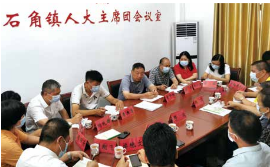
7月9日，清远市人大常委会负责同志率队检查指导石角镇人大代表联络站工作情况

基层立法联络员镇域全覆盖的优势，每年向群众征集立法项目，积极回应群众立法需求，增强立法针对性；每年组织代表开展地方性法规执法检查，及时发现法规实施中存在的问题和困难等，为修改完善法规打好基础。2016年以来，较高质量地完成了7部地方性法规的立法工作，得到社会各届的充分肯定。