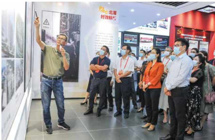
7月20日,佛山市人大常委会负责同志率队开展村级工业园改造工作情况视察

今后,我们将牢牢坚持以习近平新时代中国特色社会主义思想为指导,深入学习贯彻习近平法治思想、习近平总书记关于坚持和完善人民代表大会制度的重要思想、习近平总书记关于发展全过程人民民主的重要论述,在省人大常委会的指导和市委的领导下,全面肩负起宪法和法律赋予各项职责,积极探索和不断丰富全过程人民民主的“佛山实践”,奋力推动新时代佛山人大工作高质量发展。■