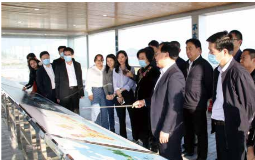
2020年12月28日至30日，市人大常委会组织深圳、汕头、惠州、汕尾、潮州、揭阳市的全国人大代表对汕头经济特区建设和推动沿海经济带发展等情况开展集中视察

一是保证人大工作的重要地位。汕头市各级党委始终把人大工作摆在党委工作的重要位置，把人大工作纳入总体工作布局，把人大工作摆上重要议事日程，统一谋划，统一部署，统一推进。健全完善党委领导人人大工作制度，及时研究解决人大工作中的重大问题，指导人大围绕大局开展工作、发挥作用。把人大立法、监督和重大事项决定工作纳入党委决策和落实体系，及时向市人大常委会组成人员通报党委的重大决策和工作部署，听取并吸纳相关意见建议。市