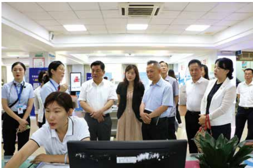
潮州市人大常委会负责同志率队调研市“数字政府”改革建设情况

充分发挥市人大常委会党组领学、促学作用。潮州市人大常委会党组充分发挥把方向、管大局、保落实作用，落实“第一议题”制度和理论学习中心组制度，把党史学习教育和人大工作实际有机结合起来，深入学习习近平总书记在党史学习教育动员会、在庆祝中国共产党成立100周年大会上的重要讲话精神以及《习近平论中国共产党历史》等指定书目，及时跟进学习习近平总书记最新重要讲话和重要指示批示精神。在市人大常委会主要负责同志的带动下，市人大常委会党组及机关党组领导干部重点围绕党团结带领人民探索建立、完善发展人民代表大会制度的光辉历程，