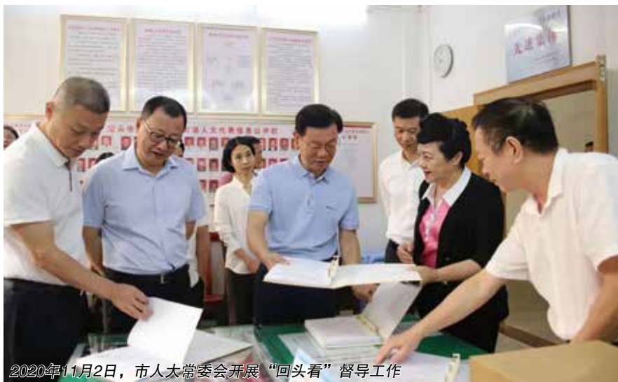
2020年11月2日，市人大常委会开展“回头看”督导工作

方式。除了召开座谈会听取报告等调研方式，汕头市人大常委会紧紧抓住人民需求，灵活运用调研方式，确保调研的情况真正反映民意，提高监督实效。如2020年下半年，市人大常委会机关多次接到群众反映东海岸新城新津片区内河涌污染及龙湖区新乡关水闸排污问题。常委会领导对此高度重视，提出具体督办要求，环境资源工委认真发挥监督职能作用，环资工委办公室多次开展暗访，实地察看河沟现场，了解沿岸民情民意，同时组织开展检查督办，召开座谈会听取有关单位情况汇报，督促推动解决水体污染甚至黑臭问题，助推构建和谐优美的人居环境。