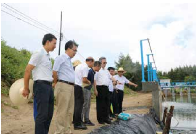
9月1日至2日，湛江市人大常委会负责同志率队到经开区、吴川市监督生态环境保护工作

加强经济民生监督。 聚焦经济高质量发展监督。评议营商环境优化提升工作情况，对市发改局等10个政府职能部门进行专项工作评议，推动营造法治化国际化便利化营商环境；听取和审议市政府关于2020年市级预算执行和其他财政收支审计工作的报告、2021年上半年国民经济和社会发展计划执行情况的报告等7项报告，开展“发挥金融作用打造现代化沿海经济带重要发展极”专题调研，推动财政金融健康稳定发展；听取市政府关于湛江市现代渔业发展情况的报告，推动现代渔业转型升级。聚焦生态环境监督。听取市政府关于《湛江市城市总体规划（2011—2020）》实施情况的报告，推动建设生态型海湾城市；听取和审议市政府关于加强市区停车场（停车位）建设和管理的议案、改善市区交通拥堵问题的议案办理方案落实情况的报告，并开展满意度测评，推动做好道路交通综合治理；听取市政府关于环境状况 and 环境保护目标完成情况的报告，推动打好污染防治攻坚战；开展《中华人民共和国环境噪声污染防治法》执法检查，推动解决建筑工地超时施工、机动车噪声影响和社会生活噪声扰民等问题。聚焦公正司法监督。听取和审议市人民检察院关于适用认罪认罚从宽制度情况的报告，推动检察机关高质量高效率适用认罪认罚从宽制度，