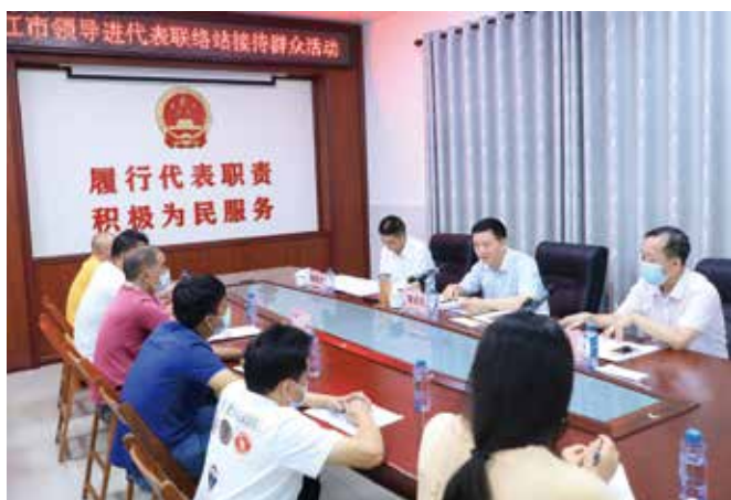
7月22日，湛江市府负责同志以普通代表身份到吴川市塘尾街道办人大代表中心联络站开展“更好发挥人大代表作用”主题活动