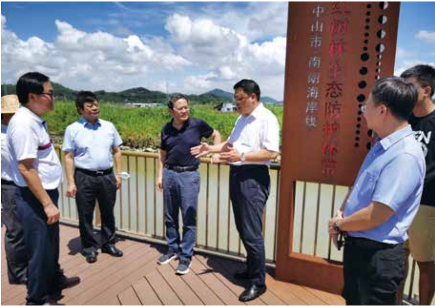
中山市人大常委会负责同志陪同省人大常委会调研组到南朗街道调研红树林保育工作