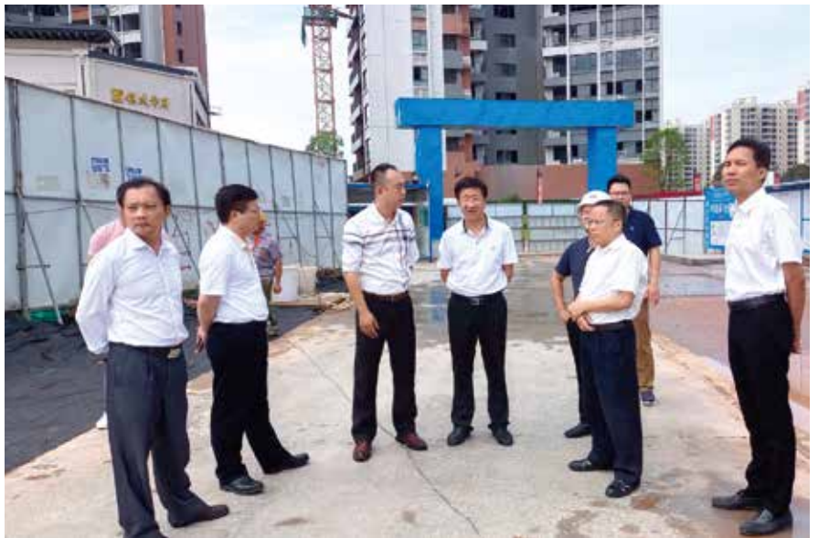
2021年5月，河源市人大常委会负责同志率队调研扬尘和固体废物污染防治工作

坚持把学习贯彻习近平新时代中国特色社会主义思想作为首要政治任务。 习近平总书记发表重要讲话、中央召开重要会议，市人大常委会党组及时跟进传达学习、抓好贯彻落实，通过持续深化学习新思想，不断提高政治判断力、政治领悟力、政治执行力，增强“四个意识”，坚定“四个自信”，做到“两