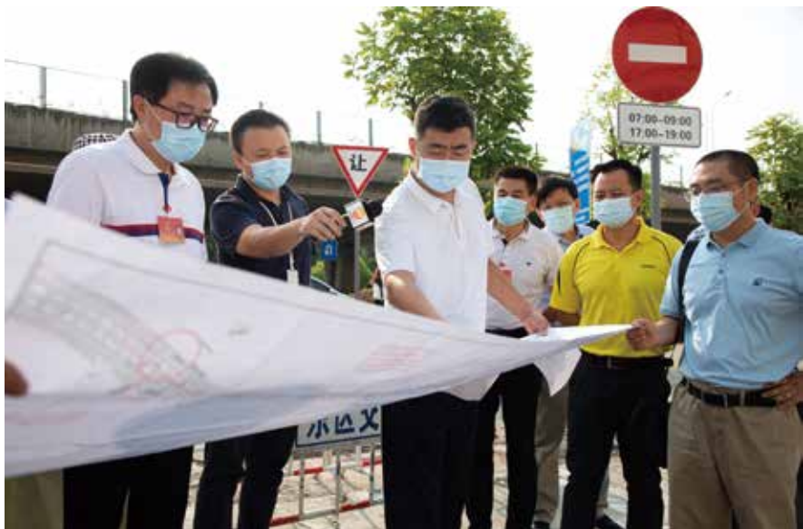
中山市人大常委会负责同志率队调研道路交通管理工作

要切实发挥代表主体作用。 实现中华民族伟大复兴的主体力量是人民群众，人大代表是人民群众的代言人。做好代表服务工作，发挥代表主体作用，是推进全过程人民民主的主要抓手。中山市人大着重抓住三个着力点：全面推进代表联络站建设。近三年建成120个代表