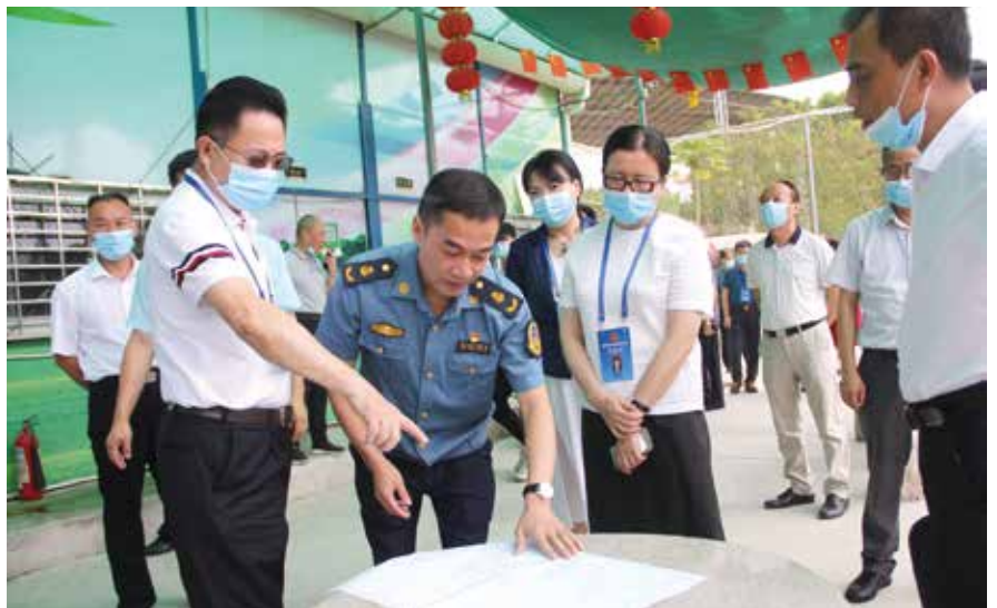
潮州市人大常委会组织市人大代表视察交通安全整治情况

通过学思践悟习近平新时代中国特色社会主义思想、习近平法治思想、习近平总书记关于坚持和完善人民代表大会制度的重要思想以及习近平总书记关于发展全过程人民民主的重要论述,潮州市人大常委会做了大量富有成效的工作,但与新时代人大工作的新任务、新要求相比,与人民群众的新需求、新时期相比,还存在一些需要不断提高的地方。接下来,我们将深入学习贯彻习近平总书记在庆祝中国共产党成立100周年大会的重要讲话精神,在市委的坚强领导下,坚持党的领导、人民当家作主、依法治国有机统一,深入开展人大制度理论研究和实践创新,扎实推进人大各项工作,为打造沿海经济带上的特色精品城市、把潮州建设得更加美丽作出新的更大贡献。■