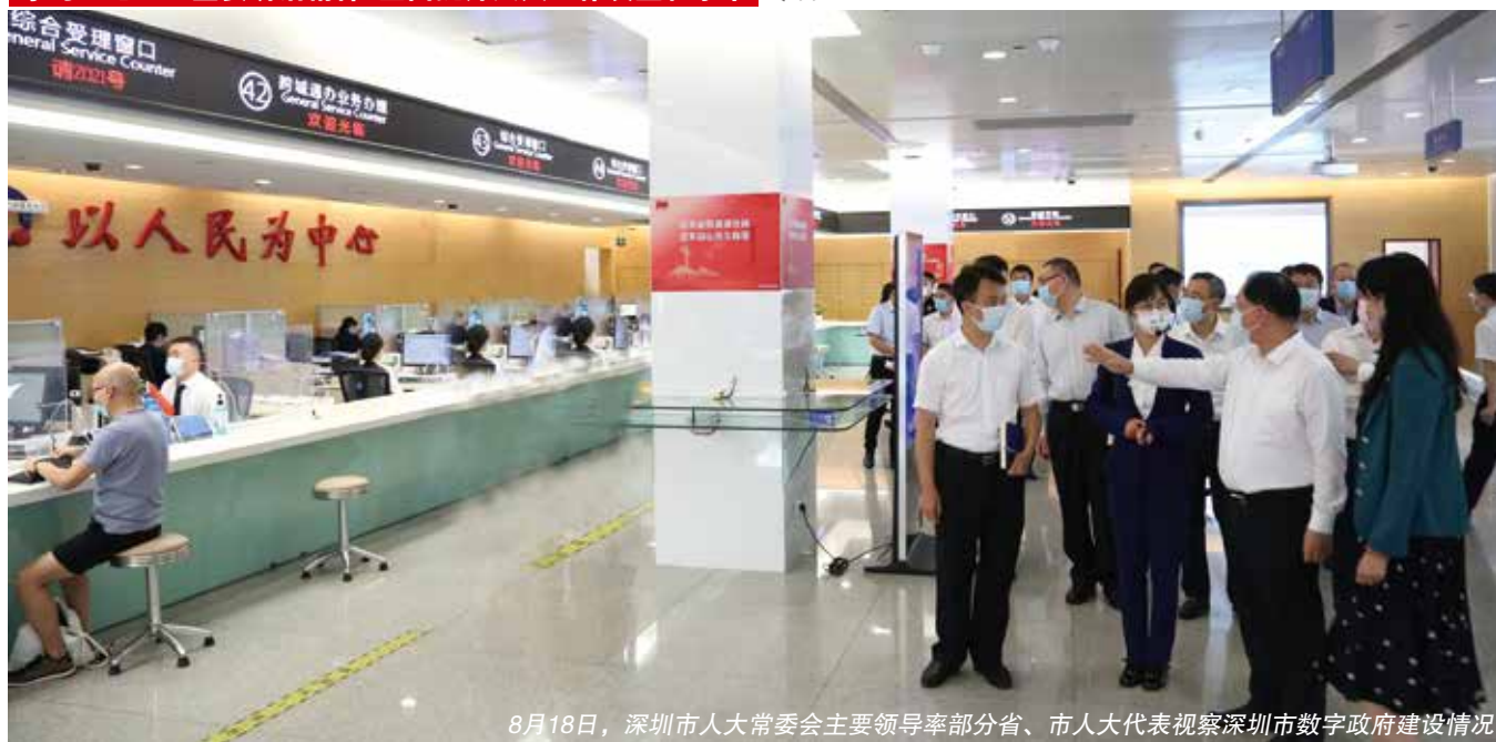
8月18日，深圳市人大常委会主要领导率部分省、市人大代表视察深圳市数字政府建设情况

大常委会坚持人大代表列席人大常委会、专门委员会会议制度，以及代表约见国家机关负责人制度，主动邀请代表参加立法调研、执法检查、专项视察等活动，设立基层立法联系点242个，让人大代表和人民群众直接参与人大立法、监督等各项工作，推进常委会组成人员联系代表、代表联系人民群众常态化、制度化。全面加强人大代表之家、代表社区联络站、代表联络点规范化建设，建立覆盖全国、省、市、区四级人大代表的社区联络站网络平台，实现代表联系群众“所有社区全覆盖、收集民意全方位、服务群众全天候”，打通联系人民群众的“最后一公里”，使人大代表联系人民群众形式更加多样、内容更加丰富、成效更加明显。