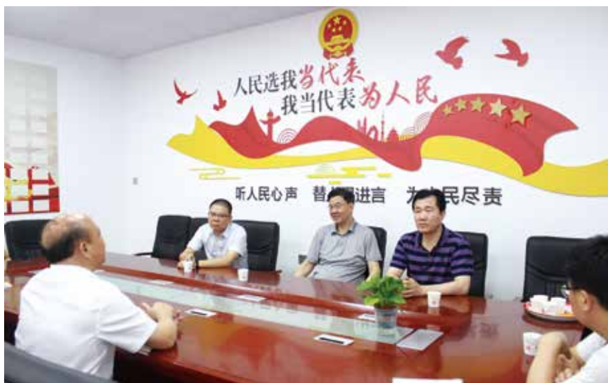
6月11日，揭阳市人大常委会负责同志率队到揭西县开展“我为群众办实事”实践活动

人大代表作为人民代表大会的主体，肩负着依法直接参与行使国家权力、管理国家和社会事务的重大使命，要积极作用、依法履行职责，练就植根人民群众、与群众保持密切联系的基本功。如何加强代表与群众的密切联系，人大代表联络站就是一个生动实践。