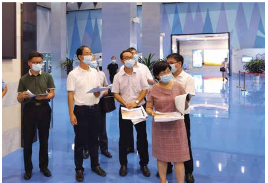
江门市人大常委会负责同志率队到江海基层立法联系点活动中心调研

加强队伍建设,提高立法能力。 立法工作是一项政治性、专业性、理论性、实践性很强的工作,需要培养一支政治坚定、业务过硬、肯奉献能担当的立法队伍。不仅要培养人大立法人才,还要培养政府相关职能部门从事法制工作的人员,逐步树立起“小切口”立法理念。继续加强与高校、研究机构的合作,加强“小切口”立法理论支撑。继续完善立法专家库制度,拓展“小切口”知识厚度。■