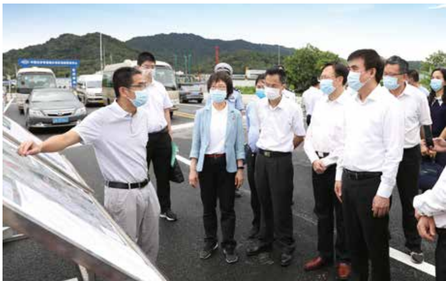
7月21日，广州市人大常委会主要领导率队开展加强道路交通微循环代表重点建议办理情况专题调研

广州市委高度重视人大工作。今年出台进一步加强新时代人大工作责任分解清单，提出16个方面73条措施，其中就加强区镇（街）人大工作和建设提出10条措施，推动基层人大工作再上新台阶。去年以来，市委主要领导对人大工作作出批示108次，其中涉及基层人大