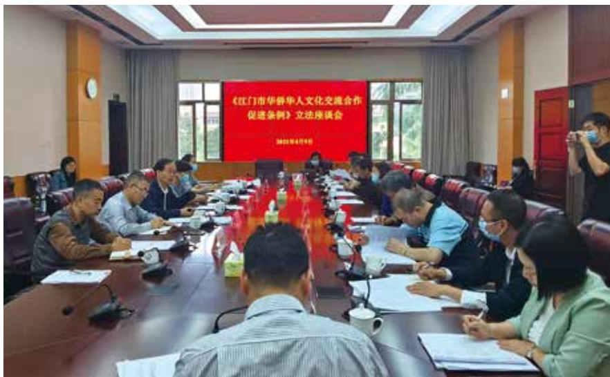
4月9日，江门市人大常委会召开《江门市华侨华人文化交流合作促进条例》立法座谈会

在地方特色上力求精准。地方特色是地方立法的灵魂，是地方立法的生命力所在。江门是著名的“中国侨都”，“侨”是江门的名片，也是江门的特色。近年来，我们在“侨”的立法上认真下足功夫，作为特色和重点工作去开展，出台了《江门市历史文化街区和历史建筑保护条例》，着力保护一片片带有浓厚异域建筑风格的历史风貌区和一座座中西合璧的骑楼、碉楼和洋楼，守住侨乡文脉，守住记忆，守住乡愁；出台了《江门市文明行为促进条例》，要求尊重华侨华人生活习惯，传承和弘扬侨乡优秀传统文化。