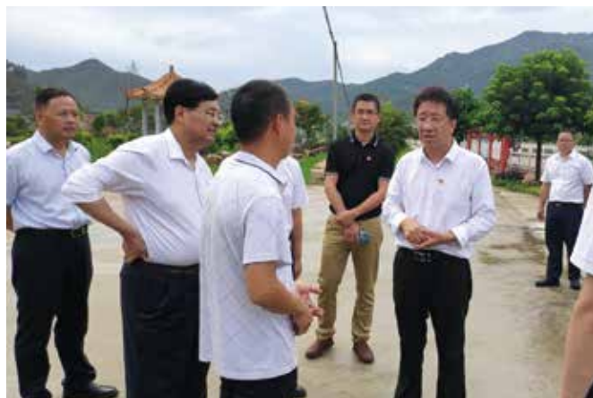
2021年6月，河源市人大常委会负责同志率队到紫金县调研乡村振兴工作

助力绿色发展。 市人大常委会践行“绿水青山就是金山银山”理念，发挥立法、监督等职能作用，促进生态环境持续改善，加快建设绿色发展示范区，巩固和提升河源发展核心竞争力。坚持每年听取审议环境状况和环境保护目标完成情况报告，督促市政府持之以恒抓好环境状况持续改善、推动环境保护达到预期目标。继续跟踪督办综合治理东江新丰江市区段水环境的议案，督促市政府压实责任、综合施策，确保东江新丰江市区段水环境得到明显改善，持续巩固河源绿色生态优势。围绕温泉资源管理和开发利用开展专题调研，推动市政府加大资源勘查力度、科学规划有序