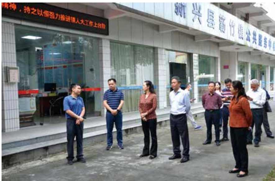
2020年10月28日，云浮市人大常委会负责同志率队到新兴县检查督导贯彻落实省委、市委人大工作会议精神“回头看”工作情况

习近平总书记指出，人民群众对立法的期盼，已经不是有没有，而是好不好、管用不管用、能不能解决实际问题。针对问题立法、立法解决问题就是地方立法工作的重要目标，“小切口”立法可以做到问题更聚焦，也更强调着眼于具体问题的解决。栗战书委员长强调，紧密结合地方实际，突出地方立法特色，善于通过“小切口”解决实际问题，可以搞一些“大块头”，也要搞一些“小快灵”，增强立法的针对性、适用性、可操作性。对取得了立法权的地级市来说，法规适用范围小，针对本地突出问题对症下药，起草制定“小切口、立得住、真管用”的法规，更能解决人民群众关心的实际问题，有效推动民生改善和社会治理创新。