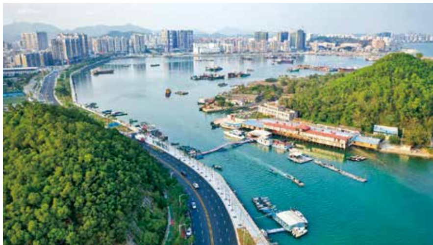
汕尾品清湖碧道

推进“智慧人大”建设。 建设好汕尾“智慧人大”,完善代表履职系统,进一步拓宽代表履职交流、知情知政渠道,满足地方人大代表履职工作的需要。建立统一的议案建议管理系统,实现办理过程的“全程可视”。构建人大代表与“一府一委两院”之间、选民之间的良性互动,推动人大代表履职的积极性,建好用好人大双联工作平台,实现网上代表联络站全覆盖,进一步密切代表与人民群众的联系,实现“线上线下”代表联系选民的双渠道运行,通过构建常委会与代表联系平台、代表沟通交流平台,实现代表与常委会、选民以及代表之间“24小时不打烊”交流互动。■