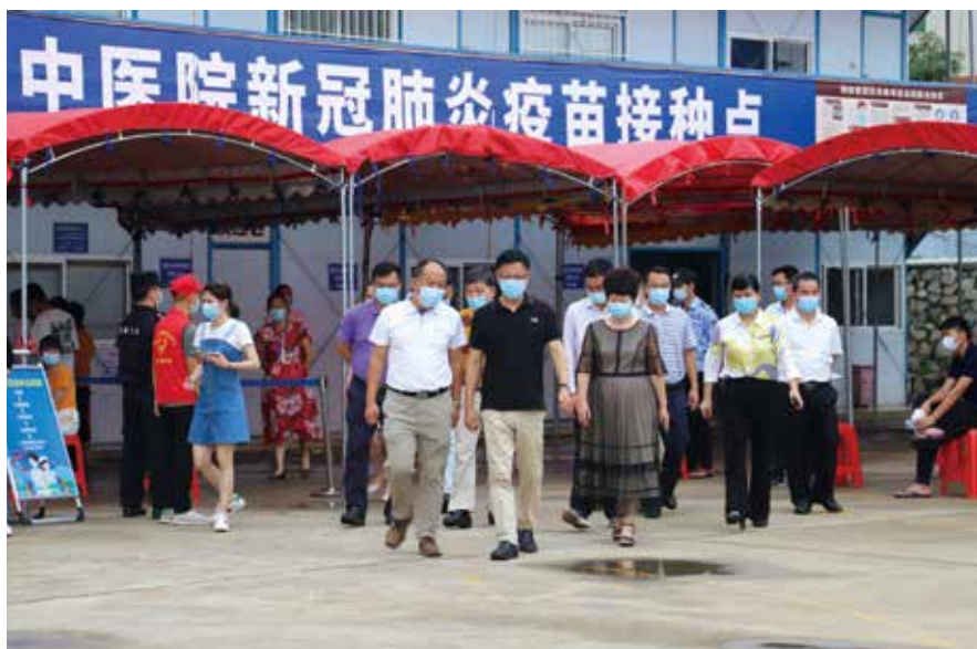
6月1日，茂名市人大常委会负责同志率队到高州中医院督导新冠肺炎疫情常态化防控工作

贯彻习近平新时代中国特色社会主义思想作为首要政治任务，作为党组会议的第一议题，结合“不忘初心、牢记使命”主题教育、党史学习教育等，第一时间传达学习贯彻习近平总书记重要讲话和重要指示批示精神，深入学习贯彻党的十九大和十九届历次全会精神、习近平法治思想、习近平总书记关于坚持和完善人民代表大会制度的重要思想，自觉用党的创新理论武装头脑、统揽和指导人大一切工作，切实增强“四个意识”，坚定“四个自信”，做到“两个维护”。