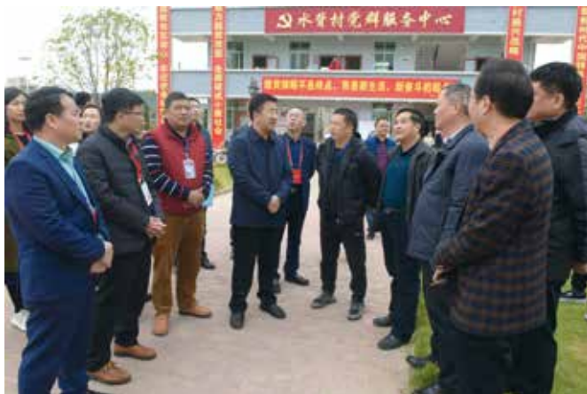
2020年12月1日河源市人大常委会组织三级人大代表视察农村住房建设管理工作，加强农房管控，提升乡村风貌

项。立足市委认可、政府关心、群众关切、人大可为的大事，推动重大决策科学民主，今年计划对6项重大事项工作进行讨论决定。人事任免保一致，把党管干部与人大依法选举任免有机结合起来，确保党委的人事意图不折不扣得到贯彻落实。近几年来，常委会任免的人事绝大部分都是满票通过。