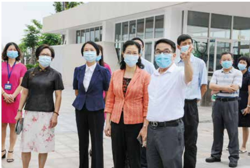
2020年9月15日，佛山市人大常委会负责同志率部分市人大代表对增加佛山市学前及义务教育学位供给情况开展专题调研

中国共产党始终代表最广大人民根本利益，与人民休戚与共、生死相依。社会主义民主政治发展史、新中国法治发展史充分证明，只有在党的领导下依法治国、厉行法治，人民当家作主才能充分实现。人民民主之所以是全过程民主，最为关键的是始终有党的领导这一