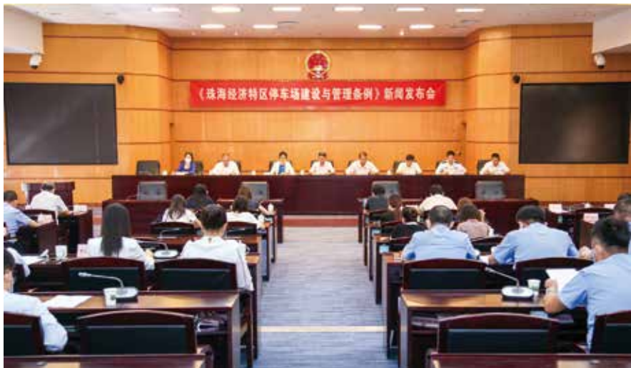
8月24日，珠海市人大常委会召开《珠海经济特区停车场建设与管理条例》新闻发布会

习近平总书记在“七一”重要讲话中强调要“发展全过程人民民主”。发展全过程人民民主，体现了人民民主覆盖的广泛性、过程的完整性、内容的全面性，彰显了人民民主的显著优势，具有重大理论意义和现实意义。人民代表大会制度是中国人民当家作主的重要途径和最高实现形式，是全过程民主实践的主渠道。我们要深入理解把握全过程民主这一重大论断的深刻内涵、精神实质和原则要求，把全过程人民民主贯彻到人大工作的全过程和各方面，推进全过程人民民主在珠海的新实践。一是坚持立法为民。我们严格贯彻科学、民主、依法立法的原则，注重在立法全过程各