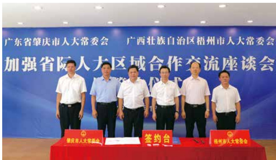
8月18日，肇庆市人大常委会与广西梧州市人大常委会召开“加强省际人大区域合作交流座谈会”

拓展“我为群众办实事”实践活动的一个重要内容。近年来，市人大代表围绕全市改革发展稳定大局、人民群众普遍关心的问题提出的《关于加快建设大榄岗长者公园、羚山涌碧道公园议案》等议案以及《关于推进我市垃圾分类的建议》等537件建议得到有效办理，办复率100%，满意率90%以上。在办理过程中，市人大常委会建立各专委会、工委归口督办代表议案建议制度，将相关代表议案建议交各专委会、工委进行督办。有关专委会、工委根据各自的督办任务，制定相关督办方案，并通过实地督查、座谈面谈、发提醒函、电话督办等多种方式，持续传导压力、跟踪问效，以代表建议的落实落地推动解决一批群众“急难愁盼”问题，努力提升群众获得感和满意度。