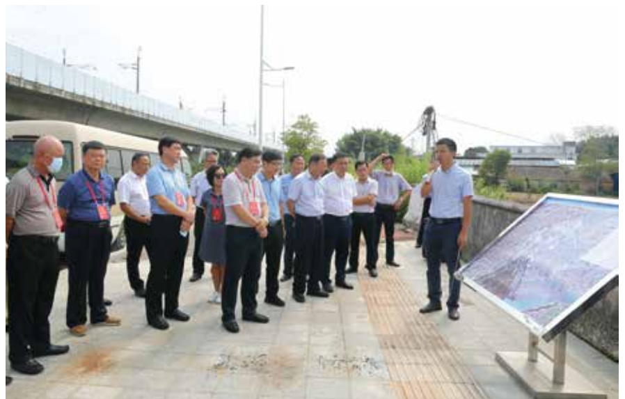
7月28日，肇庆市人大常委会组织省人大代表开展水污染防治和万里碧道建设专题调研

始终坚定人民代表大会制度自信，开展全方位、立体式宣传，讲好人大故事，传递代表声音，传播人大正能量。