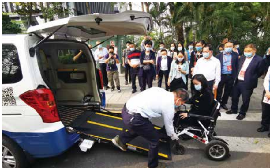
3月16日，深圳市人大常委会主要领导率队视察深圳市无障碍环境建设情况

坚持党的领导是做好人大工作的根本保证和关键所在。深圳市人大常委会始终把坚持党的领导贯穿到人大工作的全过程各方面，不断增强“四个意识”、坚定“四个自信”、做到“两个维护”，切实提高政治判断力、政治领悟力、政治执行力，认真贯彻市委坚决落实“两