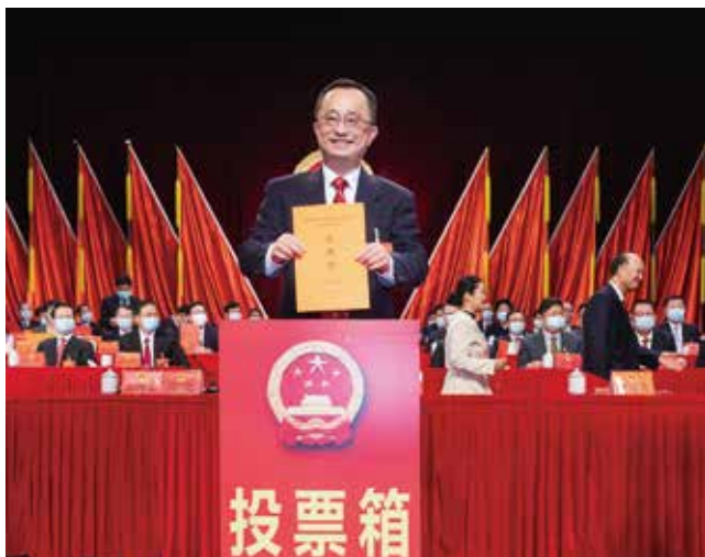
梅州市七届人大八次会议首次票决出十件民生实事

俱进原则，以坚持和完善人民代表大会制度为重点，扩大人民有序参与人大工作。尤其在立法工作方面，坚持健全立法制度，促进立法规范，先后出台了立法公开、论证、听证、评估、调研、规范性文件备案审查等一系列立法工作配套制度，把全过程人民民主贯彻到立法工作各环节，使立法工作更具可操作性、更加有章可循。其中，为规范梅州市地方性法规立法公开活动，推进立法工作的民主化、科学化，提高立法质量，常委会制定了《梅州市人民代表大会常务委员会立法公开工作规定》，对立法规划和立法计划公开征求建议项目、法规草案公开征求意见等作出了详细的规定。此外，常委会还坚持完善立法机构，提高立法能力，建立了“梅州市人大常委会基层立法联系点”，为立法工作提供坚强保障，促进了立法的精细化和科学化，进一步彰显了全过程人民民主的优越性。以《梅州市红色资源保护条例》的立法实践为例，常委会按照《梅州市人民代表大会常务委员会立法公开工作规定》，通过网络、座谈会、调研等各种途径向社会和代表、专家等征求意见，人民群众对草案征求意见反映热烈，共提出红色资源的修缮、修复费用要由保护责任人承担或者筹集，红色资源保护与利用要与扶贫开发、乡村振兴和旅游发展相结合等61条意见建议，其中16条