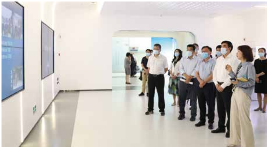
5月20日，广州市人大常委会主要领导率队到天河区调研软件和信息技术服务业发展情况

人大将代表工作融入市委“令行禁止、有呼必应”党建引领基层共建共治共享社会治理格局，广泛运用天河区“随手拍”网络监督等做法，力求把人民群众诉求第一时间解决在第一线。二是“夜间接访”方便群众。越秀区东湖新村代表联络站连续10多年组织代表每周二夜间接待选民群众，这一做法得到市委主要领导肯定并在全市范围推行。三是“民情观察员”细察民情。荔湾区选取700多名具有群众基础的热心居民、退休老党员担任“民情观察员”，利用闲暇时间收集群众关注的热点问题，助力人大代表了解社情民意。四是“代表网格化”促履职常态化。白云区三元里街创设人大代表进网格，与社区“五长”共同参与社区治理机制，及时化解邻里纠纷、社会治安等问题。五是“服务圈”服务企业、群众。黄埔区夏港街针对辖内企业众多的情况，依托“一中心三站十一点”平台，深化代表履职活动，建立“企业服务圈”和“社区服务圈”。六是“参与式”预算监督守好“钱袋子”。天河区探索开展参与式预算审查监督，组织代表提前介入审查、全过程跟踪监督，受到全国人大常委会预算工委充分肯定并在全国人大微信公众号上推送。七是“五个一”形成全链条闭环监督。海珠区对今年民生实事项目和重点监督议题等实行“一事一专班”“一季一通报”“半年一视察”“一年一审议”“年终一测评”，以“五个一”全链条闭环式监督促进履职提质增效。八是“履职公