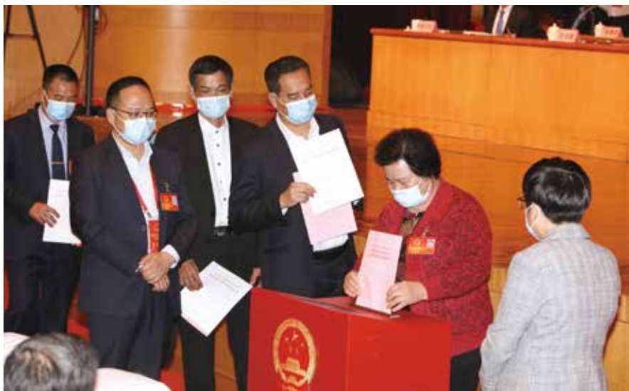
1月30日，汕尾市人大代表票决确定2021年汕尾市十件民生实事项目，并对2020年汕尾市十件民生实事项目完成情况进行满意度测评。图为市人大代表投表决票、测评票

以科学立法、民主立法、依法立法的生动实践展示全过程人民民主。2015年12月依法获得地方立法权以来，市人大常委会坚持“党委领导、人大主导、政府依托、各方参与”的立法工作格局，坚持人民有所呼、立法有所应，围绕把汕尾建设成为沿海经济带靓丽明珠的目标定位，扎实推进立法工作，用法治来呵护百姓的幸福生活。先后颁布实施了汕尾市制定地方性法规条例、水环境保护条例、城市市容和环境卫生管理条例、居住出租房屋安全管理条例、电力设施保护和供用电秩序维护条例、品清湖环境保护条例、革命老区红色资源保护条