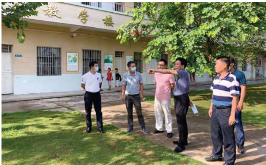
6月17日，惠州市人大常委会负责同志率队走访调研挂钩联系点惠东县梁化镇七星墩村

坚持把充分发挥代表主体作用作为发展全过程人民民主的实现路径。 人大代表来自人民、代表人民，发挥代表主体作用对发展全过程人民民主具有重要的实践意义。市人大常委会着力提升代表服务保障水平，健全完善代表工作机制，加强代表履职能力培训，扩大代表对常委会及“一府两院”工作的参与度。近5年来，共组织和邀请代表参加各类视察、调研等活动4700多人次，邀请代表列席常委会会议390人次。在全省率先建立市县镇（乡）三级人大代表履职电子档案，全市市、县、镇共5018名代表的履职情况全部纳入信息化管理。丰富代表活动形式内容。连续14年开展市人大“代表统一活动日”活动，形成代表活动金字招牌。自2018年起组织省、市、县、镇五级人大代表开展“更好发挥代表作用”主题活动，4年来共有五级人大代表约9700人次参加活动，通过专题调研、集中视察、代表联络站接待群众等形式开展活动1400余场次，收集群众反映问题1100余件，形成闭会期间代表建议723件，推动解决一批群众关切的难点堵点问题，进一步履行了人大代表“我为民、我履职，我行动”的承诺。创新代表建议办理机制。2020年起，惠州决定每年安排2500万元专项资金用于代表建议办理工作，市人大常委会建立代表建议办理专项资金工作机制。两年来落实5000万资金推动解决了62个涉及公共设施完善、修桥灌溉照明等民生问题，达到“当年建议、当年拨款、当年落实”立竿见影的效果，集中解决人大代表建议中无预算列支、无项目支撑而群众反映强烈的“急、难、老、小”问题。在市人大常委会引领和支持下，