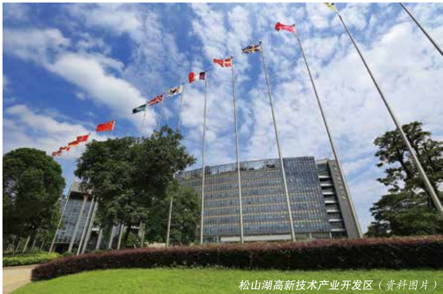
松山湖高新技术产业开发区（资料图片）