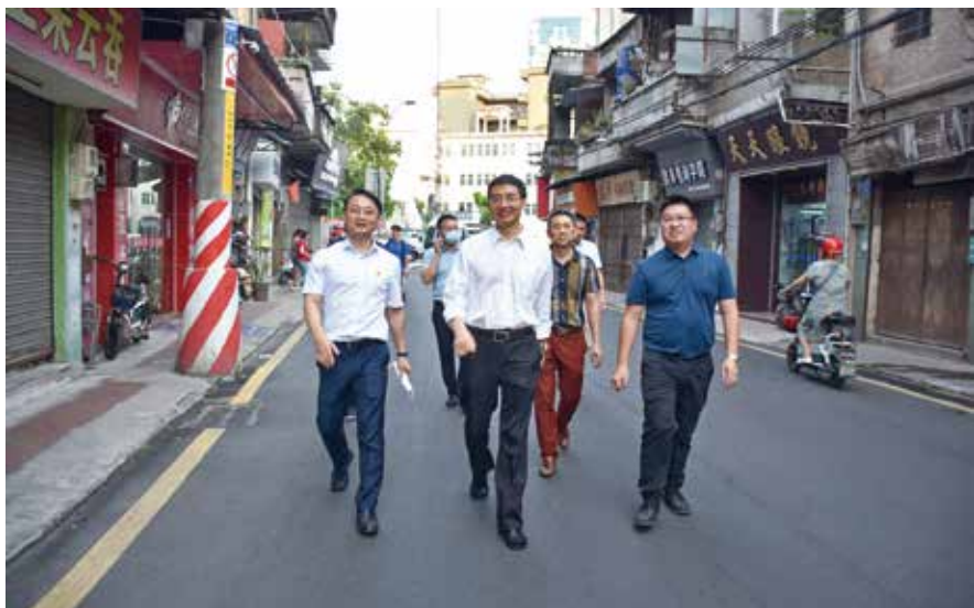
7月13日，东莞市人大常委会负责同志率队到石龙镇调研督导基层人大“巩固基层、强化履职”两年行动工作

法律或政策虽有原则性规定、但没有操作办法的事项，可先行探索、细化办法。 比如，民生实事人大代表票决制，是习近平总书记以人民为中心的发展思想在浙江的生动实践，浙江省推动此项工作在市县乡三级层面深入实施。东莞市人大常委会认真落实省的部署，把民生实事票决制工作作为基层人大服务党委中心工作的一项实践创新，通过做实决定工作、做深监督工作、做活代表工作，推动镇级民生实事代表票决制全覆盖，2020年全市28个镇共决出民生实事项目295个，总投资规模344.26亿元。各镇通过开展票决工作，使公共服务范围最大限度地覆盖辖区群众，实现重大事项由“难以界定”向“落地细化”转变，政府决策由“为民做主”向“由民作主”转变。又如，关于街道人大工作规范化建设，地方组织法规定设立人大街道工委，但对其机构的具体职能等有待作出