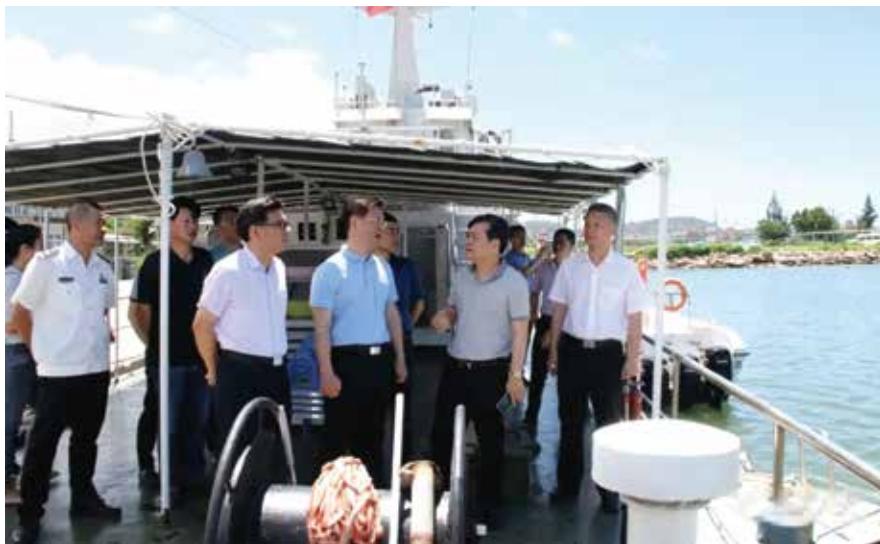
2020年6月7日，汕头市人大常委会负责同志率队赴南澳县督导检查防汛工作