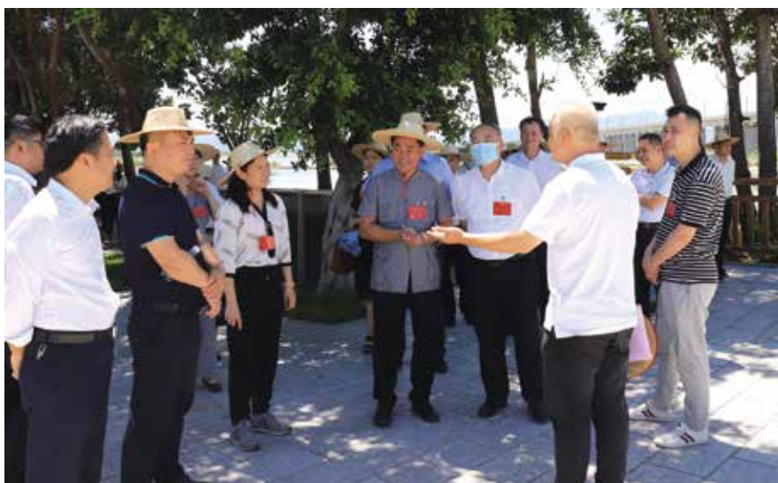
7月13日，汕尾市人大常委会组织代表围绕“提升公共卫生防控救治能力”开展专题调研

紧贴民心讨论决定重大事项，推进科学民主决策。 市人大常委会坚持守正创新，不断总结、开拓依法行使重大事项决定权的思路和方法，形成了较为完备的讨论决定重大事项的工作机制。2021年2月1日起，《汕尾市人民代表大会常务委员会讨论决定重大事项规定》施行，该规定明确界定了讨论决定重大事项的内容和范围，规定了讨论决定重大事项的方法和要求，使重大事项决定权的履行更加规范科学，效果更加明显。本届以来，市人大常委会共作出重大事项决定决议28个，先后批准年度市级决算、地方政府债务限额和市级财政预算调整方案以及海汕路西闸至埔边段综合改造工程等重点建设项目，推动《海陆丰革命老区振兴发展规划》政策红利落地落实。同时，建立了市政府向市人大常委会报告国有资产、政府债务管理情况报告。为贯彻落实习近平总书记关于疫情防控重要指示精神和党中央、省委和市委的部署要求，坚决打赢疫情防控的人民战争、总体战、阻击战，市人大常委会