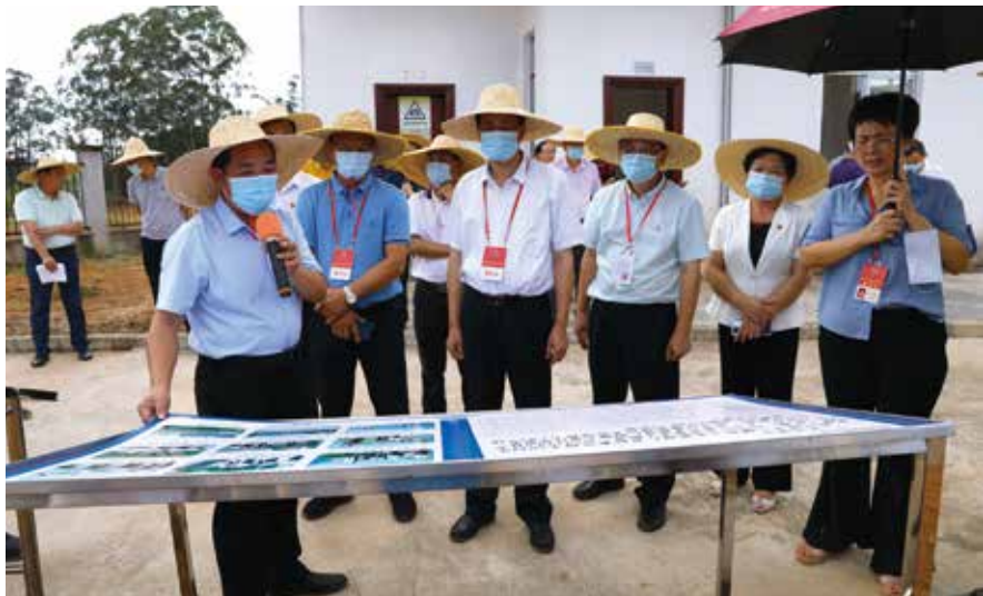
阳江市人大常委会负责同志率队开展水污染治理专题视察

紧扣“双联系”工作，更好发挥代表作用。 一方面丰富代表主题活动。今年6月，市人大常委会印发《关于围绕全面推进健康阳江建设开展“更好发挥人大代表作用”主题活动的实施方案》，