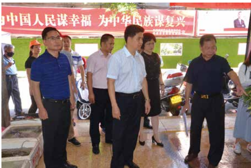
梅州市人大常委会负责同志率队到梅江区开展专题调研

突出司法工作监督，保障社会公平正义。 近年来，市人大常委会密切关注新形势下司法工作的新特点和人民群众对司法监督工作的新期待，在精准监督上下功夫、在有效监督上显作为，确保司法监督不缺位、不越位、不错位，收到了明显的监督成效。先后听取和审议了市中级人民法院关于“加快推进基本解决执行难”工作的报告，开展了梅州司法所建设情况、梅州监狱建设和工作开展情况的视察，开展了《未成年人保护法》等13项法律法规实施情况的执法检查，制定了《梅州市人民代表大会常务委员会监督司法工作规定》，推动了相关法律在梅州市的正确贯彻执行，维护了社会公平正义。此外，切实加强宪法和《民法典》宣传和实施监督，并及时开展《广东省实施宪法宣誓制度办法》实施情况执法检查，弘扬宪法精神，维护宪法权威，推动宪法实施。