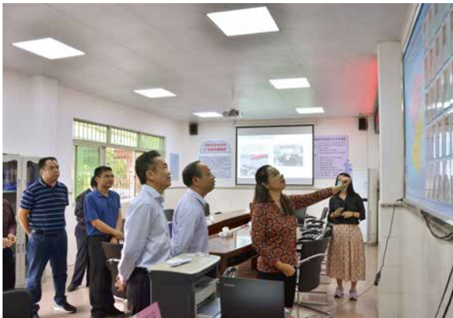
2020年10月28日，云浮市人大常委会负责同志率队到新兴县簕竹镇良洞片区人大代表联络站视察

门前标识牌告诉你”，在建设中心联络站+村、居（片区）联络站的基础上，进一步探索延伸代表联系群众的平台，打通代表联系服务群众“最后一米”。去年以来，云浮市各镇（街）人大开展“人大代表户”挂牌活动，在人大代表的家门口统一挂上“人大代表户”标识牌，人大代表的家成为了联系服务群众最近的窗口、收集社情民意最前的阵地。通过门前亮身份，人大代表履职为民的动力进一步增强，基层人民群众的“急难愁盼”问题得到进一步解决。