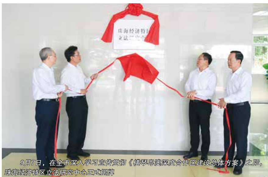
9月7日，在全市深入学习宣传贯彻《横琴粤澳深度合作区建设总体方案》之际，珠海经济特区立法研究中心正式揭牌

习近平总书记在“七一”重要讲话中强调，中国共产党领导是中国特色社会主义最本质的特征，是中国特色社会主义制度的最大优势，是党和国家的根本所在、命脉所在，是全国各族人民的利益所系、命运所系。人大机关是党领导下的重要政治机关，理应在加强党的领导和党的建设方面走在前、作表率。我们严格落实党领导人大工作的各项机制，不折不扣贯彻中央和省委、市委决策部署，保证党的主张和意图贯彻到人大工作中。严格落实请示报告制度，常委会工作报告、年度工作要点、立法计划、监督计划以及其他重要工作、重大事项均报请市委同意后实施。