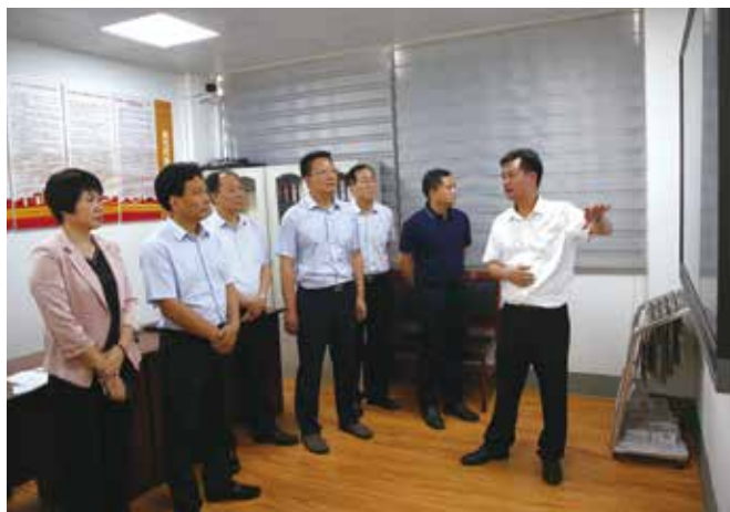
5月14日，惠州市人大常委会在惠东县稔山镇召开全市县乡人大“巩固基础、强化履职”两年行动推进会

市人大常委会切实履行新时代人大工作职责，把加强常委会和机关建设作为发展全过程人民民主的基础性工作抓紧抓实抓好，坚持守正创新，践行群众路线，大力提升能力素质，努力建设忠诚履职的工作机关、人民信赖的代表机关。突出“严”字为先抓党建。学思践悟新思想，旗帜鲜明讲政治，深入开展“不忘初心、牢记使命”主题教育和党史学习教育，引导机关党员干部守初心、担使命、善作为，为人大事业不懈奋斗。突出“强”字为要增本领。近5年来依托高等院校开展“习近平新时代中国特色社会主义思想”“习近平法治思想”等主题培训15场次，集中培训机关干部职工750人次，不断强化依法履职、服务为民的能力和水平。突出“实”字为基转作风。深入开展机关作风整顿等活动，教育引导机关党员干部自觉讲党性、重品行、作表率。扎实推进“我为群众办实事”实践活动，办实办好13件市人大机关“办实事开新局·十惠行动”重点民生项目，用心用力用情为群众办实事解难题。■