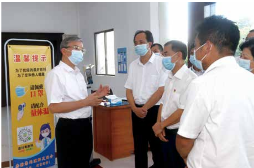
阳江市委书记、市人大常委会党组书记林道平到阳春市岗美镇参加“更好发挥人大代表作用”主题活动，听取群众意见

筑牢人大履职的思想根基。 坚持把习近平总书记关于坚持和完善人民代表大会制度的重要思想作为全市人大履职的行动指南。去年12月以市委理论中心组名义率先举办“学习贯彻习近平总书记关于坚持和完善人民代表大会制度的重要思想”专题报告会，推动习近平总书记关于坚持和完善人民代表大会制度的重要思想以及人大制度理论列入