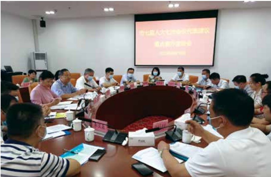
6月16日，清远市人大常委会负责同志参加代表建议重点督办活动

议督办，规范完善代表建议办理机制，激励代表履职实干。市七届人大一次会议以来代表提出的意见建议全部办理并答复，代表满意和基本满意率达到98%以上，有效激发了代表履职干事的积极性。先后在《人民日报》《人民代表报》等中央和省级主流媒体登载报道代表履职典型事例近100篇，加强宣传报道，代表履职的热情十分高涨。