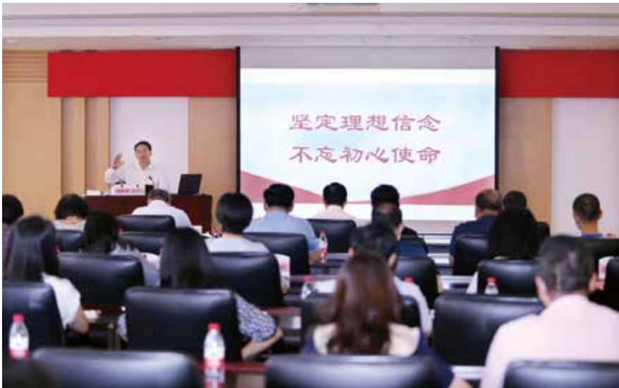
8月6日，东莞市人大常委会负责同志为机关党员干部讲党史学习教育专题党课

2016年12月中央经济工作会议上，习近平总书记强调“稳中求进工作总基调是我们治国理政的重要原则”。2020年6月，“坚持稳中求进工作总基调”写入全国人大常委会工作报告，成为人大工作总要求之一。坚持稳中求进，“稳”是基础、是前提，“进”是方向、是目标。具体到人大工作，“稳”，就是要以习近平总书记关于坚持和完善人民代表大会制度的重要思想为指导，坚持党的领导、人民当家作主、依法治国有机统一。“进”，就是要与时俱进，实现新作为，不断取得新成绩新进展。