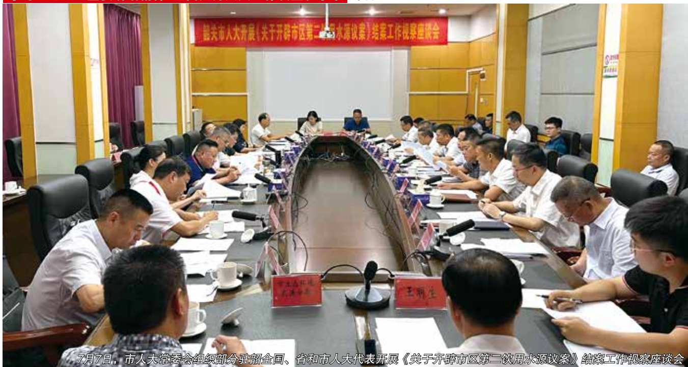
7月7日，市人大常委会组织部分驻韶全国、省和市人大代表开展《关于开辟市区第二饮用水源议案》结案工作视察座谈会

常委会认真贯彻落实总书记重要讲话精神，一是依法保障人民实行民主选举，经市委同意，转发了《中共韶关市人大常委会党组关于县镇人大换届选举工作的意见》，会同市委组织部、市委统战部召开了市县镇三级人大换届选举工作会议，部署了换届选举具体工作，出台了《韶关市人大常委会指导联系县镇人大换届选举工作方案》，常委会领导班子成员每月至少一次到县（市、区）联系指导，直到换届选举工作结束，目前换届选举各个阶段的相关工作正稳步推进。二是依法保障人民实行民主协商、民主决策，在市、县、镇三级人大全面推行民生实事代表票决制，通过一张张选票，把实事项目的最终确定权完全地交到代表手中，人民群众通过自己选出的人大代表，事实上成为民生实事项目的建议者、决策者、监督者和最终的受益者，人民当家作主的内涵在人大工作实践中得以充实和丰富。三是依法保障人民实行民主管理，坚持邀请人大代表列席常委会会议，支持代表在会议上提出建议意见，保障人民通过自己选出的人大代表，参与国家事务和经济社会各项事业的管理。逐步规范建设代表联络站，共建成代表联络站611个，其中镇