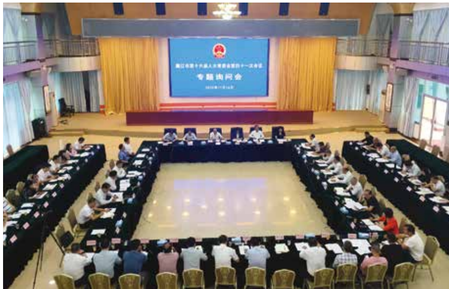
廉江市人大常委会专题询问会现场