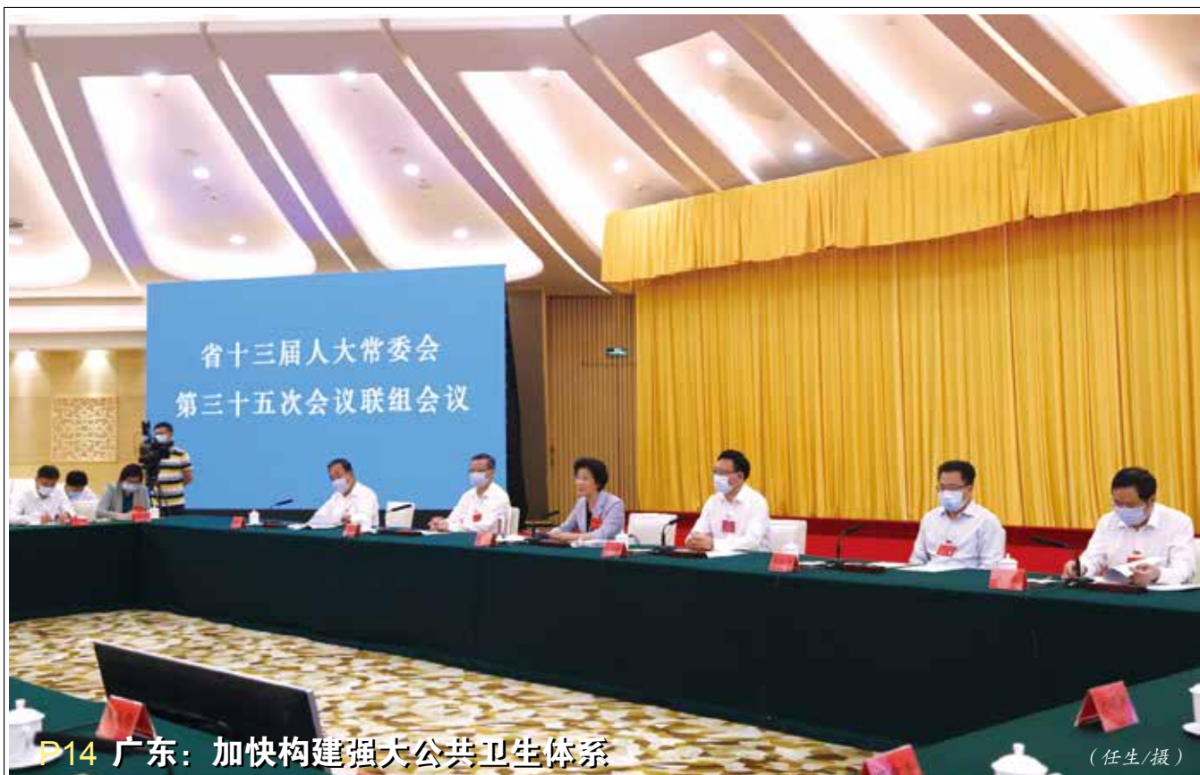
P14 广东：加快构建强大公共卫生体系