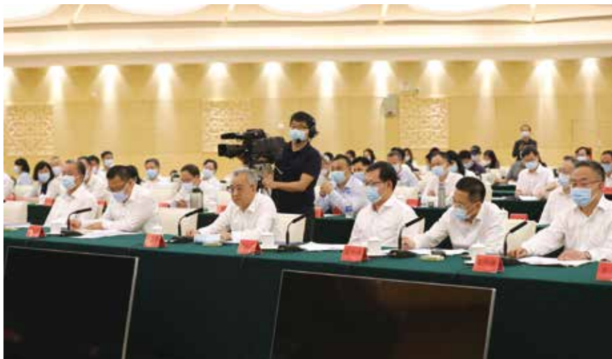
省政府副省长陈良贤及省政府有关部门负责人回答委员提问

推动高灵敏度快速检测试剂技术取得突破。围绕病人救治，深入总结在防治新冠肺炎方面的经验，进一步加强中药有效活性成分筛选。三是建立更加高效的科研攻关协同机制，推动政产学研医精准合作。组织高校、科研院所、企业以及公共卫生科研平台，资源共享、优势互补，开展“大联合、大协作、大团队”协同攻关，提升公共卫生领域科技引领性和凝聚力。