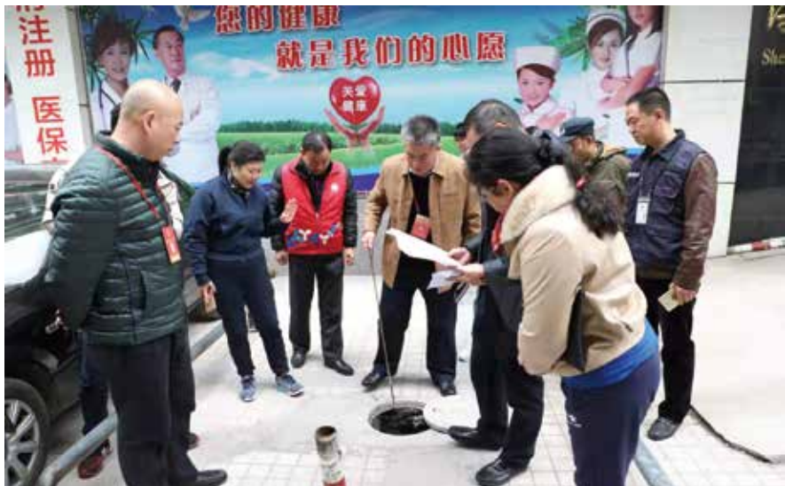
深圳市南山区南头街道人大工委组织人大代表视察田厦糖烟酒宿舍楼管道堵塞问题