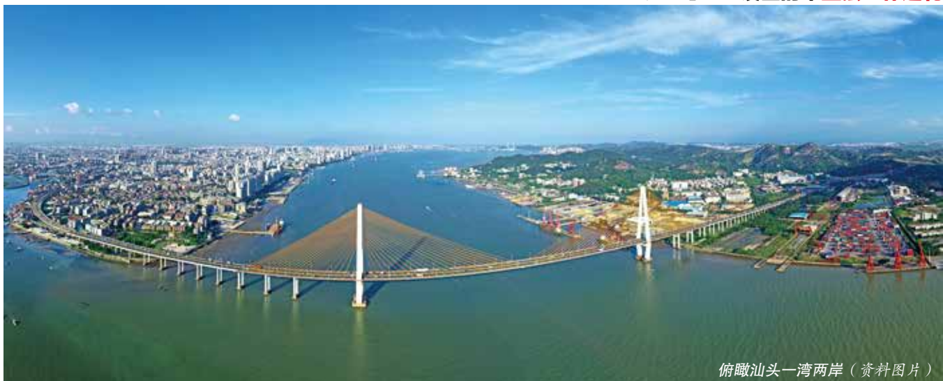
俯瞰汕头一湾两岸（资料图片）