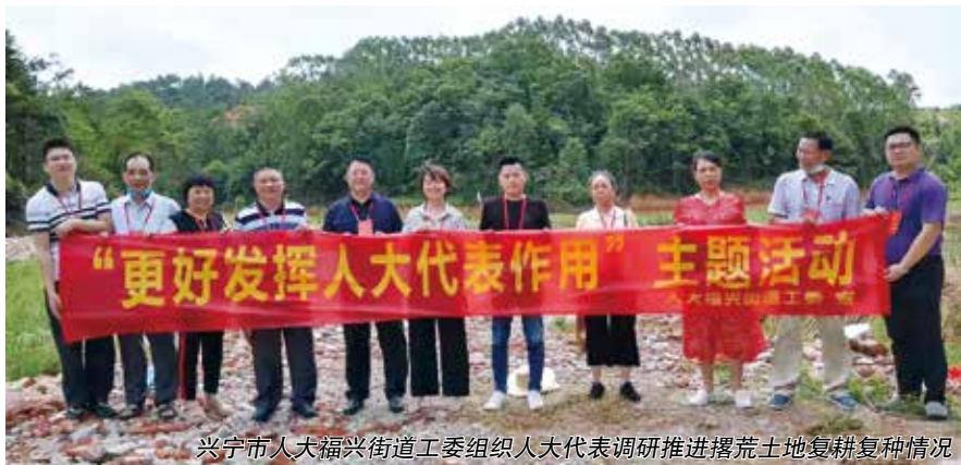
兴宁市人大常委会组织人大代表调研推进撂荒地复耕复种情况

今年7月主题活动期间，兴宁市人大常委会以主题活动为契机，充分发挥人大代表作用，以更为高涨的热情推动解决群众“急难愁盼”问题。