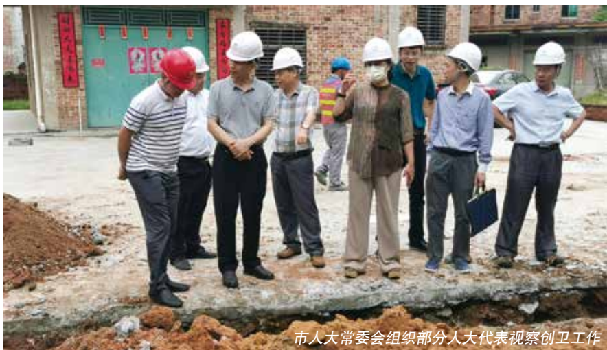
市人大常委会组织部分人大代表视察创卫工作