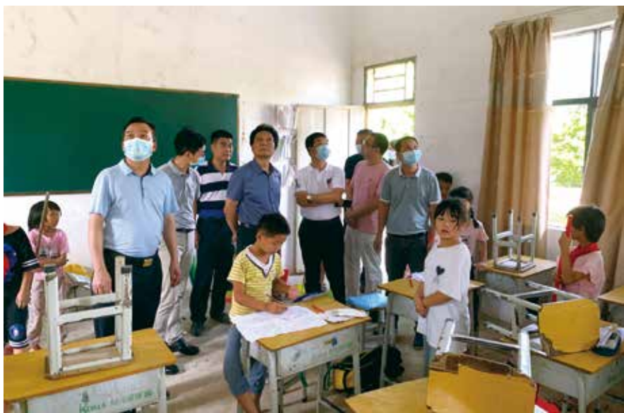
6月17日，惠州市人大常委会调研组到惠东县梁化镇七星墩村小学调研代表建议办理专项资金项目实施情况

办理代表建议是做好各项工作的制度性安排，但是客观上办理工作往往会因“无预算不支出”而导致“无资金不办理”的情况，而且有限的财政资金无法包揽办理所有建议。惠州市设立代表建议办理专项资金，开辟了以国家权力机关制度之力有效解决民生问题的新途径。将2500万元专项资金安排由本级财政专户储存，按财政专项资金管理使用，单独核算，专款专用，并由市人大常委会工作机构、财政和承办单位共同监督实施，审计部门按照年度专项审计，且