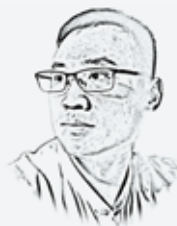
戚戚语 戚耀斌专栏