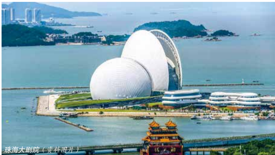
珠海大剧院（资料图片）

6月1日,《珠海经济特区生活垃圾分类管理条例》正式施行,标志着珠海垃圾分类进入法治化新阶段,也意味着珠海对于垃圾分类的态度由“倡导”变为“要求”。条例借助法律强制力和约束力,为提升城市垃圾治理水平提供了法治保障。