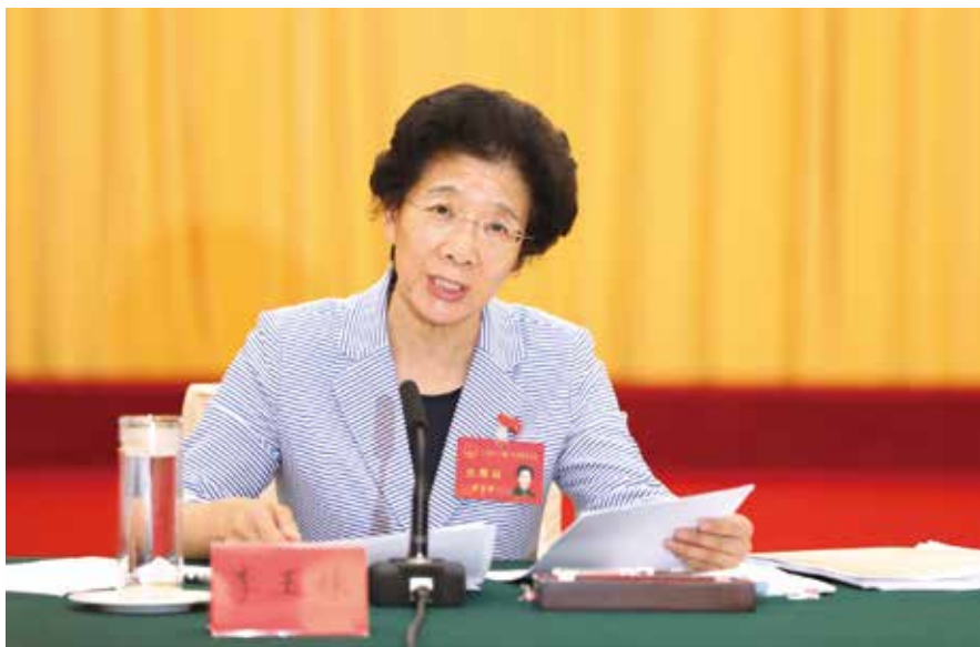
省人大常委会主任李玉妹主持联组会议并讲话

牢牢把握专题询问的正确方向；二要坚持以人民健康为中心，始终聚焦突出问题；三要坚持目标导向和问题导向，确保问到关键、答得扎实。通过专题询问，推动我省加快构建强大的公共卫生体系，提高疾病预防控制能力，更好保障人民生命安全和身体健康，建设健康广东！”省人大常委会主任李玉妹如是强调，并对开展本次专题询问寄予厚望。