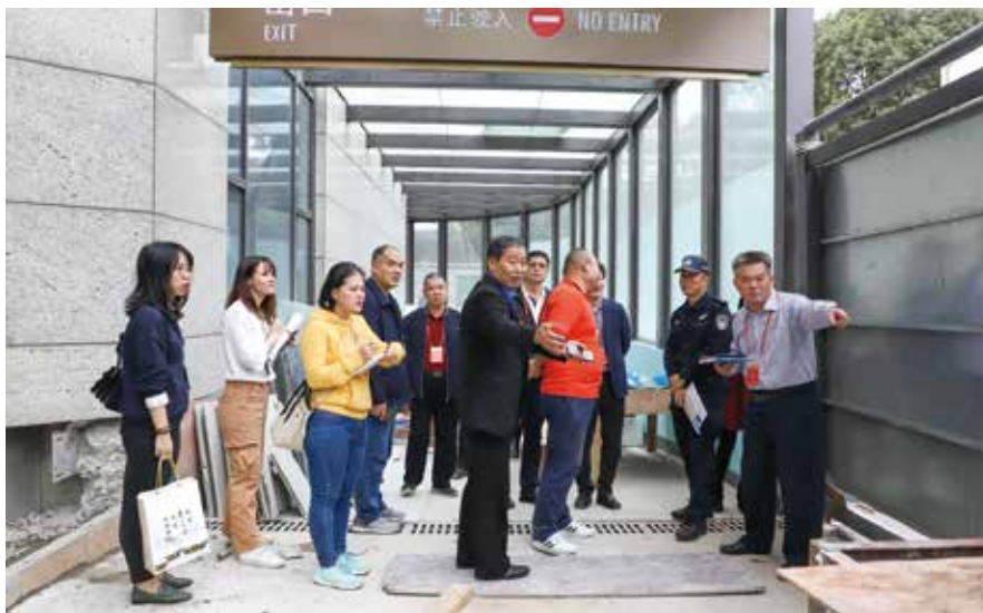
深圳市南山区南头街道人大工委组织人大代表视察荷兰花卉小镇公益停车场

街道”、广东省“县乡人大工作和建设先进集体”称号，成为南山区唯一获以上两个称号的街道。