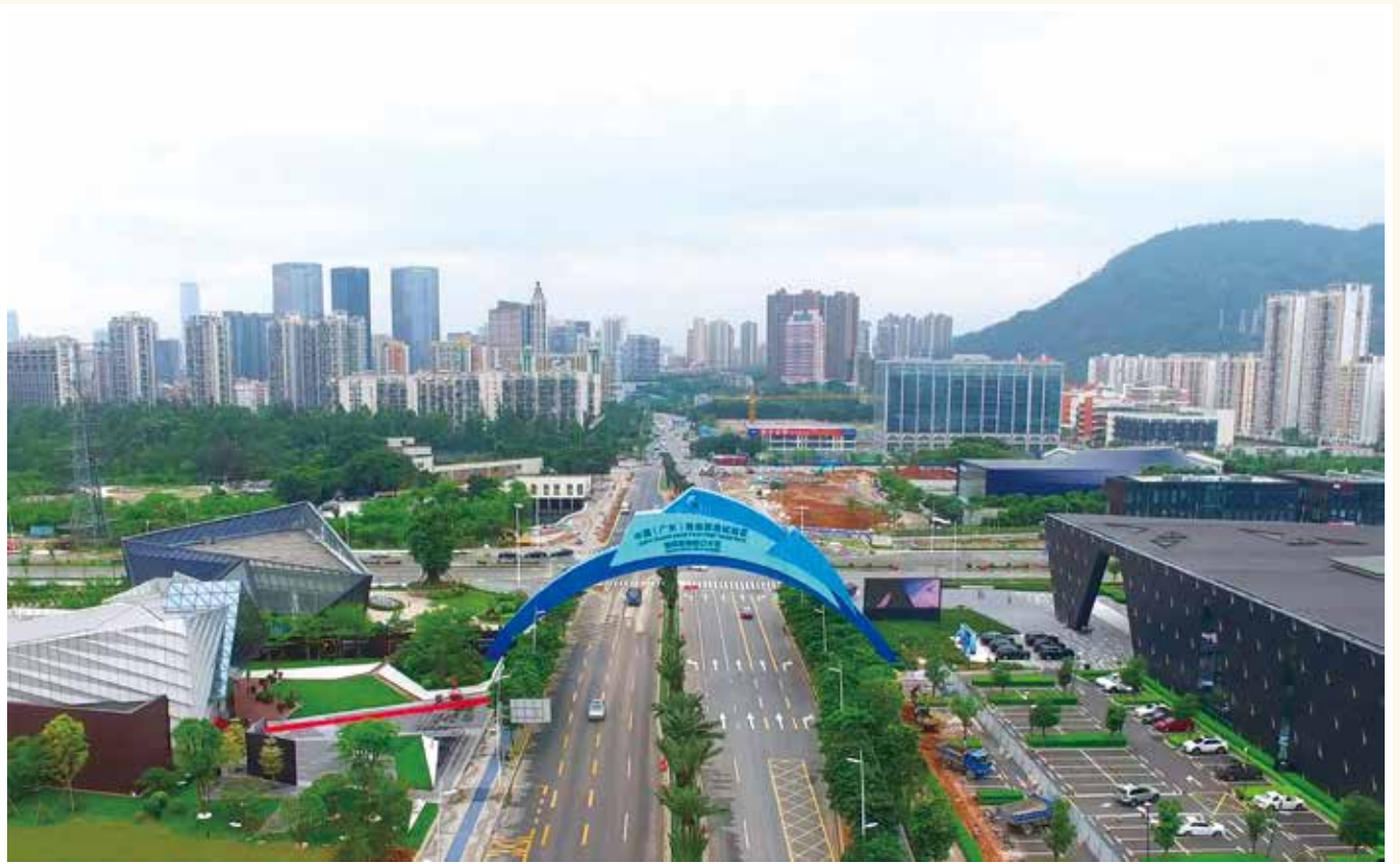
深圳前海蛇口片区（资料图片）