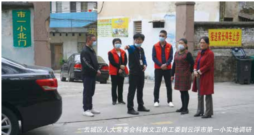
云城区人大常委会科教文卫侨工委到云浮市第一小实地调研

委会负责人等到学校北门路段实地调研并形成相关情况汇报。由于该路段属于云浮市交通警察支队管辖范围，经讨论决定，仍然采取“直通车”的方式将建议直接“运送”至市有关部门，便于以最快的速度解决这个交通安全隐患。