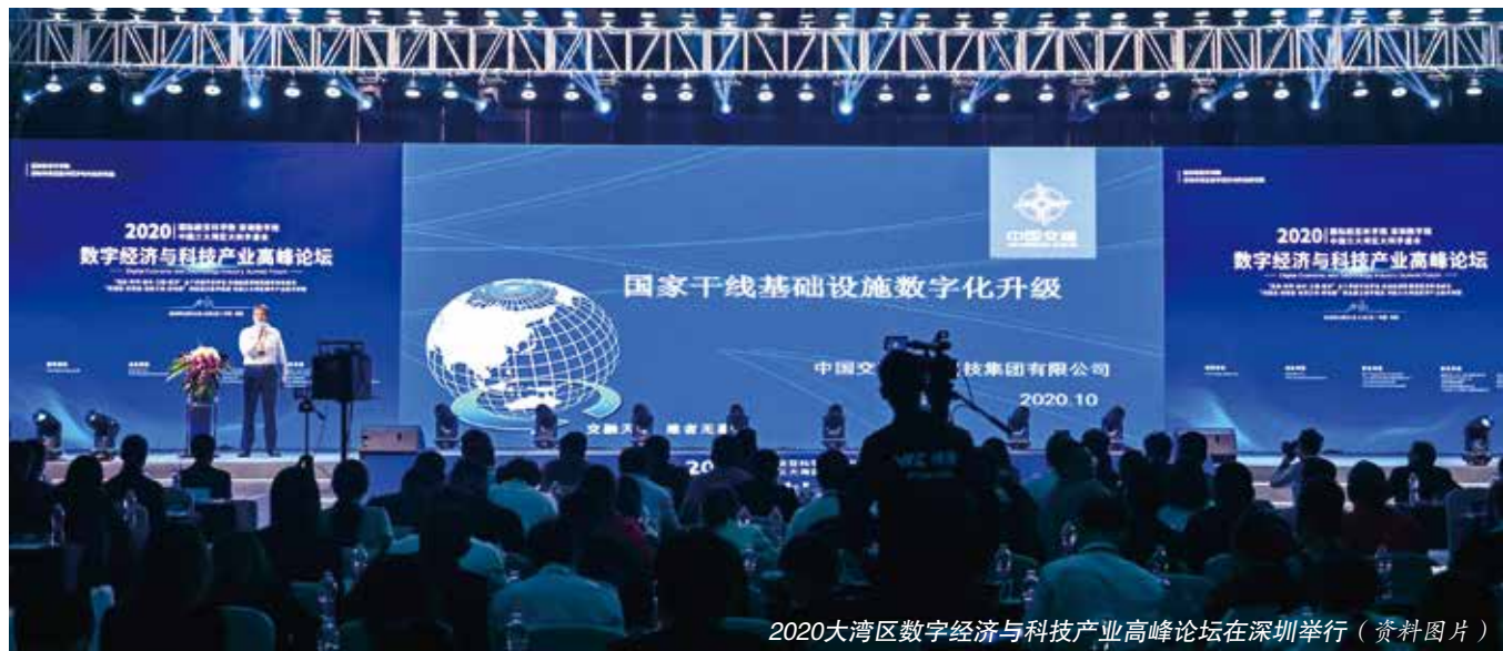
2020大湾区数字经济与科技产业高峰论坛在深圳举行（资料图片）