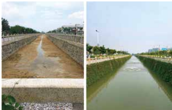
示范段清淤铺沙整治前后对比