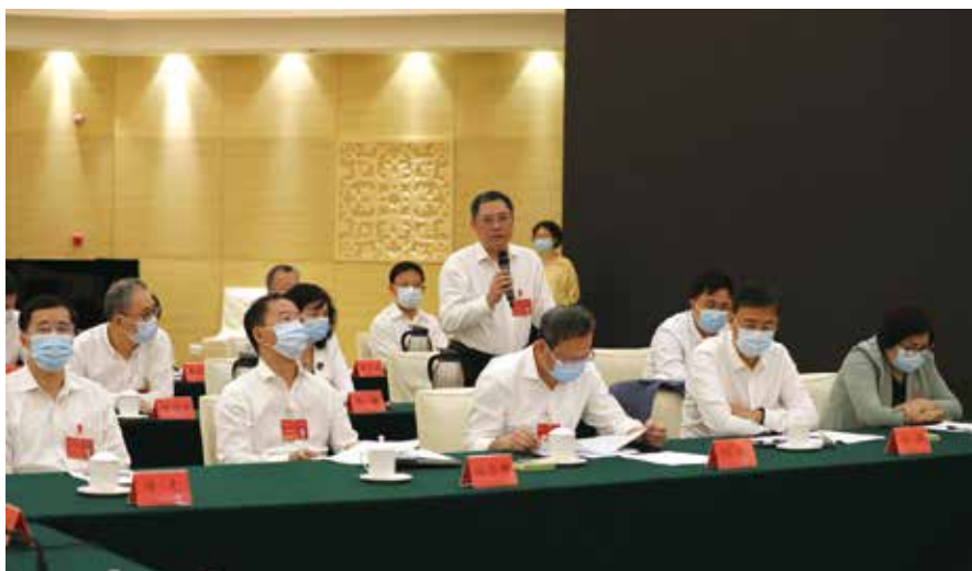
专题询问现场，省人大常委会组成人员争先恐后“发问”

推动优质医疗资源扩容和均衡布局，是不断完善分级分层分流的重大疫情救治体系过程中，需要统筹解决的问题。当前我省有两个比较突出的问题，