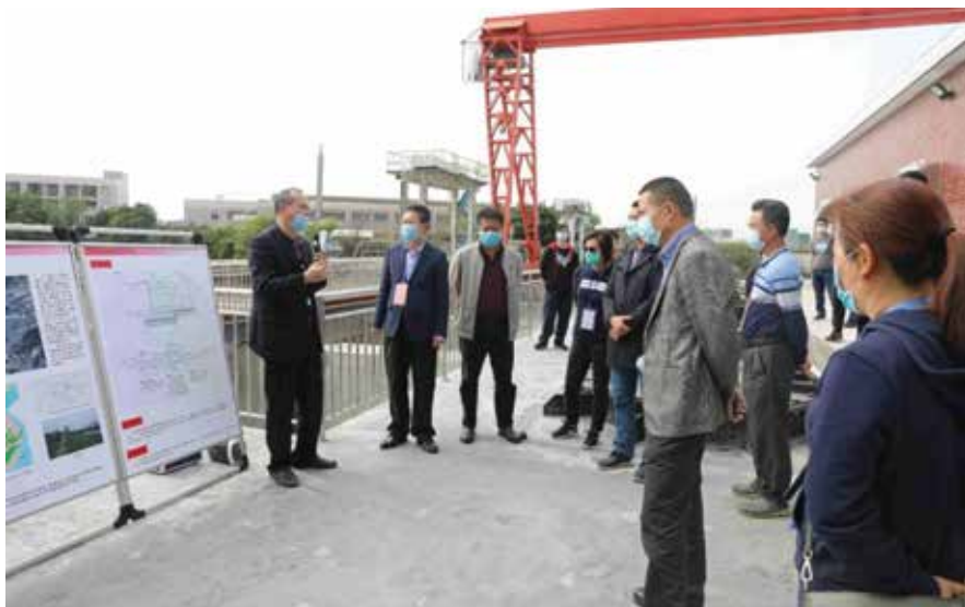
市人大常委会组织部分人大代表视察南、北排河

度组织代表开展不少于1次专项视察，定期组织各级人大代表、镇村两级干部、村民代表及保洁队伍代表召开调研座谈会，收集一线干部群众对黑臭水体整治工作的意见建议，并及时反馈给相关部门办理。