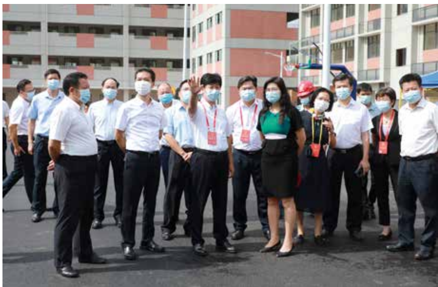
市人大代表开展基础教育扩容提质视察调研活动

封开县大洲镇岐岭村委会罗洞口自然村与广西木双镇双贤村麦佑组相连，罗洞口自然村到主道路约有2.5公路的村道是泥路，计划建设硬化村道，但两地村民林地、园地、农田、竹棵等相交穿插。在推进村道建设中，两地充分发挥省际人大代表联络站作用，由两地人大代表到涉及到村道硬化用地问题的村民家中，入户协调。经过两地人大代表的努力，解决了让地问题，促进村道修建完成。“村道建成后，两地村民出行方便，也大大解决了林木、砂糖桔等农作物运输问题。”大洲镇人大代表、