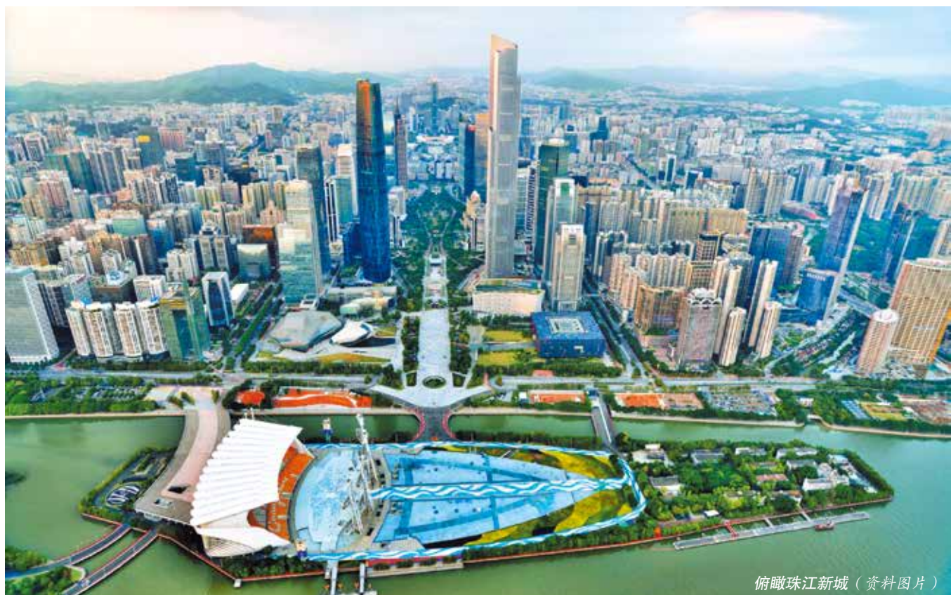
俯瞰珠江新城（资料图片）

斗的历史经验，把“十个坚持”历史经验与总书记在“七一”重要讲话中提出的以史为鉴、开创未来的“九个必须”重要要求结合起来，一体学习领会、整体贯彻落实，不断深化“1+1+9”工作部署，在新征程上把广东发展的路子走对走实走好。四要深刻领会、准确把握新时代党的历史使命，坚决响应党中央号召，始终牢记中国共产党是什么、要干什么这个根本问题，坚定担当责任、坚持自我革命，攻坚克难、开拓奋进，为实现第二个百年奋斗目标、实现中华民族伟大复兴的中国梦而不懈奋斗。