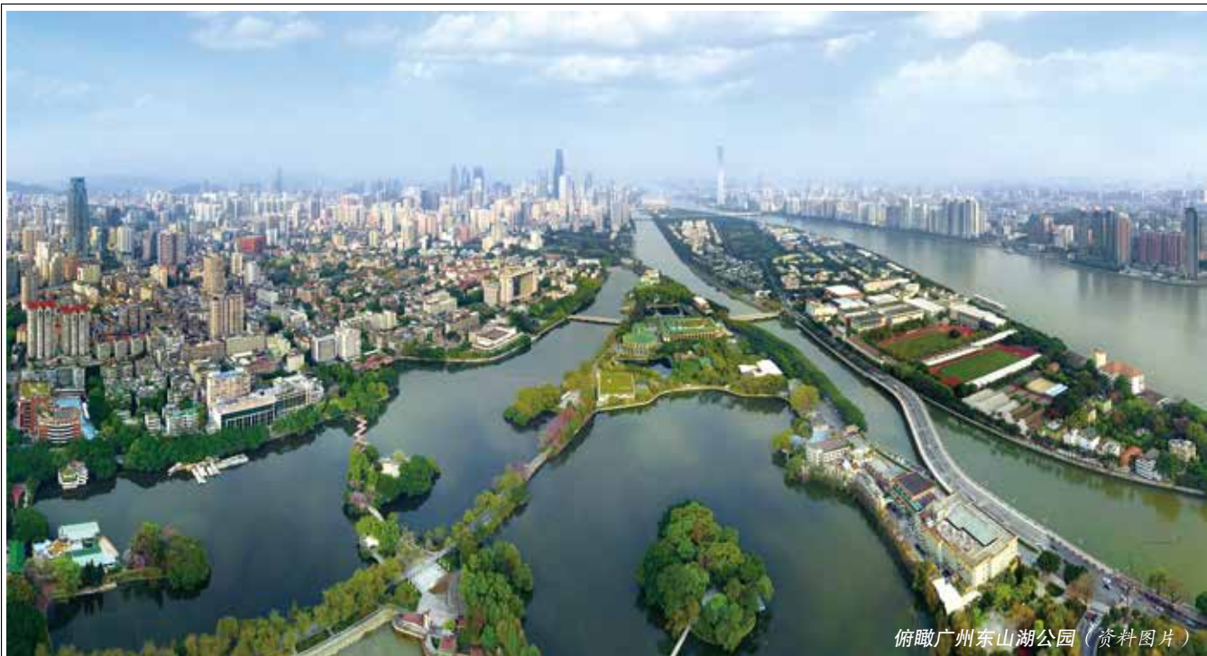
俯瞰广州东山湖公园（资料图片）