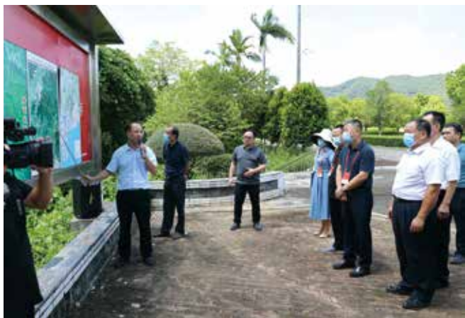
市人大代表在大河水库现场听取工程建设汇报