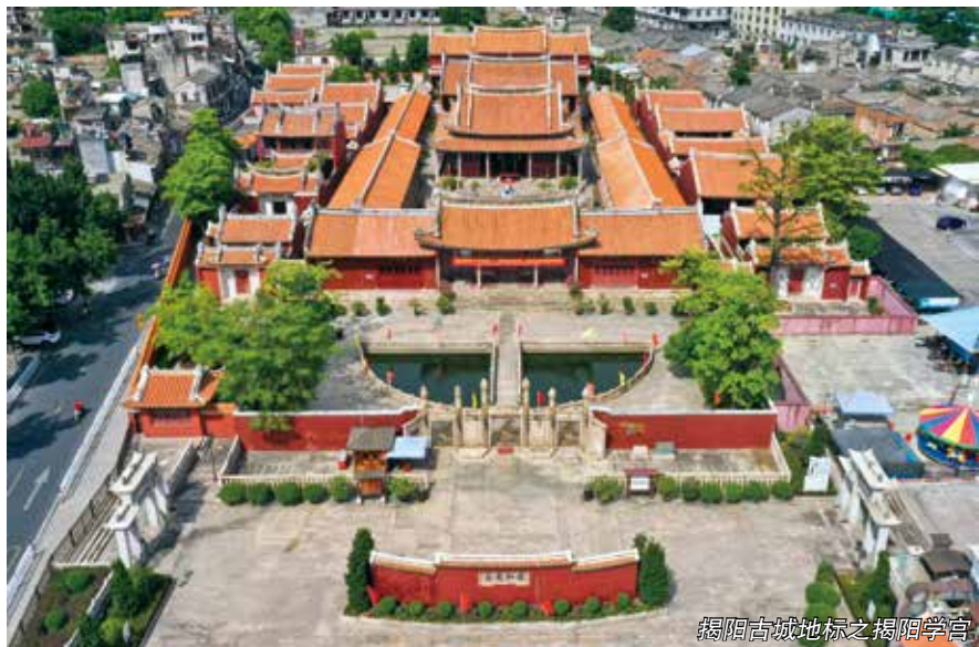
揭阳古城地标之揭阳学宫

开门立法问民意。 市人大常委会坚持和践行全过程民主，注重在立法程序上做好开门立法、问法于民，制定出台了立法公开、立法论证、立法评估、立法听证、基层立法联系点等一系列配套制度，有效拓宽和畅通公民参与地方立