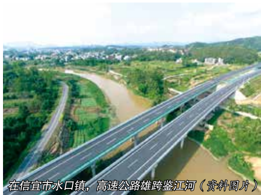
在信宜市水口镇，高速公路雄跨鉴江河（资料图片）

（上接第56页）要强化联络站正常活动的机制建设，统一创建标准，以“五个有”提升硬件配套，即有固定场所、有统一标牌、有必要设施、有学习资料、有代表信箱；以“五公开”接受选民监督，即公开代表信息、公开工作制度、公开年度计划、公开结对名单、公开履职成果；以“五到位”强化组织管理，即代表注册到位、人员配备到位、服务保障到位、台账管理到位、经费支持到位。要通过严格考核评定，将争创优秀代表联络站纳入对区人大工作考核的重要内容，每年公布优秀代表联络站名单，在区人代会期间进行授牌表彰，并给予