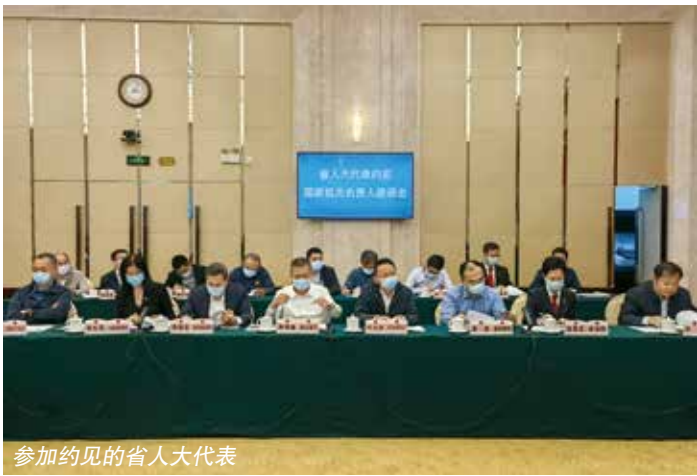
参加约见的省人大代表