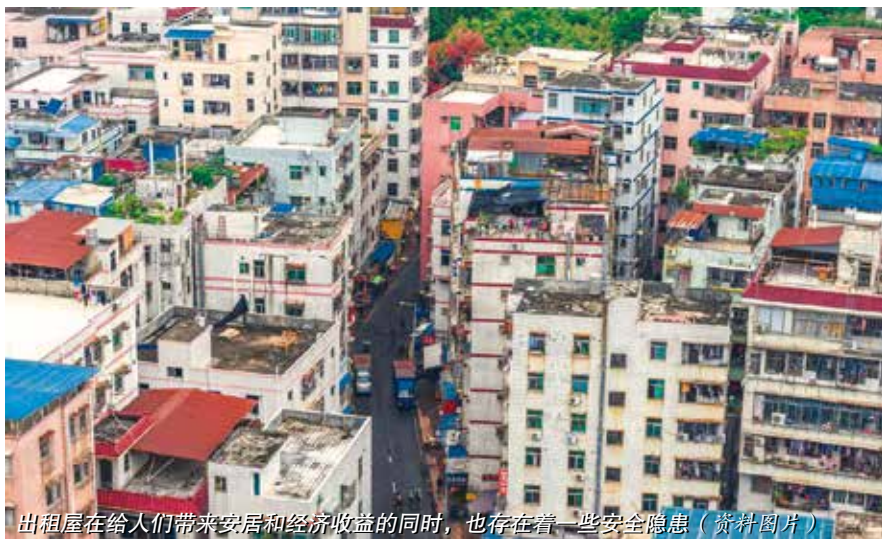
出租屋在给人们带来安居和经济收益的同时，也存在着一些安全隐患（资料图片）

息化手段，启动实施“智安”工程，实现对区域内人、车、物和环境四种基本要素的多维感知及智能管控，逐步构建起以安全为主要特征，大安防和大数据应用为支撑的小区治理新体系，从而积极推动小区出租屋规范化管理，认真做好租户信息登记等工作。通过近两年来的努力，南社村鱼苗场小区如今保持了出租屋内治安案件近两年“零发案”的记录，同时小区的违法犯罪率也在持续下降。