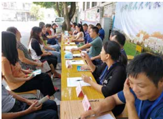
江门市开平塘口镇人大组织召开“人大代表议事会”,共议民生热点问题

市人大工作信息专刊、微信公众号发布立法信息;在《江门日报》等媒体发布立法新闻。其次是组织协调《南方日报》《南方都市报》《广州日报》等媒体对我市立法工作进行报道,相关的报道引起国家级媒体关注,“学习强国”学习平台、人民日报客户端以及全国人大常委会、广东人大微信公众号经常转载我市立法信息。