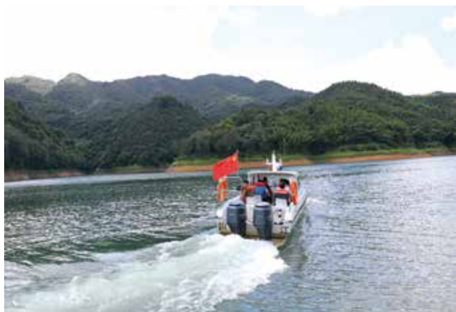
市人大代表在视察大河水库水质

情况、大河水库水质和水量情况、市第二自来水水厂取水和建设情况，研讨项目建设中的存在问题，提出意见和建议；同时，多次召开专题会议，研究如何通过专题询问，全力推动大河水库引水工程建设进程。