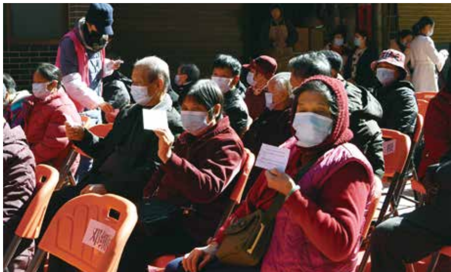
30多名长者来到现场参加揭牌仪式