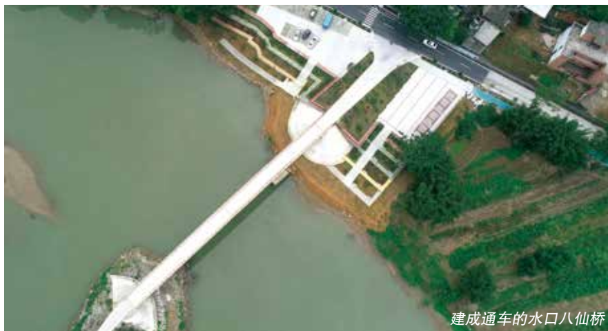
建成通车的水口八仙桥