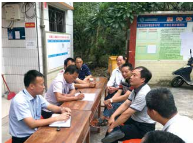
乐城镇人大组织人大代表以“摆摊设点”的方式开展代表接访活动