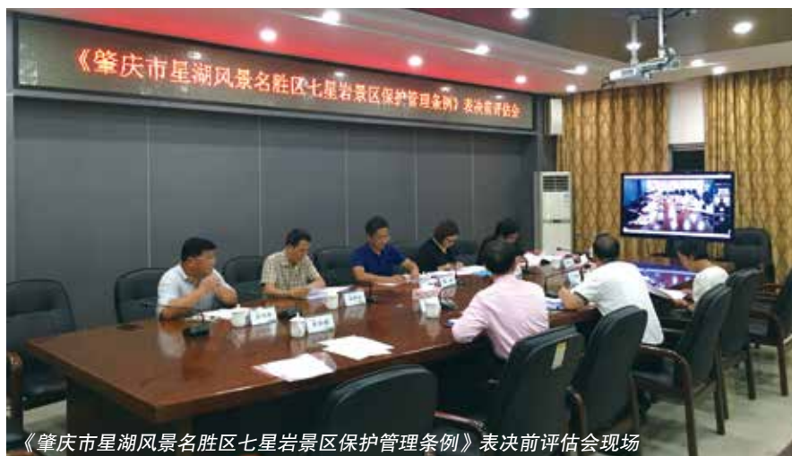
《肇庆市星湖风景名胜區七星岩景区保护管理条例》表决前评估会现场

规定，这让法规有了“温度”，充分彰显了立法为了人民的共建共治共享社会治理理念。《肇庆市城市生活垃圾分类管理条例》通过建立生态补偿制度，规定“生活垃圾输出区域应当按照生活垃圾跨区域处理量缴纳生态补偿费，并用于生活垃圾集中处理设施周边环境改善、公共服务和基础设施建设等”，着力破解生活垃圾设施建设容易产生的“邻避效应”，从制度上切实保障群众的合法权益。同时，建立生活垃圾分类管理社会监督员制度，通过邀请居民代表等进入垃圾收集点、转运站和处理设施现场，对生活垃圾的处理等实施情况进行监督，切实保障群众的知情权和监督权。