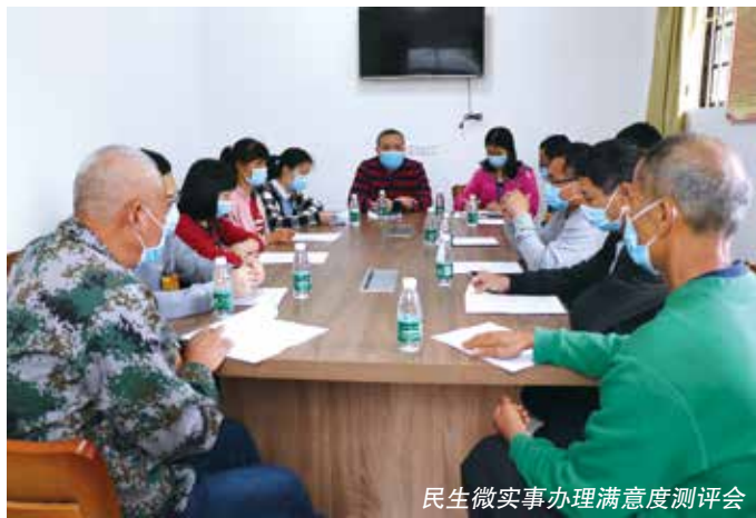
民生微实事办理满意度测评会

“五级小平台”运行成效如何？建议意见办理情况是否满意？为进一步掌握建议意见办理的实施效果、资金使用、群众满意度等情况，镇人大组织驻站代