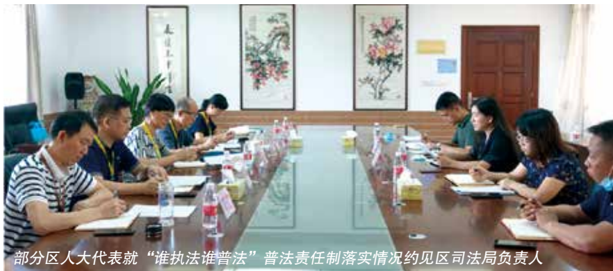
部分区人大代表就“谁执法谁普法”普法责任制落实情况约见区司法局负责人

近日，江门市蓬江区人大常委会会议听取区人大代表约见国家机关负责人情况报告。这是自2018年《江门市蓬江区人民代表大会代表约见国家机关负责人办法》施行以来首次听取专题情况报告，对约见活动进行一次自我“体检”。