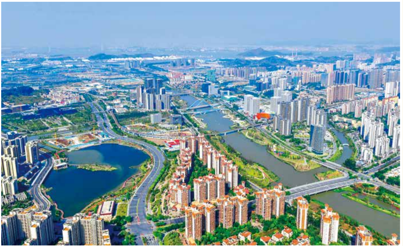
俯瞰南沙蕉门河中心区（资料图片）