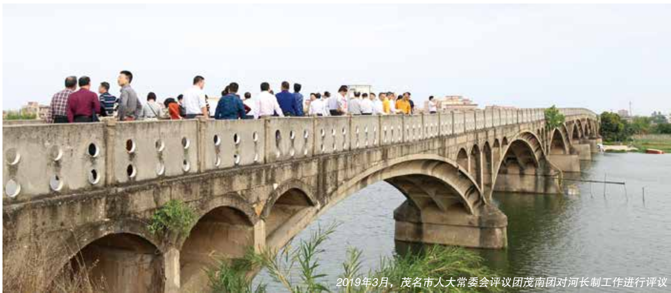
2019年3月，茂名市人大常委会评议团茂南团对河长制工作进行评议

98座，镇级污水处理设施实现全覆盖，生活污水处理能力达62.325万吨/日，污水管网突破1000公里。1700个行政村20754条自然村，有13444条自然村已建有终端污水处理设施，完成比例为64.78%。污水处理设施的建设快速推进，为水环境质量全面改善打下了良好基础。