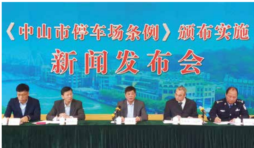
《中山市停车场条例》颁布实施新闻发布会现场

中山市是著名的岭南水乡，城市数十年高速发展带来的河涌污染等问题却饱受人民群众诟病。获得地方立法权之后，为了确定首部法规项目，市人大常委会围绕地方立法权限发放了5000份调查问卷，公众反馈排在前5位的选题有4个与水环境保护直接相关。根据习近平总书记要求广东切实抓好水环境污染治理的重要批示和社会主流民意，市人大常委会确定《中山市水环境保护条例》为中山第一部地方性法规项目，并紧扣市委市政府推进水环境污染治理的重点难点，从“小切口”立法的角度确立了水环境保护联席会议工作制度、河（段）长制度、排污口分项管理制度、黑臭水体排查公布制度等主要制度规范。为了强化刚性执法，市人大常委会连续多年把推进黑臭水体整治列入监督重点，打出了强有力的监督组合拳，尤其是开展专题询问并落实问责机制，重组了市水务部门领导班子和工作团队，推动政府走出了“九龙治水、各自为政”的困局。