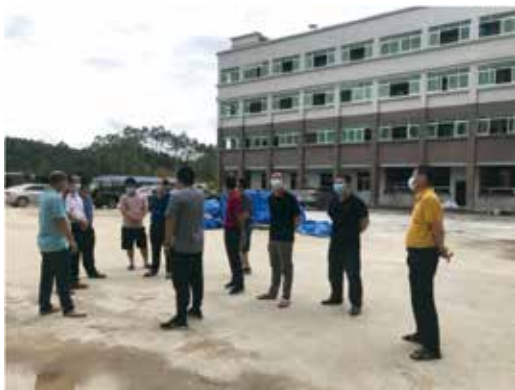
镇人大全程跟踪监督工程建设