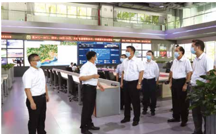
省人大常委会副主任李春生到省气象局调研

本公共服务均等化上持续发力，注重加强普惠性、兜底性、基础性民生建设”，他鼓励和支持林良勳结合气象专业知识和我省气象监测预报工作实际，针对政策性农业、渔业保险气象指数需求，从气象设施建设、推进现代农业发展的角度提出代表建议。