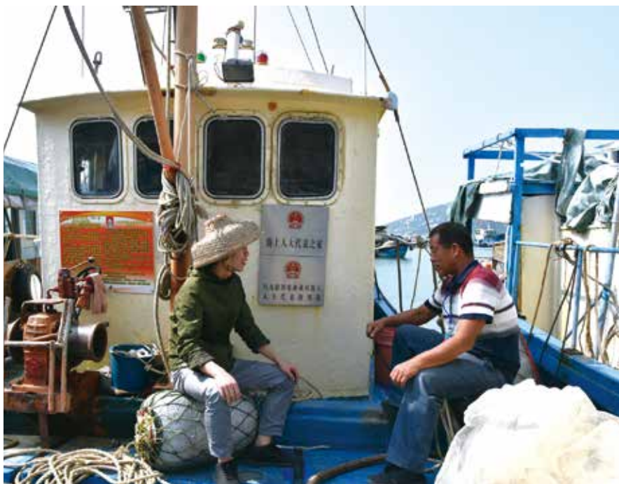
人大代表在海上人大代表之家接访渔民