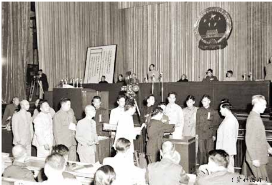
1954年9月20日,第一届全国人大第一次会议投票通过了《中华人民共和国宪法》

新中国成立后,党和国家领导人开始考虑和着手准备制定正式的宪法。1953年1月,根据中央人民政府委员会会议的决定,成立以毛泽东为主席,以刘少奇、朱德、邓小平等32人为委员的宪法起草委员会,负责起草中华人民共和国第一部宪法。中共中央也专门成立了宪法起草小组,由毛泽东主席亲自挂帅,领导中共中央宪法起草小组进行宪法草案初稿的起草工作。1953年12月至1954年3月,毛泽东主席亲自率领宪法起草小组进驻杭州,制定了起草宪法的详细工作计划,集中精力开展宪法起草工作,深入研究和比较国内外各种类型的宪法文件,先后起草并修改形成了宪法初稿、“二读稿”“三读稿”等,圆满完成宪法草案的起草任务。同时,在京同步召开中央委员会、中央政治局扩大会议等对宪法草案稿进行讨论和研究。1954年