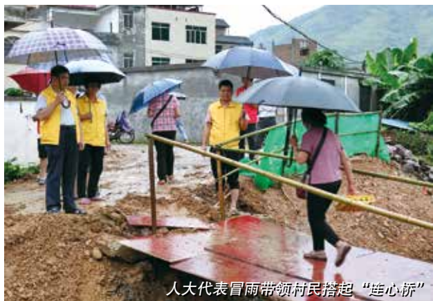
人大代表冒雨带领村民搭起“连心桥”