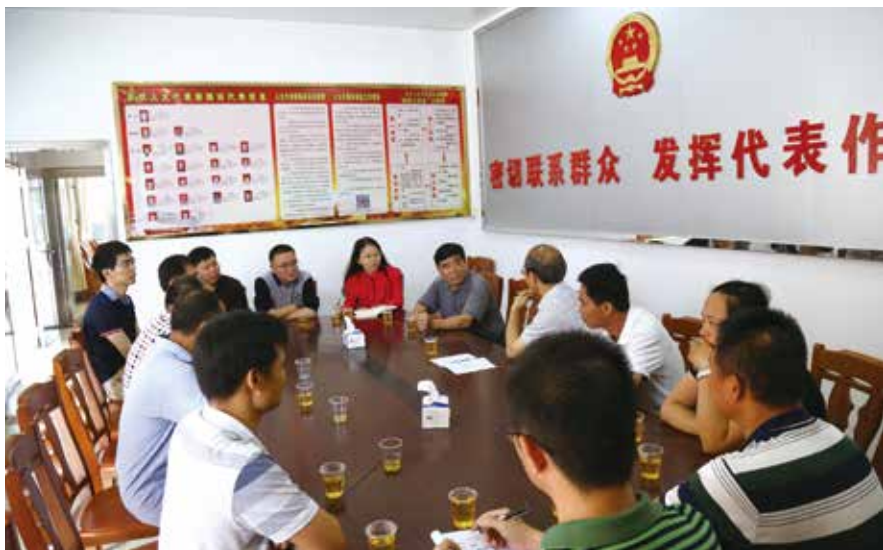
代表在联络站联系选民了解民情

茂名市人大常委会积极作为，固本创新，架好代表与选民之间的桥梁，以高质量代表工作不断发展全过程人民民主在茂名的实践。