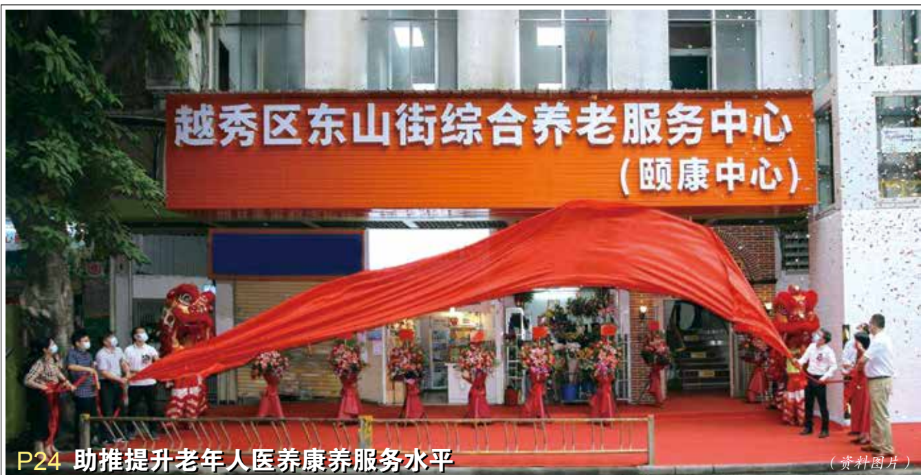
P24 助推提升老年人医养康养服务水平