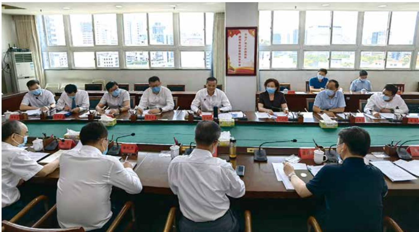
2021年9月，省人大常委会副主任吕业升率队赴省工业和信息化厅专题调研