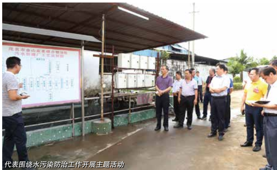
代表围绕水污染防治工作开展主题活动