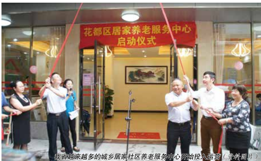
我省越来越多的城乡居家社区养老服务中心开始投入运营(资料图片)

高,相应管理机制还不够完善。目前养老机构服务形式较为单一,为老年人服务的医疗资源明显不足,健康保障差。此外,社区养老基础薄弱,设施缺乏。