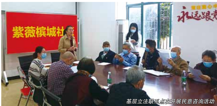
基层立法联系点在开展民意咨询活动

坚持双向互动，请进来、走出去相结合，不断拓宽群众参与渠道，扩大意见征集范围。“请进来”，配合、支持人大代表依法履职。2021年3月5日，广州市在新市街基层立法联系点组织召开《广州市养老服务条例》立法征求意见座谈会，部分人大代表、专家学者、人民群众以及行政相对人代表参加座谈。会上，立法机关与群众面对面，倾听大家的意见和建议；群众在家门口就可以参与立法，纷纷对养老工作建言献策，