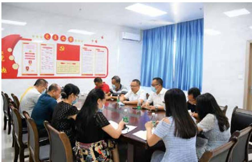
高明区人大荷城街道工委到街道中心卫生院调研

常委会不断完善“六个一”工作法，依托“互联网+”技术，将“代表之声”网络平台接入了“高明通”微信公众号综合服务平台。这是常委会继打造“代表之声”网站之后，又打造的一