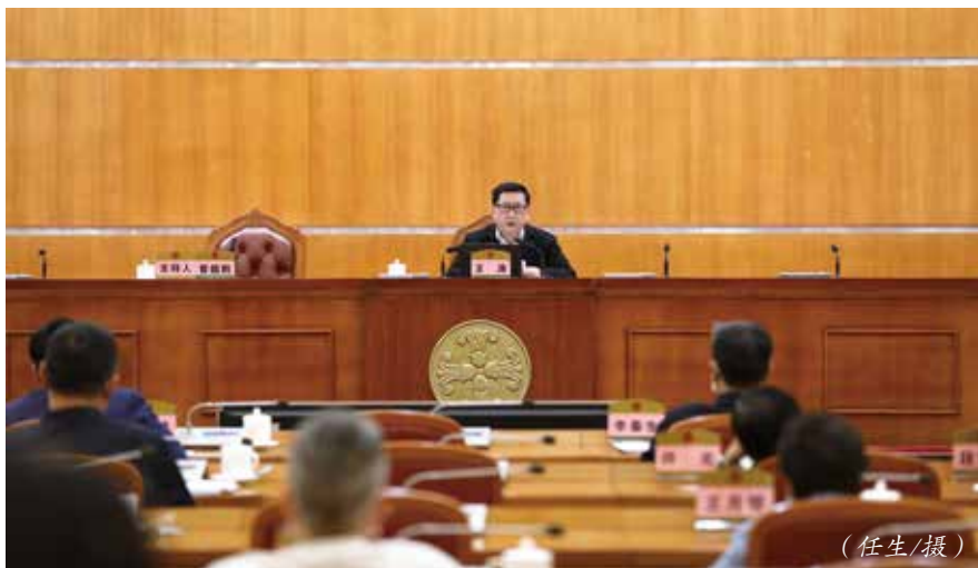
2021年12月8日，王涛为省人大常委会机关党员干部宣讲党的十九届六中全会精神