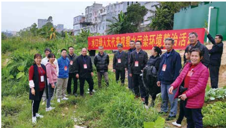
水口镇人大组织人大代表视察水污染环境整治工作

明确责任与时限，提高建议交办效率。 镇人大接到人大代表反映的意见建议后按照职能范围、职责归属，分别交镇政府的相关职能部门办理，明确分管