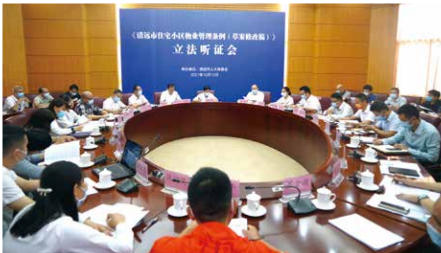
《清远市住宅小区物业管理条例（草案修改稿）》立法听证会现场

状，常委会从2019年开始启动《清远市住宅小区物业管理条例》立法工作，以回应人民群众的热切期盼。由于物业管理涉及利益方较多，各方诉求各有不同，争议较大，常委会本着慎重、缜密、公开的原则，坚持开门立法，充分利用覆盖全市8个县（市、区）的立法联络点和85个乡镇（街道）的立法联络员，广泛征求社会各界群众意见建议，对法规条文逐条论证、修改，力争把此部法规立好，做到切实管用、群众拥护。