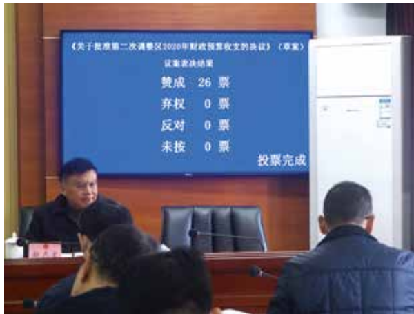
云城区2021年第二次调整预算表决结果