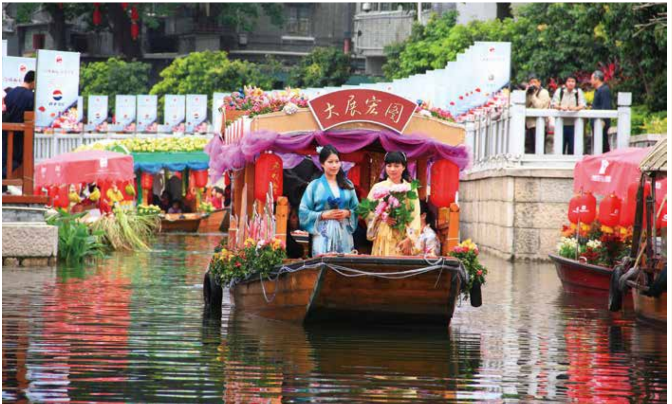
荔枝湾涌（资料图片）