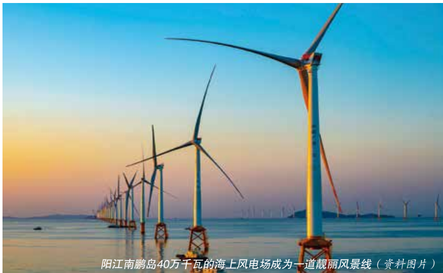
阳江南鹏岛40万千瓦的海上风电场成为一道靓丽风景线（资料图片）

在修改生态环境保护、资源能源利用、国土空间开发、城乡规划建设等领域地方性法规时，增加应对气候变化、促进碳达峰和碳中和的内容，形成推动碳减排协同效应。（下转第59页）